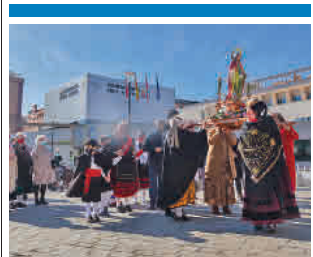
Uno de los actos oficiales celebrados el domingo 6

Esa es la principal conclusión que deja el balance epidemiológico publicado este martes 8 de febrero por la Consejería de Sanidad, un informe que sitúa a Tres Cantos con una tasa de incidencia acumulada de 1.055 casos por cada 100.000 habitantes, una cifra 200 puntos menor que la de hace siete días. Colmenar también confirma la tendencia descendente, con una tasa de 1.182 positivos. En cuanto a las Zonas Básicas de Salud, Embarcaciones ya está por debajo de los 1.000 casos.