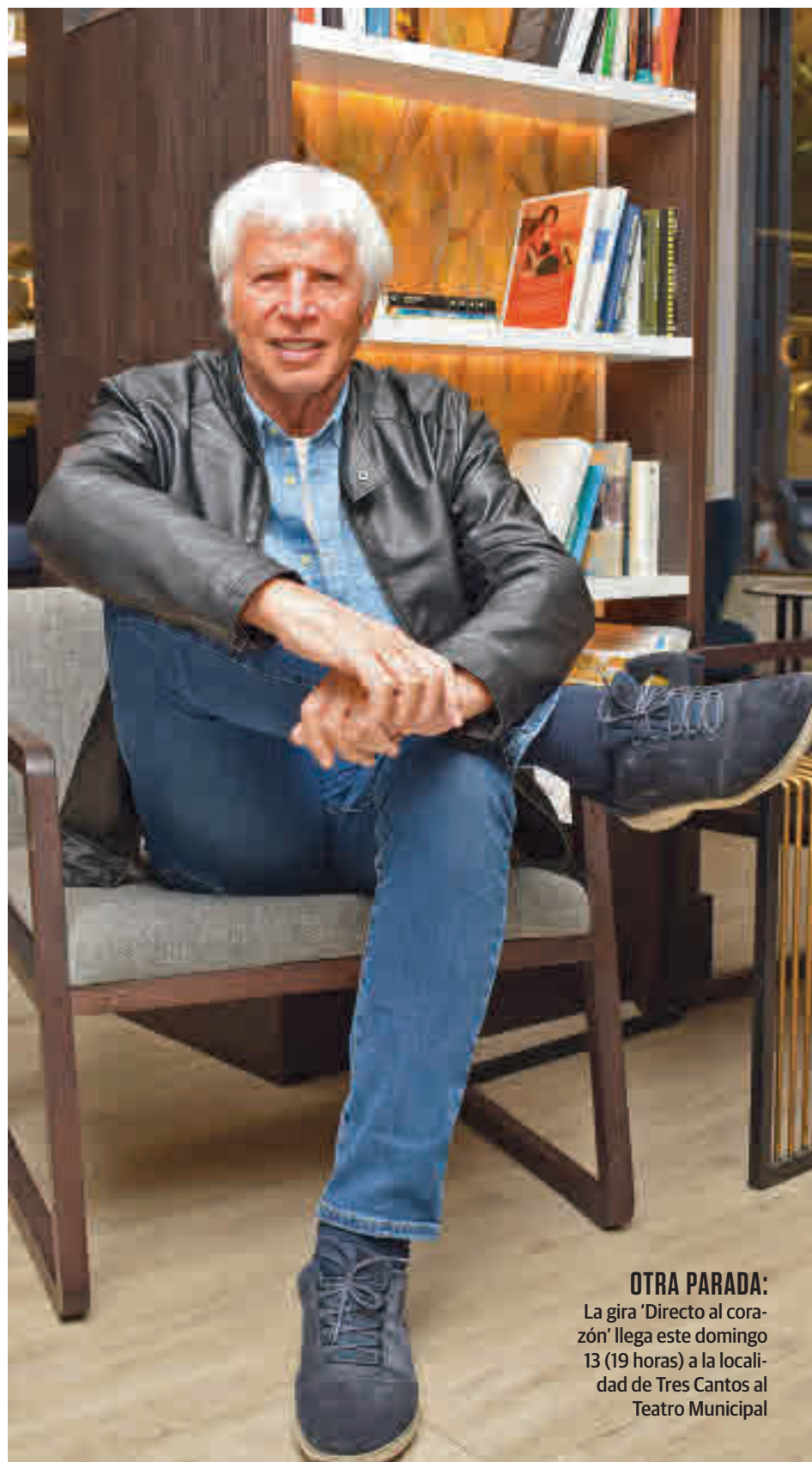
OTRA PARADA: La gira ‘Directo al corazón’ llega este domingo 13 (19 horas) a la localidad de Tres Cantos al Teatro Municipal

fue un éxito que nadie imaginábamos, tan grande que ha servido para que artistas como Sergio Dalma hicieran versiones y también ayudaran a que ‘El jardín prohibido’ estuviera siempre en el recuerdo”. Gracias a ese tema, el nombre de Sandro Giacobbe empezó a ser tremendamente popular en nuestro país, generando una legión de fans que protagonizaron anécdotas increíbles: “Me acuerdo que, en una ocasión, iba a actuar en ‘El gran musical’, un