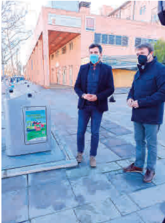
Presentación de la iniciativa

SIGUE DISPONIBLE PARA ESTE FIN EL PUNTO LIMPIO DE RONDA DE VALDECARRIZO