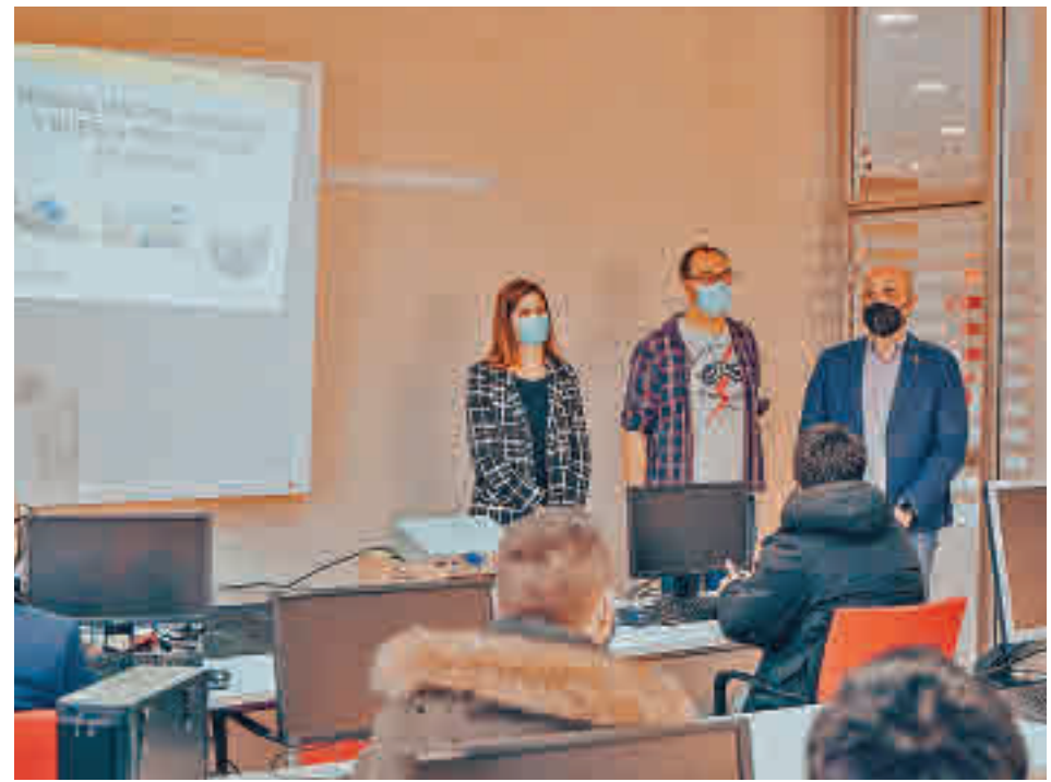
Visita del alcalde y de la concejala de Economía y Empleo

De estas diez personas, dos se sumaron al Servicio Informático, dos están como ayudantes de archivo en Urbanismo y Cultura, dos están incorporadas como personal administrativo en Contratación y