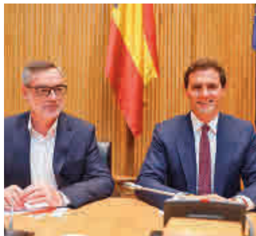
Villegas y Rivera, caminos paralelos

EL PERIÓDICO GENTE NO SE RESPONSABILIZA NI SE IDENTIFICA CON LAS OPINIONES QUE SUS LECTORES Y COLABORADORES EXPONGAN EN SUS CARTAS Y ARTÍCULOS