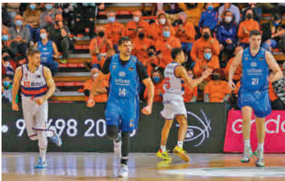
El Urbas Fuenlabrada sigue buscando la permanencia