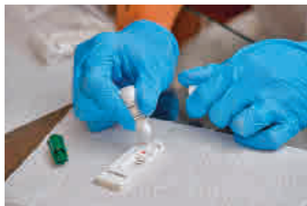
Pruebas de detección de covid-19

Las regiones y los expertos que abogan por su reducción piden que sean de tres o de cinco