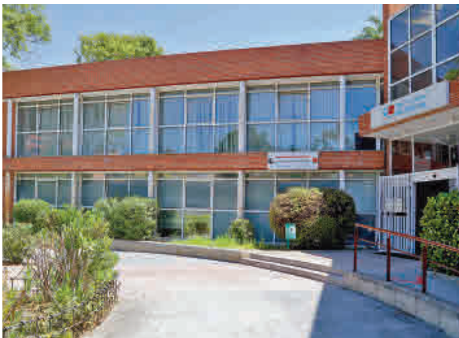
Centro de salud de Miraflores, ubicado en Alcobendas

La actualidad de Alcobendas y Sanse, en nuestra web.