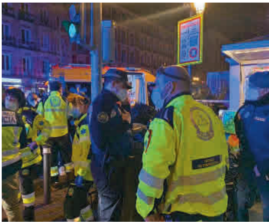
Los servicios de Emergencias tuvieron que atender varias agresiones

González criticó que se "haga política" con la acción de las bandas juveniles y ha afirmado que "no todo vale con lo que está pasando" y que se les "está yendo de las