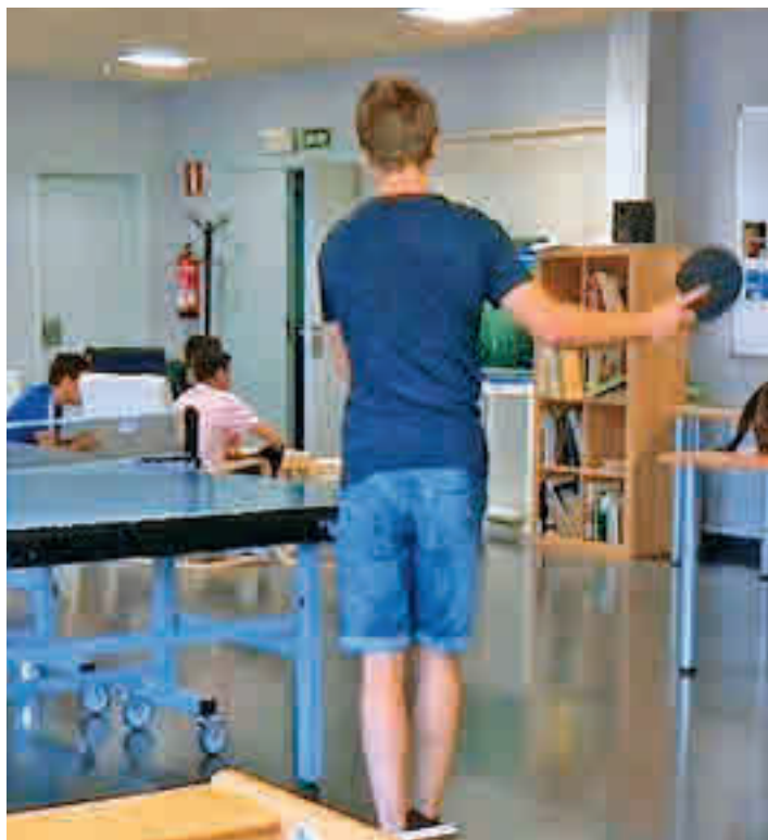
Una de las actividades que se llevan a cabo en el centro

Hay que destacar que ‘Espacio abierto’ es completamente gratuito. Los interesados solo necesitan preinscribirse y firmar una declaración responsable en la