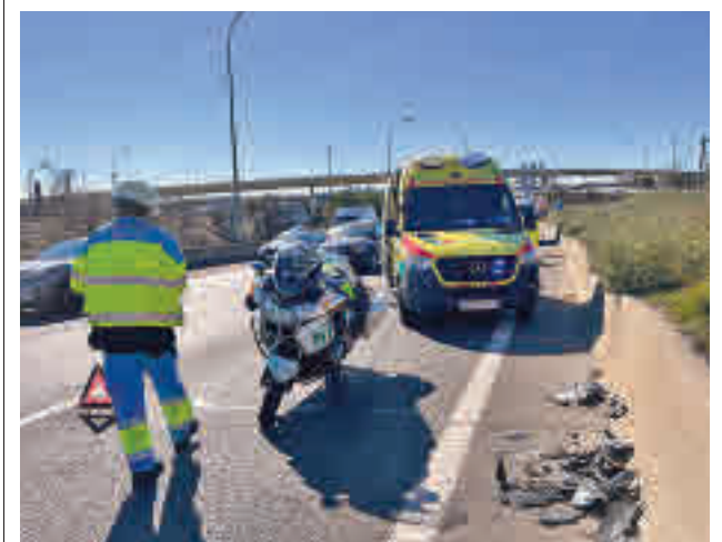
Lugar del siniestro

El listado de admitidos al sorteo podrá consultarse en los tablones de anuncios de Emvialsa y del Ayuntamiento, así como en la web emvialsa.org , donde también se podrá encontrar el formulario de inscripción para los solicitantes admitidos al sorteo que quieran asistir al acto de este lunes 14.