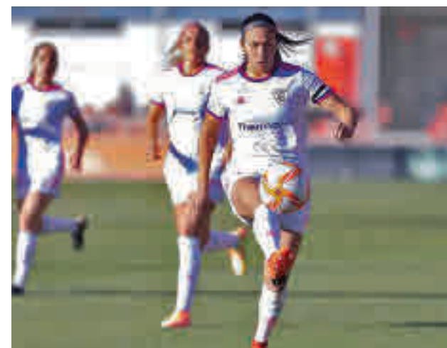
El Madrid CFF atraviesa una racha negativa

lla que es séptimo tras sumar solo uno de los últimos nueve puntos que ha disputado. Un balance bien diferente (cinco triunfos consecutivos) es el que acumula un Real Madrid que visita este domingo (11 horas) el campo del Eibar. El cuadro armero es segundo por la cola, pero no pierde de vista a equipos como el Sporting de Huelva.