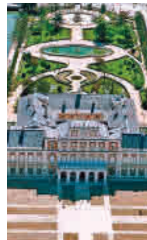
Palacio Real de Aranjuez

La iniciativa de los bonos turísticos, en marcha desde el pasado 10 de noviembre, está disponible para aquellos visitantes que opten por una escapada romántica a la Comunidad de Madrid o por un plan en pareja sin salir de la región, ya que la agencia de