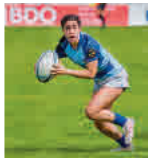
El Cisneros juega en casa

Después de unos días reservados para los partidos aplazados, la Liga Femenina Endesa recupera la normalidad el jueves 17 con un Perfumerías Avenida-Estudiantes y un Leganés-Spar Girona.