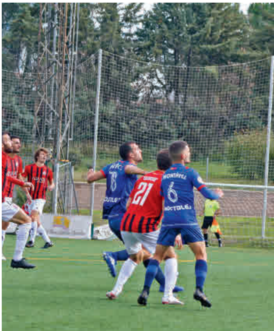
Imagen del partido disputado en noviembre entre Adarve y Móstoles

La próxima prueba que deberá superar el Adarve será este domingo 13 (16:30 horas) en el Mariano González, el campo del tercer clasificado, un Navalcarnero que, gracias a los 33 puntos conquistados hasta la fecha, sueña con volver a navegar por las aguas de la categoría de bronce del