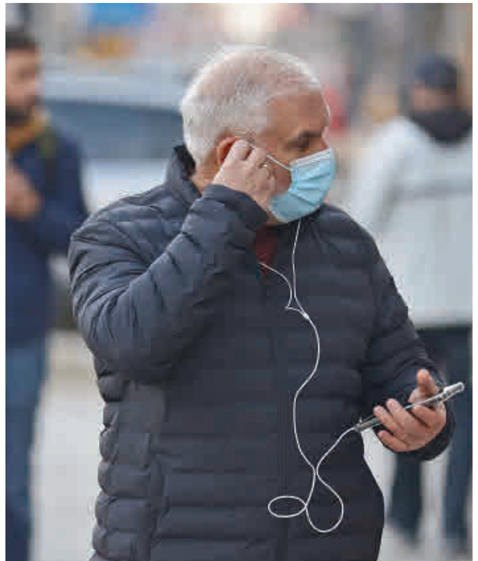
Llevar mascarillas en la calle ya es opcional