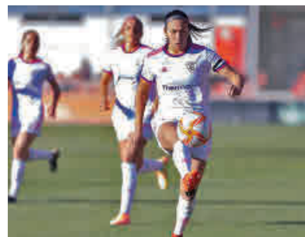
El Madrid CFF atraviesa una racha negativa

lla que es séptimo tras sumar solo uno de los últimos nueve puntos que ha disputado. Un balance bien diferente (cinco triunfos consecutivos) es el que acumula un Real Madrid que visita este domingo (11 horas) el campo del Eibar. El cuadro armero es segundo por la cola, pero no pierde de vista a equipos como el Sporting de Huelva.