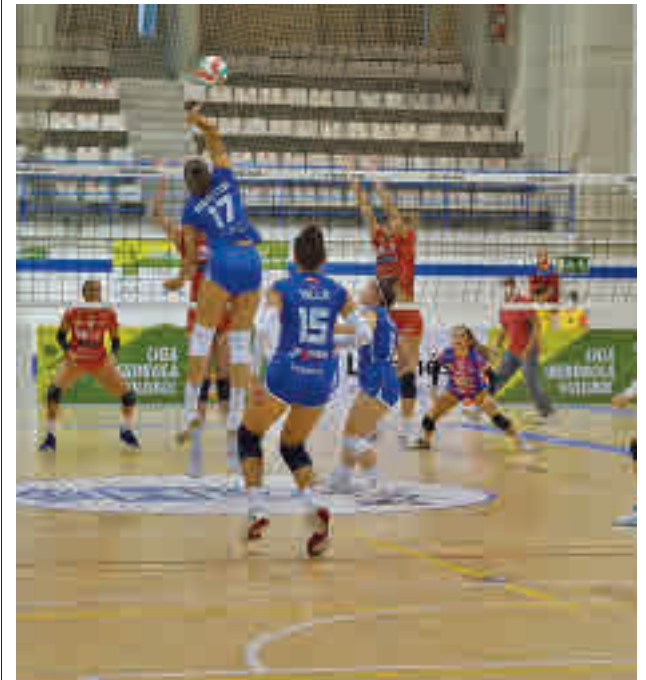
El Leganés vuelve a la competición este sábado

Por su parte, el Feel Volley Alcobendas, que también se ha visto afectado por los aplazamientos, tendrá un fin de semana de descanso y, por tanto, más tiempo para preparar la cita del sábado 19 en casa ante el cuarto clasificado, el DSV Sant Cugat.