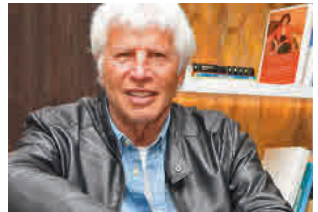
Sandro Giacobbe, durante la entrevista

El artista italiano interpretará los grandes éxitos de su dilatada carrera en un concierto que tendrá lugar el próximo martes 15 en el Teatro EDP Gran Vía • Será su regreso a la capital más de dos años después