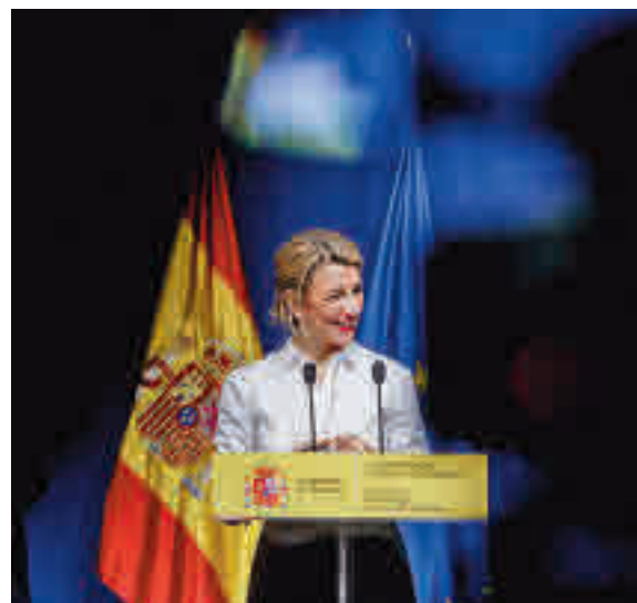
Yolanda Díaz, durante su comparecencia

Enero La subida del SMI tiene un efecto retroactivo