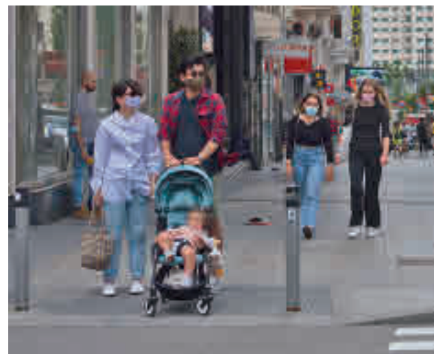
Cambio de criterio en menos de una semana