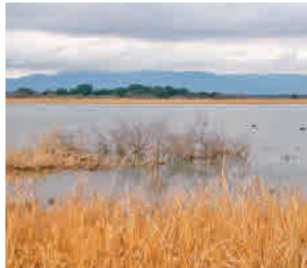
Sequías e inundaciones afectan a su conservación

Las amenazas relacionadas con factores climáticos con fenómenos extremos como sequías e inundaciones provocan cambios también en el 38% de los ecosistemas analizados. Las acciones derivadas del hombre, como la contaminación de sus aguas y la alteración del