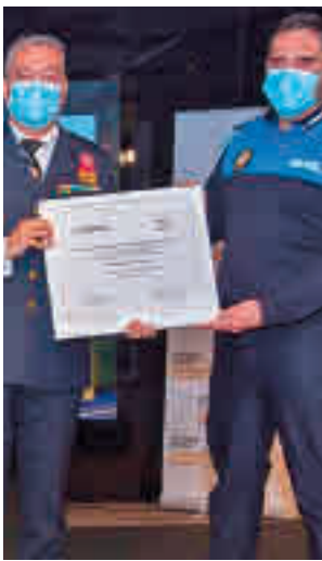
Recogida del premio