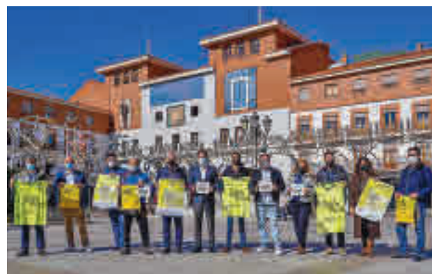
Presentación de la carrera AYTO. TORREJÓN

de Torrejón 10K'. La fecha escogida para su cuarta edición será el próximo domingo 20 de febrero. La inscripción tiene un coste de 10 euros y el plazo para poder apuntarse finaliza el próximo miércoles 16. Se trata de una carrera de 10 kilómetros en un circuito urbano con salida en la ave-