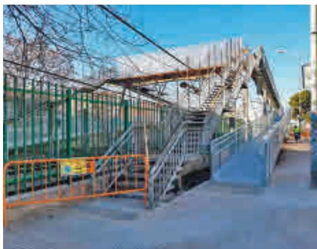
Pasarela afectada por la reforma

La pasarela ha estado cerrada durante varios meses y las obras se han realizado de noche y han ocasionado cortes de tráfico en el puente de la avenida de Meco. La reforma se ha demorado debido a las exigencias técnicas por parte de Adif.