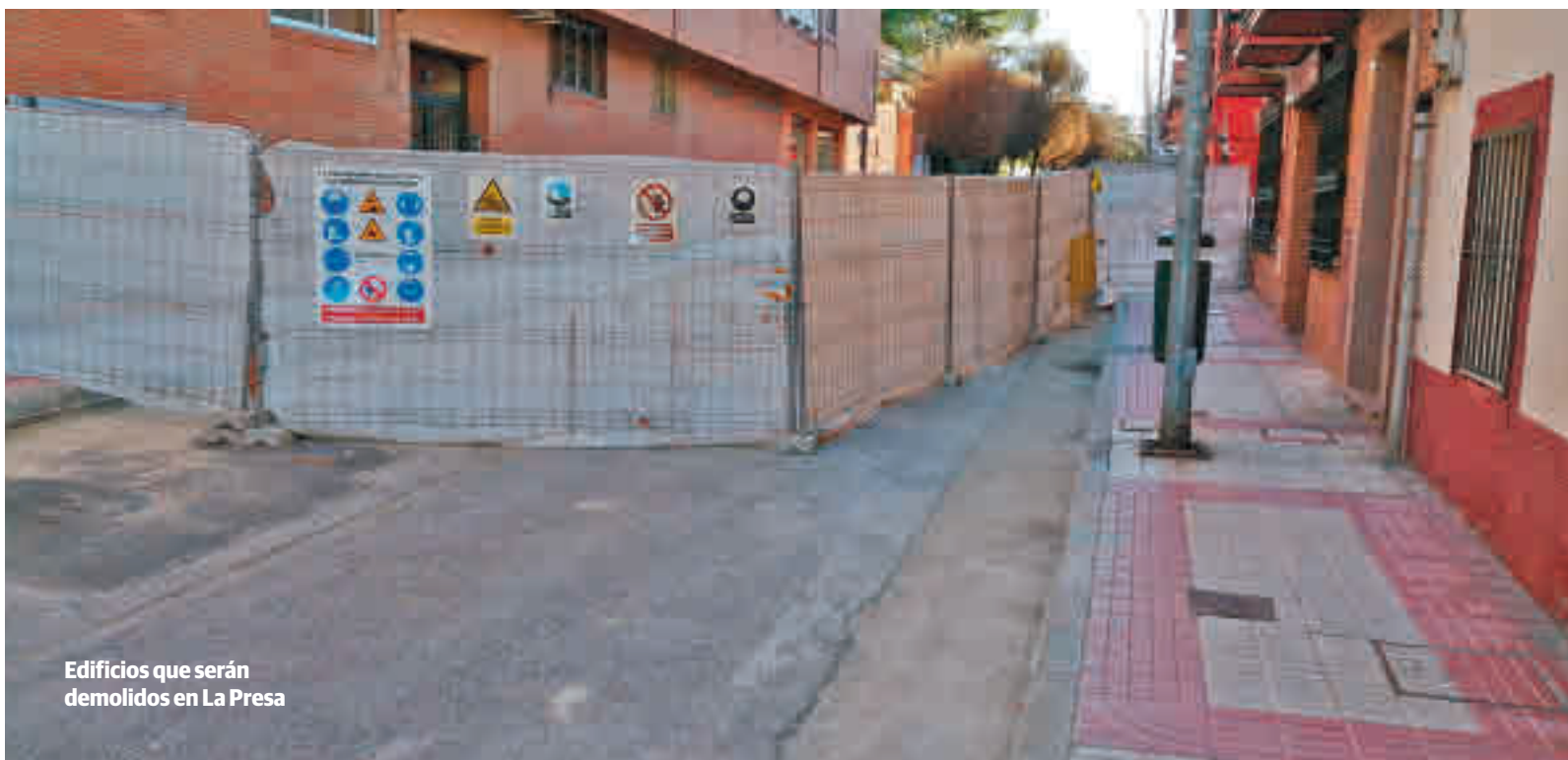
Edificios que serán demolidos en La Presa