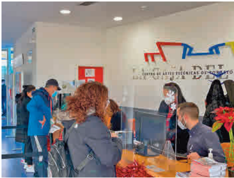
Vecinos recogiendo el primer test de antígenos

Los test de antígenos se entregarán en el Ayuntamiento y en La Caja del Arte de 8 de la mañana a 13 horas. Se entregará un test por persona de cualquier edad y será imprescindible presentar cualquier tipo de documento acreditativo de residencia en el municipio, bien sea el DNI, certificado de empadronamiento o una factura de suministros, entre otros. Asimismo, cualquier persona puede recoger un test para sus familiares o amigos presentando otro documento oficial de esa persona empadronada en la ciudad. Como indican desde el Consistorio, esta prueba ha sido validada para su utilización en la Unión Europea, como así aparece recogido en la web oficial de la Agencia Española del Medicamento y Productos Sanitarios en el Listado común de pruebas rápidas de antígeno para covid-19 para su uso en los estados de la UE. Este test es complementario al que entrega la