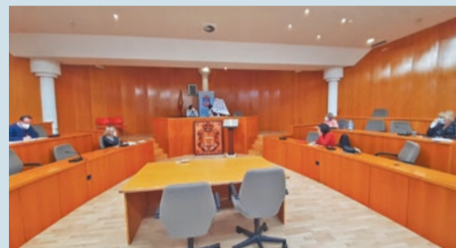
Junta de portavoces del Ayuntamiento de San Andrés del Rabanedo.

SAN ANDÉS | LA MINISTRA RECIBIRÁ A LA ALCALDESA EL 16 DE FEBRERO