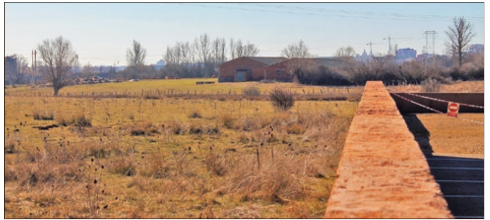
Aledaña también al tanatorio, parcela de 20.000 metros en la que se levantará el Instituto de Secundaria.