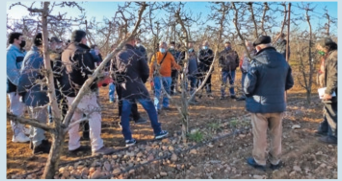
En Santa María el curso irá sobre el nogal, almendro y otros frutales de cáscara.

CAMPO | SERÁ GRATUITO Y LO IMPARTE LA ASOCIACIÓN DE ECOLÓGICOS -AGRELE-