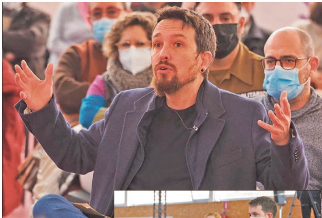
Pablo Iglesias participó el domingo 6-F en León en la charla coloquio titulada 'Corrupción política y propaganda institucional'.

El ex vicepresidente del Gobierno fue más allá y se preguntó si "pueden ser limpias unas elecciones en las que la mayoría de los medios de comunicación son propiedad de dos empresarios condenados de corrupción. ¿Se van a atrever estos medios a denunciar la corrupción del Partido Popular