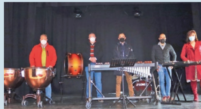
La Banda de Música de Sariegos se ha gestado en la Escuela Municipal de Música.

SARIEGOS | ESTÁ CONTRUYENDO UN SUPERMERCADO EN AZADINOS