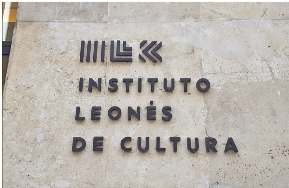
Las bases de los nuevos Premios Concejo fueron aprobadas por el Consejo Rector del Instituto Leonés de Cultura (ILC).

En concreto, podrán ser candidatos a los Premios Concejo los leoneses o personas con especiales vínculos con la provincia por razones de origen y/o residencia,