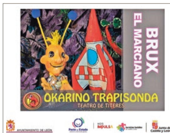
Carteles de las dos representaciones de teatro del 14 al 18 de marzo para sensibilizar contra la violencia de género.