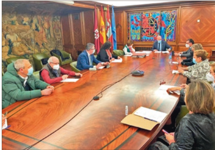
Junta de Gobierno Local del Ayuntamiento de León celebrada el viernes 4 de febrero.

La Junta de Gobierno Local también adjudicó, a la empresa 'Locus avis SLU', el servicio de control de es-