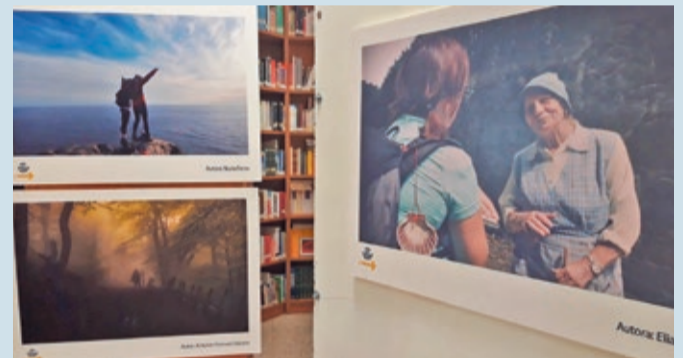
La exposición contiene 12 fotografías con motivo del Año Santo Compostelano.

MANSILLA DE LAS MULAS | HASTA EL 25 DE FEBRERO GRACIAS A CORREOS