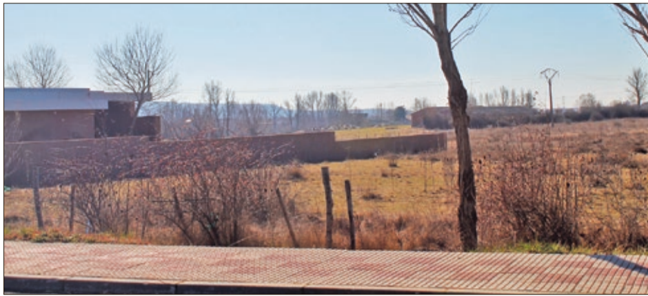
Parcela de 5.000 metros cuadrados sobre la que se construirá el futuro centro de salud.