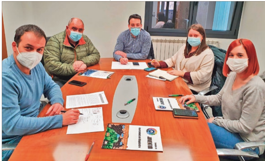
El concejal de Juventud renovó el convenio de colaboración con el Consejo de la Juventud que engloba a distintas asociaciones juveniles.