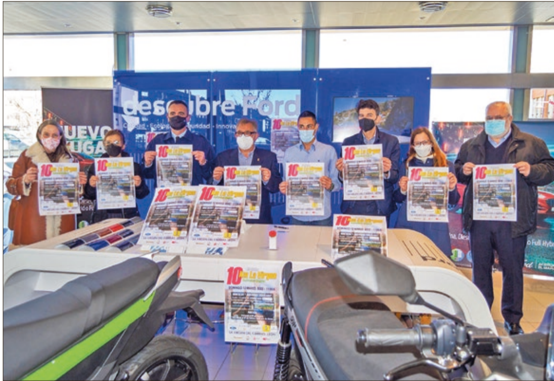
La presentación de la XII edición de la 'Virginiana' tuvo lugar en Auto Palacios, concesionario y taller oficial de Ford en León.