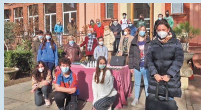
Alumnos de ESO de Maristas San José con residentes del centro de mayores.

LEÓN | JUEGOS DE DAMAS Y AJEDREZ REALIZADOS EN CLASE DE PLÁSTICA