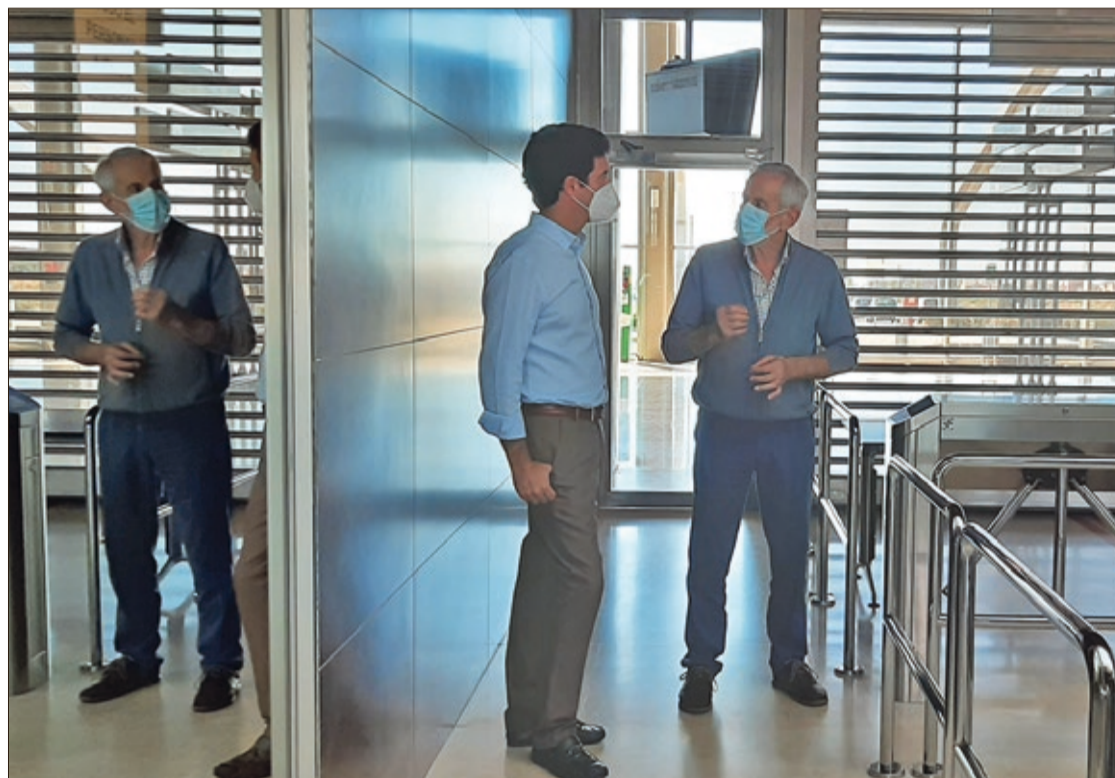
El presidente del Consorcio del Aeropuerto de León, Matías Llorente, conversa en las instalaciones de La Virgen del Camino.

De acuerdo a los mínimos establecidos en el expediente de contratación, que en próximas fechas se publicará en el Diario Oficial de la Unión Europea y en el Perfil del Contratante de la Diputación de