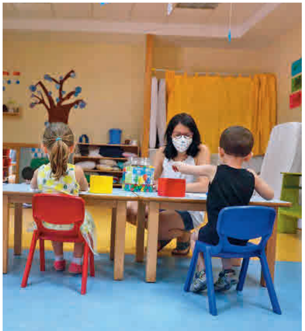
Escuela infantil de la Comunidad de Madrid

La red pública de Educación Infantil y casas de niños suma más de 500 centros distribuidos por la región con un total de 41.000 niños.