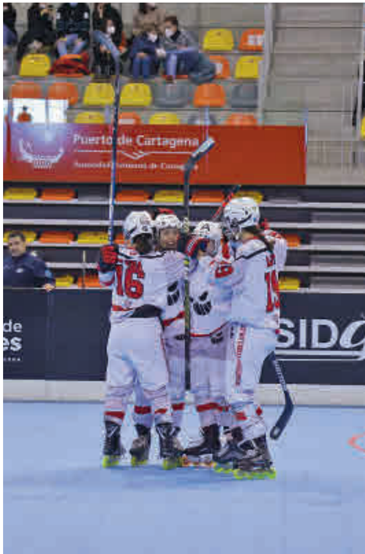
Las jugadoras del Tres Cantos celebrando un gol FEP

Tras superar por un ajustado 4-3 el derbi que deparó el cruce de cuartos de final con el Rink Rat CPL Madrid, el conjunto tricantino volvió a tener una dura prueba en