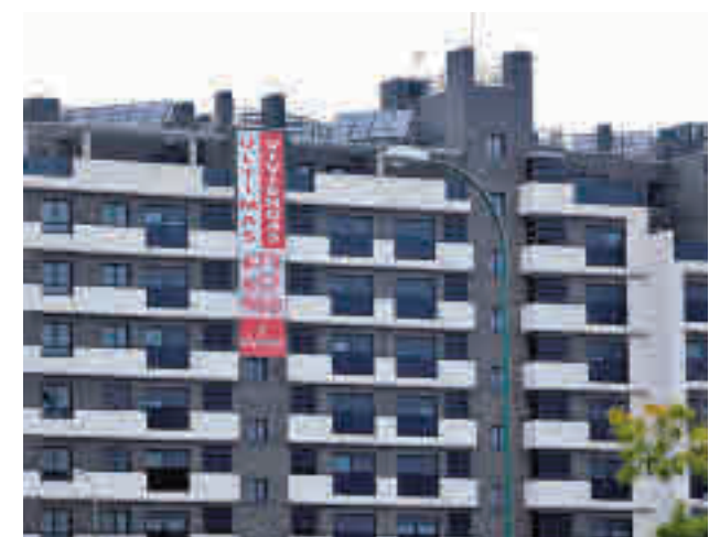
Viviendas en venta en Madrid

Al margen de Madrid, las comunidades que presentaron los mayores aumentos anuales en el número de compraventas de viviendas durante el año 2021 fueron La Rioja (42,7%), Andalucía (42,5%) y Cantabria (38,0%). Por su parte, País Vasco (15,8%), Canarias (22,0%) y Principado de Asturias (23,5%) fueron las que menos crecieron.