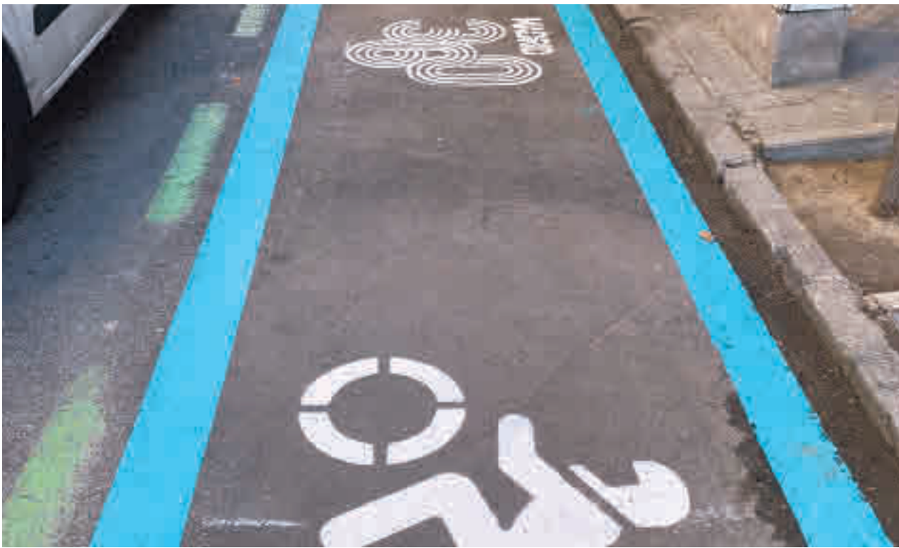
Las instalaciones situadas entre las calles de Menorca y la avenida de Menéndez Pelayo