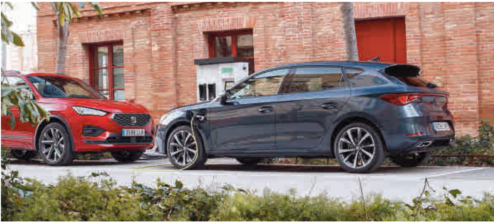
En 2030 se estima que circularán por España cinco millones de vehículos eléctricos