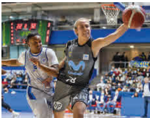
Nueva cita este domingo en Magariños FEB

Por su parte, el Movistar Estudiantes (19 horas) medirá sus fuerzas en Magariños con el Lojintek Gernika Bizkaia, el equipo que aparece justo por detrás suya en la clasificación y que le apeó el año pasado en el 'play-off'.