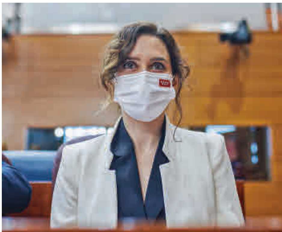
La presidenta regional, en el pleno de la Asamblea de este jueves

La presidenta madrileña también incidió en que "desde hace unos meses distintos medios de comunicación han venido denunciando que dirigentes del PP estaban creando un dossier" contra ella, vinculándola "a algún caso de corrupción referido a mi familia".