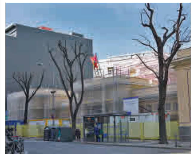
Estado actual de las obras