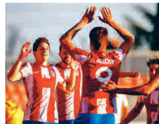
El filial rojiblanco continúa con su buena dinámica

tos al ascenso, Las Rozas, que visita en la tarde del domingo (18 horas) el campo de un Complutense que corre el riesgo de quedarse descolgado en la lucha por la permanencia. Otro partido destacado en la zona alta lo jugarán el Rayo Vallecano B y el Torrejón. Será este domingo (11 horas) en la Ciudad Deportiva franjirroja.