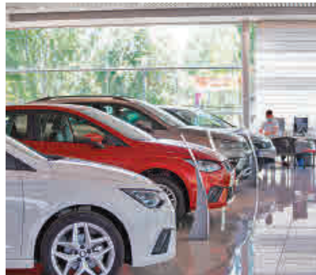
Imagen de un concesionario

En su respuesta, el Gobierno precisa que el incremento en el impuesto de matriculación según las emisiones de dióxido de carbono (CO2) del vehículo se aplicará a los compradores que reciban sus vehículos nuevos en 2022, aunque hubieran formalizado su adquisición el año pasado. "Según las primeras estimaciones, se calcula que el