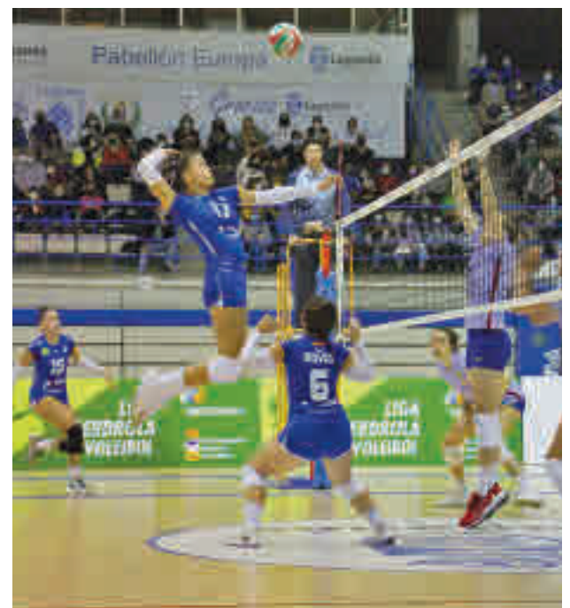
El torneo de la regularidad regresa tras el parón copero

Después de esa gran conquista, el cuadro tricantino ya mira a su siguiente objetivo, que no es otro que defender otro título, el de campeón de Liga. Para ello deberá asegurarse su pase al 'play-off', una ronda en la que, si se mantiene lo visto en la fase regular, habrá una enorme igualdad, ya que solo tres puntos separan al líder, el Munia Panteras, del tercero, el propio Tres Cantos. Este sábado 19 (17 horas), cita en el Laura Oter ante el Tucans.