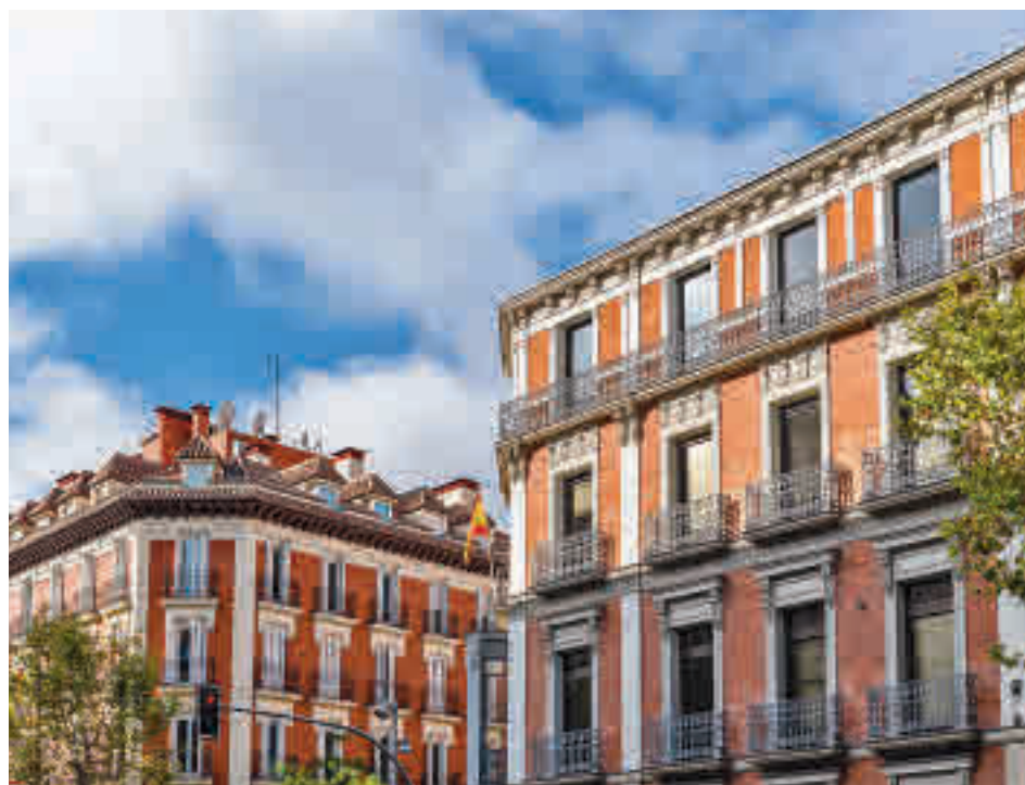
Dos edificios de viviendas del barrio de Recoletos