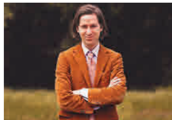
El director Wes Anderson

americano Wes Anderson, localizado en unos decorados construidos entre los municipios de Chinchón y Colmenar de Oreja. En esta película han participado estrellas de la talla de Tom Hanks, Scarlett Johansson, Bill Murray,