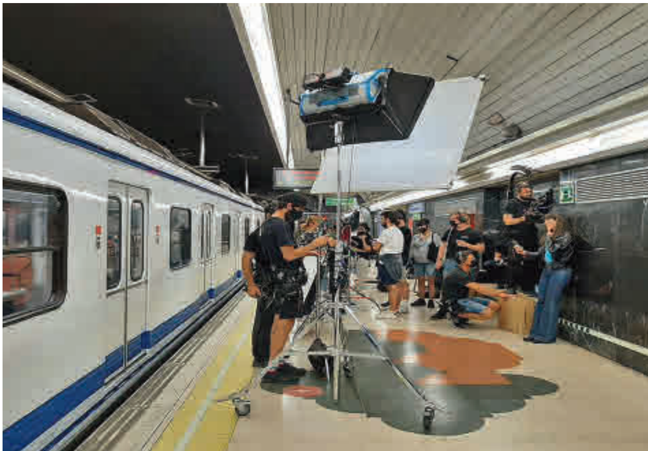
Set de rodaje en un andén del Metro