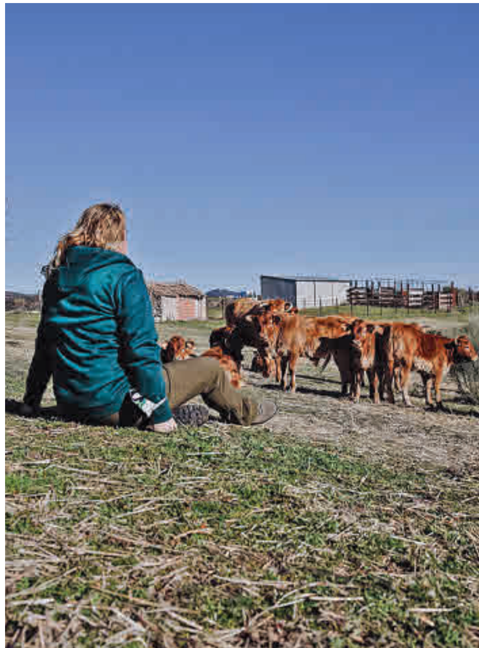
Las zonas rurales de la Comunidad están creciendo

En el extremo opuesto están las pérdidas sufridas por Asturias (26,9%), Castilla y León (19,7%), Galicia (16,9%), Extremadura (9,6%) y Castilla-La Mancha (2%). La pérdida de población de los municipios rurales impacta negativamente en el crecimiento de las lo-