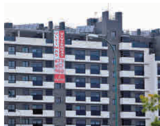
Viviendas en venta en Madrid

Al margen de Madrid, las comunidades que presentaron los mayores aumentos anuales en el número de compraventas de viviendas durante el año 2021 fueron La Rioja (42,7%), Andalucía (42,5%) y Cantabria (38,0%). Por su parte, País Vasco (15,8%), Canarias (22,0%) y Principado de Asturias (23,5%) fueron las que menos crecieron.