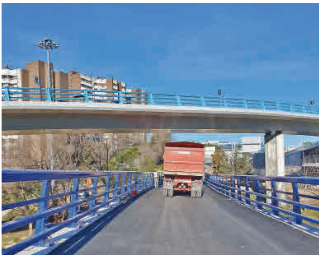
La prueba de carga del puente tuvo lugar una semana antes de su puesta en funcionamiento