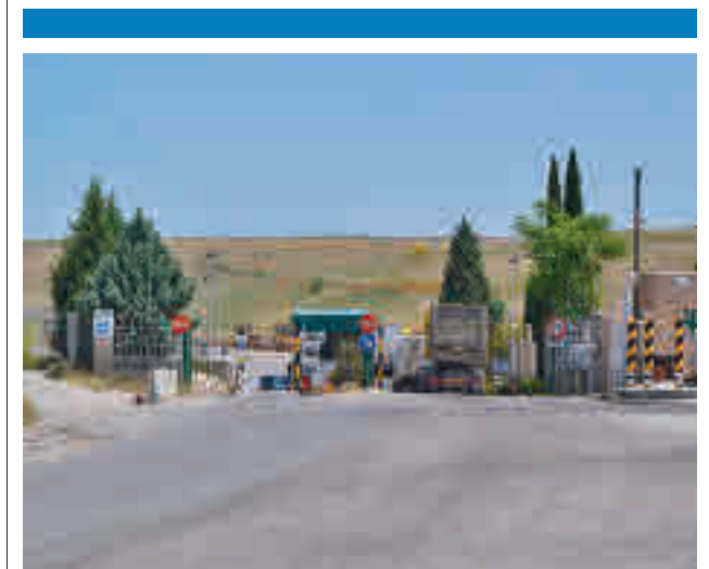
Vertedero de Pinto

Dos técnicas de Urbanismo del Ayuntamiento de Valdemoro han sido imputadas por su presunta participación en la trama 'Púnica'.