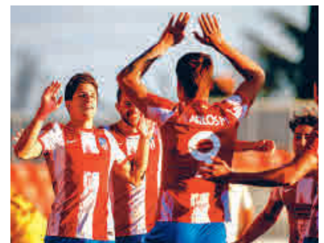
El filial rojiblanco continúa con su buena dinámica

tos al ascenso, Las Rozas, que visita en la tarde del domingo (18 horas) el campo de un Complutense que corre el riesgo de quedarse descolgado en la lucha por la permanencia. Otro partido destacado en la zona alta lo jugarán el Rayo Vallecano B y el Torrejón. Será este domingo (11 horas) en la Ciudad Deportiva franjirroja.