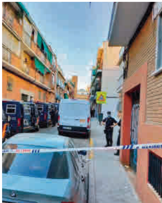
Desalojo en la zona Sur de Madrid

Respecto a la segunda, en los últimos tiempos ha "aflorado muchísima gente que se quiere aprovechar" y entra a las viviendas pagando un mes o dos y a partir de ahí dejan de pagar. Ello conlleva que el proceso judicial se pue-