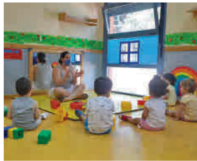
Escuela infantil de la Comunidad de Madrid