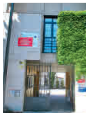
Centro Las Dehesillas

viernes 18 de febrero a las 17 horas en el centro municipal Las Dehesillas y tiene como objetivo que ciudadanos particulares, asociaciones, comerciantes y profesionales conozcan cómo funciona este proceso y sus ventajas ante supuestos de insolvencia. El presidente de Red Autóno-