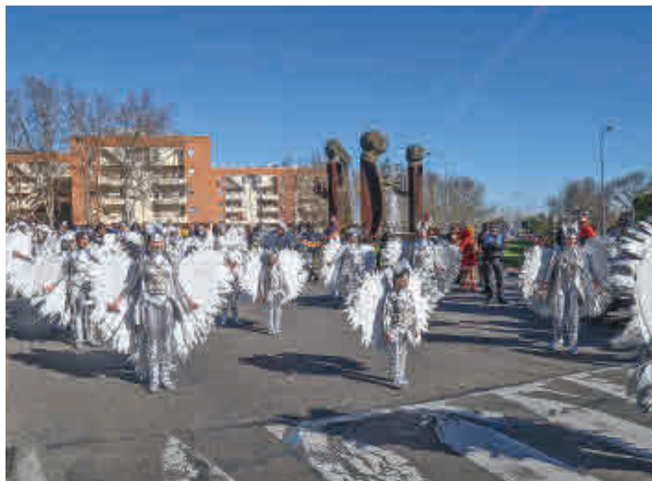
Última edición del Carnaval de Leganes

Toda la actualidad de Leganes, en nuestra página web