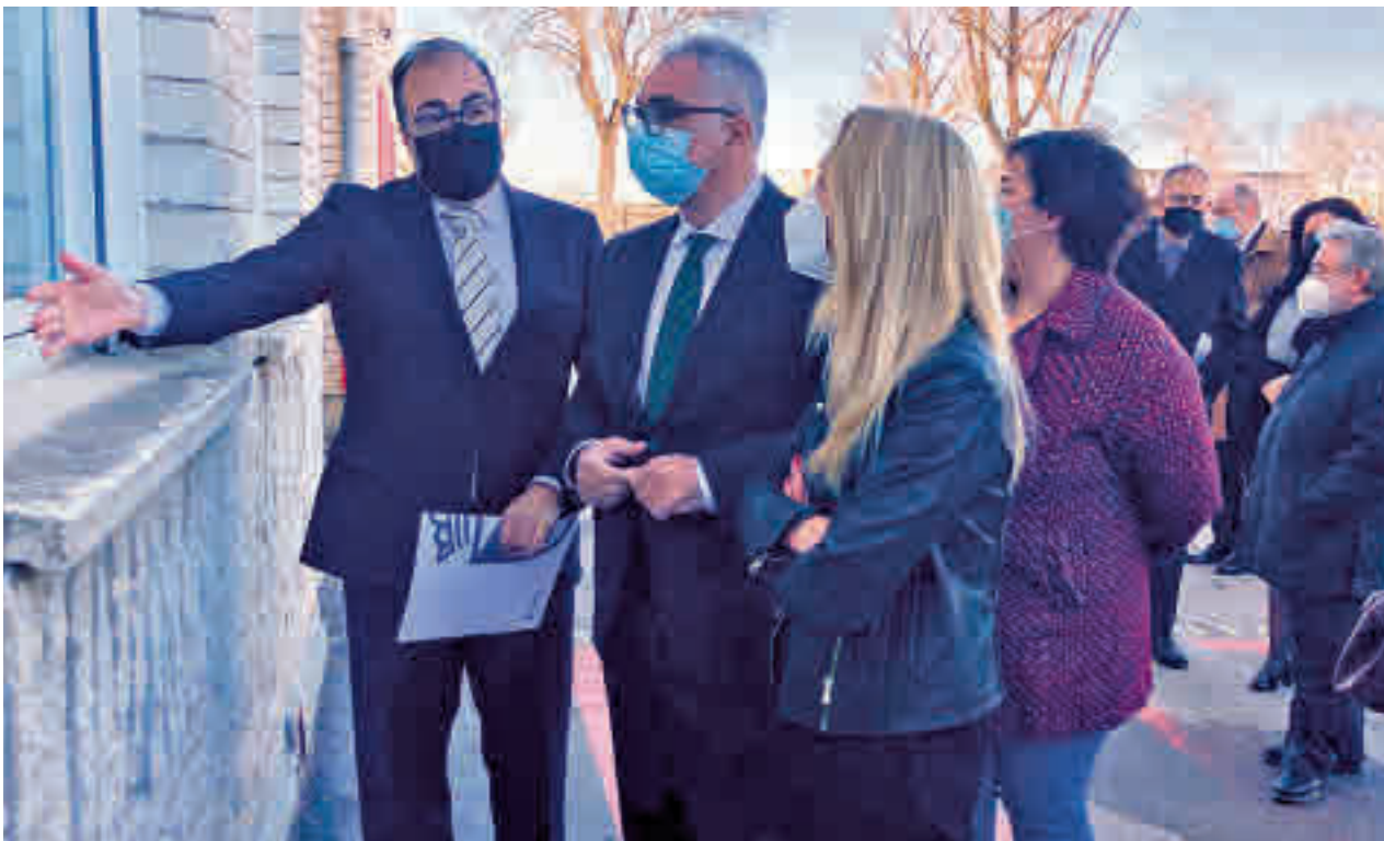
El consejero de Administración Local visitó Leganés el mismo día que se hizo pública la carta