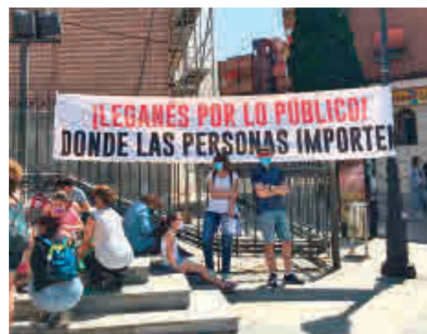
Una de las últimas protestas

una manifestación que partirá de la avenida de Gibraltar, desde la salida de Metro Casa del Reloj, y que concluirá en la Plaza del Salvador, donde se leerá un manifiesto, según han informado los convocantes. Estos colectivos han realizado en los dos últimos años hasta cuatro movilizaciones de este tipo para reclamar la defensa de los servicios públicos ya que, a su juicio, “vienen