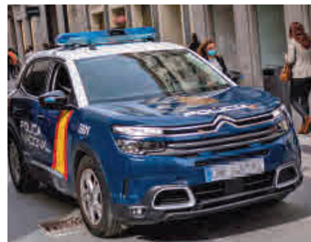
El vehículo policial patrulla por las calles de la capital

Por otro lado, se denunciaron 1.348 delitos contra la libertad e indemnidad sexual, un 20% más que en 2020. De