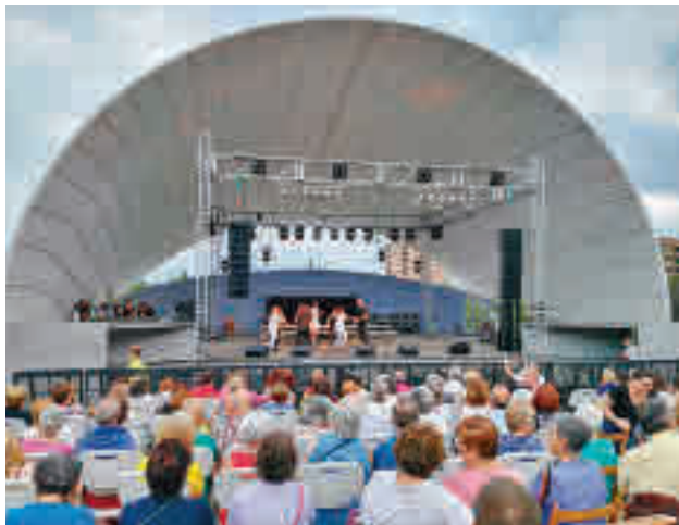
Uno de las actividades de la edición de 2018

Por otro lado, la joven Orquesta Sinfónica de la Universidad Alfonso X El Sabio (UAX) actuará tanto el viernes 25 (19 horas), como el sábado 26 (12 horas), en el mismo escenario. Y el 26 de febrero a las 19 horas, de nuevo en el Úrculo, el turno será para el grupo Algarabía, con el montaje de danza española y flamenco ‘Debla’.