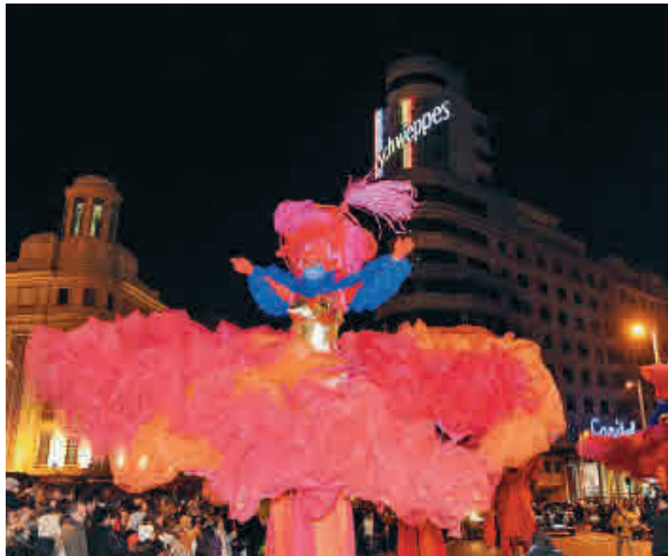
El desfile de carnaval de la última edición antes de la pandemia

Amatria y Soleá Morente pondrán banda sonora a los festejos en la plaza de Mata-