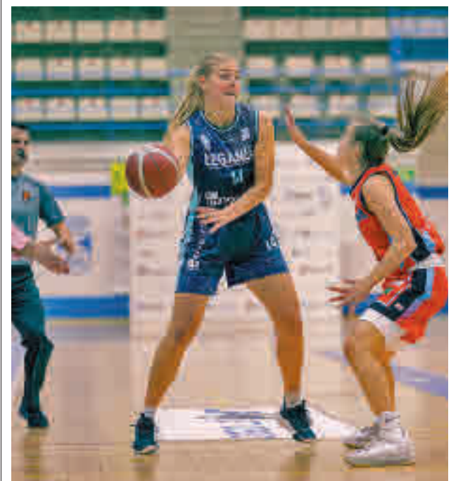
El Leganés cogió aire en la clasificación

Otro de los platos fuertes de la programación será la competición de lanzamiento de peso, que congregará a atletas de la talla del checo Tomáš Stanek, el croata Filip Mihaljević, o el polaco Konrad Bukowiecki, rivales todos ellos del veterano español Carlos Tobarina. El pistoletazo de salida de la jornada llegará a las 19 horas con el concurso de longitud y se cerrará en torno a las 21:40 con la final masculina de los 60 metros. A esa hora se sabrá si Madrid vuelve a alumbrar un nuevo récord del mundo por tercer año consecutivo, tras las plusmarcas de Yulimar Rojas en 2020 y Grant Holloway en 2021.