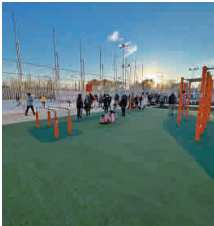
El circuito de calistenia de la dotación deportiva

En esta puesta de largo, grandes y pequeños participaron en las actividades lúdicas y deportivas organizadas por el Centro Deportivo Municipal Barajas. Además, el equipo cadete femenino del club CDE Alameda de Osuna Baloncesto realizó su entrenamiento habitual y el club de fútbol sala CDE Alaró Deportiva organizó un triangular