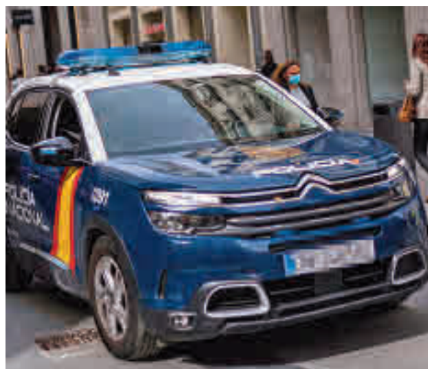
El vehículo policial patrulla por las calles de la capital

La delincuencia subió un 11,3% en la capital el año pasado con respecto a 2020, año pandémico, con especial ascenso de los robos en casas, delitos sexuales, hurtos, robos de vehículos y reyertas. Así lo refleja el último Balance de la Criminalidad publicado por el Ministerio del Interior el 21 de febrero. Según datos policiales, los homicidios dolosos y asesinatos consumados fueron 18, dos más que en 2020 y 2019, mientras que las tentativas de homicidios fueron 50, frente a las 46 de 2020 y 42 de 2019. Por su parte, los delitos graves y menos graves de lesiones y riña