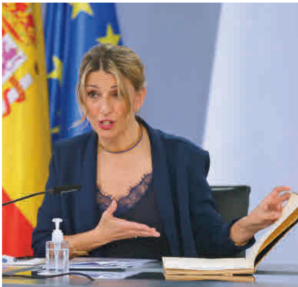
Yolanda Díaz, tras la reunión del Consejo de Ministros

Las empresas y trabajadores tendrán de esta manera un mes para adaptarse a las nuevas herramientas permanentes incorporadas en la reforma laboral. Una de ellas es el Mecanismo RED, que incluye exoneraciones del 40%, siempre condicionadas a formación. En este caso la compañía está obligada a presentar un plan de recualificación que incluya la realización obligatoria de acciones de formación para posibilitar la recolocación en otro puesto dentro de la misma empresa, o bien en otras. Tiene una duración de un año, con la posibilidad de dos prórrogas de seis meses. A nivel de empresa existen también dos opciones: