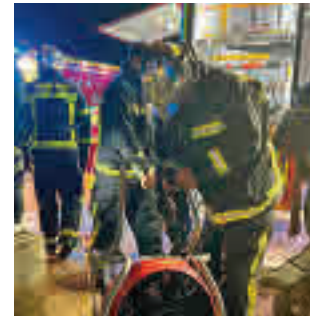
Incendio en Parla