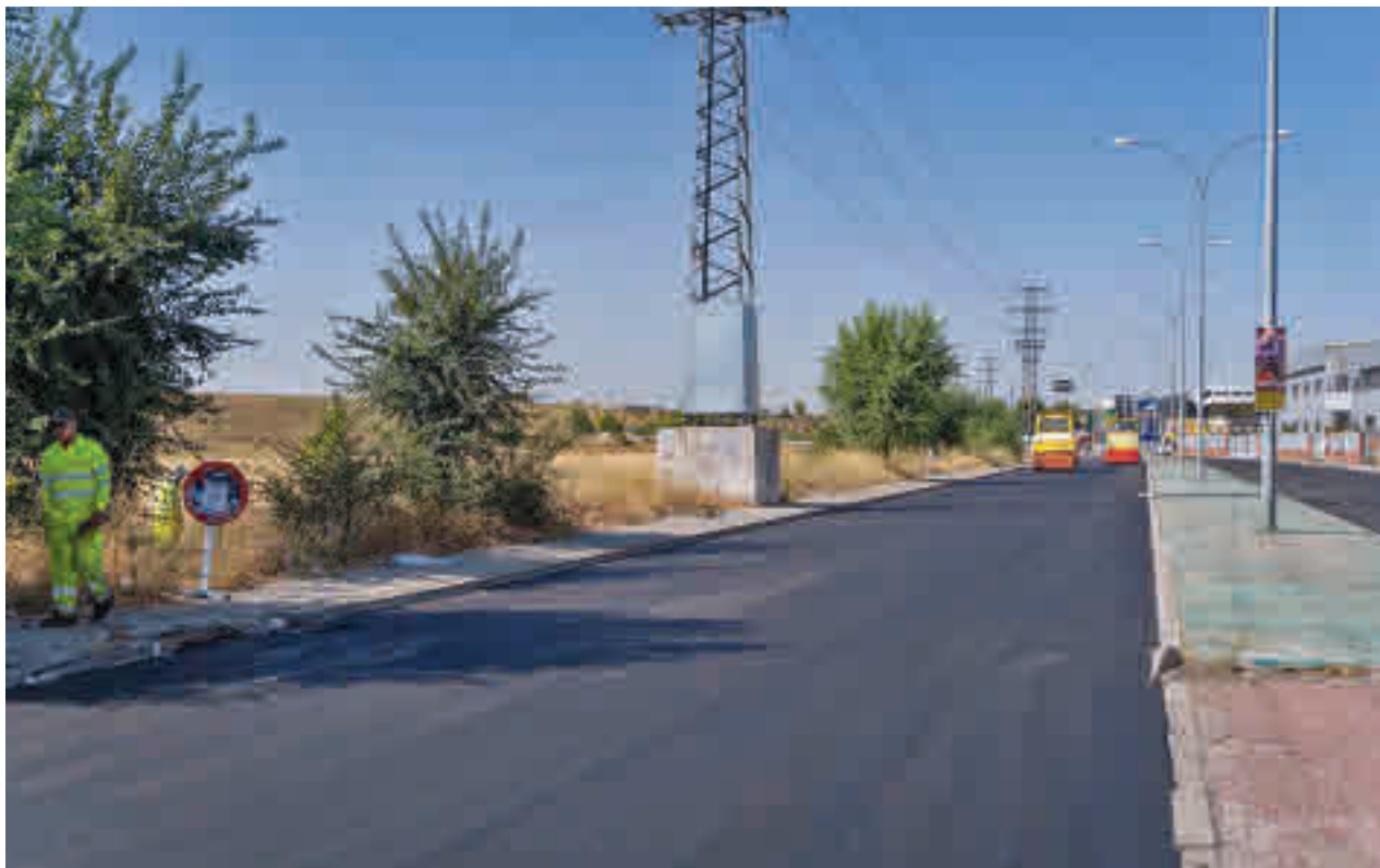
Los servicios municipales actuarán en las calles de Alcorcón este verano