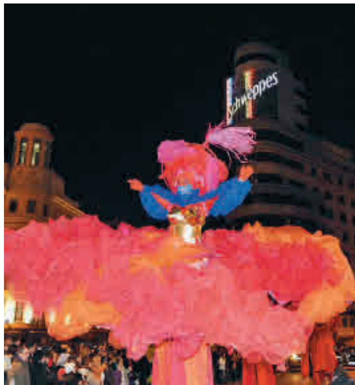
El desfile de carnaval de la última edición antes de la pandemia

Desde Cibeles explican que el Carnaval mantiene la esencia de sus tradiciones, "pero desde un enfoque abierto, moderno y en sintonía con las manifestaciones musicales contemporáneas". Los protagonistas de esta edición serán artistas y DJ de la escena nacional y madrileña, que ponen en alza la diversidad y la renovación de la música pop actual. Amatria y Soleá Morente pondrán ban-