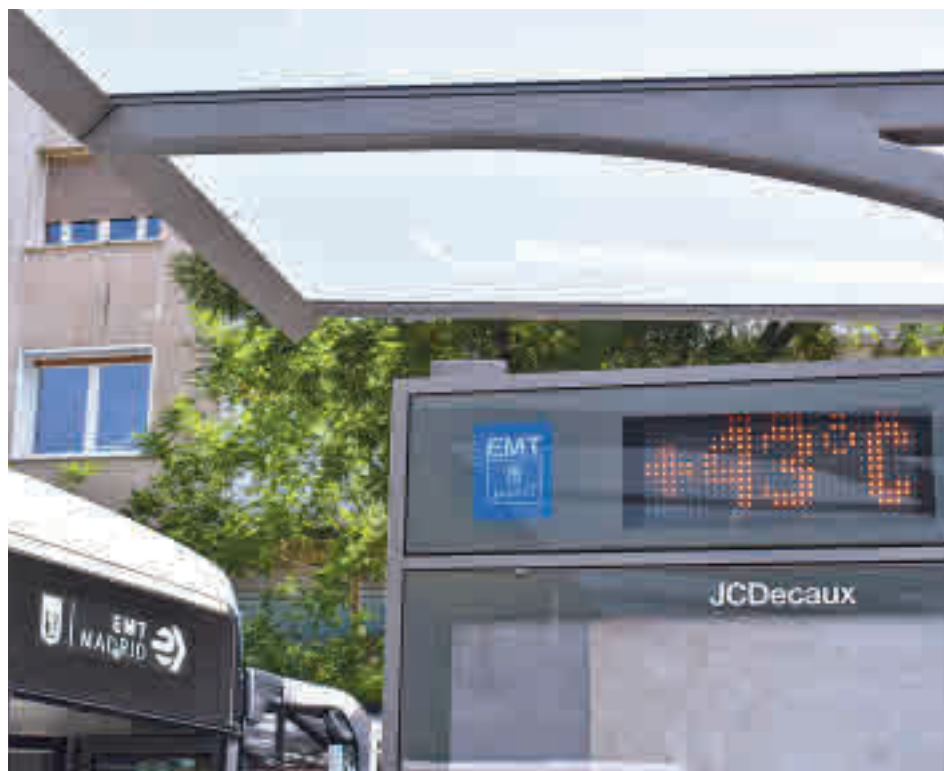
La temperatura se ha incrementado desde 1961

El organismo achaca este fenómeno a la "intensa urbanización del territorio" que se ha experimentado en esos 58 años en la Comunidad de