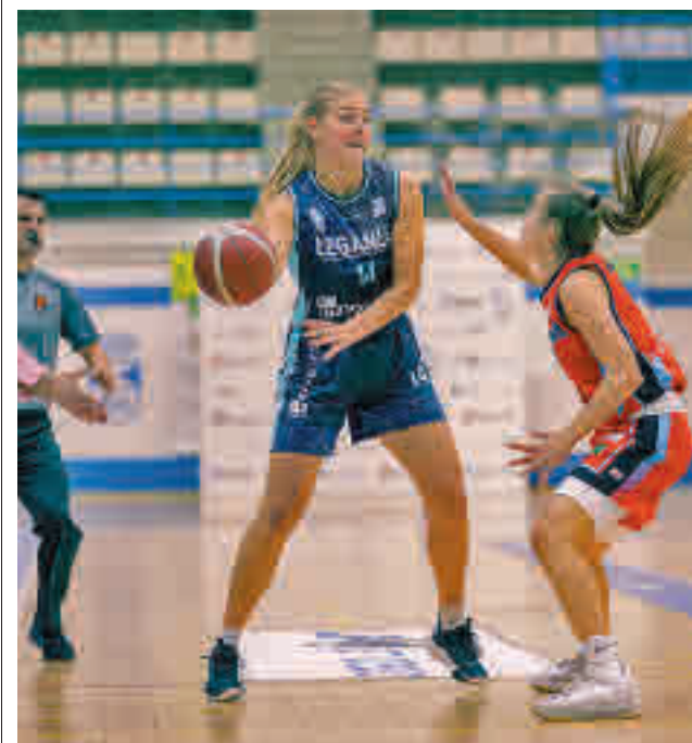
El Leganés cogió aire en la clasificación

Otro de los platos fuertes de la programación será la competición de lanzamiento de peso, que congregará a atletas de la talla del checo Tomáš Stanek, el croata Filip Mihaljević, o el polaco Konrad Bukowiecki, rivales todos ellos del veterano español Carlos Tobarina. El pistoletazo de salida de la jornada llegará a las 19 horas con el concurso de longitud y se cerrará en torno a las 21:40 con la final masculina de los 60 metros. A esa hora se sabrá si Madrid vuelve a alumbrar un nuevo récord del mundo por tercer año consecutivo, tras las plusmarcas de Yulimar Rojas en 2020 y Grant Holloway en 2021.