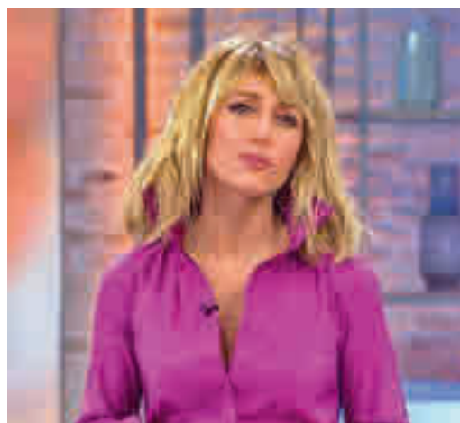
Emma García, presentadora de 'Viva la vida'

EL PERIÓDICO GENTE NO SE RESPONSABILIZA NI SE IDENTIFICA CON LAS OPINIONES QUE SUS LECTORES Y COLABORADORES EXPONGAN EN SUS CARTAS Y ARTÍCULOS