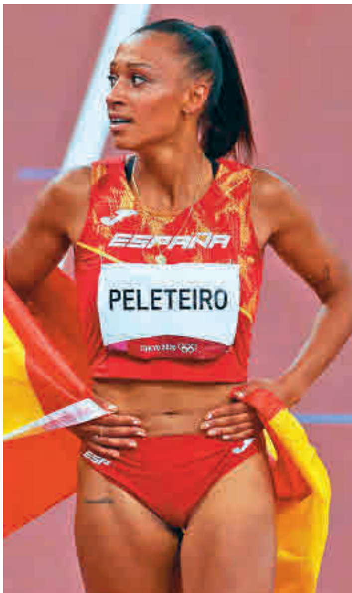
Ana Peleteiro será una de las grandes atracciones

Así, el público que se acerque hasta esta instalación podrá disfrutar de una gran programación, aunque hay varios concursos que sobresalen por encima del resto de pruebas. Uno de ellos es, claramente, el triple salto. Salvo infortunio de última hora, se espera que la venezolana Yulimar Rojas y la española Ana Peleteiro reediten el precioso duelo que ya protagonizaron en los pa-