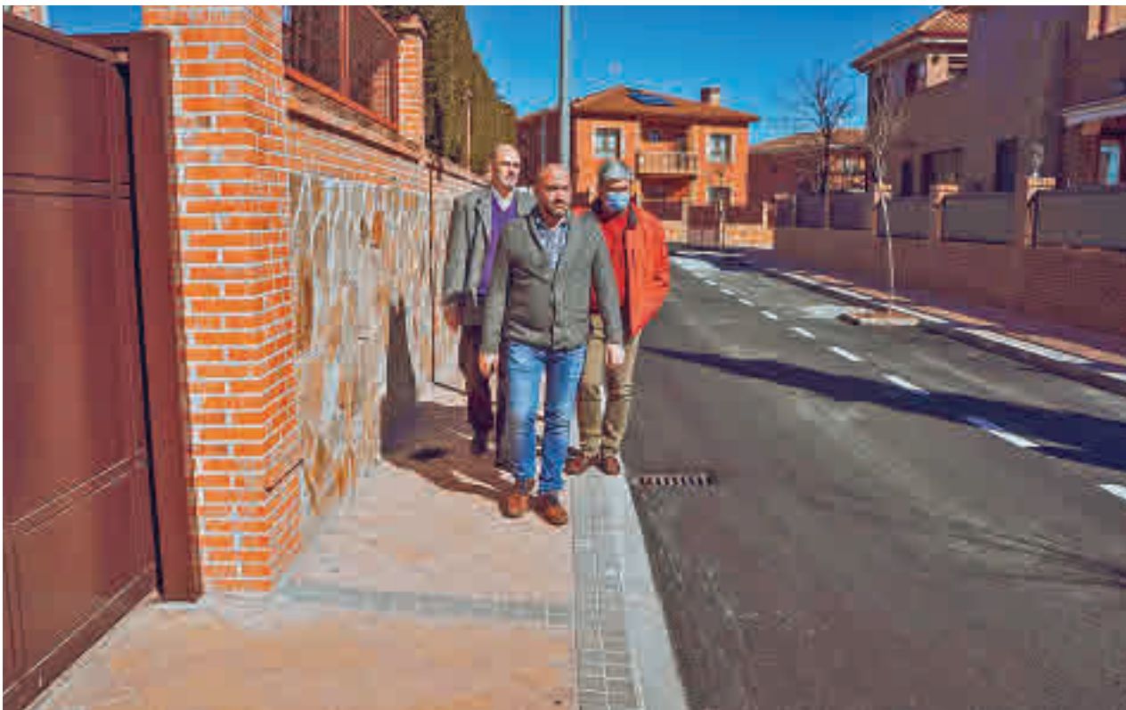
Visita institucional al entorno de Doble Rotador