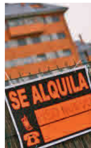
Vivienda en alquiler

los precios de la vivienda alquilada como residencia habitual. En el caso de Madrid, es el menor crecimiento registrado desde el año 2015, cuando el aumento fue de un 0,4%. En estos cinco años, el precio ha experimentado una subida global de un 11,4%. La vivienda familiar, como casas o chalés, ha registrado un aumento del 0,5%, mientras que en el caso de la colectiva, como los pisos, ha sido del 0,7%. En cuanto a los municipios de más de 10.000 habitantes donde más ha subido el precio del alquiler, Gri-