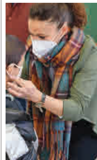
Mascarillas en interior

UGT Madrid sí que ve mejoras en determinados aspectos que pueden ayudar a que esa brecha salarial disminuya más rápidamente. Entre esos factores se citaron el aumento del Salario Mínimo Interprofesional y la reciente reforma laboral.