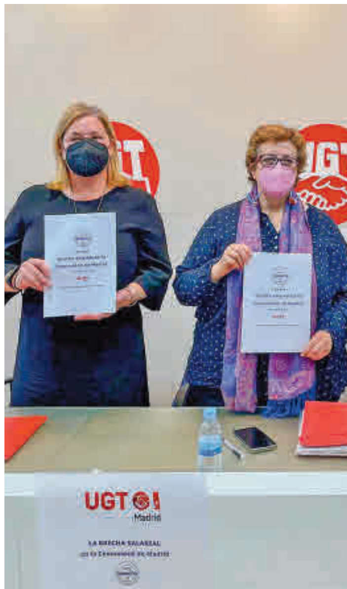
Presentación del informe de la brecha salarial

Un estudio de UGT Madrid sobre la brecha salarial asegura que las trabajadoras cobran 7.500 euros menos al año que sus compañeros ● Se ha reducido un 0,8% respecto a 2019