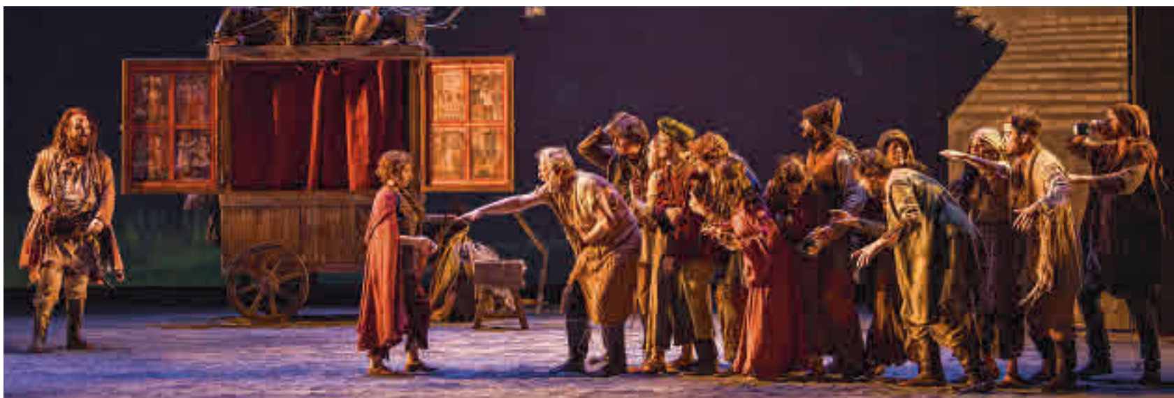
Un momento de la representación de 'El médico'