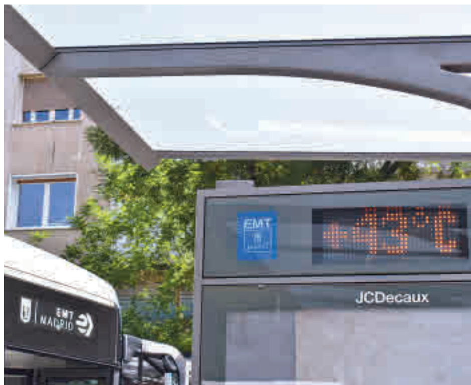
La temperatura se ha incrementado desde 1961

El organismo achaca este fenómeno a la "intensa urbanización del territorio" que se ha experimentado en esos 58 años en la Comunidad de