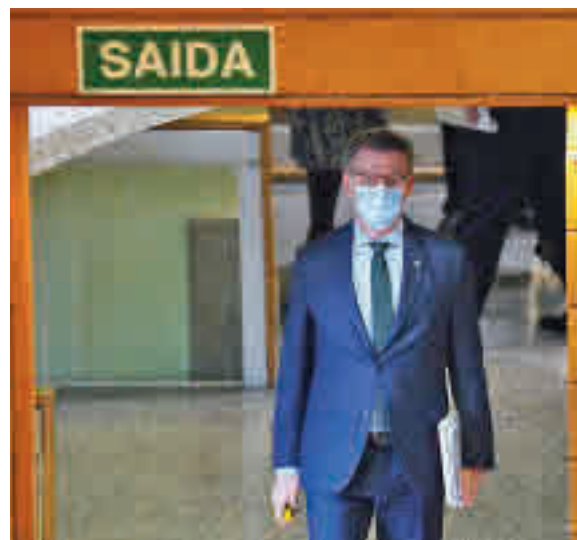
Alberto Núñez Feijóo

Desde el entorno de la presidenta regional muestran su “tranquilidad” por este asunto y esperan que Anticorrupción se pronuncie “lo antes posible”, ya que consideran que lo normal es que la denuncia se archive.