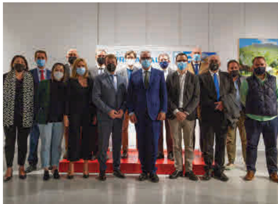
Foto de familia en el encuentro empresarial

gentedigital.es La actualidad de Tres Cantos y Colmenar, en nuestra web.