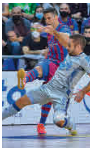
Un nuevo Barça-Inter

tar trata de cambiar el chip para disputar este fin de semana la Supercopa de España, una competición que el año pasado le sirvió para en-