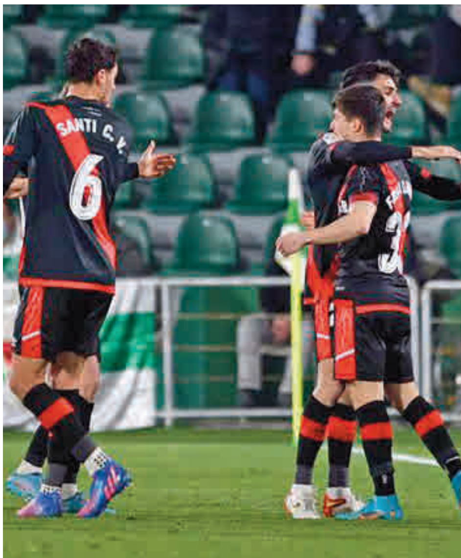
El Rayo no atraviesa su mejor momento de la temporada

Repasando las estadísticas de este curso, el Rayo ya sabe lo que es lograr un resultado similar como visitante. Fue el pasado 21 de septiembre y, curiosamente, ante otro de los equipos que sigue en liza en el torneo copero, el Athletic Club. El 1-2 obtenido en San Mamés supone un espejo en el que mirarse, especialmente cuando el conjunto vallecano atraviesa uno de los momentos de más dudas