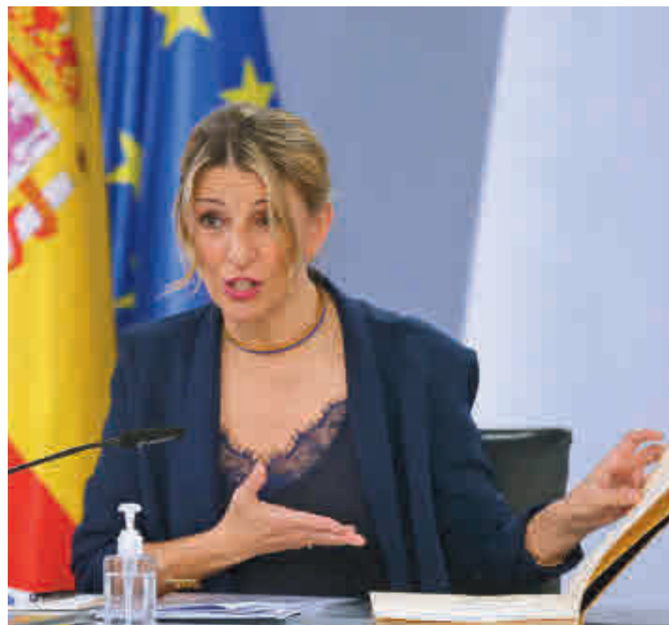
Yolanda Díaz, tras la reunión del Consejo de Ministros

Durante el mes de marzo, las empresas, con independencia de su tamaño, tendrán un 60% de exoneración en sus pagos a la Seguridad Social si imparten formación a los trabajadores en ERTE, frente al 80% actual. En caso de no dar formación, la exención será del 20% (ahora es del 40%) en las empresas de más de diez trabajadores y del 30% si tienen menos de diez empleados. La exoneración para los conocidos como