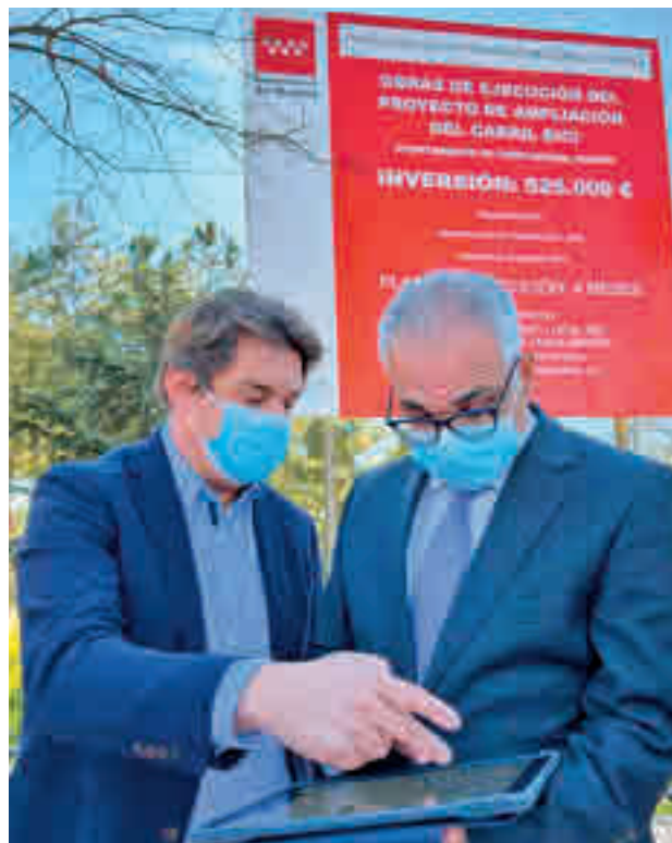
Visita de Izquierdo a Fuenlabrada

El alcalde señaló que “esto denota lo poco presente que se tiene a Fuenlabrada en el Gobierno regional”, con un PIR que “no ha cubierto las necesidades del municipio los dos años anteriores”. Por su lado, Izquierdo recordó que el Ayuntamiento de Fuenlabrada es “uno de los que más retraso llevan en la petición de los nuevos planes de futuro”, ya que casi todos los municipios han presentado ya “actuaciones” al PIR. “Por eso, exigimos desde