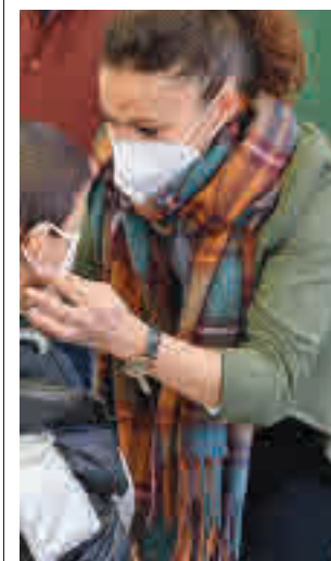
Mascarillas en interior

UGT Madrid sí que ve mejoras en determinados aspectos que pueden ayudar a que esa brecha salarial disminuya más rápidamente. Entre esos factores se citaron el aumento del Salario Mínimo Interprofesional y la reciente reforma laboral.