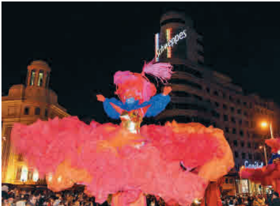
El desfile de carnaval de la última edición antes de la pandemia

gentedigital.es Toda la actualidad de los distritos de Madrid, en nuestra web