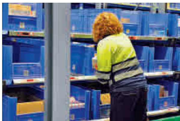
El salario mínimo afecta más a las mujeres

"El SMI empieza a ser ya digno en nuestro país y se asemeja a las medias europeas, aunque queda mucho camino por recorrer", señaló Yolanda Díaz, que pidió "un com-