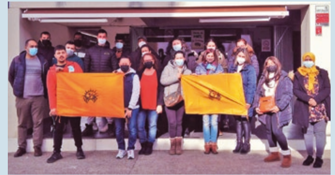
Los alumnos del curso posan a la puerta de la Casa de Cultura de Alija.