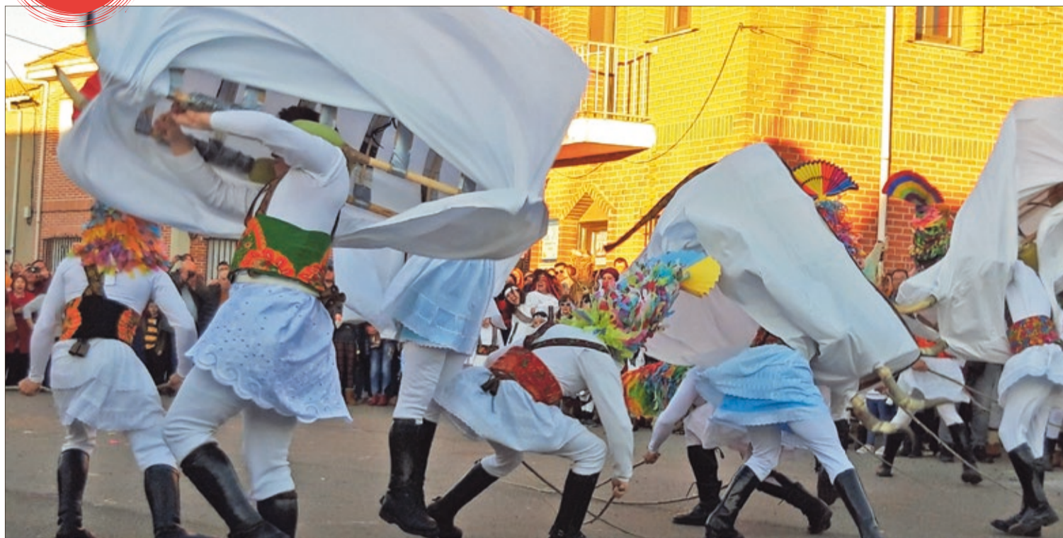
El Antruego de Velilla de la Reina, con la espectacularidad de los envites entre toros y guirrios, está declarado de Interés Turístico Provincial e incluido en el expediente de declaración BIC.