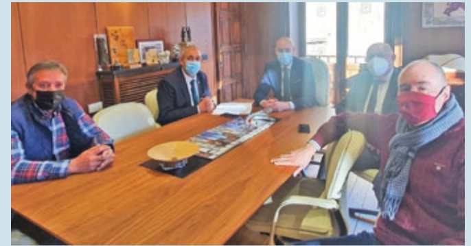
El encuentro entre Ayuntamiento y comité organizador fue el 23 de febrero.