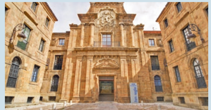
Fachada del hospital HM La Regla, que acogerá el Servicio de Oftalmología.