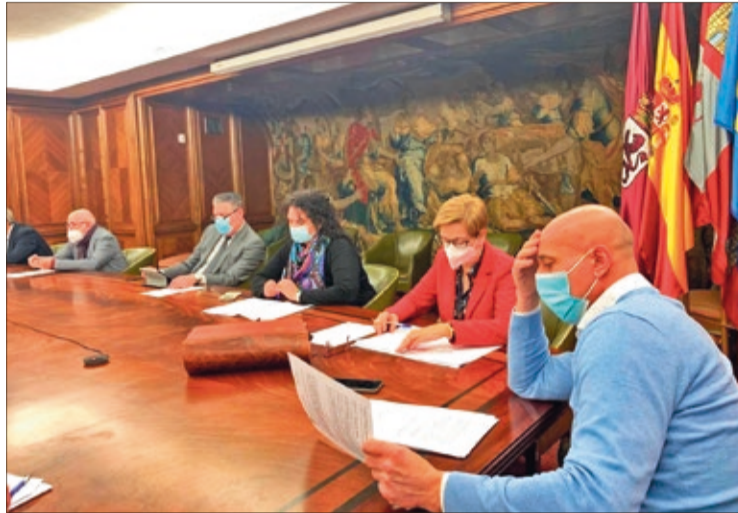
Junta de Gobierno Local del Ayuntamiento de León celebrada el viernes 18 de febrero.

Las subvenciones anuales de la Concejalía de Promoción Económica suman un importe de 107.000 euros, que se divide en dos programas: Apoyo a la creación de empresas, dotado con 83.000 euros, cuyo objetivo es fomentar la creación de microem-