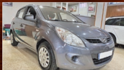
HYUNDAI I20 1.2 CLASSIC 78 CV. AIRE ETC... AÑO 2011 • 7.600€