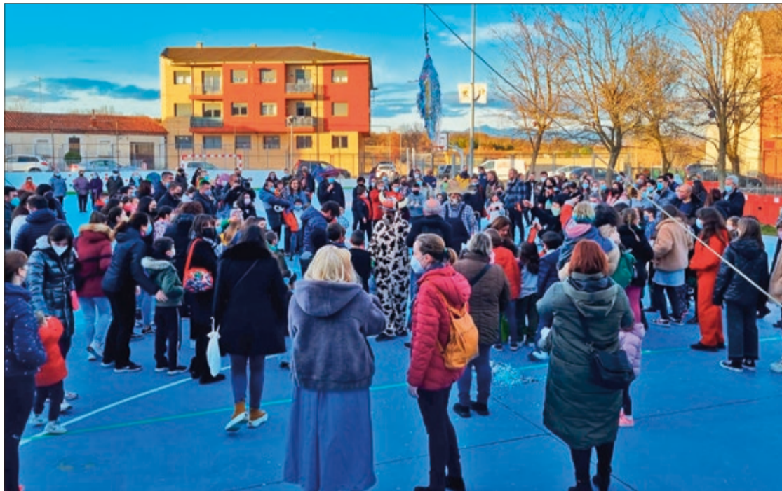
La destrucción de la piñata 'Sardina y confeti', el domingo 20 de febrero en el CRA de Villaquilambre, inauguró la fiesta de Carnaval.