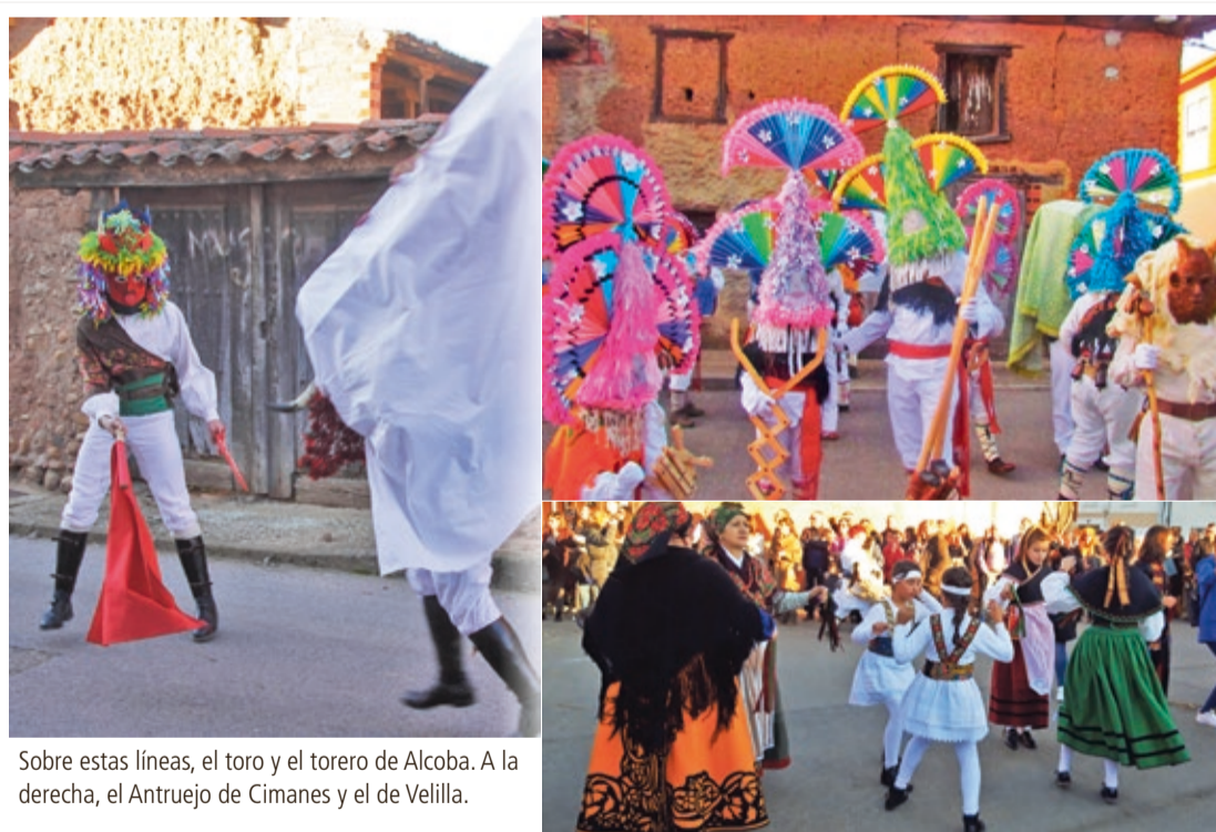
Sobre estas líneas, el toro y el torero de Alcoba. A la derecha, el Antruego de Cimanes y el de Velilla.

Antruego en Velilla y en Alcoba. Esta última recuperó hace unos años su Carnaval y los principales protagonistas que son las figuras del toro y el torero, entre otros personajes como las toras (toros de saco), los enanos, los guirrios (ataviados con ropas viejas o la máscara). A las cinco de la tarde, los antruejos se concentrarán en la plaza para recorrer todo el pueblo y finalizar en el frontón, donde continuará la fiesta carnalera.