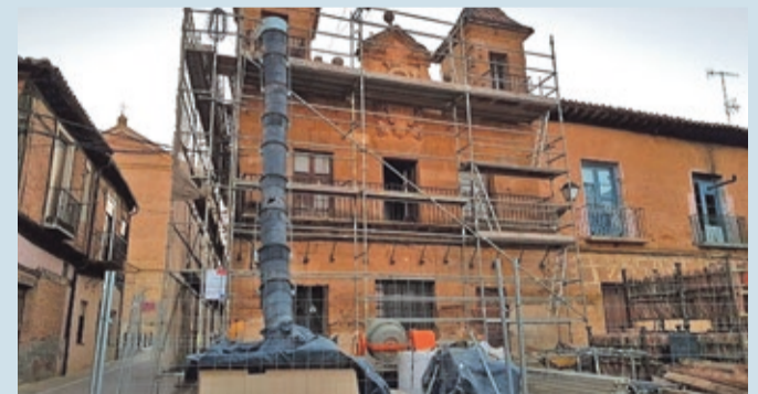
El museo irá ubicado en el viejo Ayuntamiento tras concluir su rehabilitación.