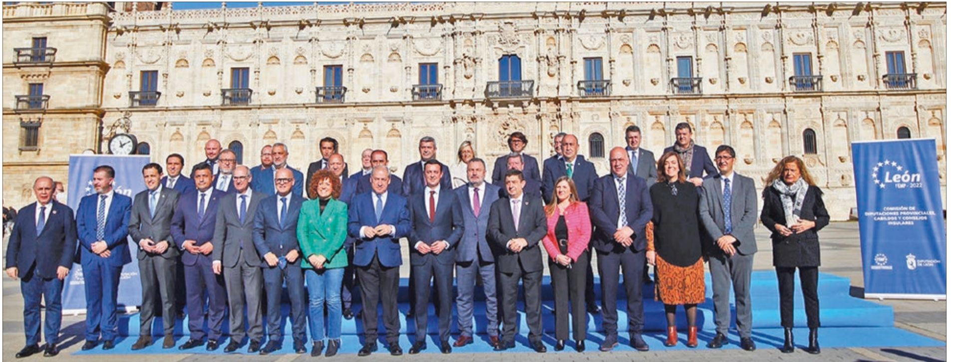
El presidente de la Diputación, Eduardo Morán, ejerció de anfitrión del pleno de la Comisión de Diputaciones Provinciales, Cabildos y Consejos Insulares de la Federación Española de Municipios y Provincias (FEMP) que se celebró en León el 21-F.