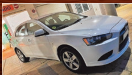
MITSUBISHI LANCER SPORTBACK 2.0 DI-D 16V 140CV 5P. AÑO 2009 • 8.990€