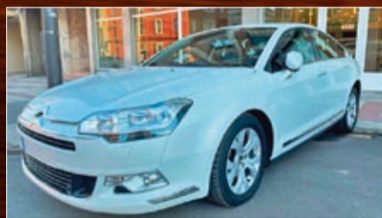
CITROEN C5 2.0 HDI 140 CV MILLENIUM AÑO 12/2012 • 10.600 €

Avda. Párroco Pablo Díez 199 Trobajo del Camino 24010 León Tel.: 987 840 448 www.autoscelada.es