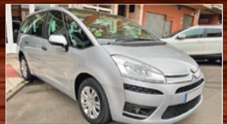
CITROEN GRAND C4 PICASSO HDI 110 CV CLIMA ETC... 89.000 KMS. 12/2011 - 9.600€