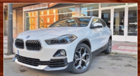
BMW X2 S-DRIVE 18i 140 CV Auto 8 Vel. 37.000 kms. Año 2018 - 29.600€