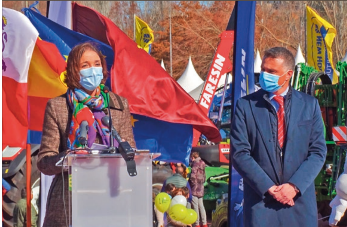
Reyes Maroto conoció los proyectos de futuro de Valencia de Don Juan en su visita a la última edición de la Feria de Febrero.