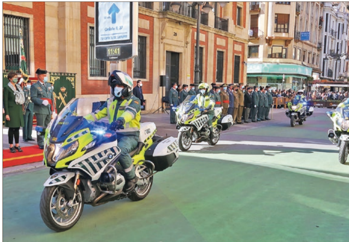
Parada y desfile militar en Ordoño II con motivo del descubrimiento de la placa de la calle Guardia Civil, antigua Capitán Cortés.