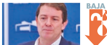
Alfonso Fernández Mañueco