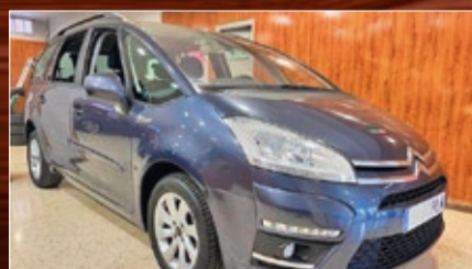
CITROEN GRAND PICASSO 1.6 VTI 120 CV AÑO 2012 • 8.600€