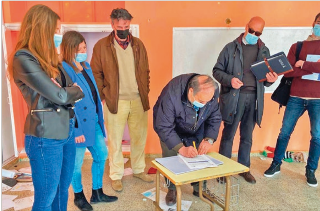
Representantes de la Junta, el Ayuntamiento y la empresa constructora firmaron las actas de inicio de las obras del centro sanitario.