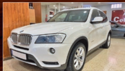
BMW X3 X-DRIVE 30 D AUTO 8VEL. 258 CV CUERO, NAVY, XENON, LED, ETC. AÑO 2011 - 21.900€