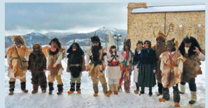
Los personajes del Antruido de Riaño conservan una tradición muy leonesa.