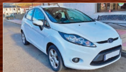
FORD FIESTA 1.25i 82 CV. 5P. Año 2011 • 8.200€