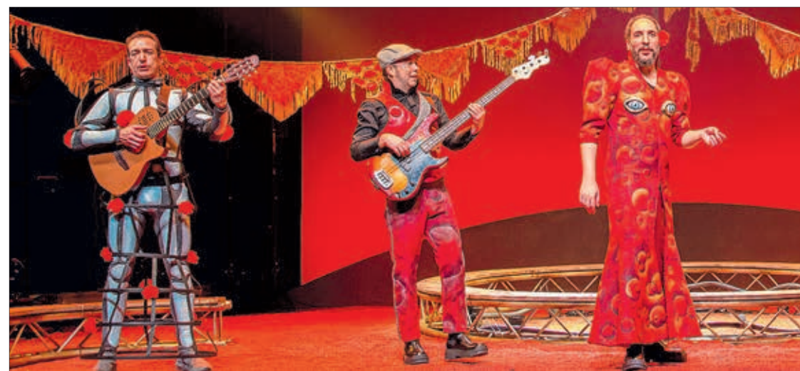
Espectáculo 'Villa y Marte. Sainete cómico-lírico de chulapos mutantes', que se llevará a escena el día 12.