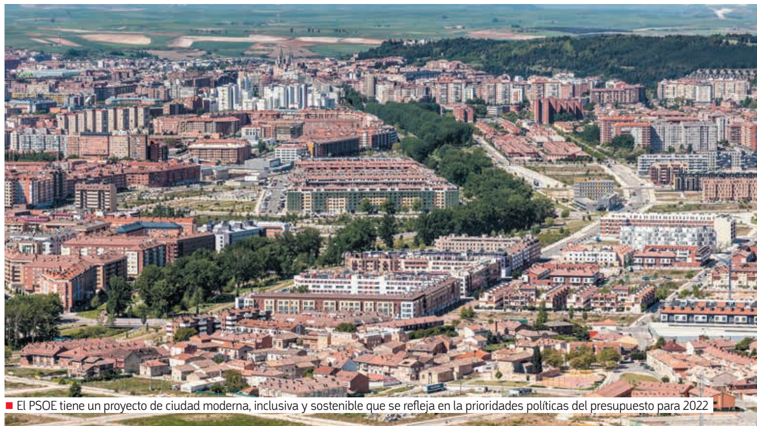
■ El PSOE tiene un proyecto de ciudad moderna, inclusiva y sostenible que se refleja en la prioridades políticas del presupuesto para 2022

Desde el grupo municipal socialista no dudamos en poner a Burgos por delante. Hacemos política útil, cercana y transparente, tendiendo puentes y apostando por el diálogo y el acuerdo, no como quienes utilizan las instituciones con fines partidistas.