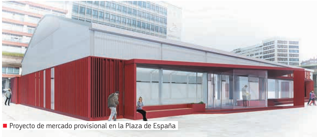
■ Proyecto de mercado provisional en la Plaza de España