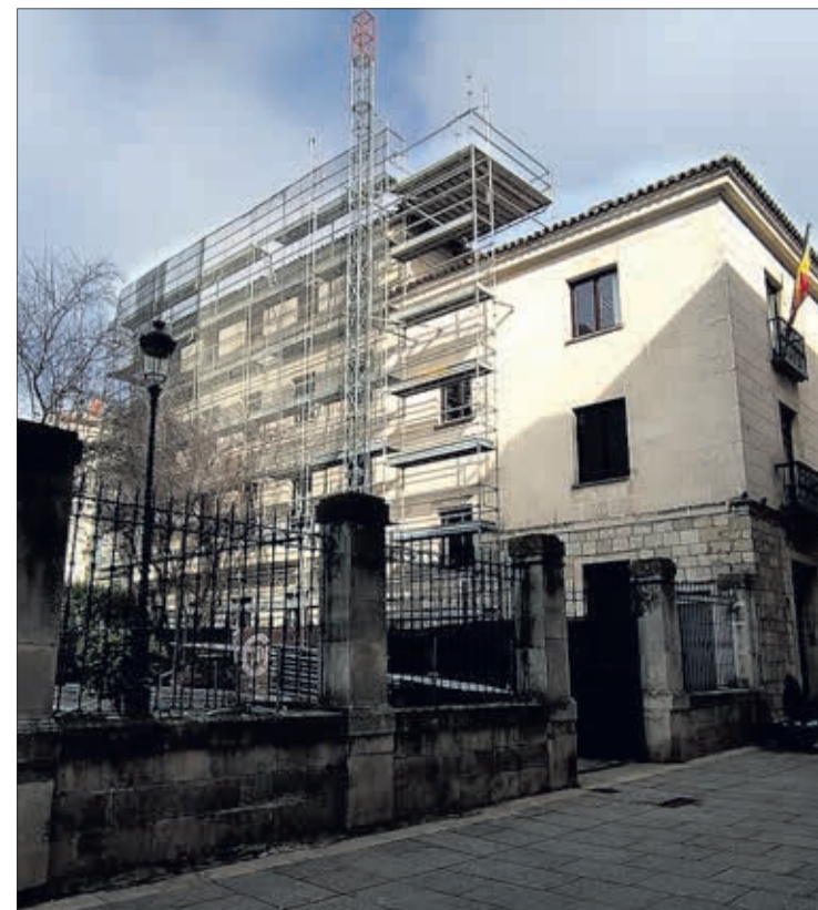
Entre las inversiones en la red de cívicos, destacan las obras en las cubiertas de San Juan.

Con respecto a la gestión económica, la concejala reconoció que el impacto de la crisis "sigue siendo importante". Los ingresos de los cívicos provenientes de las inscripciones en las distintas actividades "siguen sin alcanzar la mitad de los que alcanzaban antes de la pandemia" mientras que el gasto "se asemeja al ordinario. En 2021 el gasto ha sido de 3.259.000 €, muy similar al de 2019, y en 2020, 2.452.000 €. Los ingresos se situaron en 2021