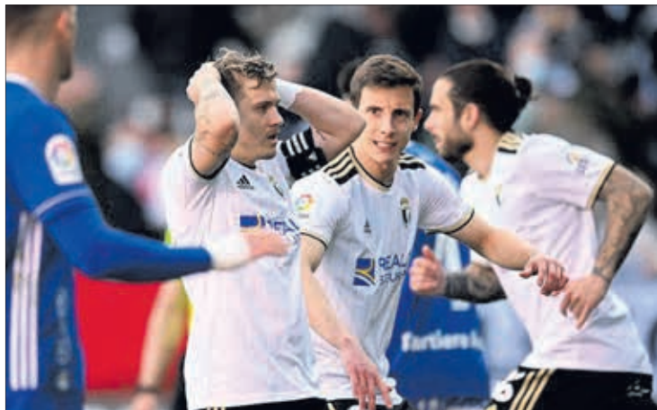
El Burgos CF buscará puntuar en el campo del líder, Ipurua.

El Burgos CF buscará sorprender al líder y sacar algo positivo, sobre todo, después de la derrota de la última jornada en El Plantío ante el Oviedo. Derrota por la mínima en un partido muy disputado. El Eibar, por su parte, llega