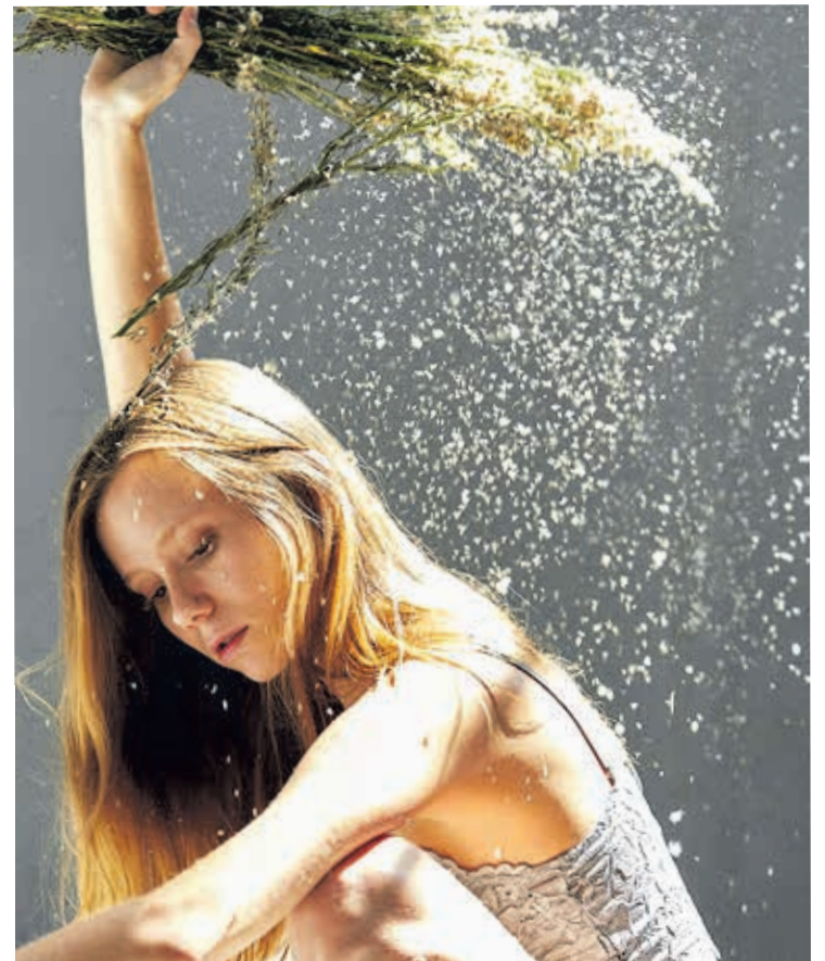
Obra 'Talaré a los hombres de sobre la faz de la tierra', de Pecado de Hybris.

ti', presenta un texto propio que ella interpreta donde se relata el periplo de una vida llena de dificultades siendo mujer.