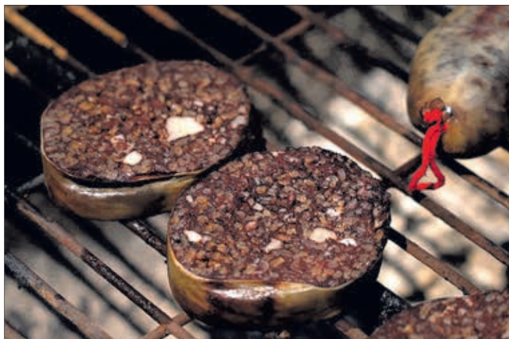
La morcilla de Burgos es un producto con gran valor nutricional, según diversos estudios.

El objetivo principal es dar a conocer que la Morcilla de Burgos es Indicación Geográfica Protegida. El producto tiene más de mil años de antigüedad y los propios elaboradores lo han sabido posicionar en los mercados nacionales e internacionales. Todo, después de décadas de duro trabajo para conseguir la IGP para uno de los productos más representativos de la provincia burgalesa y de la