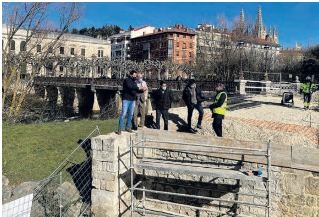
Visita del alcalde y el edil de Obras a la intervención del puente Besson, el miércoles 23.