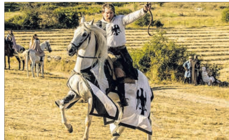
La Batalla de Atapuerca ha desarrollado de forma ininterrumpida XXVI ediciones.

La Pasión, de Covarrubias, ha sido valorada por la Comisión por contar con un montaje original, pues se trata de representaciones estáticas de once pasos de la Pasión de Jesucristo.