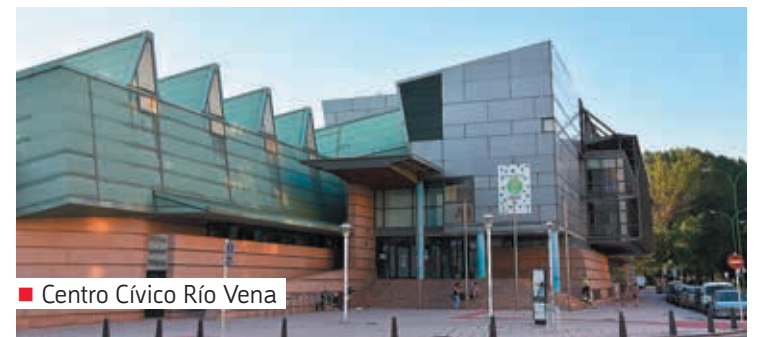
■ Centro Cívico Río Vena