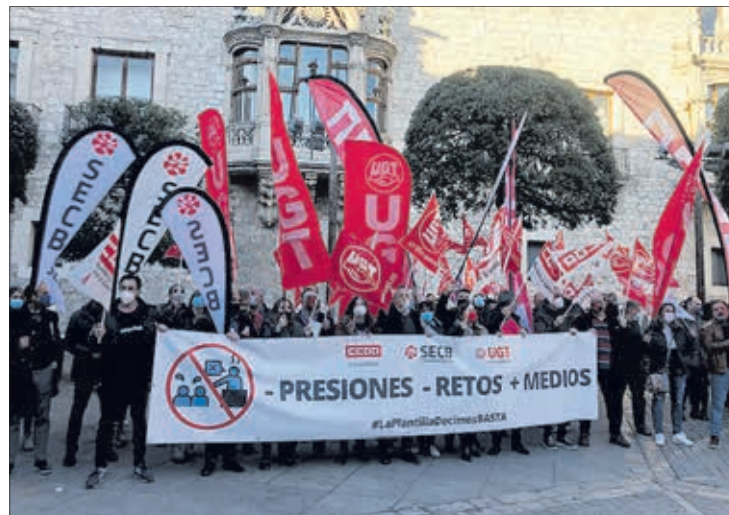
Concentración en la Plaza del Cordón, el martes 22.

En esta línea, explicó que debido al cierre de oficinas y el ERE, la plantilla sufre falta de recursos y se están “alargando las jornadas laborales de forma reiterada todos los días”, lo que dificulta la conciliación. Así, defendió que están luchando por unas “condiciones