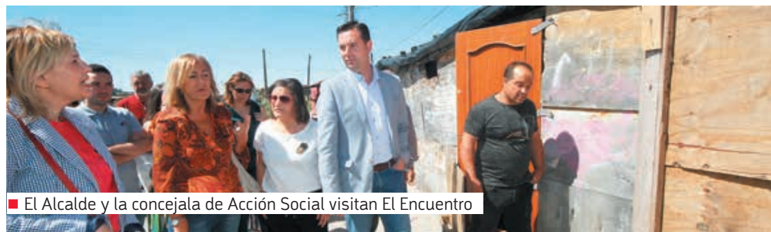
■ El Alcalde y la concejala de Acción Social visitan El Encuentro

Nuestro compromiso con el gobierno abierto supone más transparencia, más colaboración y más participación. Es por esto que, como ya comprometimos en el presupuesto 2021, en este ejercicio los vecinos y vecinas de Burgos tendrán la capacidad de decidir sobre 2,03 millones en inversiones para sus barrios a través de los distritos.