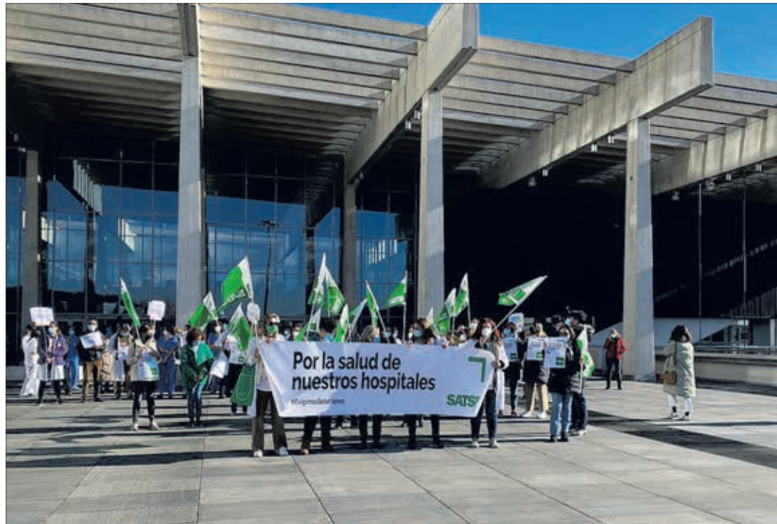
Concentración de sanitarios el martes 22 en la entrada principal del HUBU convocados por SATSE.

En las concentraciones se ha denunciado que no hay ni recursos, ni medios ni profesionales suficientes en los cerca de 350 hospitales públicos que hay en España, tres en la provincia de Burgos, “lo que genera numerosos problemas y deficiencias que impiden poder ofrecer una aten-