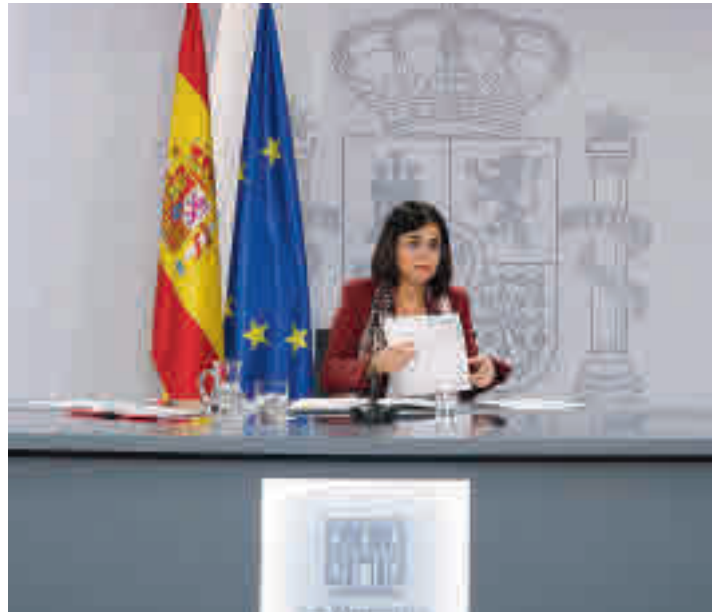
Comparecencia de Carolina Darias

El Gobierno central y las comunidades autónomas se reunirán el próximo jueves para decidir el camino a seguir • La idea es controlar la covid-19 como a una infección similar a la gripe