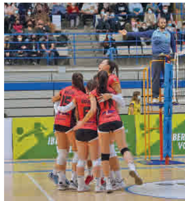
Doble cita este fin de semana en el Pabellón Europa

Precisamente esa circunstancia ha hecho que se aplaque el CSKA-Real Madrid fijado inicialmente para este viernes 4, lo que deja a Pablo Laso y sus jugadores más margen para preparar el choque liguero que tendrá lugar este domingo 6 (18:30 horas) en el WiZink Center. Enfrente estará el Bitci Baskonia, séptimo clasificado, que está firmando un año irregular como demuestra el hecho de que se quedara fuera de la Copa.