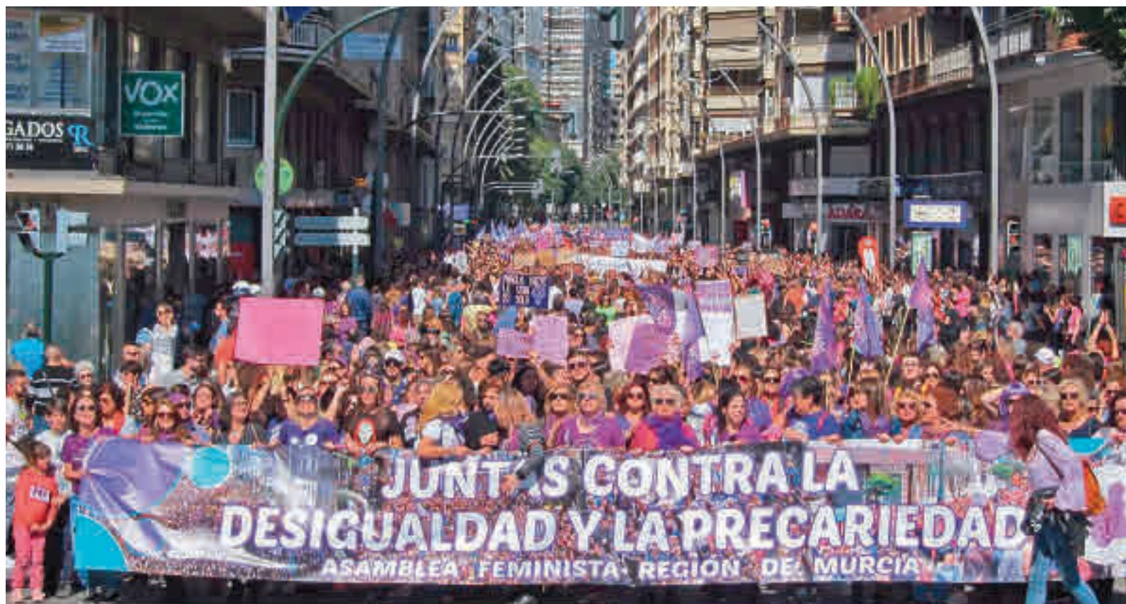
Celebración del 8-M del año 2020