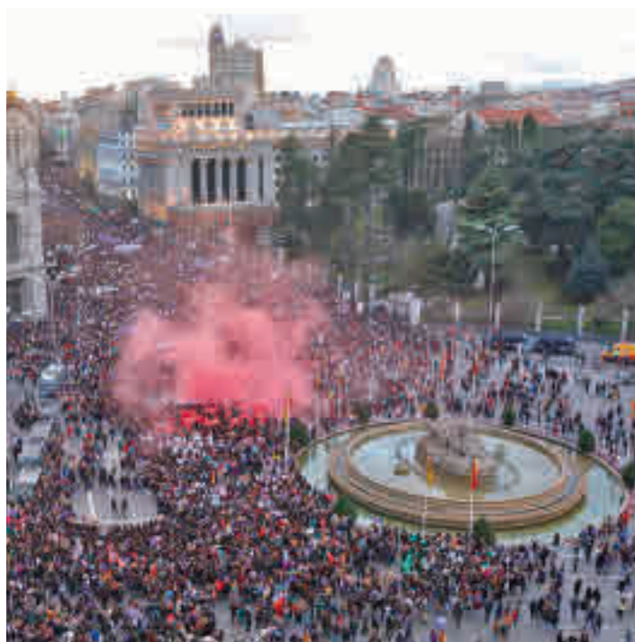
Vuelta a las calles: La celebración del 8 de marzo del año 2020 estuvo marcada por la presencia del coronavirus, ya que tuvo lugar solo una semana antes del confinamiento. El año pasado se tuvo que suspender, mientras que en la edición de este año las mujeres volverán a las calles.