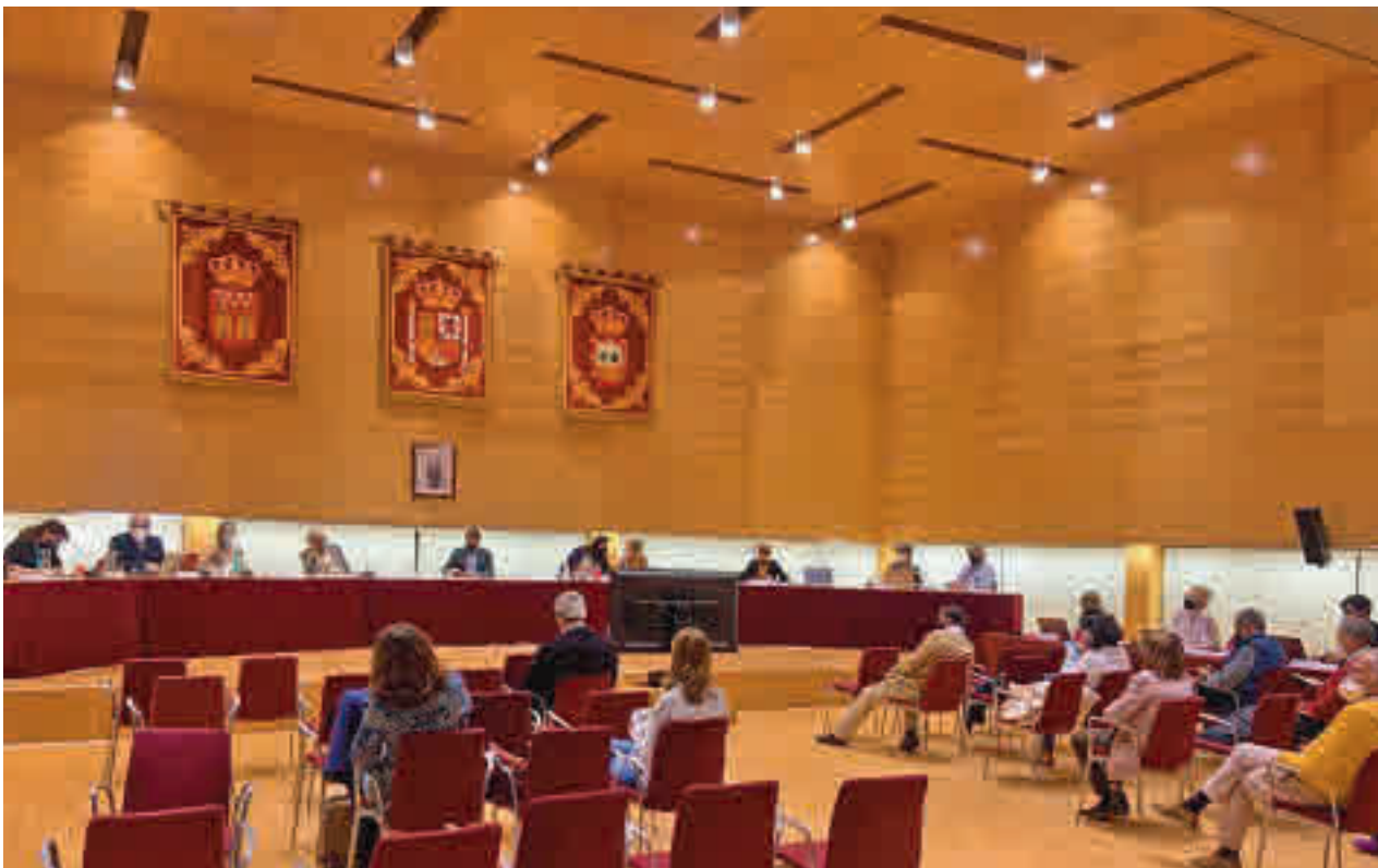
Un momento del pleno celebrado la semana pasada