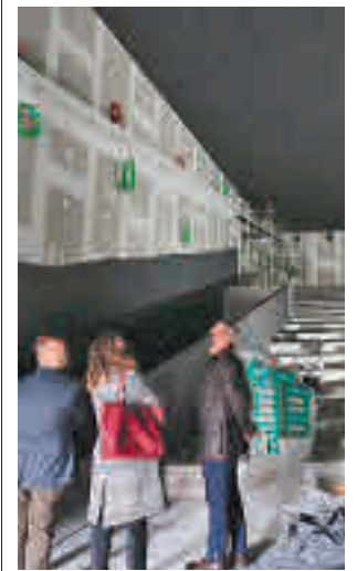
Visita a las obras

Toda la información del Corredor, en nuestra página web