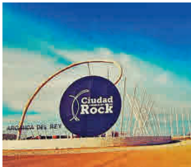
A Summer Story: La Ciudad del Rock tan sólo acoge un evento al año. Se trata del festival A Summer Story y que este año se celebra el 17 y 18 de junio. El aforo suele rondar las 40.000 personas, menos de la mitad de lo que acogía Rock in Rio.

ran con dejar Barcelona si no se les garantizaba un formato de semana consecutivos para contrarrestar las pérdidas económicas producidas por la pandemia de covid.