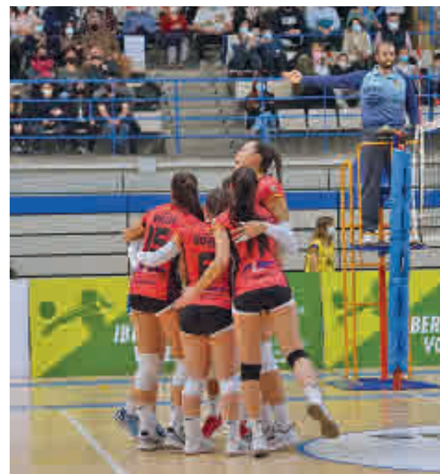
Doble cita este fin de semana en el Pabellón Europa

Precisamente esa circunstancia ha hecho que se aplaque el CSKA-Real Madrid fijado inicialmente para este viernes 4, lo que deja a Pablo Laso y sus jugadores más margen para preparar el choque liguero que tendrá lugar este domingo 6 (18:30 horas) en el WiZink Center. Enfrente estará el Bitci Baskonia, séptimo clasificado, que está firmando un año irregular como demuestra el hecho de que se quedara fuera de la Copa.