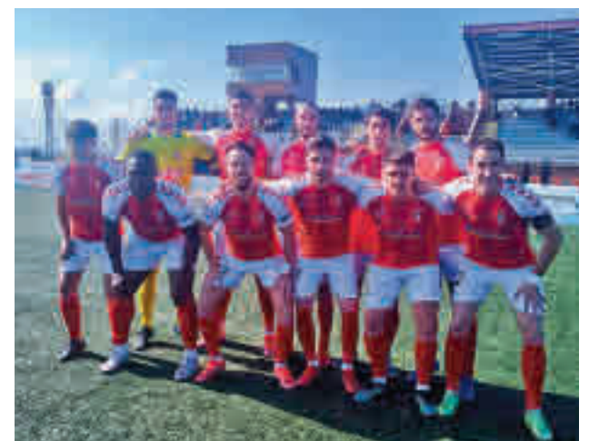
El partido entre Las Rozas y el Alcalá fue muy polémico

También se van clarificando las cosas en la zona baja, donde este domingo (11:30 horas) tendrá lugar un Villaverde San Andrés-AD Parla que puede catapultar a los visitantes o servir a los locales para seguir creyendo en la permanencia.