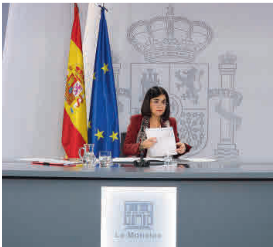
Comparecencia de Carolina Darias

Entre el 15,4% de los encuestados que no han modificado sus hábitos de consumo, se ve una clara preponderancia de los hombres (20,5%) frente a las mujeres (10,6%), y de mayores de 65 años (22%) en comparación a los jóvenes de entre 18 y 34 años (8,5%). Casi 7 de cada 10 (69,1%) responsables del pago de suministros han afirmado que son "más conscientes" del consumo energético total a raíz de la situación económica.