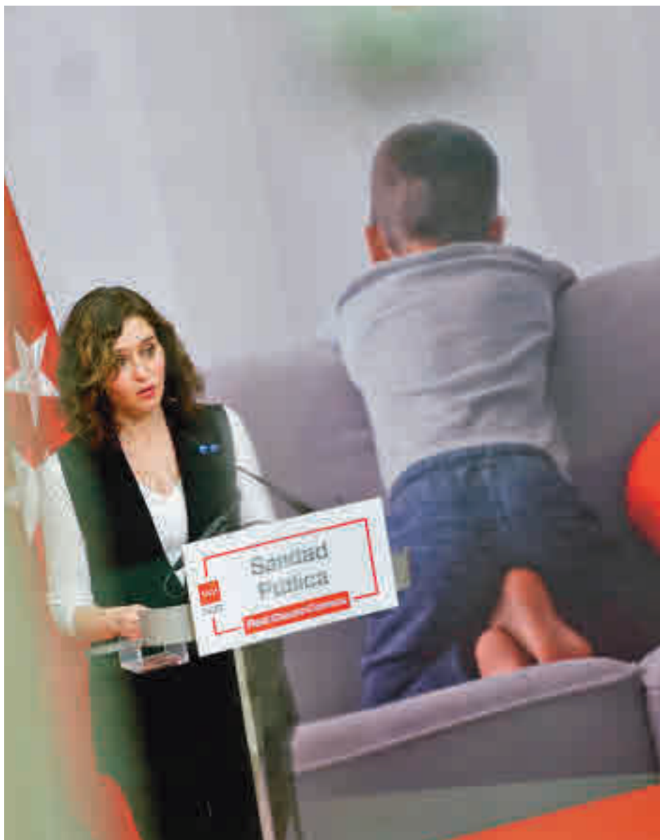
Isabel Díaz Ayuso, durante la presentación del plan

En cuanto a la atención específica en Salud Mental a los profesionales sanitarios, en el plan se recoge el refuerzo de la Unidad de Valoración y Orientación del Profesional Sanitario Enfermo, denominado programa PAIPSE. "No nos vamos a olvidar de ayudar a los que cuidan, y me refiero a todos los profesionales que han vivido momentos muy difíciles a lo largo de estos dos años de pandemia", señaló Isabel Díaz Ayuso durante su intervención del lunes.