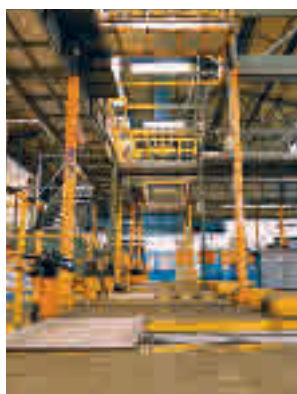
El centro de La Elipa

Las cocheras volverán a abrir sus puertas en el futuro para operar con una flota de autobuses completamente eléctrica. Con un presupues-