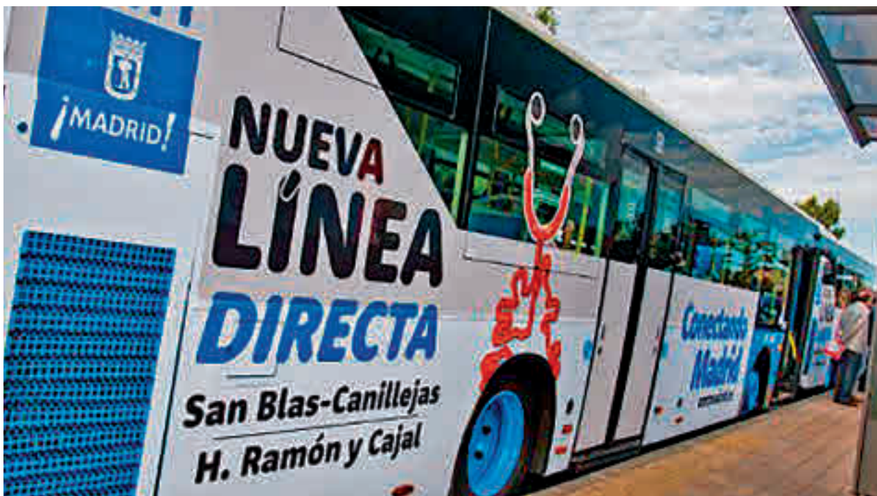
Uno de los autobuses, en la cabecera de la Plaza de Alsacia