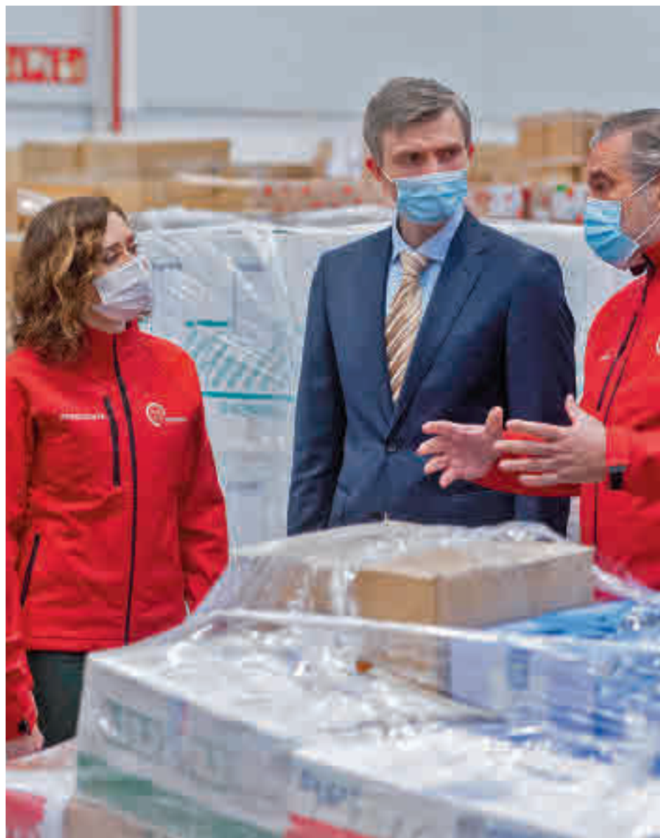
Díaz Ayuso visitó en almacén del Isabel Zendal

El alcalde de Madrid, José Luis Martínez-Almeida, anunció este lunes que el espacio público frente a la Embajada de Ucrania de la capital llevará el nombre del presidente ucraniano, Volodimir Zelenski, a quien denominó como "faro de la libertad". Se trata de la plazuela en la que confluyen Ronda de Sobradiel, Ronda Abubilla y avenida de Champagnat. "Es necesario homenajear a aquellos que están defendiendo la libertad y democracia en el mundo", añadió.