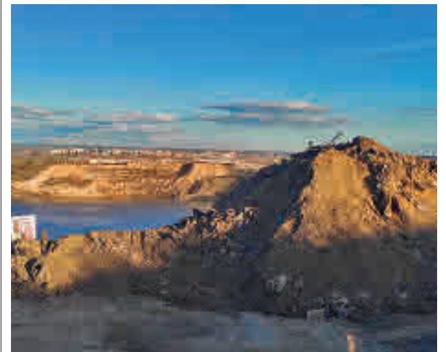
La montaña de tierra, junto a las Lagunas AMAE-SBC

"Esta actuación se llevó a cabo por una orden de la Comunidad. Resulta muy sorprendente que la Dirección General de Biodiversidad no tuviese constancia de esta colonia de aves. También sorprende que no haya existido ningún tipo de coordinación para que la ejecución de estos trabajos se hiciese sin amenazas para la flora y fauna del lugar. Tampoco parece que haya habido contactos ni con el Seprona ni con la Policía Municipal", critican.