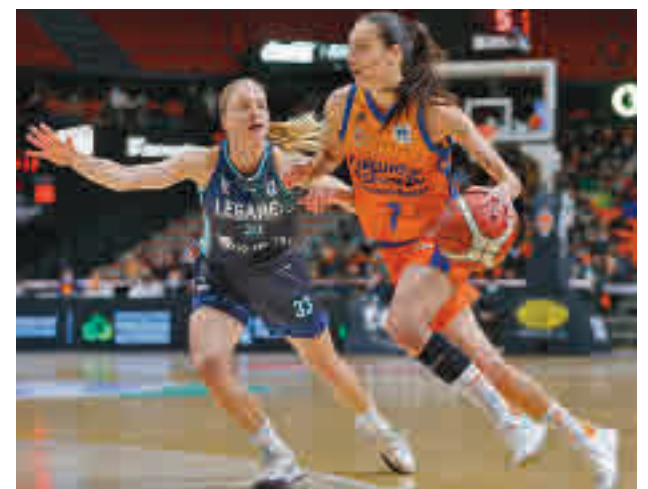
El Leganés no pudo con el Valencia FEB