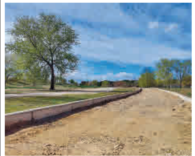
Una de las sendas de la zona verde carabanchelera