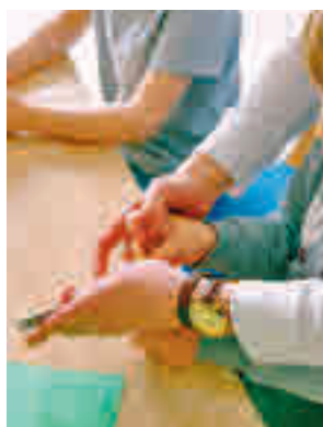
Habrán actividades de ocio

La inscripción gratuita podrá realizarse de manera online o por teléfono en el 917 791 286 hasta 17 de marzo.