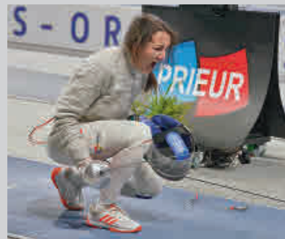
La madrileña compete en la disciplina de sable

La jornada 21 de la Parlem OK Liga de hockey patines depara una complicada visita este sábado (18 horas) para el CP Alcobendas, que se medirá con un Barça que es líder con una única derrota.