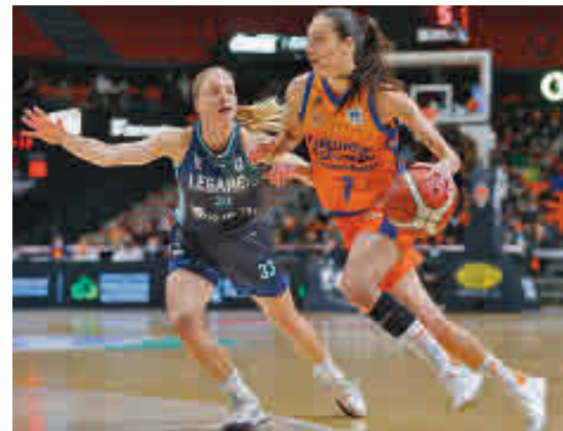
El Leganés no pudo con el Valencia FEB