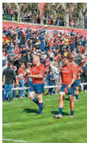
Nueva cita en Madrid

13 de marzo (12:45 horas) se viva otra bonita mañana de rugby, con la selección española jugando un choque claro en la clasificación para el