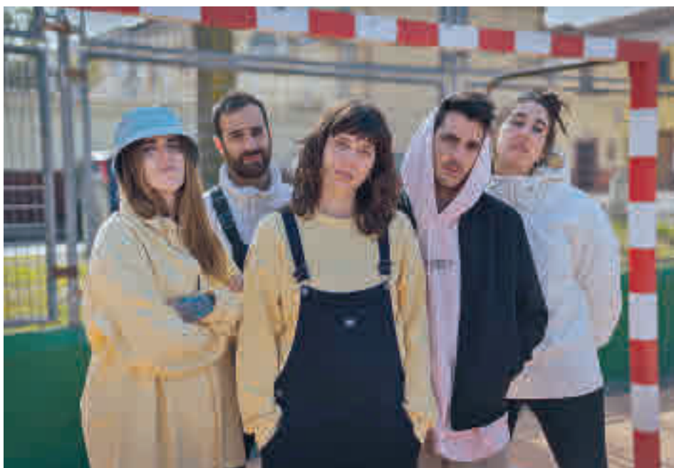
La banda madrileña ha iniciado una nueva gira LA PUREZZA DEL QUARTIERE

» MIRA Teatro. Sábado 12, 19:30 horas. Precio: 30 euros.