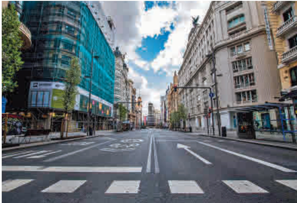
Madrid es uno de los principales destinos turísticos

La plataforma de reservas ha registrado una tendencia positiva de recuperación en el