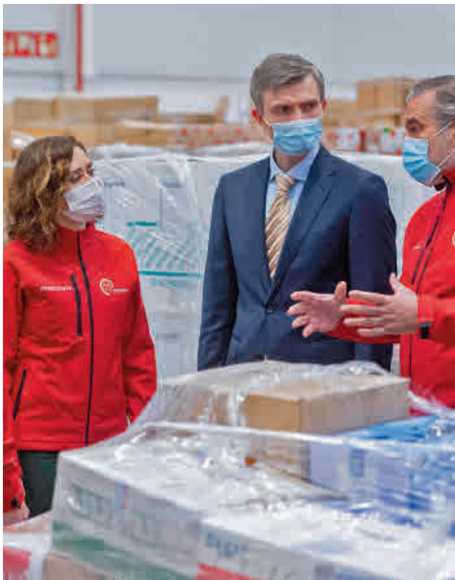
Díaz Ayuso visitó en almacén del Isabel Zendal

Pozuelo de Alarcón albergará uno de los tres centros de acogida de refugiados que el Gobierno central habilitará para recibir a las personas que lleguen desde Ucrania huyendo de la invasión de Rusia. Los otros dos estarán en Bar-