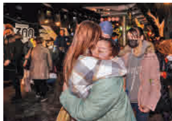
Refugiados llegando a España

El mecanismo en el que trabaja el Ministerio será similar al desarrollado en el caso de Afganistán. "Tendremos un centro de recepción donde haremos todo el proceso documental, una primera entrevista para conocer sus necesidades y esa primera intervención con ellos nos permitirá derivarlos hacia los recursos más apropiados", apuntó el ministro Escrivá.