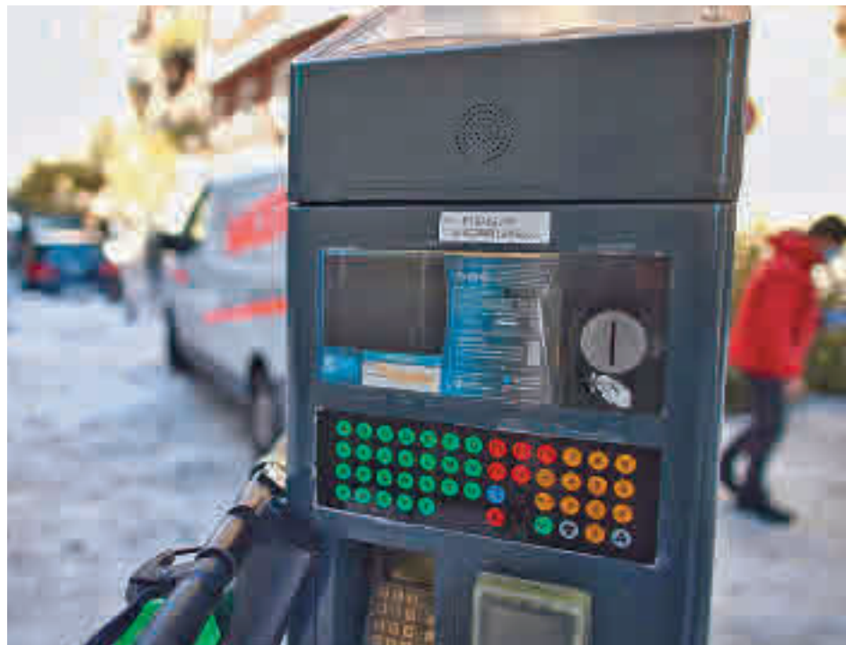
El SER pretende solucionar los problemas de aparcamiento de los residentes de estos barrios

Toda la actualidad de los distritos de Madrid, en nuestra web