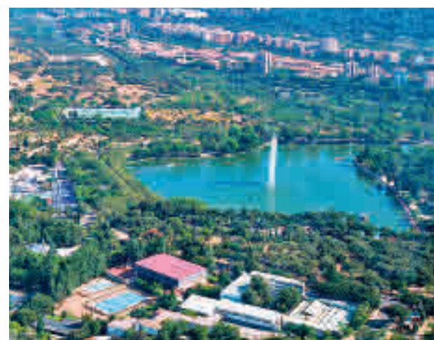
La Casa de Campo es el mayor pulmón verde la capital

La especie que peor salió parada fue el pino, con hasta 100.000 ejemplares en la Casa de Campo afectados. Por su parte, en el parque de El Retiro, el porcentaje de arbolado dañado se elevó hasta el 68% (alrededor de 32.500 ár-