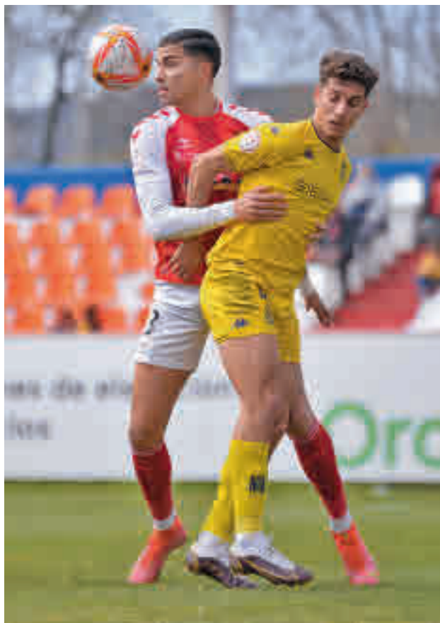
Alcalá y Alcorcón B empataron en un vibrante duelo (2-2)

ESTE SÁBADO HAY DOS DUELOS DIRECTOS POR ENTRAR EN LOS PUESTOS ALTOS