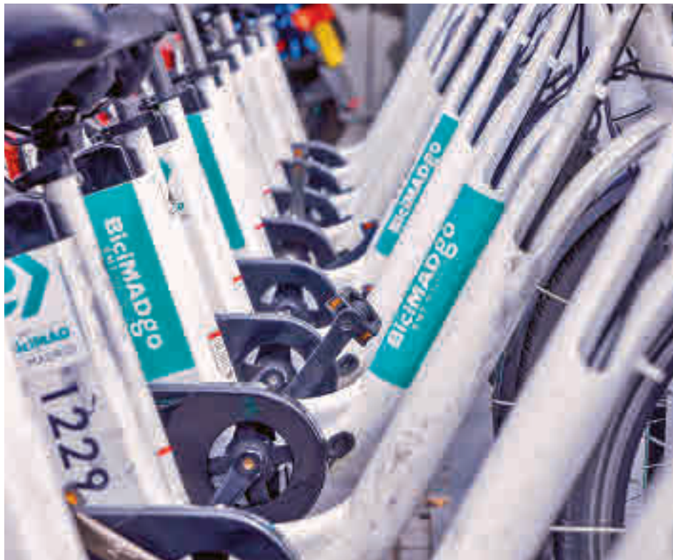
Una de las bases del servicio municipal de alquiler de bicicletas en la capital

El nuevo BiciMAD incluirá, además, nuevas funcionalidades que se irán desplegando de forma paulatina. Una de ellas será el desarrollo de estaciones virtuales para dar cobertura a eventos