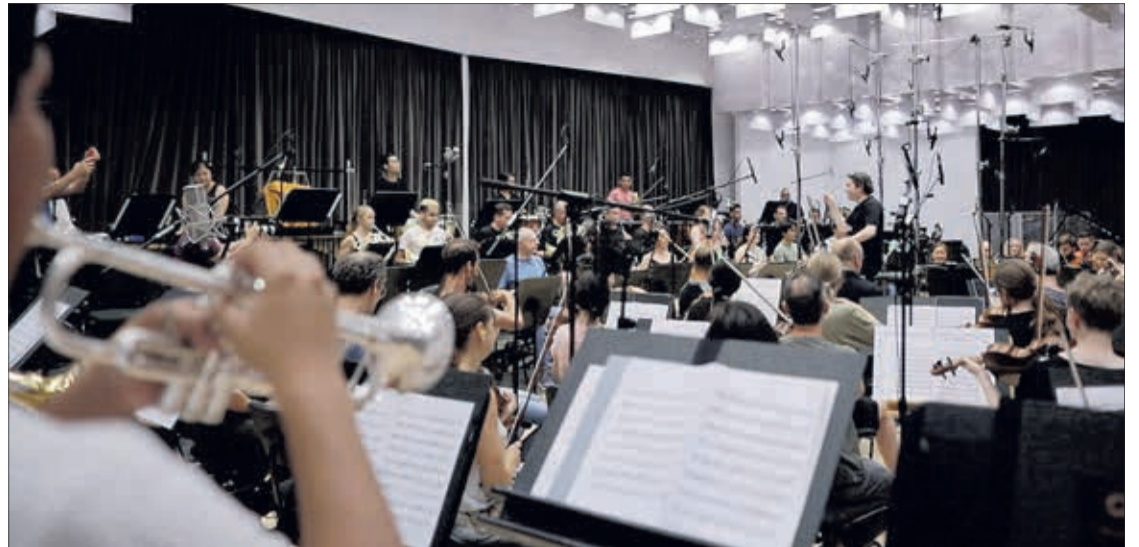
Hay más de 250 personas involucradas en el proyecto.

Se trata de una experiencia inmersiva que tiene una duración aproximada de cuarenta minutos, repartida en dos tiempos, y que comienza con la proyección de una película panorámica para seguir con un salto a la realidad virtual que permite un visionado en 360 grados de la Mahler Chamber Orchestra,