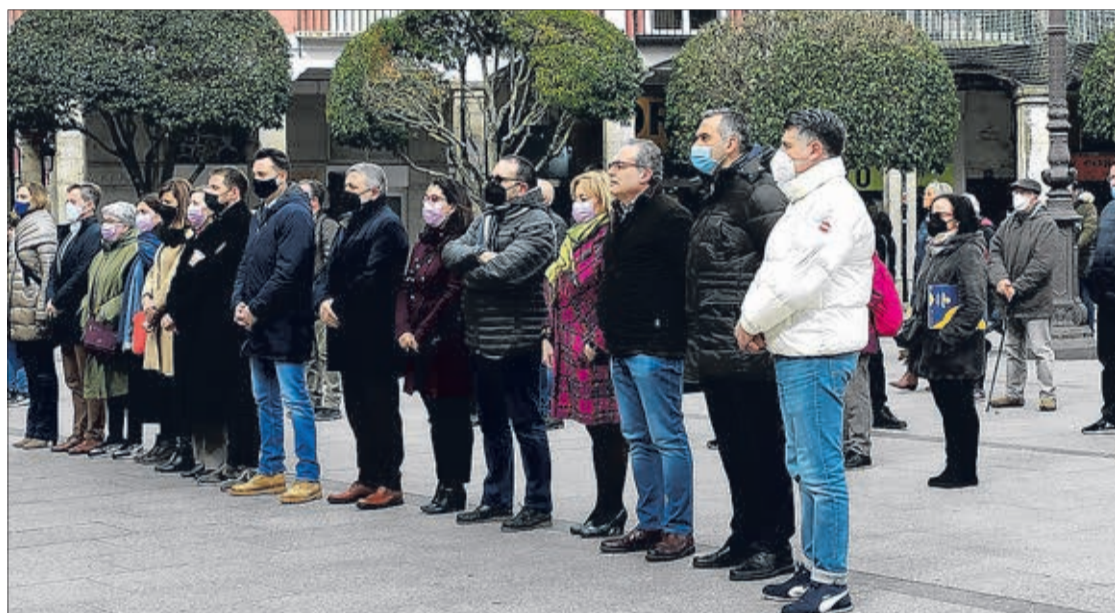
El Ayuntamiento de Burgos se sumó a la convocatoria de la FEMP para que los Gobiernos Locales guardaran cinco minutos de silencio el miércoles 9 en solidaridad con Ucrania. En la imagen, el alcalde y corporativos de los grupos municipales.

Debido al “enorme problema logístico”, “al colapso en los corredores humanitarios” y “al conflicto en la canalización, recepción, transporte y distribución de materiales, enseres y alimentos en las zonas fronterizas con Ucrania”, De la Rosa señaló que “lo que se está pidiendo” por parte de las autoridades competentes y de las tres organizaciones que forman parte del sistema de acogida nacional, que en Burgos son Burgos Acoge, Cruz Roja Española y ACCEM”, es que