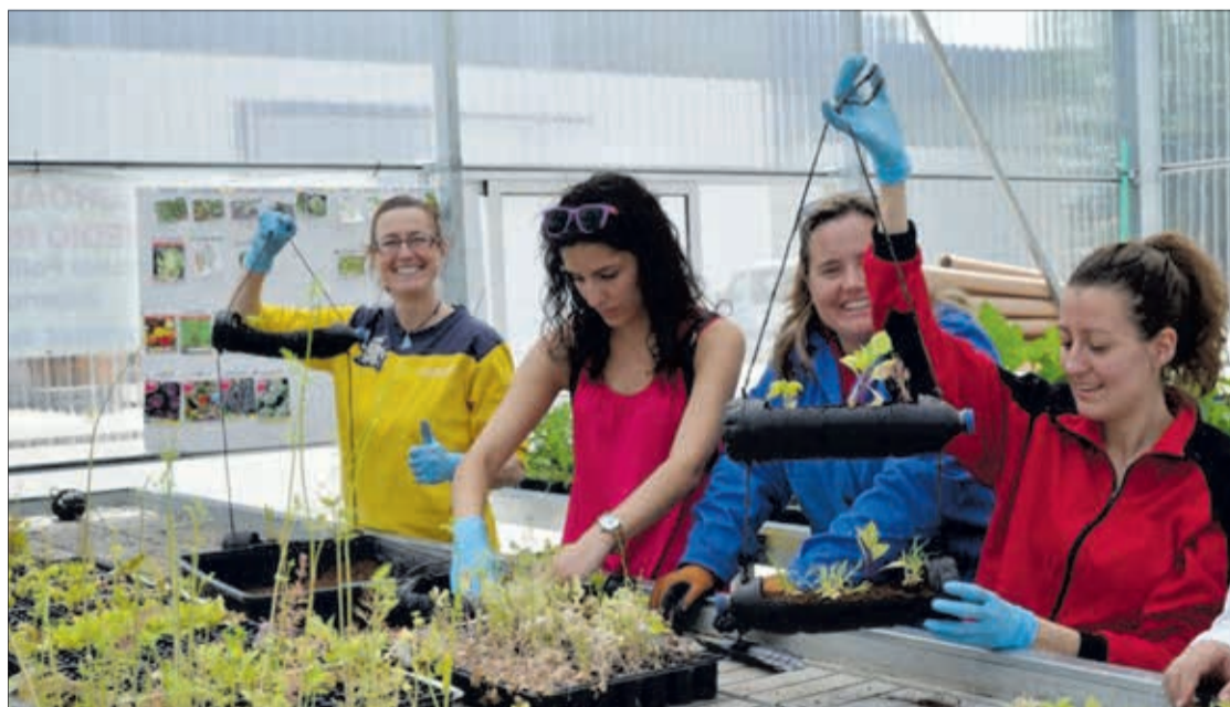
Ejemplo de una de las actividades orientadas a la lucha contra el cambio climático.

Actividades gratuitas en marzo y abril abiertas a todo el público interesado