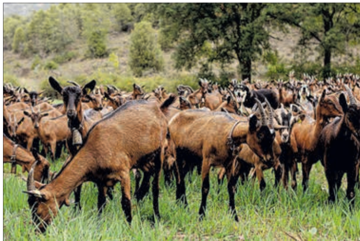
Pasear con cabras en Santa Gadea es una de las propuestas de ‘Burgos Emociona’.

A través de una página web, ‘Burgos Emociona’ da cabida a los productos de diferentes empresas asentadas en la provincia y ofrece una amplia gama de planes de ocio para el disfrute de los turistas, a quienes piden que cuenten cómo lo han pasado y dónde han estado. Con esta iniciativa, señaló el presidente, “se dan a conocer productos que seguramente, si no están en el mundo digital, nadie los conoce y a nadie les llaman la atención”. Al mismo tiempo, Rico se mostró “seguro” de que el proyecto crecerá de la mano de otros, como ‘Burgos Alimenta’, que aglu-