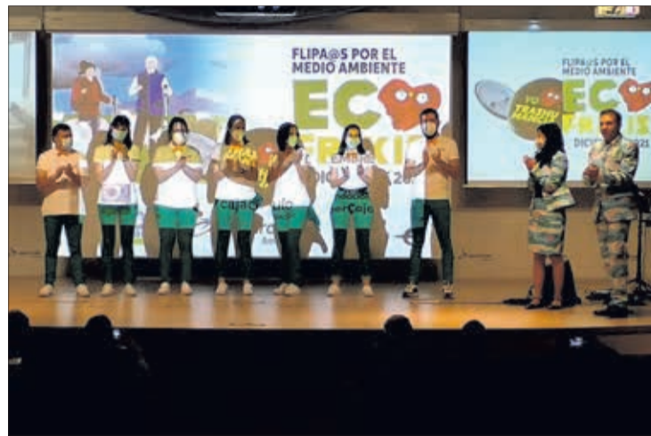
Imagen de archivo de anteriores ediciones de Ecofrikis.

El jueves 10 tuvo lugar la actividad 'Conversando con Félix', en la Escuela Politécnica, con la participación de Odile Rodríguez de la Fuente y Rosalía Santaola-