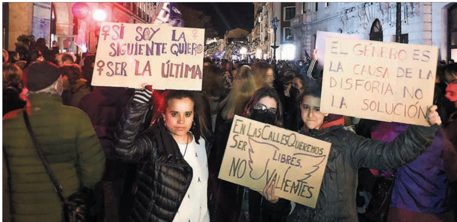
La manifestación del 8M comenzó a las 20.00 horas en la Plaza del Cid.

8M / DÍA INTERNACIONAL DE LA MUJER | “El feminismo es abolicionista”, pues la prostitución es la “máxima expresión de la violencia sexual que sufren las mujeres”