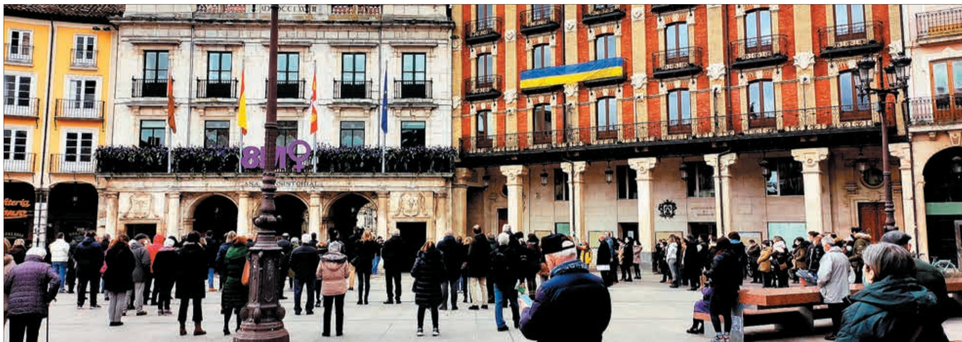
La concentración convocada por la Federación Española de Municipios y Provincias (FEMP) reunió el día 9 a decenas de burgaleses en la Plaza Mayor para mostrar su rechazo a la invasión de Ucrania por Rusia.