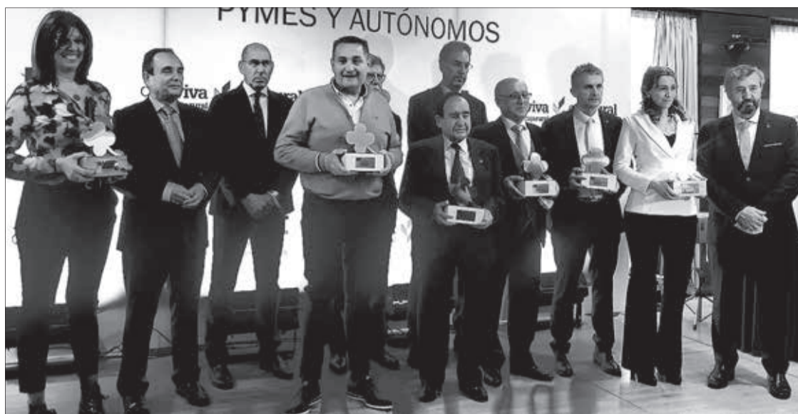
Foto de familia de todos los premiados, en el Hotel Abba, el jueves 10.