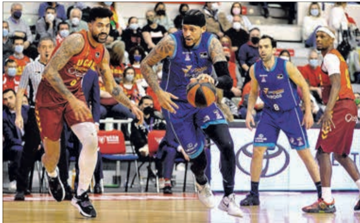
El San Pablo Burgos llega al Coliseum tras ganar al UCAM Murcia.

El conjunto burgalés llega al duelo tras lograr una merecida victoria, la tercera consecutiva, en la pista del UCAM Murcia y con el 83-89 obtenido en la capital del Segura sale de los puestos de descenso. Ahora el San Pablo es decimocuarto con 7 triunfos y 14 derrotas, mientras que el cuadro murciano continúa en la octava posición con 11 victorias.