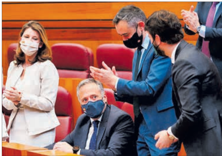
Imagen de la sesión de constitución de la Mesa de las Cortes de CyL.

El pacto de gobernabilidad en Castilla y León incluye once ejes de gobierno y un total de 32 acciones. La primera de esas 32 acciones recoge la aprobación de una ley de Desarrollo y Competitividad Rural, con un apoyo al medio rural,