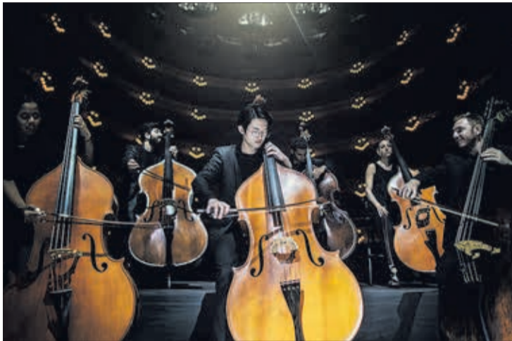
La iniciativa ofrece nuevas perspectivas de una orquesta sinfónica y sus instrumentistas.

dirigida por Dudamel, y grabada en el Gran Teatro del Liceo de Barcelona. El proyecto Symphony es una experiencia de tipo pedagógico, cultural y lúdico pensada para todos los públicos a partir de los 8 años, que no incluye movimiento físico por parte del usuario, ya que su objetivo principal es fomentar la escucha de la música.