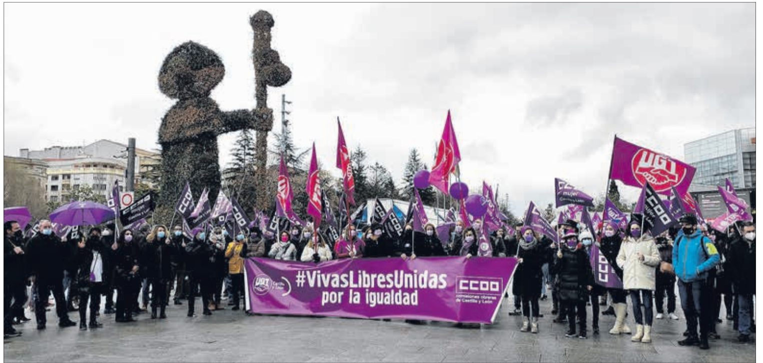
La concentración convocada por CCOO y UGT en el Día Internacional de la Mujer tuvo lugar en el Paseo de Atapuerca.