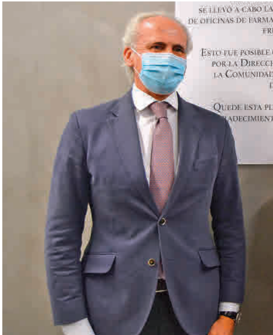
Ruiz Escudero, durante su visita al Colegio de Farmacéuticos

El consejero lamentó que este tema no estuviera sobre la mesa en la reunión del Consejo Interterritorial de este miércoles, en el que estaban representadas las comunidades autónomas y el Ministerio. "La frase de la ministra Carolina Darias siempre es