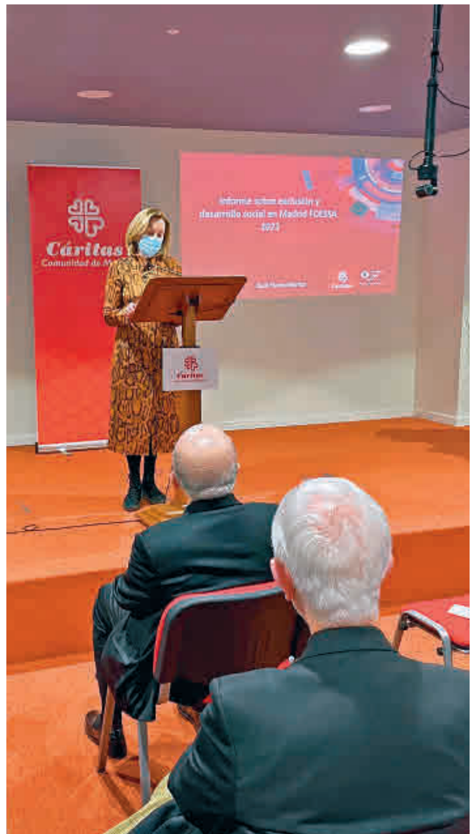
Presentación del informe

Respecto al factor de la salud, el problema más relevante que cita el informe es la falta de acceso a medicación o tratamientos a causa de problemas económicos, con el 11% de los hogares afectados, casi 300.000, que han dejado de comprar medicinas, prótesis, seguir tratamientos o dietas por problemas económicos. También destaca la tasa de exclusión entre las personas que padecen una enfermedad mental, con un 14% de familias madrileñas con algún miembro al que se le ha diagnosticado algún trastorno de este tipo, y que supera en 10 puntos la del conjunto de la población.