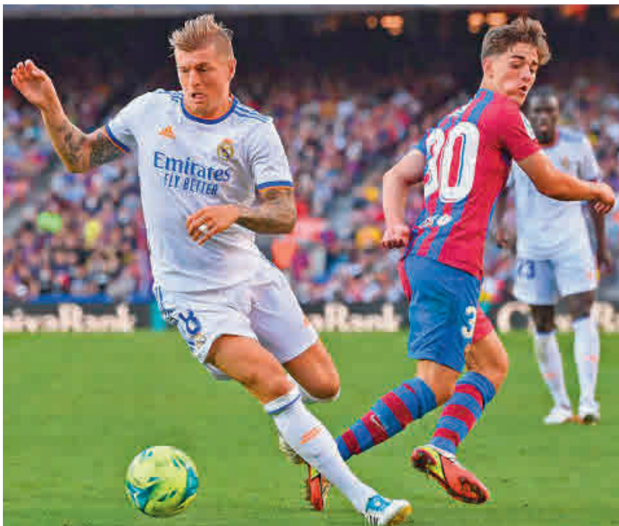
Kroos disputa un balón con Gavi en el partido jugado el pasado 24 de octubre en el Camp Nou

El pasado domingo 13 el Barcelona entonaba el alirón en la Liga Iberdrola tras golear al Real Madrid (5-0). Nueve días después, el equipo blanco tendrá la oportunidad de desquitarse, además, en un escenario diferente y con un premio apetecible. Valdebebas acogerá el martes 22 (21 horas) la ida de los cuartos de final entre los dos representantes españoles. Las jugadoras de Alberto Toril tratarán de buscar un resultado positivo que les permita afrontar con garantías la vuelta del día 30 que se disputará en el Camp Nou.