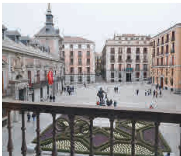
La Plaza de la Villa será una de las paradas obligadas

La edición de este año, que presentó el pasado mié-