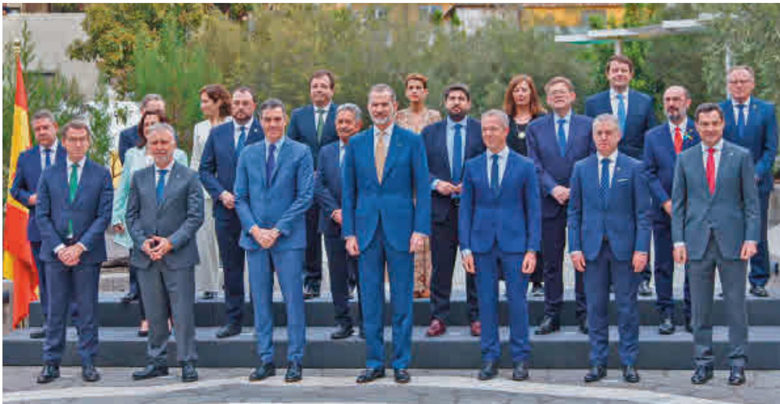
Conferencia de Presidentes celebrada el pasado fin de semana en La Palma