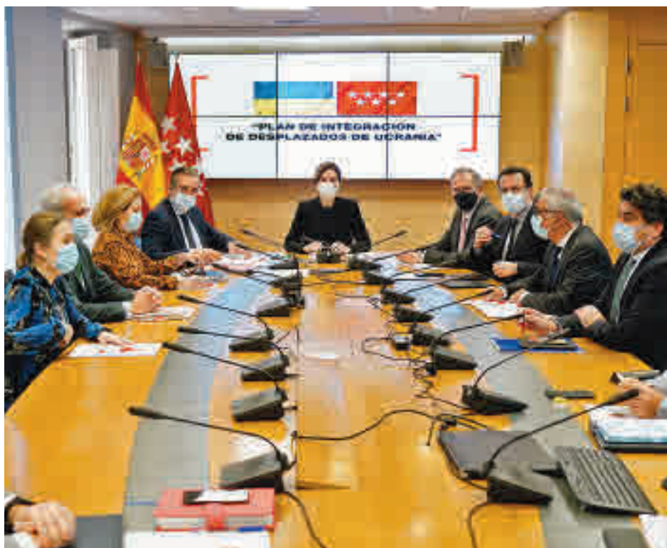
Reunión del comité de crisis de Ucrania

En el plano logístico, y una vez activado el Protocolo de Actuación Inmediata frente a la llegada de refugiados, el Hospital Zendal ha comenzado a operar como epicentro a la hora de canalizar toda la ayuda material y dar respuesta a las iniciativas solidarias de los madrileños. Desde el inicio de la invasión se han tramitado y dado salida hacia la zona fronteriza de Ucrania