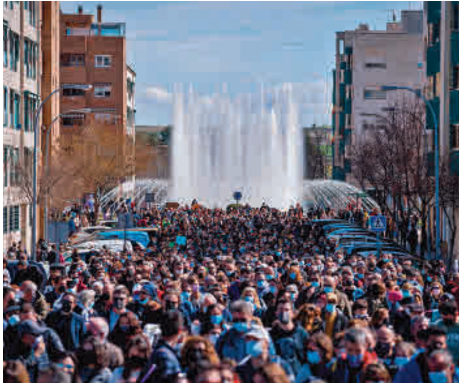
Protesta contra la ampliación del vertedero de Pinto

Tras 36 años albergando el mayor vertedero de toda España, los ciudadanos, que llegaron desde lugares como Parla, Valdemoro, Móstoles, Alcorcón, Fuenlabrada, Leganés o Getafe, protestaron en contra de la construcción de seis nuevas macroplantas, "proceso que se ha iniciado de espaldas a la ciudadanía, sin llevarlo a votación en la asamblea de la Mancomunidad, y con la oposición de sus vicepresidentes que, o bien se han posicionado públicamente en contra o bien han