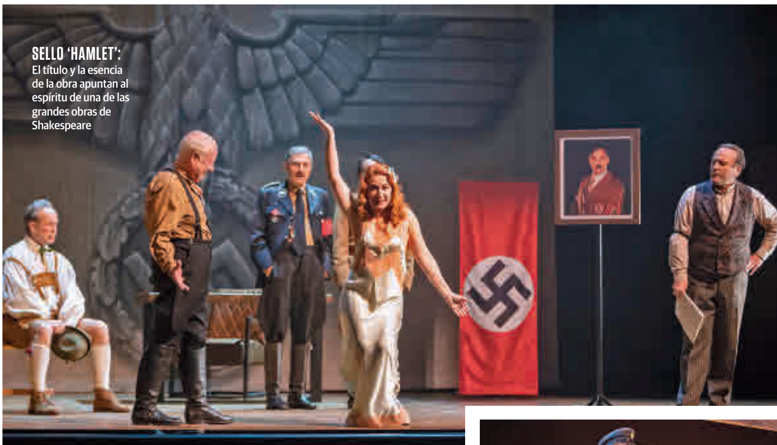
SELLO 'HAMLET': El título y la esencia de la obra apuntan al espíritu de una de las grandes obras de Shakespeare

“EL SENTIDO DEL HUMOR ES NECESARIO PARA OXIGENAR CEREBRO Y ALMA”