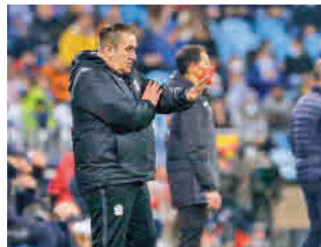
El técnico de Humanes debutó con derrota

Un poco más tarde, a las 18:15, el Leganés recibirá en Butarque al Sporting, con el objetivo de distanciarse de manera casi definitiva de la zona de peligro y, por qué no, soñar con el 'play-off'.