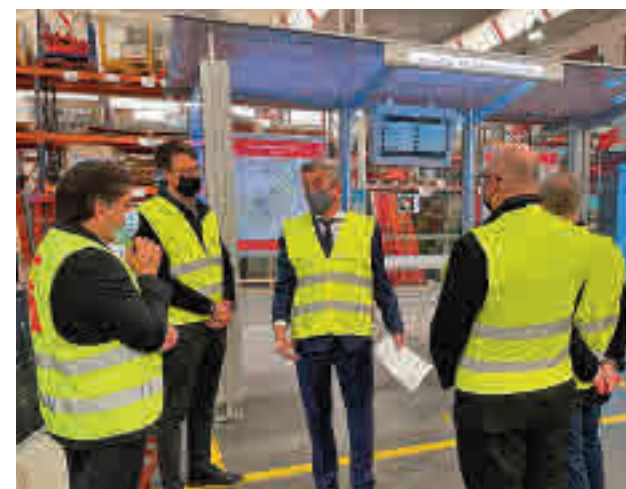
Visita a la fábrica de las marquesinas

Por otro lado, la Comunidad de Madrid continuará con la implantación del sistema de información NaviLens, una tecnología que interactúa de manera sencilla con el smartphone de los usuarios, y que supone una mejora en términos de accesibilidad para personas con visibilidad reducida e invidentes. Es un sistema de señalización pionero que funciona mediante una aplicación gratuita.