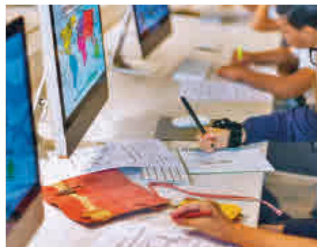
Aula de un colegio de la Comunidad

Como complemento, está prevista otra partida de 2 millones en cursos para instruir a los maestros y profesores en el manejo eficiente de los dispositivos. De manera paralela, se dedicarán otros 85 millones para completar la digi-