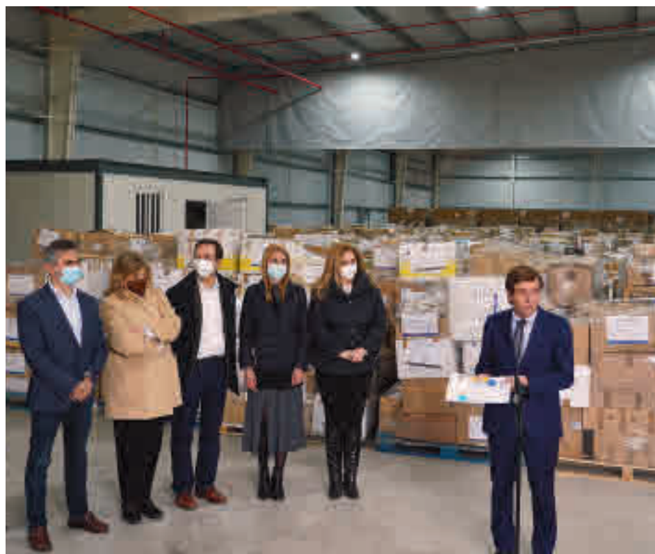
Un momento de la intervención del alcalde, José Luis Martínez-Almeida

El mencionado espacio está siendo utilizado por el Consistorio para centralizar la recogida de material puesta en marcha el pasado 9 de