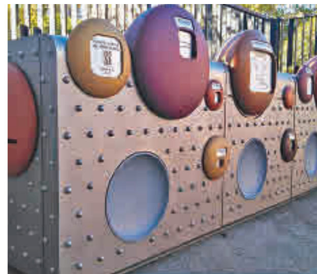
Punto limpio de proximidad AYTO. MADRID

En estos contenedores se pueden depositar hasta 12