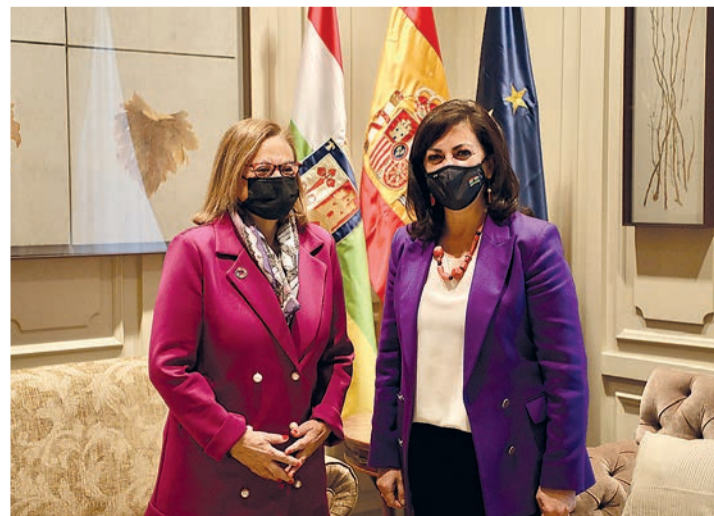
Gallach y Andreu, durante la recepción oficial en el Palacio del Gobierno.

nal, Concha Andreu, y estuvo en la Fundación Dialnet, que colaborará con la iniciativa con ciencia en español, y en los monasterios de Yuso y Suso en San Millán de la Cogolla, patrimonio de la humanidad y las joyas del Valle de la Lengua, que tendrán una financiación para el ámbito turístico de 3,8 millones procedentes de los fondos europeos.