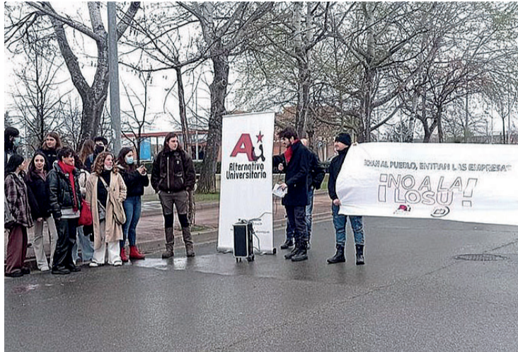
La concentración de estudiantes en el campus de la Universidad de La Rioja.

Respecto a la Ley Orgánica de Ordenación e Integración de la Formación Profesional dicen que "generaliza, a través de la modalidad dual, la disposición por parte de las empresas de mano de obra estudiantil infrarremunerada". Sobre el ámbito universitario, "tanto la Ley Orgánica del Sis-