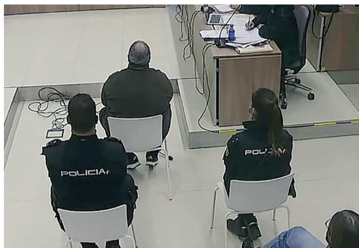
El juicio celebrado en la Audiencia de Logroño contra el parricida de Nájera.

El fallo relata cómo el Tribunal del Jurado, tras apreciar en conciencia las pruebas practicadas en