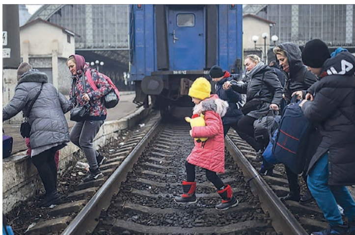
Refugiados ucranianos huyen de su país a través del tren.

Además, el Consejo declaró Proyecto de Interés Estratégico Regional (PIER) la inversión de la empresa Royo Operador Logístico para la creación de un Centro Intermodal en el polígono industrial El Sequero de Agoncillo, que tendrá impacto en la Ciudad del Envase y el Embalaje o Enorregión.