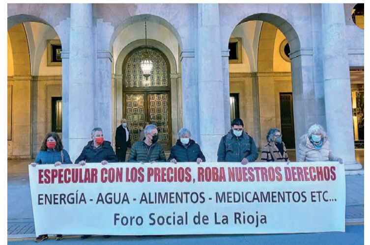
El cartel de la protesta contra los precios frente a la Delegación del Gobierno.

MANIFESTACIÓN | Protesta por el aumento de costes