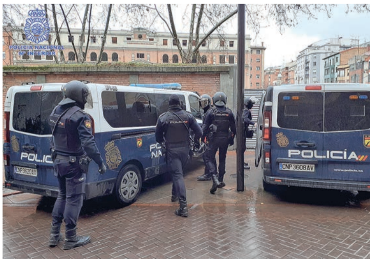
Los oficiales de la Policía Nacional que actuaron en Ciriaco Garrido.

Por otra parte, la Policía Nacional finalizó con éxito la operación 'La Pinta' en Logroño, que culminó con la detención de dos