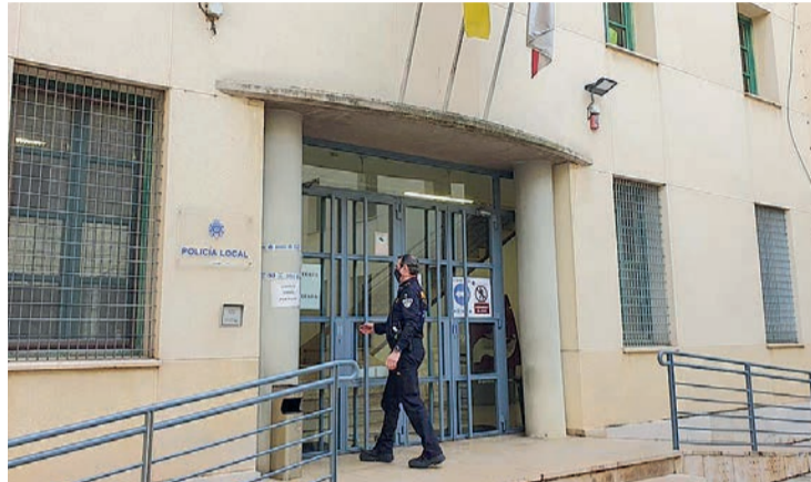
Una imagen de la comisaría de la Policía Local de Logroño.