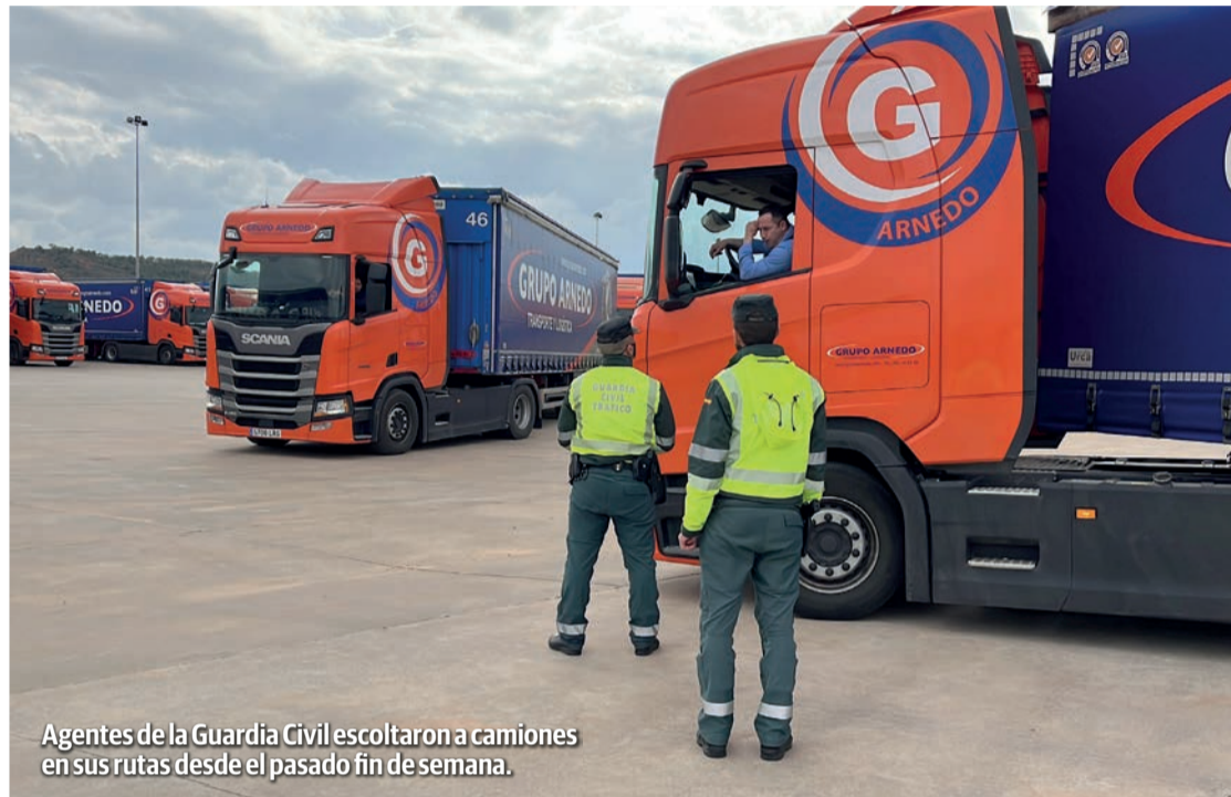
Agentes de la Guardia Civil escoltaron a camiones en sus rutas desde el pasado fin de semana.

Cámara no ve “ninguna solución fácil ni próxima” a la crisis del transporte, con el 29 de marzo co-