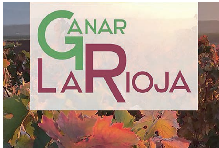
El logotipo de la plataforma Ganar La Rioja.

proyecto es ver qué opina la gente y, desde ahí, trabajar. Si cualquiera de los partidos clásicos a raíz de nuestra labor cambia su forma de ver las cosas, pues no hará falta crear ningún proyecto político. Tenemos nueve integrantes y un grupo de gente de otros colectivos dispuesta a colaborar. Ya nos plantearemos si concurrimos a las elecciones de 2023".