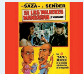
El cartel de la película de los 80.

joven y preciosa arqueóloga, que cree haber encontrado en sus excavaciones australianas, en un fósil idéntico a Marcelo, el arquetipo del macho de tiempos pasados. Tras muchos y divertidos esfuerzos, logra que Marcelo colabore con ella en el redescubrimiento del amor. Al final todo queda como al principio". Bueno, lo que yo quería contar es que, si las mujeres mandaran o mandasen, seguro que habría menos guerras y menos testosterona suelta por el mundo. Pero es mi opinión y como siempre nadie me hace caso.