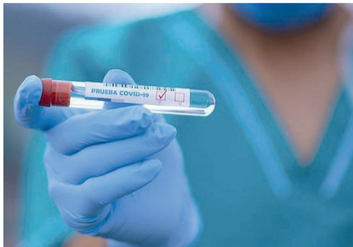
Imagen de una prueba positiva de coronavirus.

Salud Pública justifica que los cambios acordados se fundamentan en que "los altos niveles de inmunidad alcanzados en la población española determinan un cambio en la epidemiología de la COVID-19 que apoya la transición