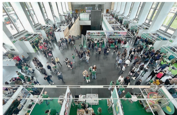
El hall del Riojaforum con los stands informativos de Formación Profesional.

EDUCACIÓN | Feria de FP en el Riojaforum