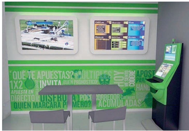
Los locales de apuestas tendrán que estar a 200 metros de los centros educativos.