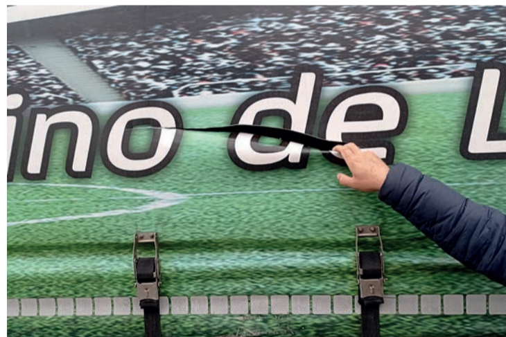
Desperfectos en la lona de un camión provocados por el piquete de la huelga.

“LA INTERRUPCIÓN DEL TRANSPORTE AGRAVA LA MALA SITUACIÓN POR EL AUMENTO DE LOS COSTES, LOS DAÑOS PUEDEN GENERAR UNAS PÉRDIDAS IRREPARABLES”