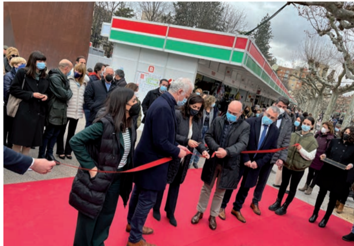
Las instituciones locales y regionales, en la inauguración de 'Logrostock' 2022.

A estos proyectos con financiación europea se suman otros apoyados por los Ejecutivos nacional y regional para relanzar la economía y el turismo. En este capítulo se encuentra la ayuda estatal de