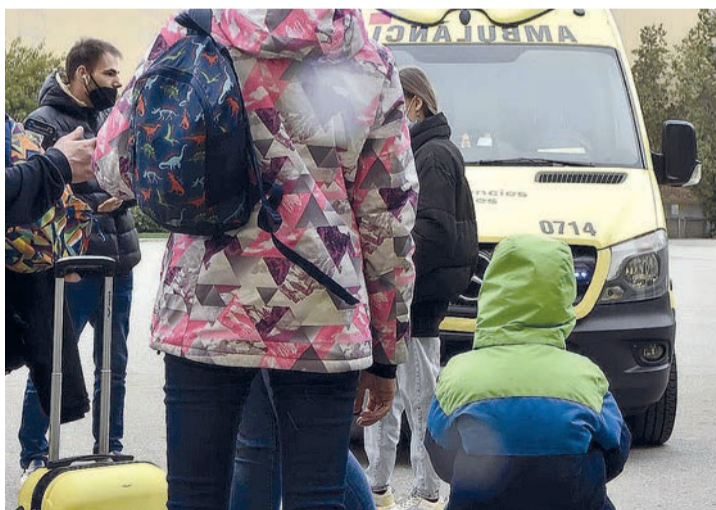
Una imagen de refugiados ucranianos tras abandonar su país.