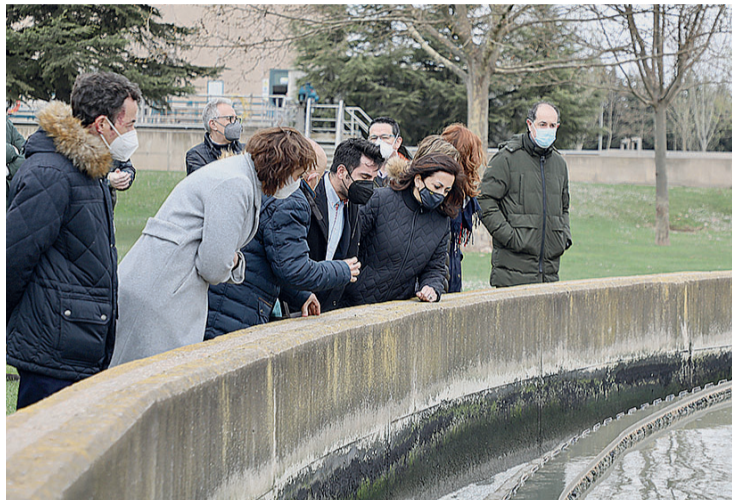
La presidenta riojana, Concha Andreu, en su visita a la depuradora de Logroño.

Con motivo del Día Mundial del Agua, la presidenta riojana, Concha Andreu, rubricó el acuerdo entre el Consorcio de Aguas y Residuos de La Rioja y la Sociedad Mercantil Estatal de Aguas de las Cuencas de España (ACUAES) del Ministerio para la Transición Ecológica y el Reto Demográfico, que ayudará a solucionar los problemas de saneamiento que afectan a los municipios de la parte baja de la cuenca del Iregua: Logroño, Lardero, Villamediana de Iregua, Alberite, Albelda y Nalda.