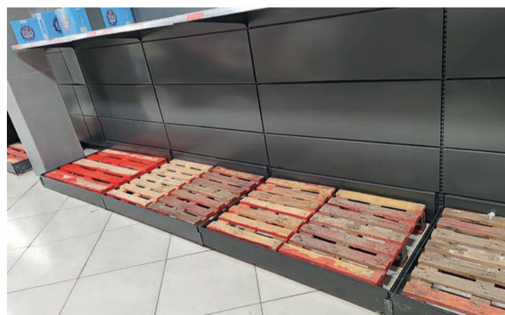
Productos de primera necesidad, como la leche, empiezan a desaparecer en los súper.

mo fecha marcada por el Gobierno para tomar decisiones, tras reunirse en Europa. Aun así, “toca gestionar de la mejor manera”: “Tenemos una responsabilidad con el tejido empresarial y la sociedad para asegurar los repartos, gracias a los acuerdos alcanzados en Navidad: se revisaron los precios conforme a la variación del combustible, se redujeron las esperas y se pactó no hacer cargas ni descargas”. Los suministros, especialmente lácteos y frescos, como frutas y pescados, han llegado a desaparecer algunos días de los supermercados, aunque un desabastecimiento generalizado no se espera hasta la próxima semana. El jueves 24 se produjo una cumbre entre Ejecutivo central y CTNC (que se beneficiará de rebajas y ayudas directas), pero infructuosa por no citar a los parados de la Plataforma.