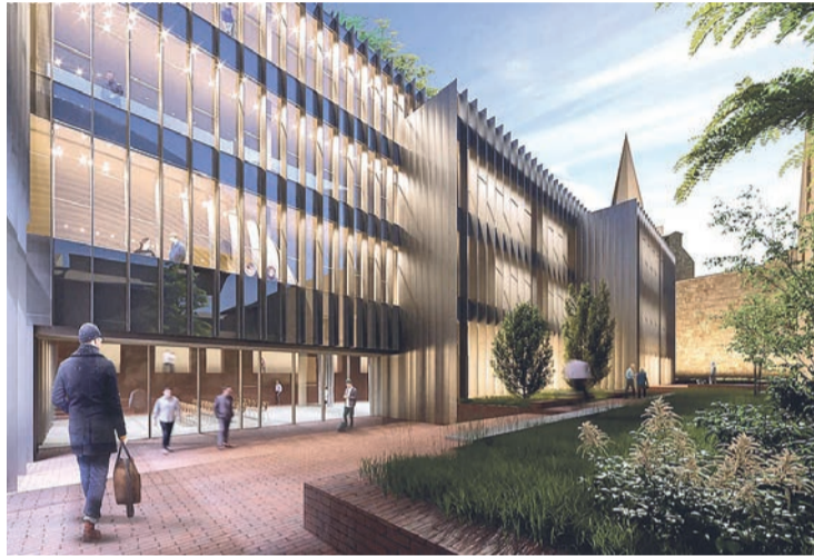
Proyección de cómo será la sede de la firma tecnológica Bosonit.

Además, la Junta adjudicó las obras para la creación de pasos de cebras elevados, así como para las mejoras puntuales en itinerarios peatonales, a Asbeca Construcción Gestión y Servicios Múltiples por una cuantía de 169.268,03 euros en Club Deportivo y las calles Menéndez