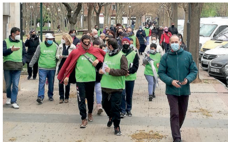
El regreso de los Paseos Saludables después de dos años por culpa del coronavirus.

De no sufrir más cambios imprevistos, los Paseos Saludables en el Barrio se celebrarán a partir de ahora el cuarto miércoles de cada mes, como era costumbre.