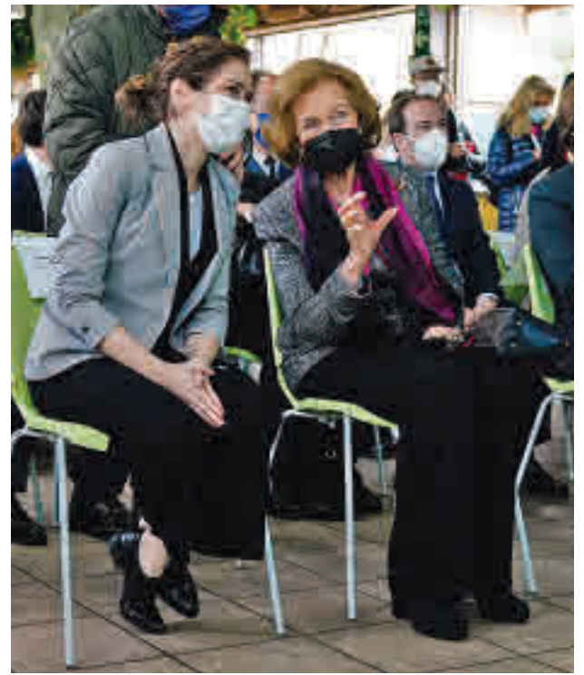
Díaz Ayuso y la Reina

El embajador de China en España, Wu Haitao, señaló en su intervención que el nacimiento de las nuevas crías “simboliza los mejores deseos para una amistad eterna entre ambos países”. Díaz Ayuso, por su parte, apuntó que el Zoo es un lugar “muy querido por los madrileños”, en el que además millones de visitantes del mundo han sido “felices” y han aprendido “el amor por los animales”.