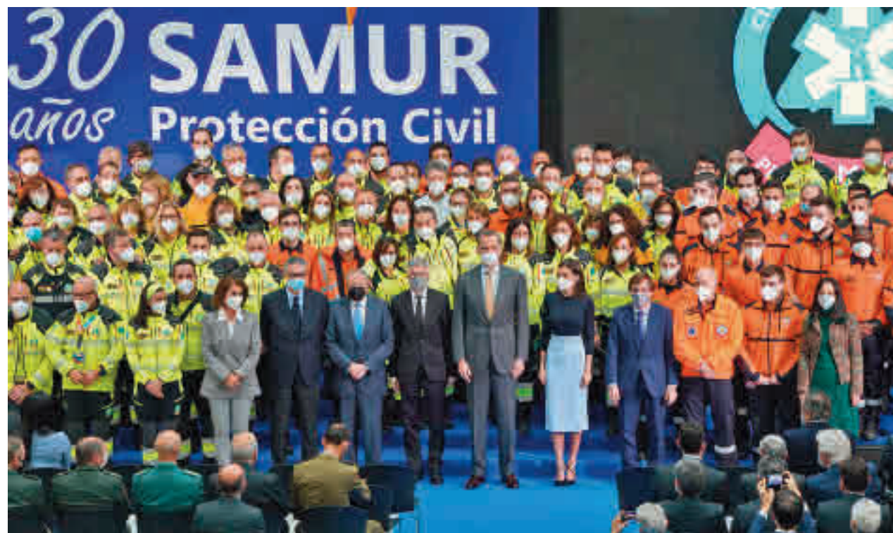
La foto de familia de los asistentes y de los profesionales del servicio de emergencias municipal

El alcalde, José Luis Martínez-Almeida, recibió a los Reyes acompañado de la vicealcaldesa, Begoña Villacís; del ministro del Interior, Fernan-