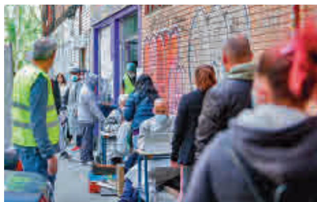
Una de las colas del hambre en la capital

Además, el 11% de las familias ha tenido contacto con los servicios sociales, porcentaje que llegaría hasta un 12%