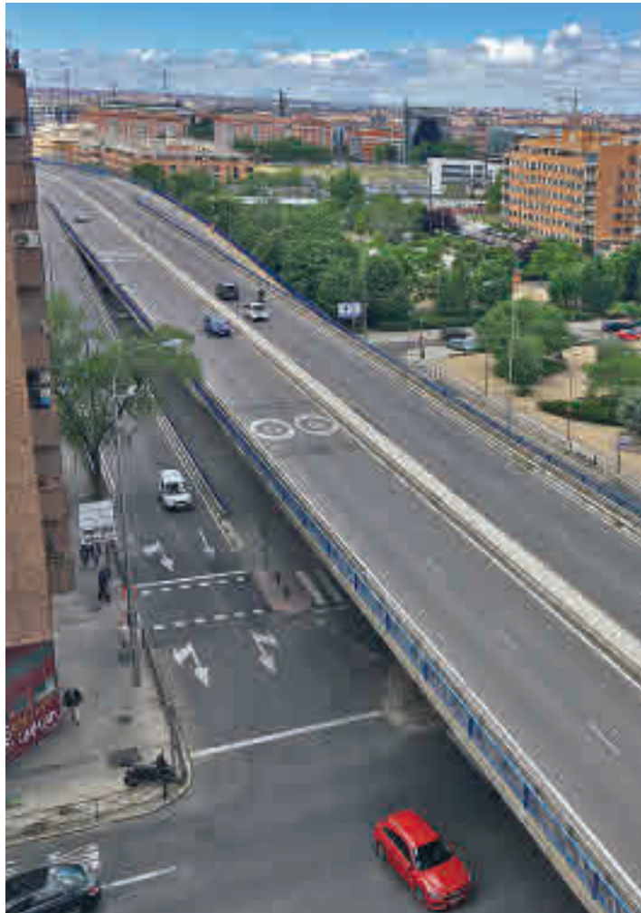
El paso elevado de Pedro Bosch

EL CONSISTORIO DE LA CAPITAL HA SEÑALIZADO CINCO DESVÍOS ALTERNATIVOS