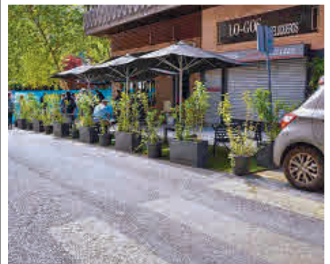
Una de las terrazas situadas en banda de aparcamiento

Entre otras acciones, esta reforma comprenderá la ampliación de las aceras, así como la creación de nuevos pasos de peatones y de un carril bici segregado bidireccional.