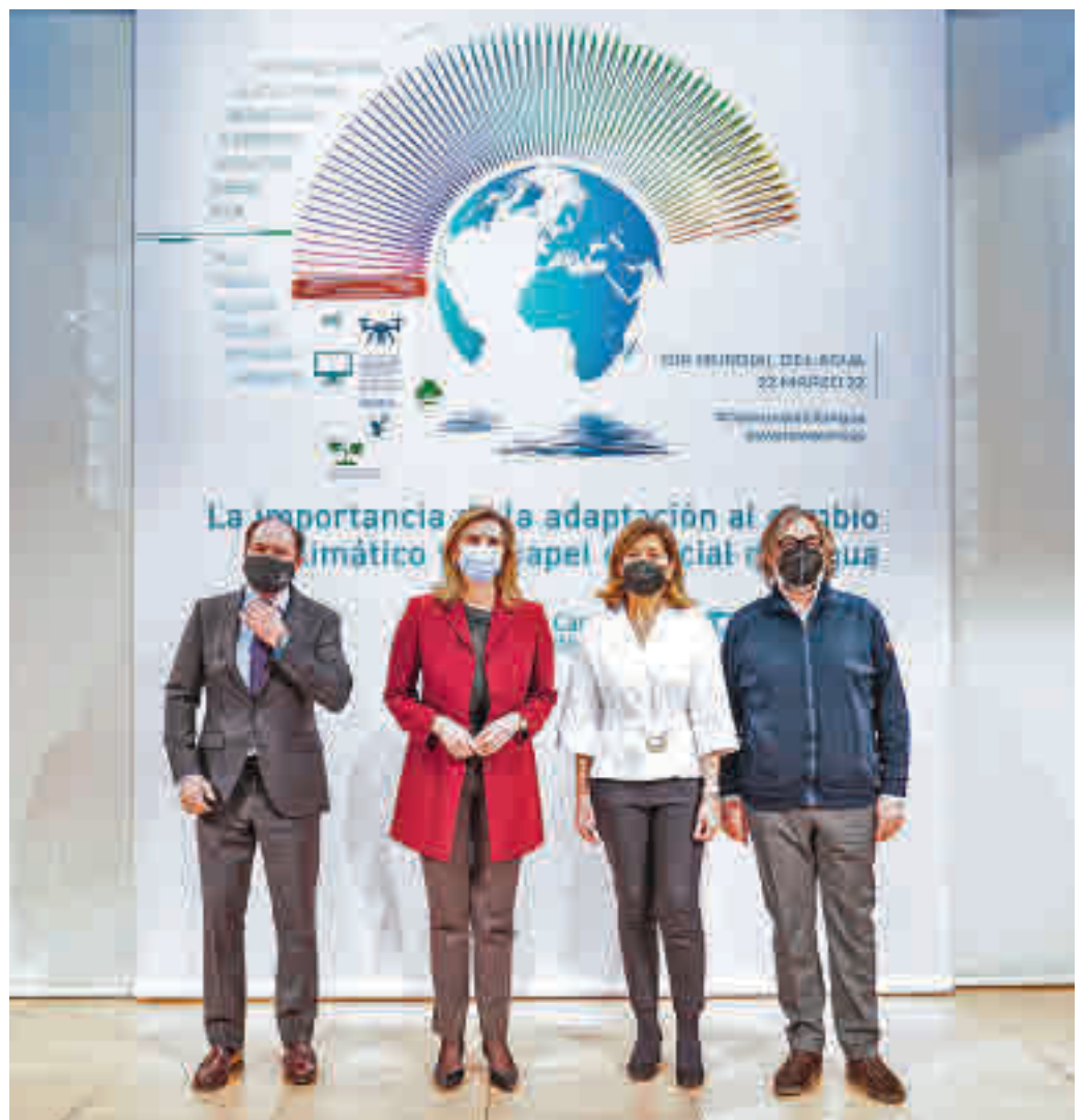
Presentación del informe del Canal de Isabel II

Se trata de un documento que señala 127 estrategias y soluciones específicas de adaptación en sectores tan diferentes como el agua, la agricultura, el urbanismo y la edificación, la salud y los sistemas de alerta temprana. Este informe recoge múltiples soluciones novedosas, ya en funcionamiento, como el cultivo de nuevas variedades vegetales resistentes a las actuales condiciones climáticas, los sistemas de 'big data' para anticipar fenómenos naturales o los vegetales en medio urbano para amortiguar dichos episodios extremos, así como los mapas urbanos de índice de control térmico e incluso la utiliza-