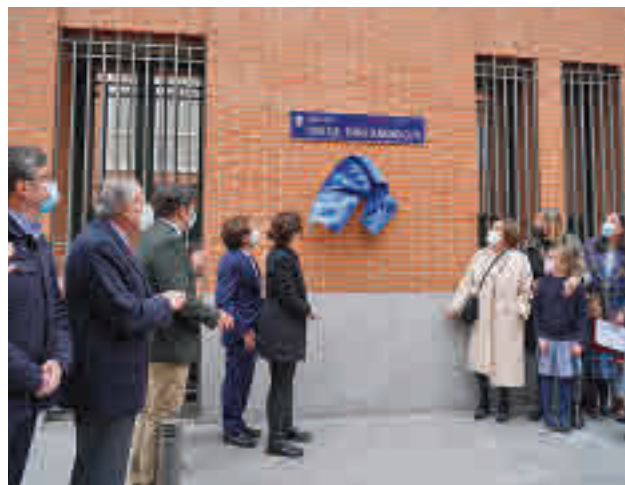
El acto de descubrimiento de la placa

La superficie total del terreno que se encuentra actualmente vacío y cuenta con todas las infraestructuras para su construcción y puesta en servicio, es de 11.100 metros cuadrados.