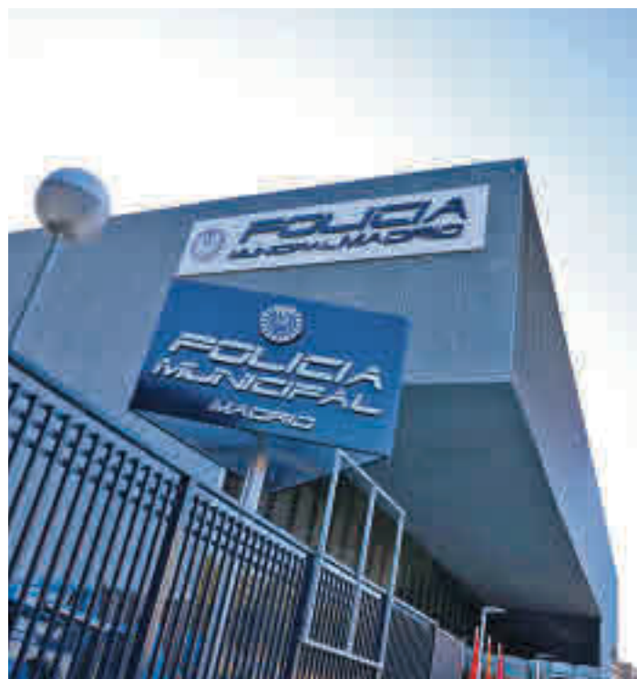
La nueva unidad tendrá cuatro plantas y un semisótano

cuadrados repartidos en un semisótano y cuatro plantas sobre rasante. En el semisótano se localizarán las plazas de aparcamiento y distintos cuartos de instalaciones, mientras que la planta baja albergará la zona pública de atención al ciudadano. Por su parte, el primer piso contará con oficinas y sala de pase de lista, y el segundo estará destinado a despachos, sala de descanso y vestuarios de mandos. En la tercera planta se ubicarán vestuarios, así como en la cuarta planta, junto a una sala-gimnasio.