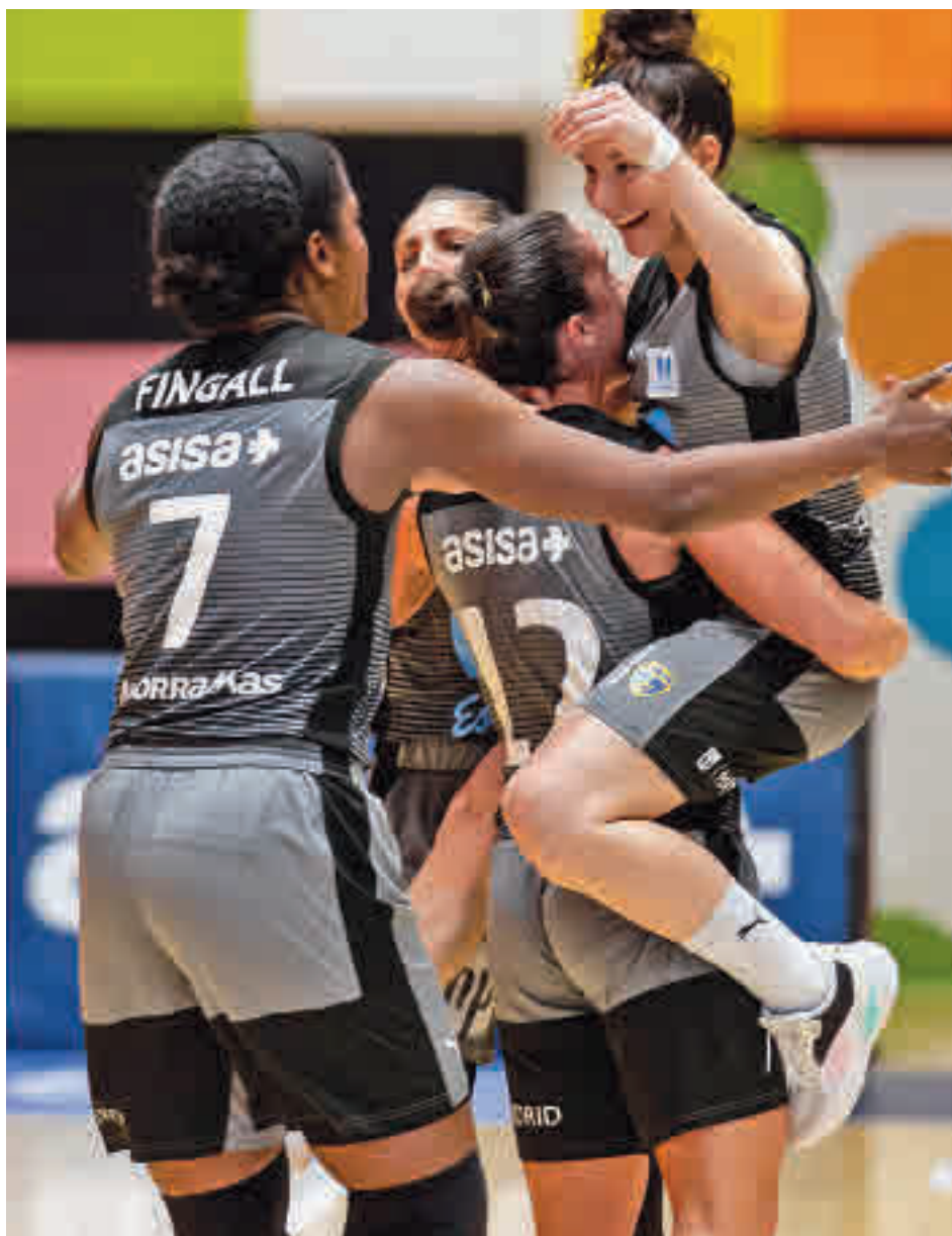
Las estudiantiles ganaron su último partido de la Liga Endesa MOVISTAR ESTUDIANTES

A ese factor se aferra un Movistar Estudiantes que sueña con emular al último equipo madrileño que disputó una final de la Copa de la Reina.