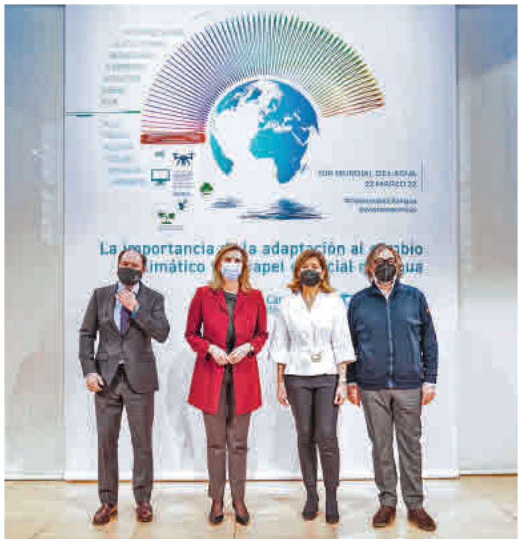
Presentación del informe del Canal de Isabel II

Se trata de un documento que señala 127 estrategias y soluciones específicas de adaptación en sectores tan diferentes como el agua, la agricultura, el urbanismo y la edificación, la salud y los sistemas de alerta temprana. Este informe recoge múltiples soluciones novedosas, ya en funcionamiento, como el cultivo de nuevas variedades vegetales resistentes a las actuales condiciones climáticas, los sistemas de 'big data' para anticipar fenómenos naturales o los vegetales en medio urbano para amortiguar dichos episodios extremos, así como los mapas urbanos de índice de control térmico e incluso la utiliza-