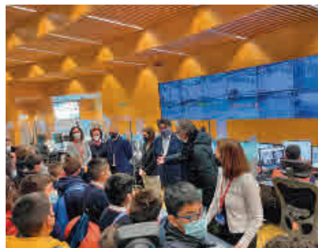
Visitas de escolares en Metro

El suburbano madrileño celebra en 2022 sus primeros 40 años de encuentros con escolares, ya que el programa se inició en 1982 para el segmento de EGB (de 6 a 13 años