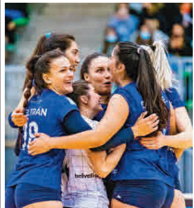
Las madrileñas celebraron su pase al 'play-off'

Esa ilusión por un hipotético ascenso de categoría contrasta con los apuros de los equipos que tratan de esquivar la amenaza del descenso a Preferente. El colista, el Moscardó, ya ha certificado su descenso, una realidad que podrían vivir su vecino Carabanchel, el Villaviciosa y el Complutense Alcalá (están a 14, 13 y 12 puntos de la zona de salvación). Las otras tres plazas las ocupan ahora mismo el Villaverde, el Tres Cantos y la ED Moratalaz.