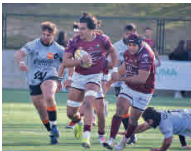
La Liga regresa a Las Terrazas

parados por apenas cuatro puntos. Uno de esos equipos punteros es el Lexus Alcobendas Rugby, que este sábado 26 (12 horas) vuelve a la Liga jugando ante sus aficionados frente al otro conjunto madrileño, el Complutense Cisneros, octavo clasificado.