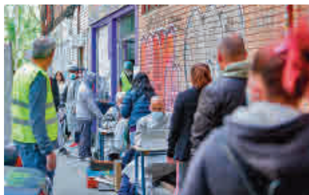
Una de las colas del hambre en la capital

Además, el 11% de las familias ha tenido contacto con los servicios sociales, porcentaje que llegaría hasta un 12%