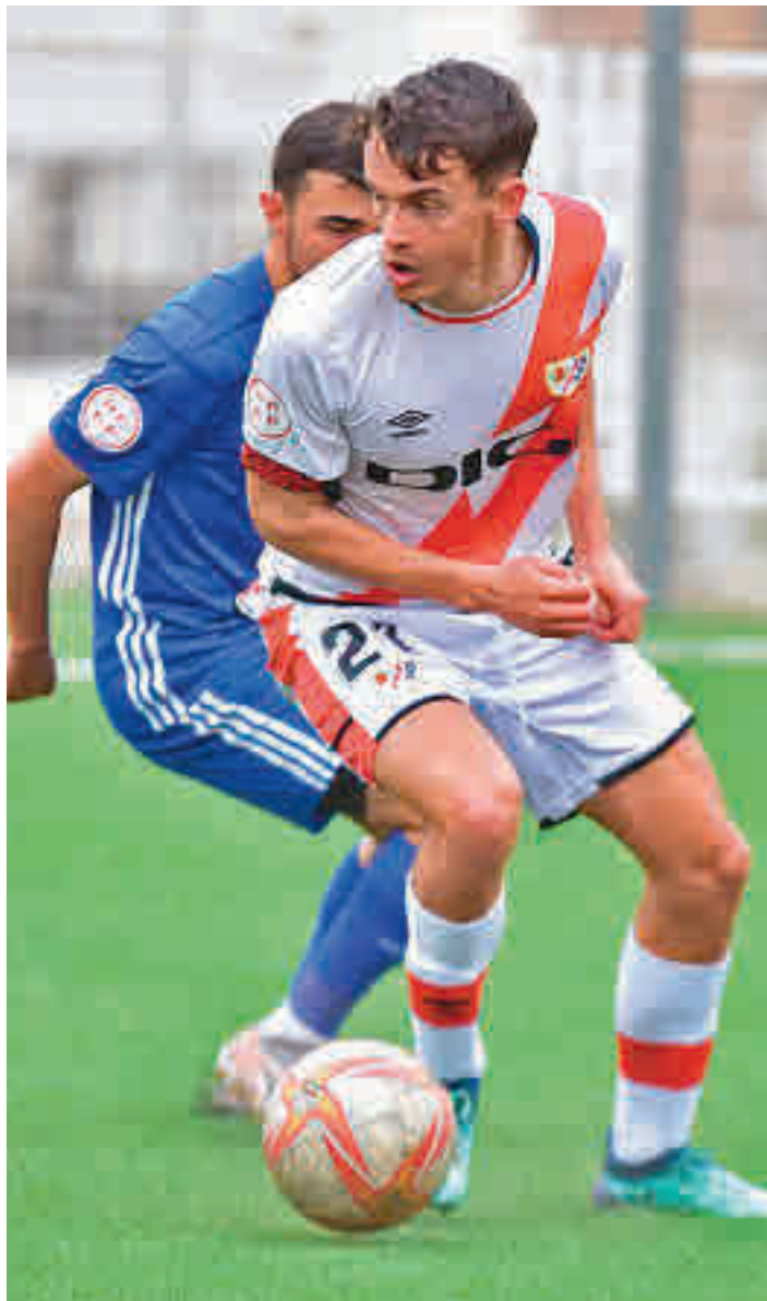
El Rayo B es undécimo en la tabla RAYO VALLECANO

Un triunfo de los visitantes apretaría un poco más si cabe esa lucha por el 'play-off' y