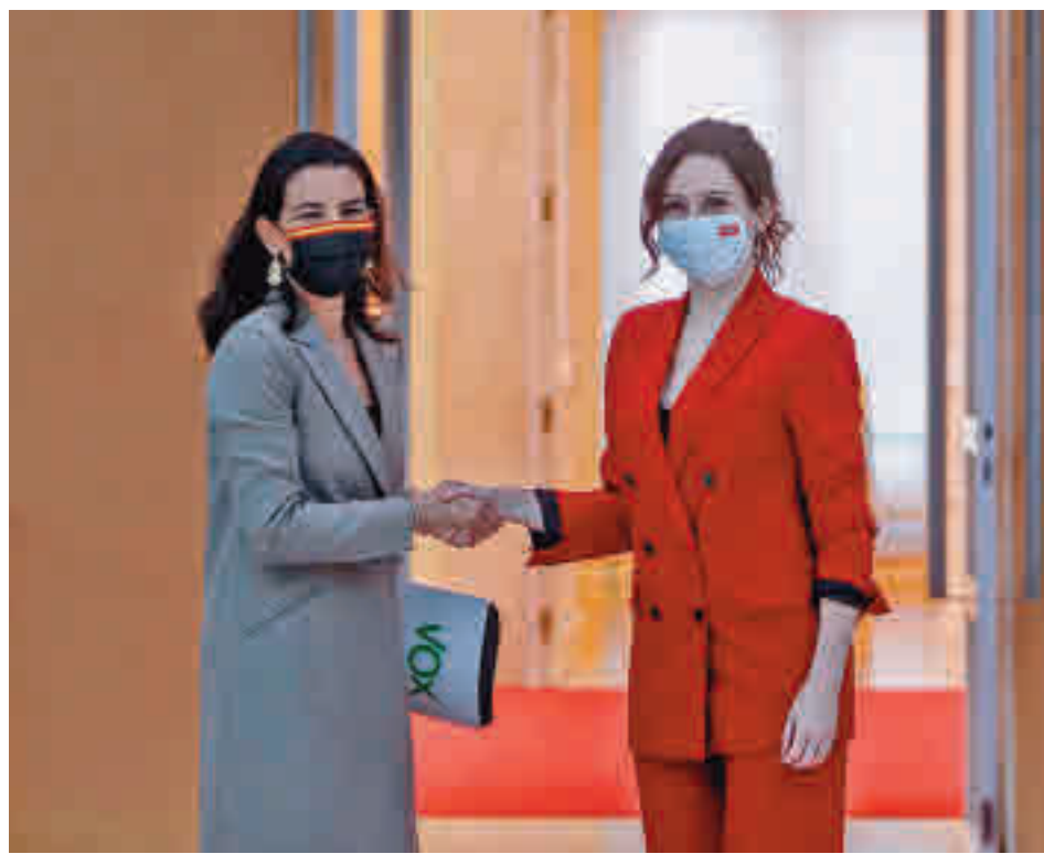
Isabel Díaz Ayuso y Rocío Monasterio

La ley reconoce el derecho de los consumidores a recibir llamadas desde un número “identificable”, gracias a una normativa de 2009 que intentaba atajar el uso de los números ocultos. Sin embargo, a juicio de la organización, esto no es suficiente pues, con que se muestre el número y ubicación geográfica, se considera identificada.