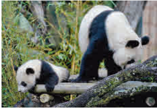
Pandas gigantes en el Zoo de Madrid