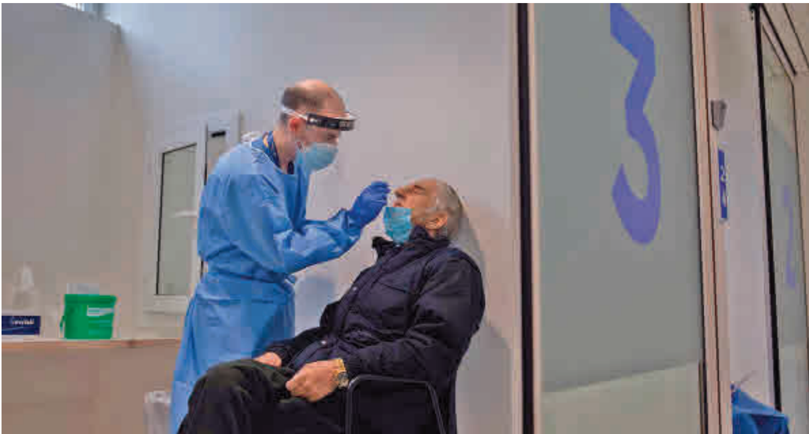
También habrá cambios en las pruebas de detección de la covid-19