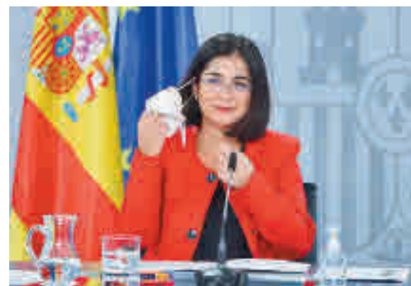
La ministra, en una intervención reciente

respecto. La ministra Carolina Darias insistía este miércoles en el pleno del Congreso de los Diputados que la eliminación de la obligatoriedad del uso de mascarillas en interiores será “más pronto que tarde”, si bien no quiso dar una