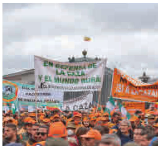
Protestas por las calles de Madrid el domingo 20

EL PERIÓDICO GENTE NO SE RESPONSABILIZA NI SE IDENTIFICA CON LAS OPINIONES QUE SUS LECTORES Y COLABORADORES EXPONGAN EN SUS CARTAS Y ARTÍCULOS