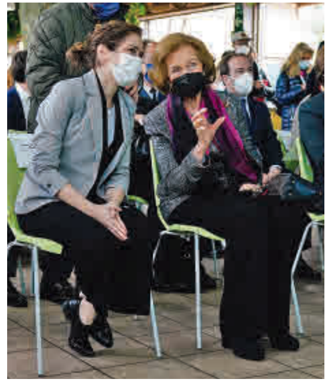
Díaz Ayuso y la Reina

El embajador de China en España, Wu Haitao, señaló en su intervención que el nacimiento de las nuevas crías “simboliza los mejores deseos para una amistad eterna entre ambos países”. Díaz Ayuso, por su parte, apuntó que el Zoo es un lugar “muy querido por los madrileños”, en el que además millones de visitantes del mundo han sido “felices” y han aprendido “el amor por los animales”.