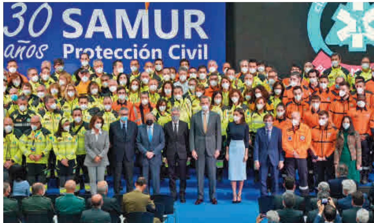
La foto de familia de los asistentes y de los profesionales del servicio de emergencias municipal

El alcalde, José Luis Martínez-Almeida, recibió a los Reyes acompañado de la vicealcaldesa, Begoña Villacís; del ministro del Interior, Fernan-