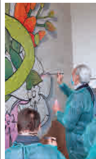
Acto en 3 Olivos

Si saliera adelante la reducción a 91 escaños, cada uno de ellos representaría a 73.000 madrileños. La medida entraría en vigor en la siguiente legislatura.