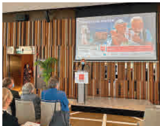
Presentación de las Rutas Culturales

Los mayores de 60 años tienen un periodo prioritario