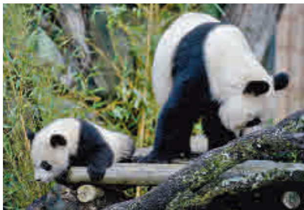
Pandas gigantes en el Zoo de Madrid