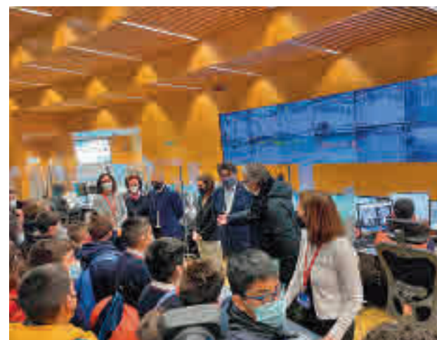
Visitas de escolares en Metro

El suburbano madrileño celebra en 2022 sus primeros 40 años de encuentros con escolares, ya que el programa se inició en 1982 para el segmento de EGB (de 6 a 13 años