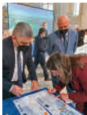
Recogida del título

Getafe fue evaluada para la obtención de este título el pasado mes de octubre en una visita de los representantes de ACES Europe, entidad que organiza los premios, en la