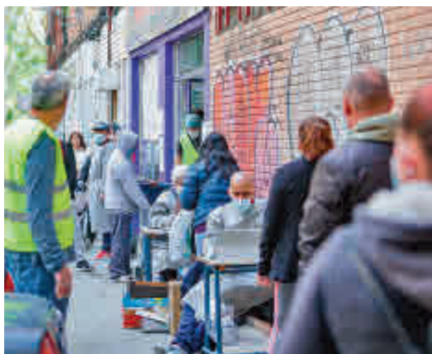
Una de las colas del hambre en la capital

Además, el 11% de las familias ha tenido contacto con los servicios sociales, porcentaje que llegaría hasta un 12% si se produjera una nueva crisis económica. El mencionado documento tiene como base las encuestas realizadas