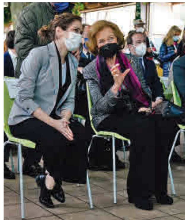
Díaz Ayuso y la Reina

El embajador de China en España, Wu Haitao, señaló en su intervención que el nacimiento de las nuevas crías “simboliza los mejores deseos para una amistad eterna entre ambos países”. Díaz Ayuso, por su parte, apuntó que el Zoo es un lugar “muy querido por los madrileños”, en el que además millones de visitantes del mundo han sido “felices” y han aprendido “el amor por los animales”.