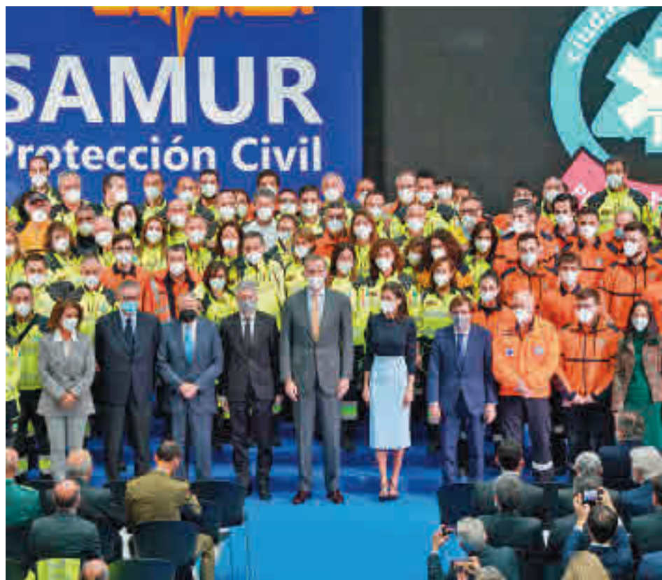
La foto de familia de los asistentes y de los profesionales del servicio de emergencias municipal