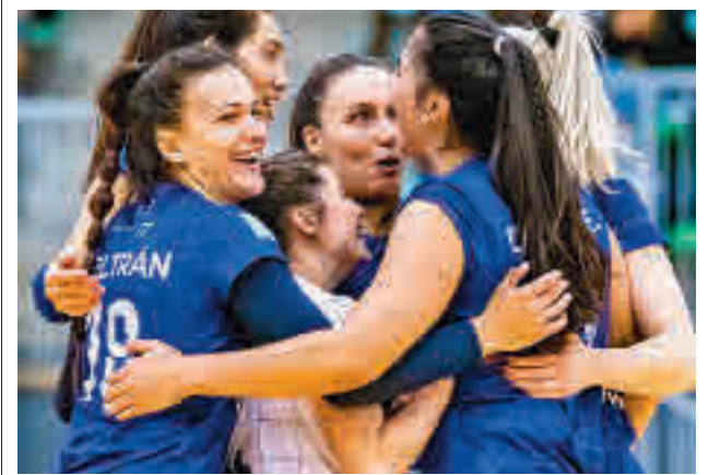
Las madrileñas celebraron su pase al 'play-off'

Esa ilusión por un hipotético ascenso de categoría contrasta con los apuros del descenso. El colista, el Moscardó, ya ha certificado su descenso, una realidad que podrían vivir su vecino Carabanchel, el Villaviciosa y el Complutense Alcalá.