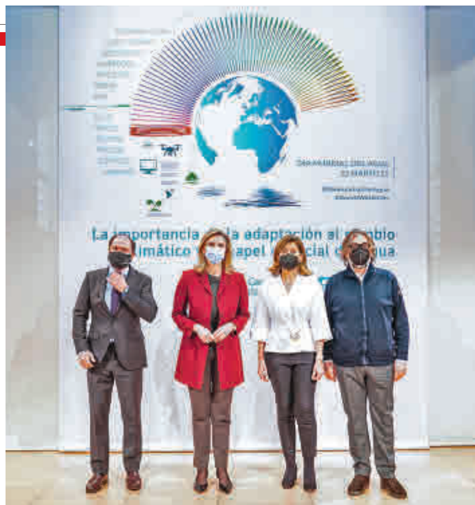
Presentación del informe del Canal de Isabel II