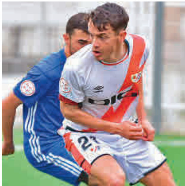
El Rayo B es undécimo en la tabla RAYO VALLECANO

La larga carrera de fondo (42 jornadas) del Grupo 7 de la Tercera RFEF va aclarando sus posiciones cuando solo quedan por disputarse siete fechas. La primera de ellas se presenta como una buena ocasión para que clarificar la zona noble de la clasificación. Con el Atlético de Madrid B caminando con paso firme hacia el ascenso (aventaja en 11 puntos al segundo), el foco se traslada a la lucha por las otras cuatro plazas que definirán el 'play-off'. Dos de los equipos que actualmente están en ese selecto grupo se ven las cara este domingo. A