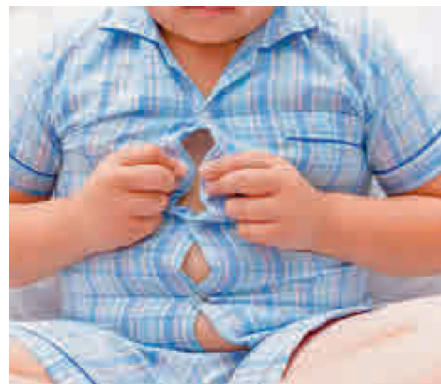
Un niño obeso tiene muchas posibilidades de serlo de adulto

La Organización Mundial de la Salud advierte que un niño obeso tiene muchas posibilidades de serlo de adulto. Las principales causas de la obesidad tienen que ver con un estilo de vida inadecuado en relación con la alimentación y la práctica de actividad física, hábitos desarrollados en la