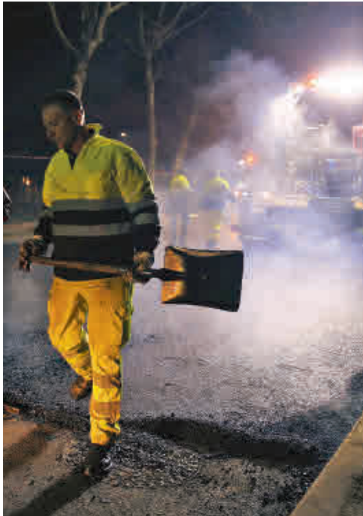
Labores de asfaltado en Sanse

"DESDE EL AÑO 2009 NO SE HABÍA HECHO NINGUNA LABOR DE ASFALTADO"