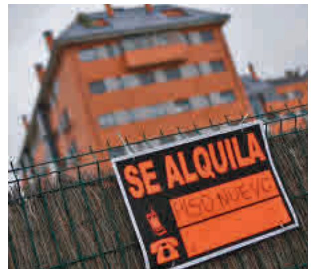
Viviendas en alquiler

Además de los inquilinos, otro sector que se beneficiará de la intervención del Gobierno central es el de los perceptores del Ingreso Mínimo Vital, que verán como su prestación aumenta un 15% en los próximos tres meses. Los beneficiarios de este subsidio pueden solicitarlo tanto de forma individual como por unidades de convivencia.