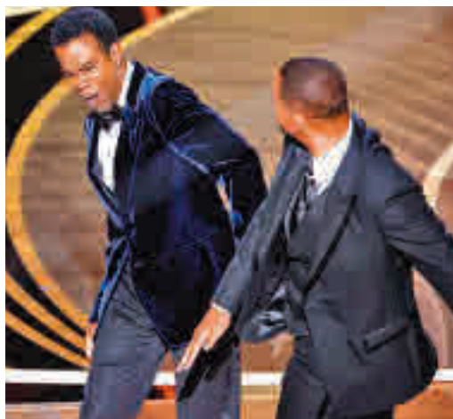
Chris Rock y Will Smith, ¿héroes o villanos?

EL PERIÓDICO GENTE NO SE RESPONSABILIZA NI SE IDENTIFICA CON LAS OPINIONES QUE SUS LECTORES Y COLABORADORES EXPONGAN EN SUS CARTAS Y ARTÍCULOS