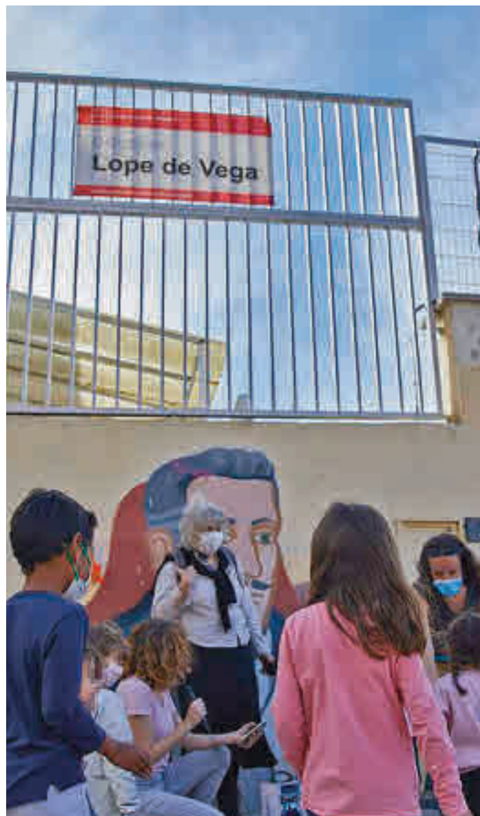
Colegio público de Madrid

La convocatoria se prolongará hasta el 5 de mayo en los centros sostenidos con fondos públicos • El Gobierno regional intenta mantener el distrito único educativo