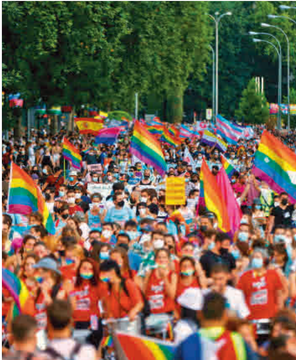
La multitudinaria manifestación de ediciones anteriores

En esta edición, MADO estará enmarcado en las celebraciones de la Asociación Europea de Organizadores de Orgullo (EPOA) con motivo del 30 Aniversario del primer EuroPride, celebrado en Londres en 1992. Uno de los mo-