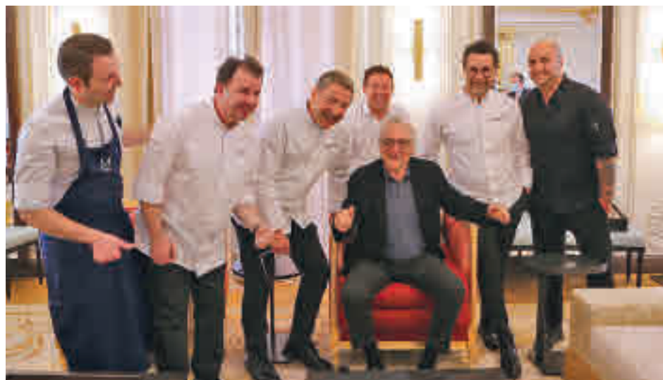
Robert de Niro, centro, junto con los cocineros MADRID FUSIÓN

sada de manera económica, sino que el pago se haría a través de un "menú impagable". Dicho y hecho. El actor disfrutó durante más de tres horas un menú elaborado por Quique Dacosta, Mauro Colagreco, José Andrés, Joan Roca y Martín Berasategui. El lugar elegido para la cita fue la suite real del Mandarin Oriental Ritz, Madrid; y junto a él estuvo su pareja,