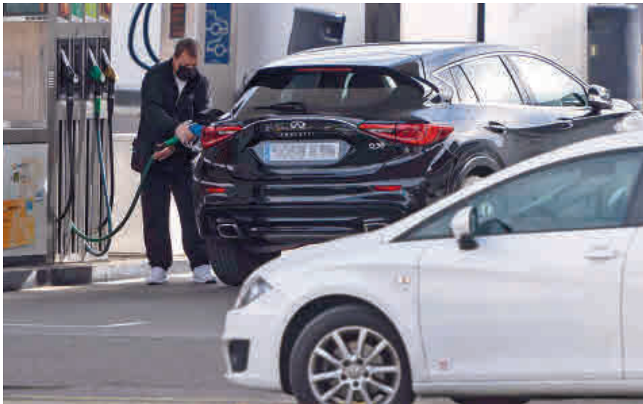
Los usuarios tendrán descuentos a partir de este viernes en las gasolineras

Los usuarios piden que se controlen los precios para evitar que las compañías los suban y así eviten el impacto económico de tener que hacer el descuento. La OCU también considera que la medida es "insuficiente" y cifra el