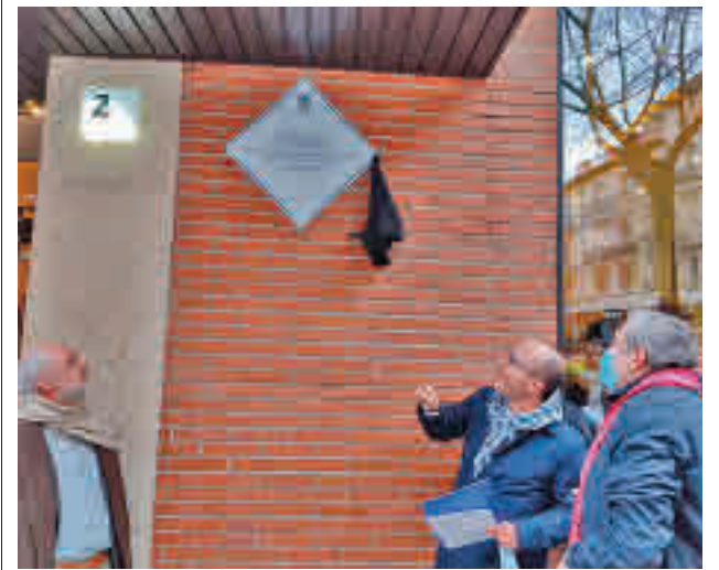
El acto de inauguración del nuevo distintivo

gentedigital.es Toda la actualidad de los distritos de Madrid, en nuestra web