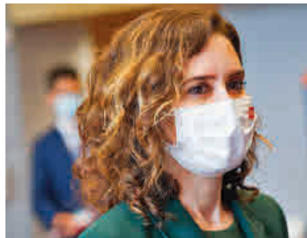
Isabel Díaz Ayuso

La ayuda económica a la natalidad de la Comunidad de Madrid consiste en un abono mensual de 500 euros desde el quinto mes de embarazo hasta que el niño cumpla dos