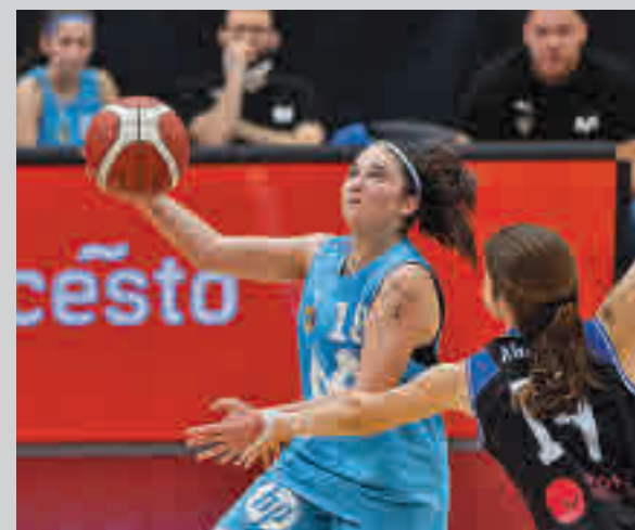
La jugadora natural de Las Rozas, en la final M. ESTUDIANTES