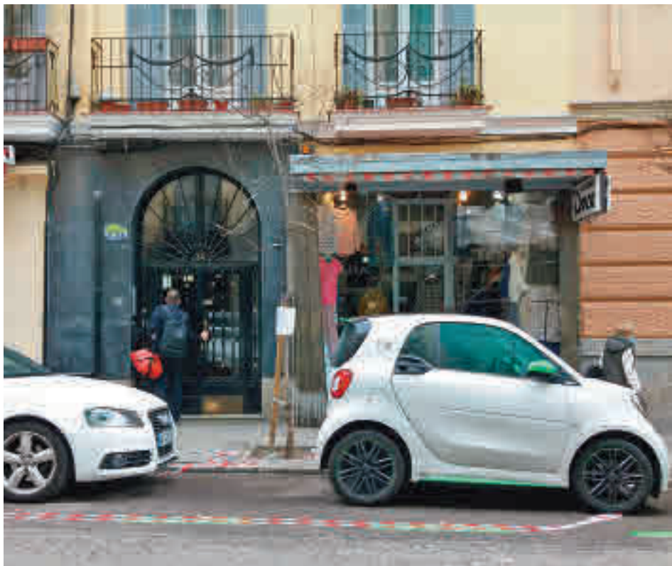
Una de las zonas de aparcamiento de la calle de Ponzano AV EL ORGANILLO