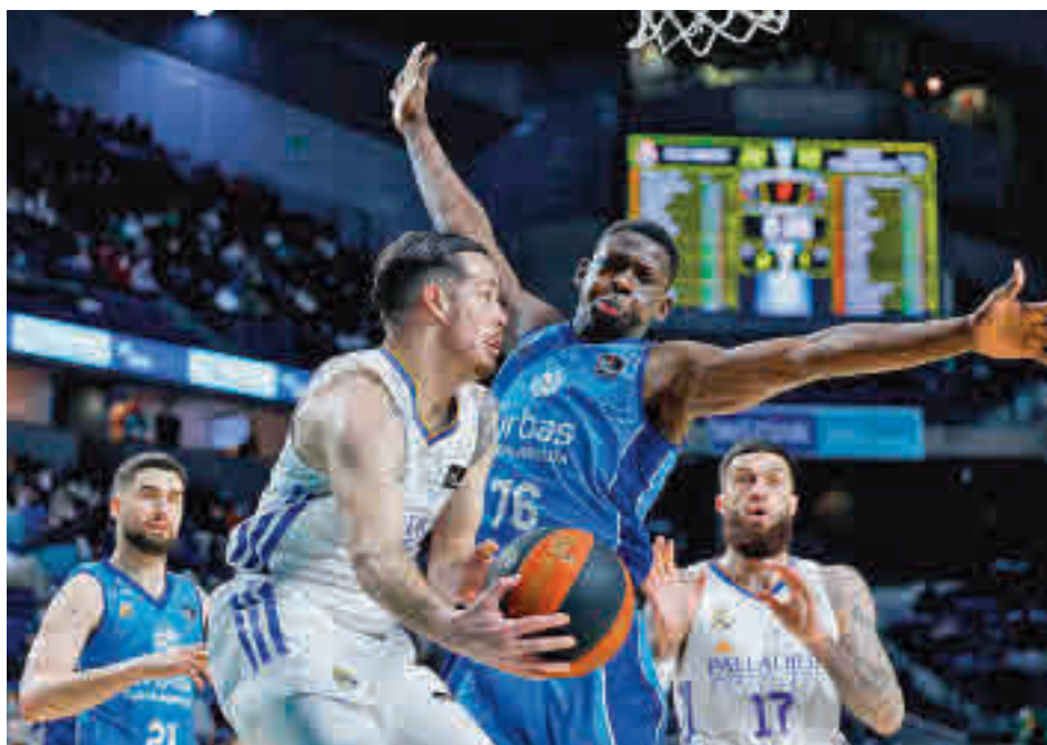
El Real Madrid se impuso en el derbi por 92-77

Teniendo en cuenta que el próximo día 10 habrá un nuevo 'Clásico' liguero en el Palau, los blancos parecen obligados a cumplir con su papel de favoritos ante un Lenovo Tenerife que tiene bien amarradas sus opciones de estar en el 'play-off' (es sexto con un balance de 15-9). Después de esa cita en el Santiago Martín, el Real Madrid comenzará a pensar en el partido del viernes 8 (20:45 horas) en el WiZink Center con el Bayern Munich como rival. Será el último compromiso de una fase regular que deja paso a los 'play-offs' a partir del 19 de abril.