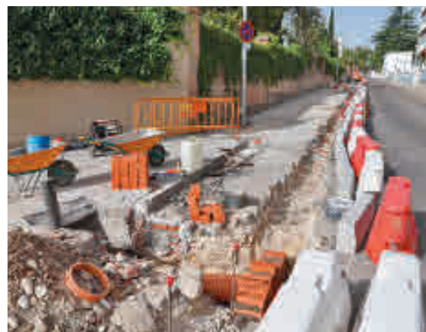
Las obras en el entorno del colegio Sagrado Corazón

Además, se contemplan actuaciones de renovación y adecuación de aceras y vías peatonales, reordenación de