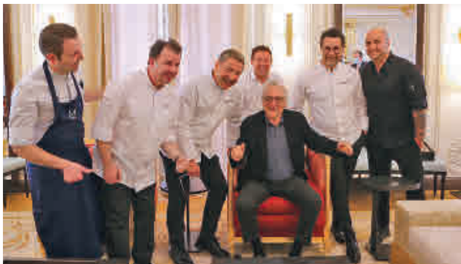
Robert de Niro, centro, junto con los cocineros MADRID FUSIÓN

sada de manera económica, sino que el pago se haría a través de un "menú impagable". Dicho y hecho. El actor disfrutó durante más de tres horas un menú elaborado por Quique Dacosta, Mauro Colagreco, José Andrés, Joan Roca y Martín Berasategui. El lugar elegido para la cita fue la suite real del Mandarin Oriental Ritz, Madrid; y junto a él estuvo su pareja,