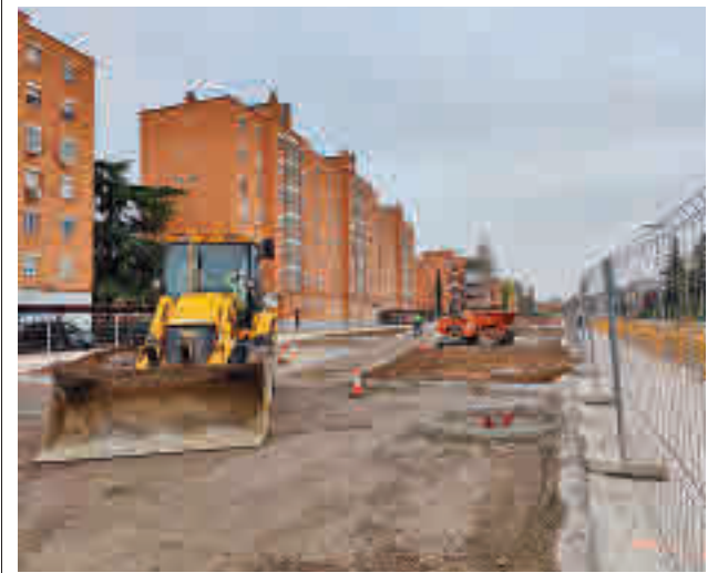
El estado actual de los trabajos

gentedigital.es Toda la actualidad de los distritos de Madrid, en nuestra web