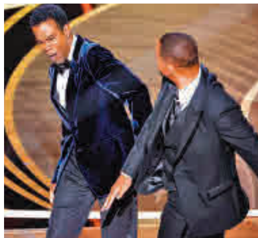
Chris Rock y Will Smith, ¿héroe o villano?

EL PERIÓDICO GENTE NO SE RESPONSABILIZA NI SE IDENTIFICA CON LAS OPINIONES QUE SUS LECTORES Y COLABORADORES EXPONGAN EN SUS CARTAS Y ARTÍCULOS