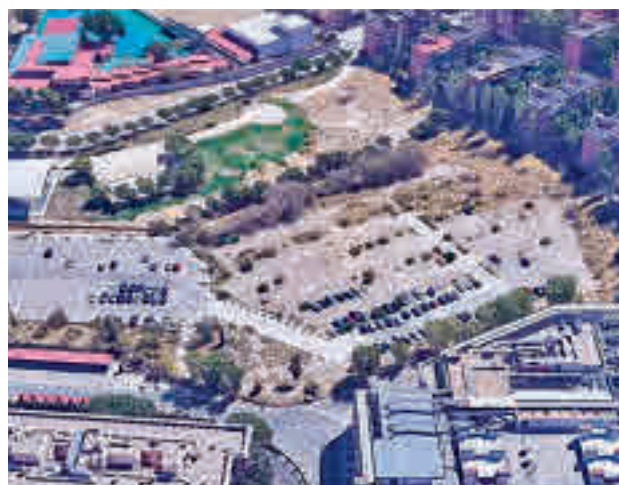
El ámbito de actuación

Según fuentes municipales, el objetivo es revitalizar un suelo actualmente infrutilizado y dotar al entorno de la estructura viaria necesaria para eliminar el efecto barrera que ahora existe entre la avenida de San Luis y la calle de López de Hoyos.