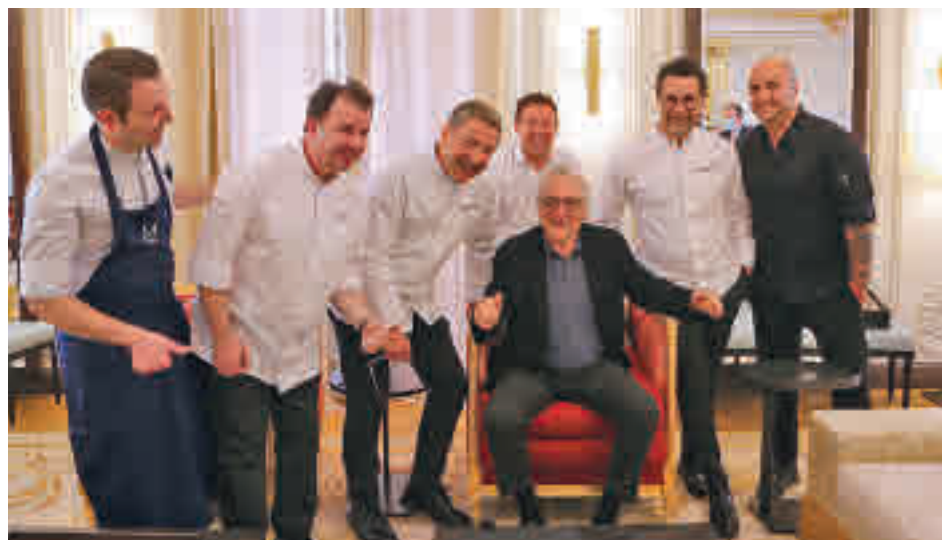
Robert de Niro, centro, junto con los cocineros

sada de manera económica, sino que el pago se haría a través de un "menú impagable". Dicho y hecho. El actor disfrutó durante más de tres horas un menú elaborado por Quique Dacosta, Mauro Colagreco, José Andrés, Joan Roca y Martín Berasategui. El lugar elegido para la cita fue la suite real del Mandarin Oriental Ritz, Madrid; y junto a él estuvo su pareja,