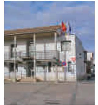
Ayuntamiento de Valdemoro