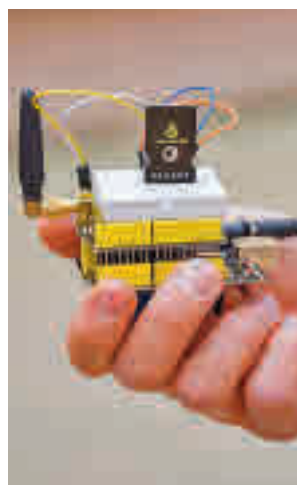
Uno de los microsatélites

(ESA). "Saber por qué no ha hecho frío este invierno o conocer en qué estado está la atmósfera con la contaminación que emitimos son las misiones espaciales de los dos microsatélites CanSat que han diseñado los alumnos de 4º de ESO del IES Miguel Hernández y el IES Miguel de Cervantes respectivamente", han señalado los responsables de la iniciativa.