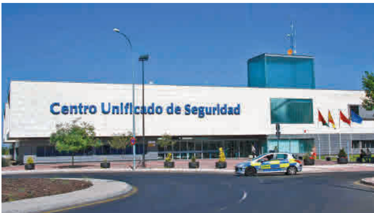
Centro unificado de Seguridad de Alcorcón

Dos meses después del suceso, el joven pidió conocer a los agentes y se encontró con ellos para agradecerles su intervención.