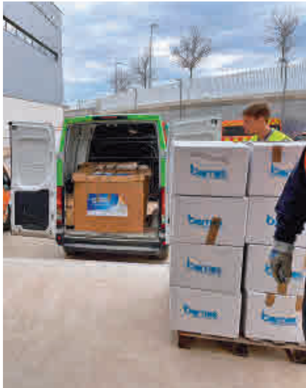
Entrega de material humanitario

Más concretamente, se centralizan administrativamente en la Concejalía de