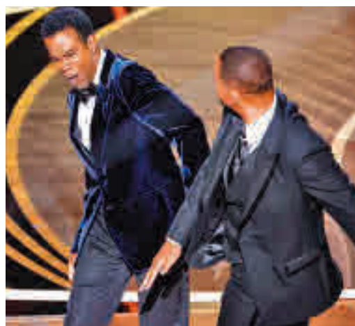
Chris Rock y Will Smith, ¿héroe o villano?

EL PERIÓDICO GENTE NO SE RESPONSABILIZA NI SE IDENTIFICA CON LAS OPINIONES QUE SUS LECTORES Y COLABORADORES EXPONGAN EN SUS CARTAS Y ARTÍCULOS