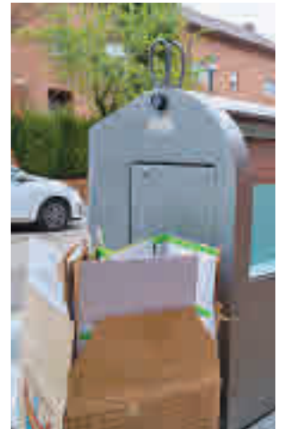
Recogida de lunes a viernes

A través de unos folletos se recuerda a los vecinos los servicios municipales de los que disponen y las condiciones de uso de los contenedores municipales conforme a la ordenanza. Para emplear este servicio, deberán plegar, apilar y depositar el papel-cartón junto a la isla de contenedo-