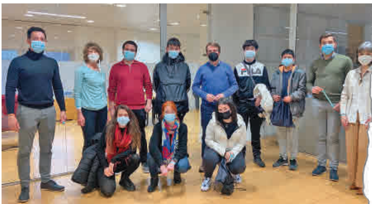
Miembros de Agora's Revolution fueron recibidos en el Ayuntamiento de Tres Cantos

La asociación Agora's Revolution, que cumple un año de vida, presta apoyo académico y social a estudiantes de Secundaria ● Realiza su labor en en IES Pintor Antonio López ● Ante la gran demanda, buscan nuevos voluntarios