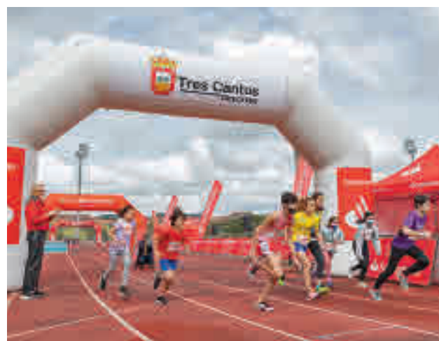
Imagen de una de las pruebas infantiles

res más cercana a su ubicación, entre las 13 y las 14 horas, de lunes a viernes, para que los servicios municipales puedan retirarlo. El concejal Pedro Fernández ha anunciado que “se está implementando un servicio especial de recogida de residuos en las zonas de restauración”.