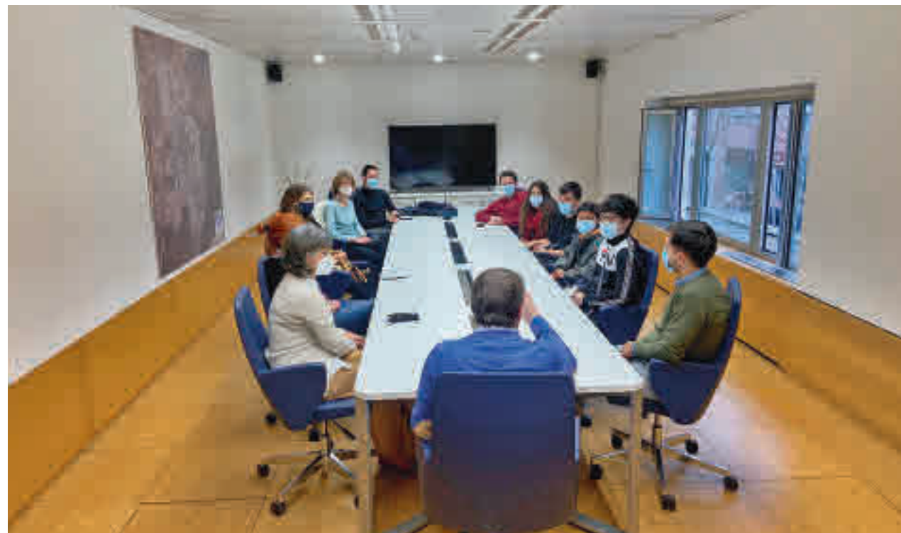
Un momento del encuentro entre jóvenes de la asociación y miembros del Ayuntamiento