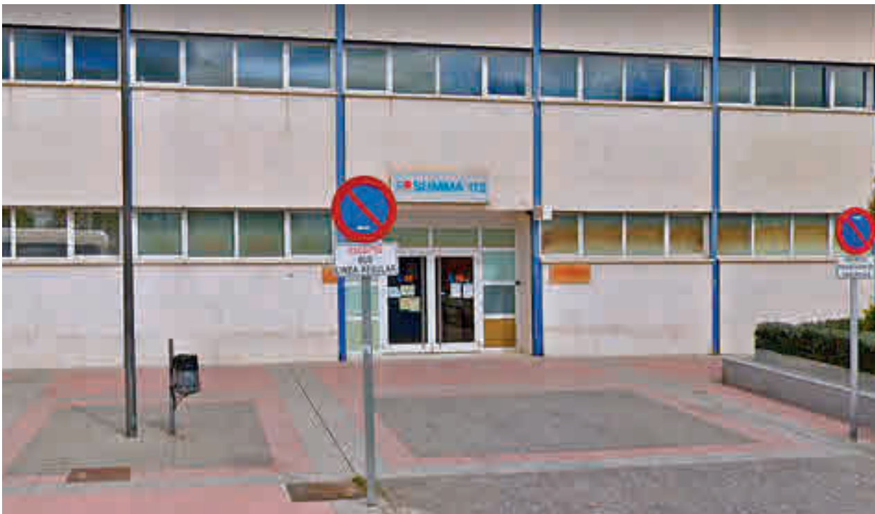
El centro de salud vio interrumpido su funcionamiento con la llegada de la pandemia