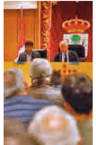
Solidaridad en Sanse

El Gobierno local da respuesta así a la llegada de ciu-