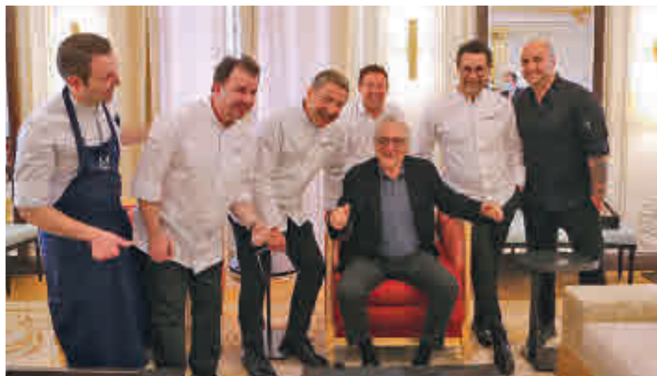
Robert de Niro, centro, junto con los cocineros

sada de manera económica, sino que el pago se haría a través de un "menú impagable". Dicho y hecho. El actor disfrutó durante más de tres horas un menú elaborado por Quique Dacosta, Mauro Colagreco, José Andrés, Joan Roca y Martín Berasategui. El lugar elegido para la cita fue la suite real del Mandarin Oriental Ritz, Madrid; y junto a él estuvo su pareja,