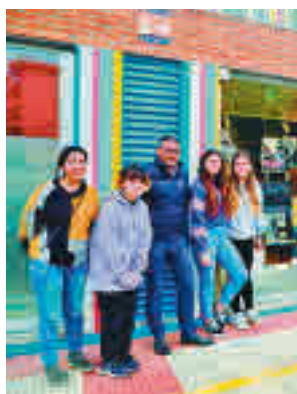
Presentación del estudio

ONG Plan International, ha presentado la primera parte de un estudio que tiene como objeto la detección de zonas consideradas inseguras por las mujeres. Ahora, Imagina acoge los 12 paneles de las zonas de la ciudad que 600 mujeres de 14 a 25 años han identificado a través del ma-