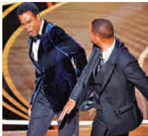
Chris Rock y Will Smith, ¿héroes o villanos?

EL PERIÓDICO GENTE NO SE RESPONSABILIZA NI SE IDENTIFICA CON LAS OPINIONES QUE SUS LECTORES Y COLABORADORES EXPONGAN EN SUS CARTAS Y ARTÍCULOS