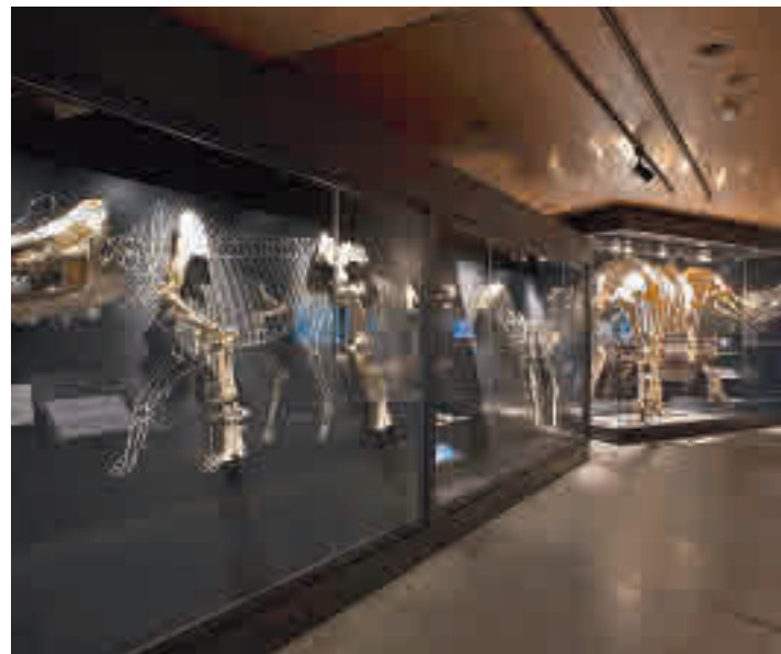
Sala de paleontología madrileña: La recientemente inaugurada sala de Emiliano Aguirre, dedicada a la paleontología madrileña, expone los primeros hallazgos de fósiles en las terrazas del río Manzanares, un espacio privilegiado por su singular riqueza geológica y paleontológica.

gabinete mediante el examen directo de restos originales, que permitirá identificar piezas dentales y craneales de mamíferos y reptiles.