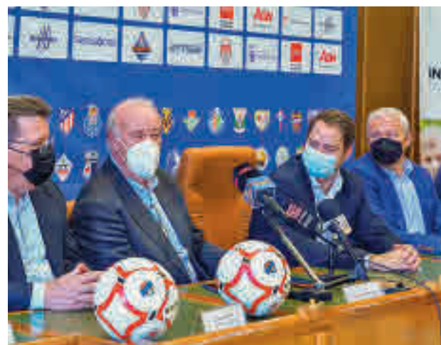
Vicente del Bosque, en la presentación AYTO. TORREJÓN

des de la XI edición de este torneo en el que participarán algunas de las mejores canteras del fútbol. A nivel nacional, destaca la presencia del Real Madrid, Atlético de Madrid o Barcelona, entre otros. Además, también participarán el París Saint Germain (Francia), el Oporto (Portugal), el FC Dallas (Estados Unidos) o el Wakatake (Japón), entre otros equipos internacionales. Y junto a todos ellos, la ciudad estará representada por uno de los equipos benjamines de la AD Torrejón CF. “Torrejón de Ar-