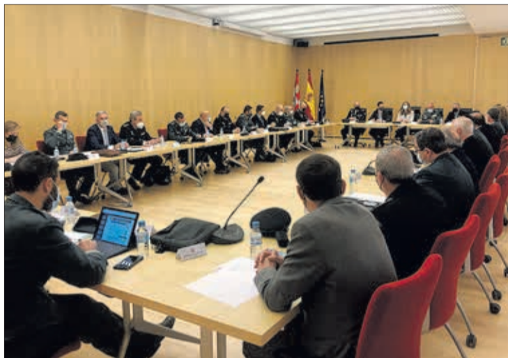
La Comisión de Asistencia se reunió en el CENIEH, el lunes 28.

Por otro lado, se refirió a la distribución de 600 tratamientos del medicamento Paxlovid contra la Covid-19 en Castilla y León, concretamente 225 tratamientos en el Complejo Asistencial Universitario de Burgos para su redistribución al resto de la región. También abordó el tema de los paros en el transporte, de manera que, en