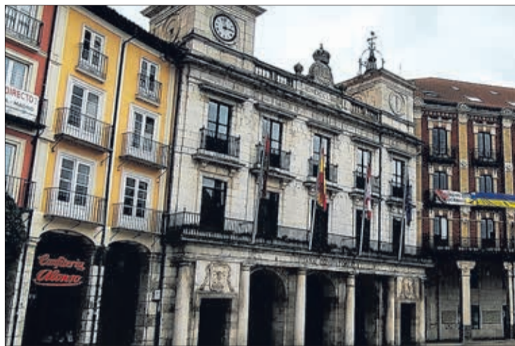
El Ayuntamiento aprobará la modificación presupuestaria en un pleno extraordinario.

Asimismo, el primer edil se refirió a la cultura y el deporte en materia de inversión. Concre-