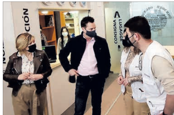
El alcalde, con la concejala de Servicios Sociales, y miembros de ACCEM, en el hostel.

En el hostel estaban acogidos el lunes 74 refugiados ucranianos: 30 hombres, 44 mujeres y 28 niños.