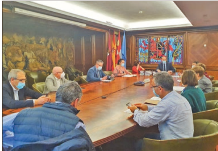
Junta de Gobierno Local del Ayuntamiento de León reunida el viernes 25 de marzo.

De acceder al citado Programa de Rehabilitación, el Ayuntamiento prevé invertir 4 millones de obras en la remodelación de cada uno de estos edificios, 8 millones de euros en total. Las obras consistirán en mejorar la eficiencia energética, en la mo-