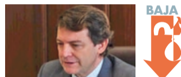
Alfonso Fernández Mañueco