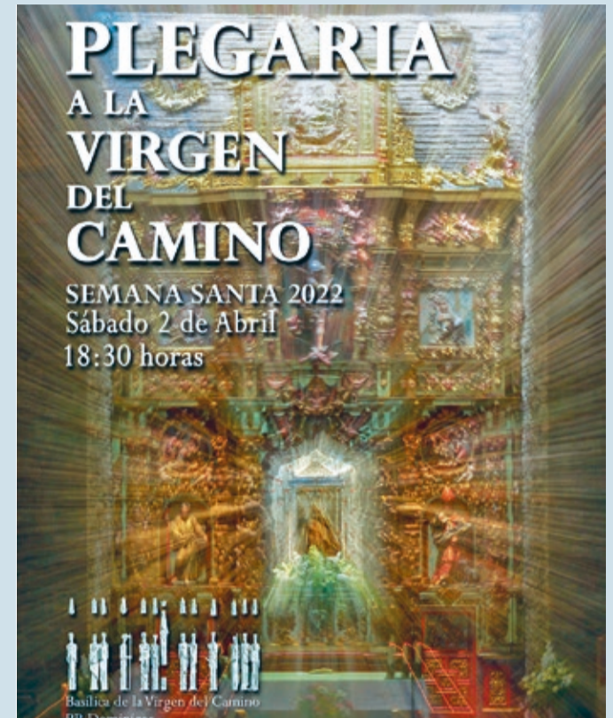
Cartel anunciador de la Plegaria a la Virgen del Camino de este sábado 2 de abril.

SEMANA SANTA | SE CELEBRA DESDE 2006 CON COFRADÍAS DE TODA LA PROVINCIA