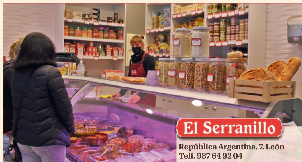
El Serranillo República Argentina, 7. León Telf. 987 64 92 04