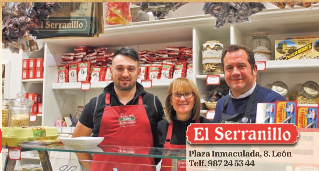
El Serranillo Plaza Inmaculada, 8. León Telf. 987 24 53 44