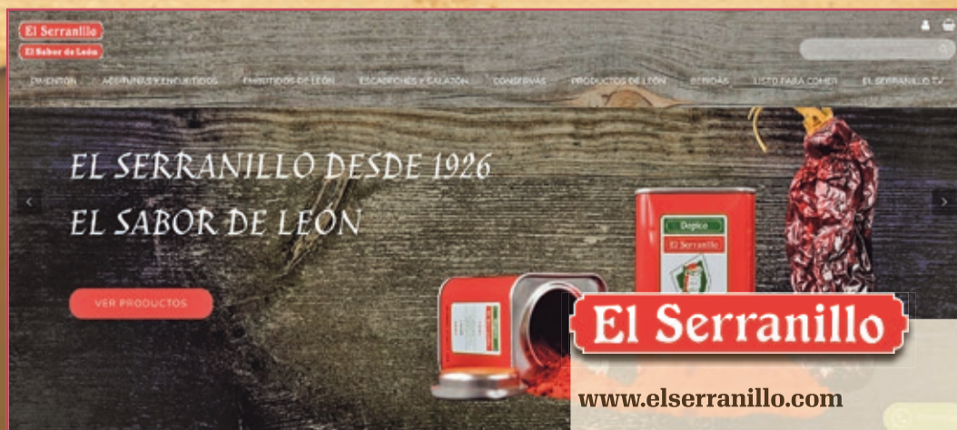
El Serranillo www.elserranillo.com