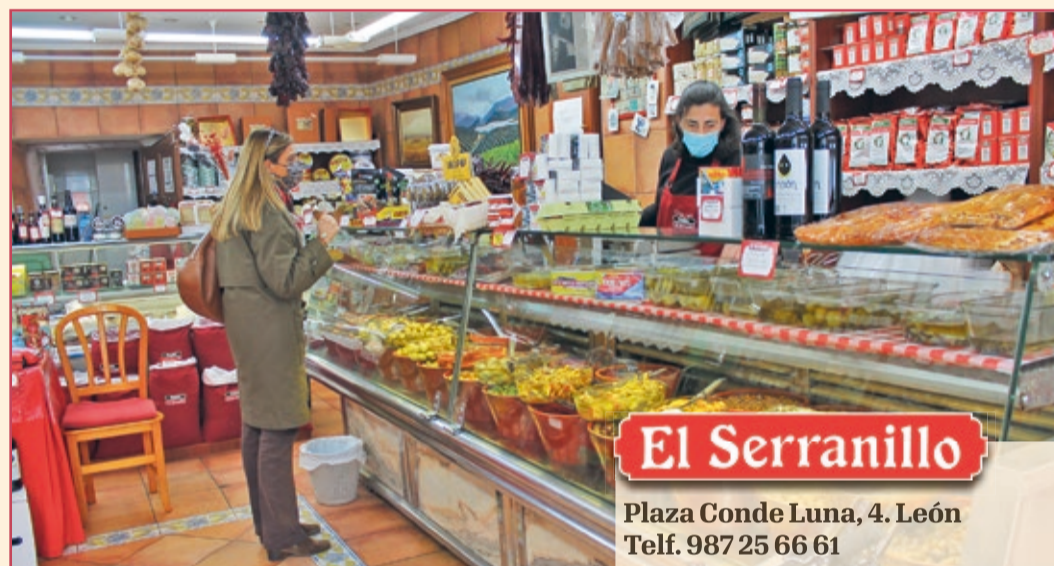
El Serranillo Plaza Conde Luna, 4. León Telf. 987 25 66 61