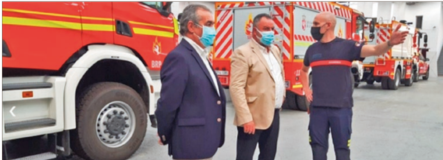
Los vehículos del SEPEIS ya fueron adquiridos y permanecen custodiados en una nave del polígono industrial de Villacedré.

SEGURIDAD | El mantenimiento anual del servicio se calcula en 7,4 millones, por eso se seguirán reclamando fondos a la Junta