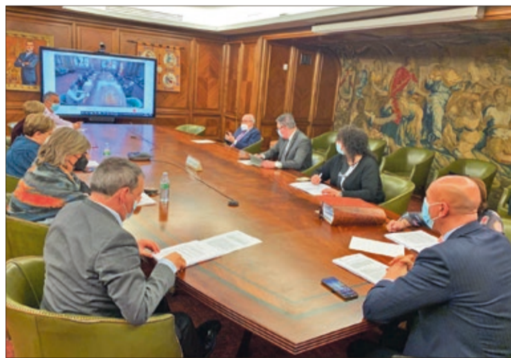
Junta de Gobierno Local del Ayuntamiento de León reunida el viernes 18 de marzo.

Asimismo, aprobó la convocatoria de la XLVIII edición del Premio Nacional de Poesía 'González de Lama', dotado con 6.000 euros; 25.000 euros para la Asociación Leonesa Séptimo Arte (ASLE) para la celebración y organización del IX Festival de Cine y Televisión 'Reino de León' 2022; y 25.000 euros para la Junta Mayor de Cofradías