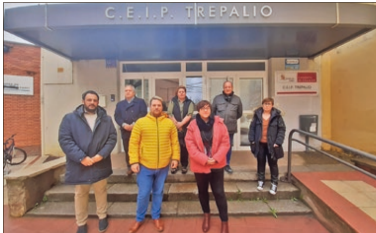
El PSOE de San Andrés, la alcaldesa y concejales, reclaman obras de mejora en los centros educativos del municipio y en especial en el colegio Trepalio de Trobajo.

Gallego también pide a la Junta que "cumpla con la PNL que llevó el PSOE en la anterior legislatura y que fue aprobada por todos los grupos", en la que, entre otras medidas, se instaba a construir un nuevo edificio