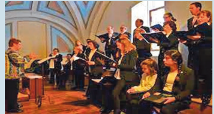
El Coro Facundino cantará el domingo 27 a las 12:00 horas en la Plaza Mayor

MÚSICA | POR EL RESTABLECIMIENTO DE LA PAZ EN EL MUNDO