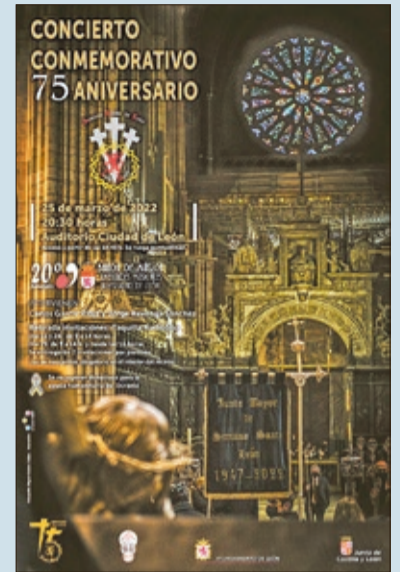
Cartel del concierto de la Junta Mayor.