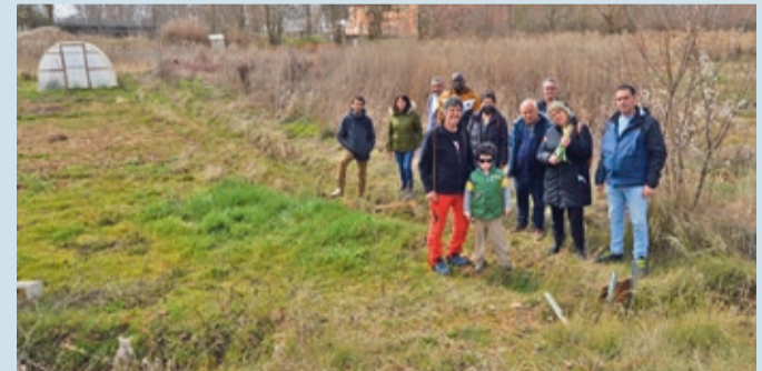
Quince vecinos de Sahagún y Comarca participaron en este curso.

CAMPO | IMPARTIDO POR LA ASOCIACIÓN AGRELE EN EL CTC-780