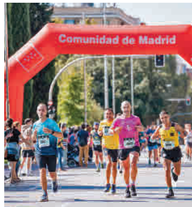
La maratón regresa a Madrid este domingo 24