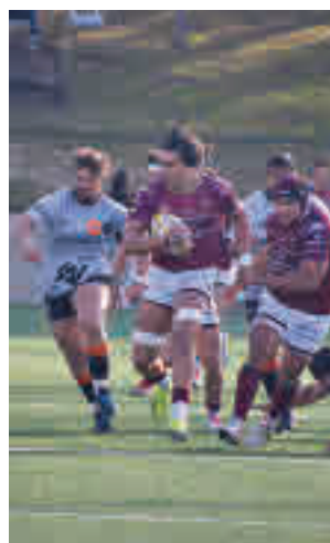
Test serio para el Alcobendas