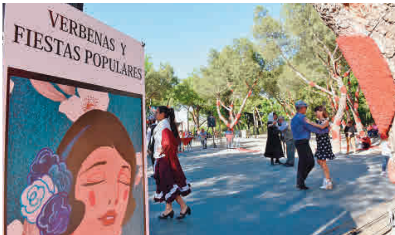
Una de las actividades de la última edición que se pudo celebrar antes de la pandemia