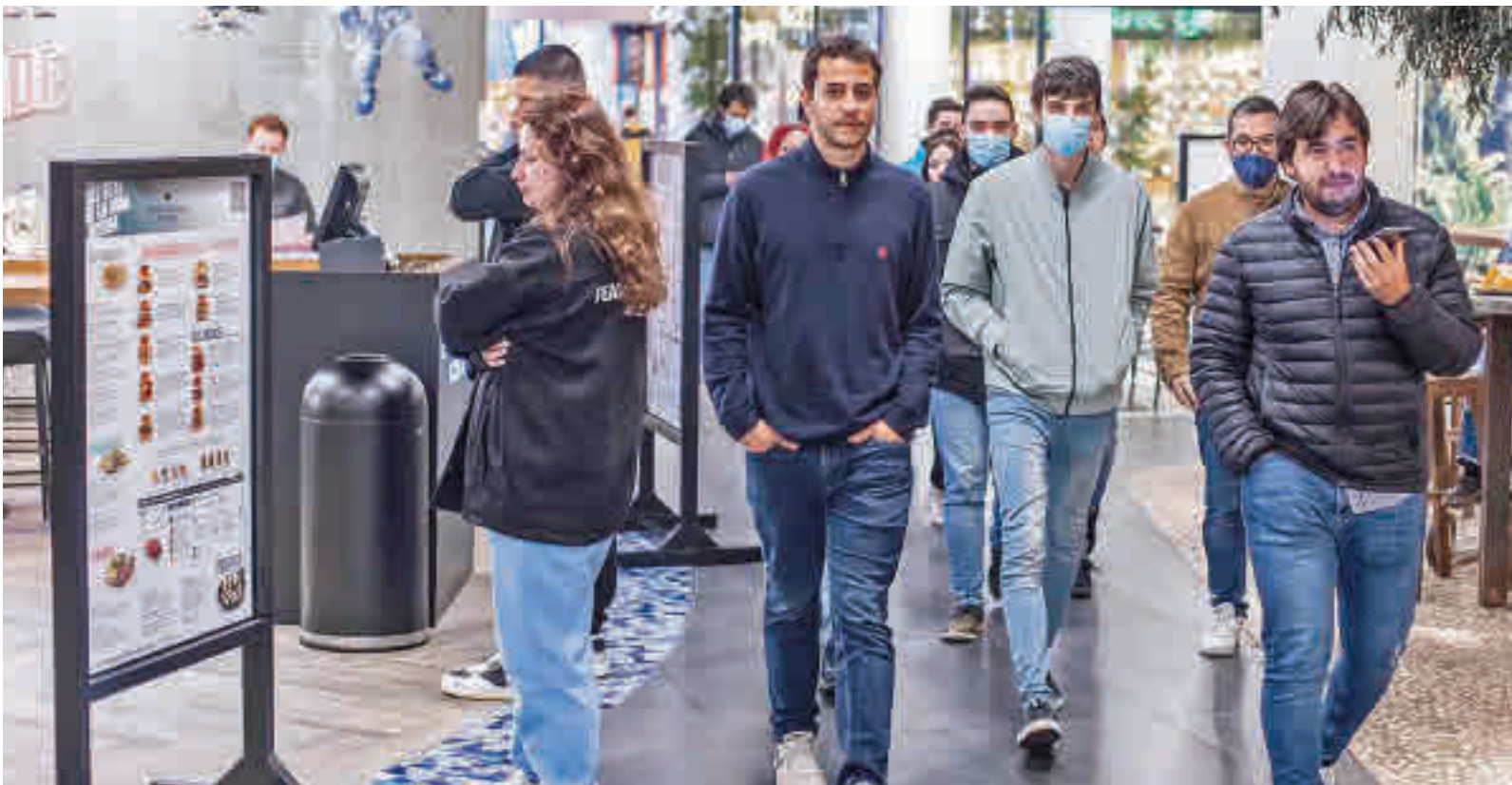
Las mascarillas ya no son obligatorias en la mayoría de los espacios interiores