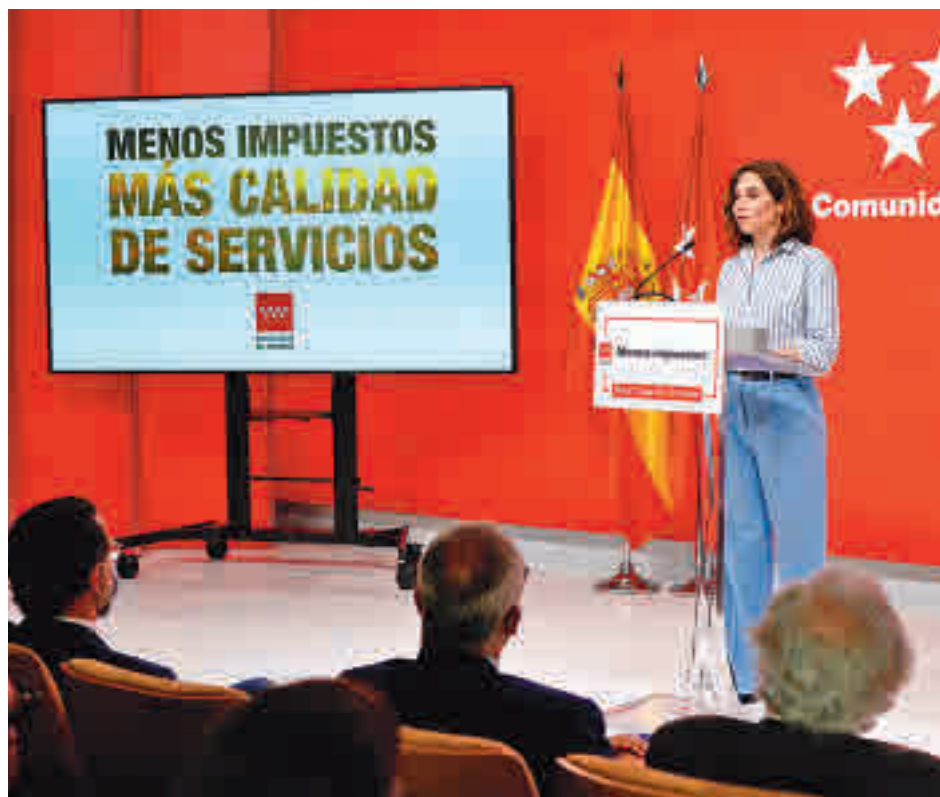
Isabel Díaz Ayuso, durante la presentación de la calculadora

Con esta aplicación, de una “manera intuitiva y fácil de manejar”, cualquier persona que tenga su domicilio fiscal en la región podrá saber qué parte de sus ingresos anuales se dirige a la financiación de servicios públicos como sanidad, educación, transporte o cultura. Dentro de cada una