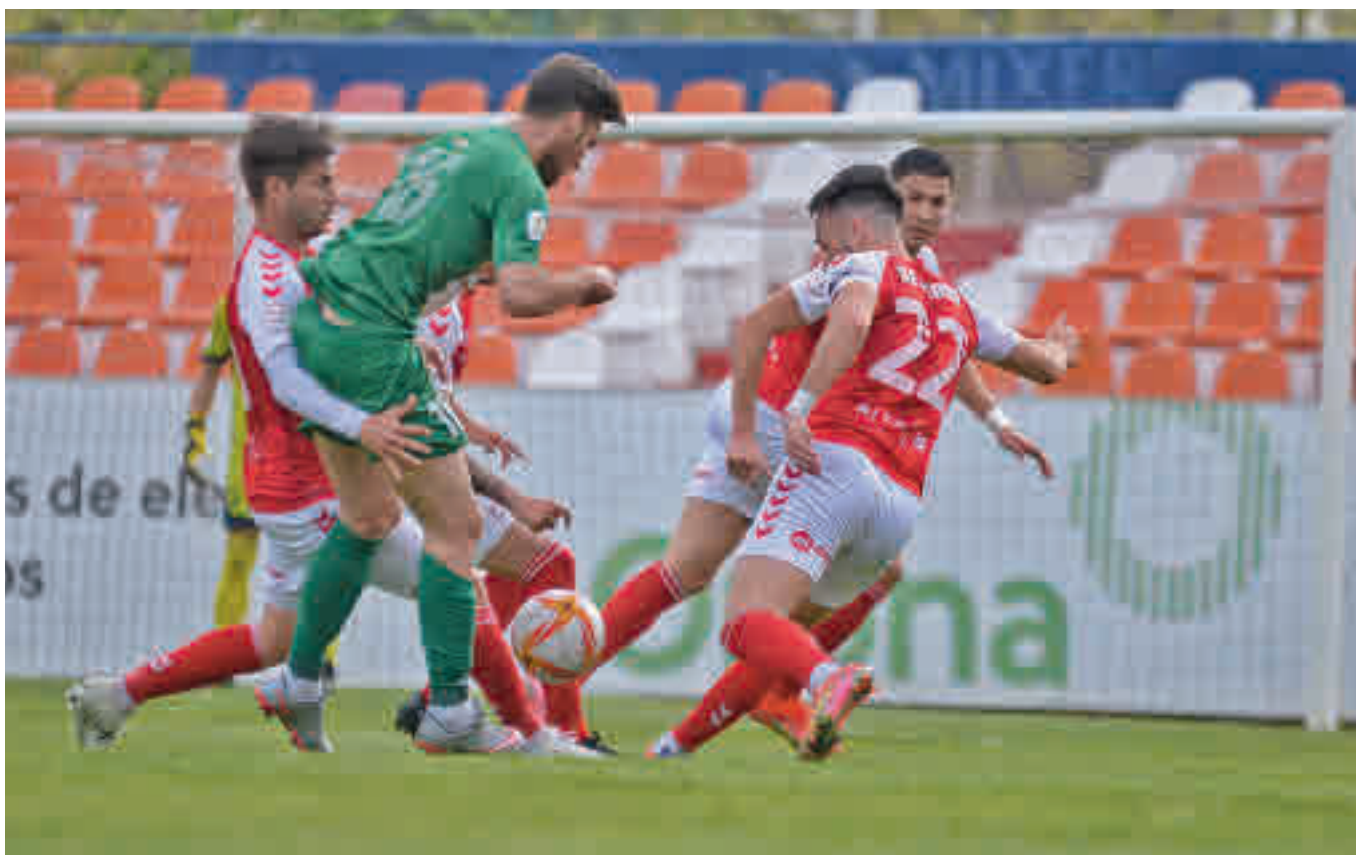
El Alcalá, que descansa esta jornada, aún tiene opciones de alcanzar la promoción de ascenso