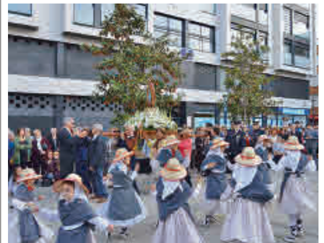
Festejos en Alcorcón

La Policía Local de Parla ha incorporado un dron a su flota, con el que realiza tareas de vigilancia en el mercadillo y en los centros educativos.