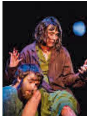
'El hombre almohada'

» Sábado 23, 19 horas. Teatro Municipal. Precio: 14-16 euros.