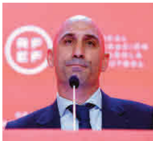
Luis Rubiales, presidente de la RFEF

EL PERIÓDICO GENTE NO SE RESPONSABILIZA NI SE IDENTIFICA CON LAS OPINIONES QUE SUS LECTORES Y COLABORADORES EXPONGAN EN SUS CARTAS Y ARTÍCULOS