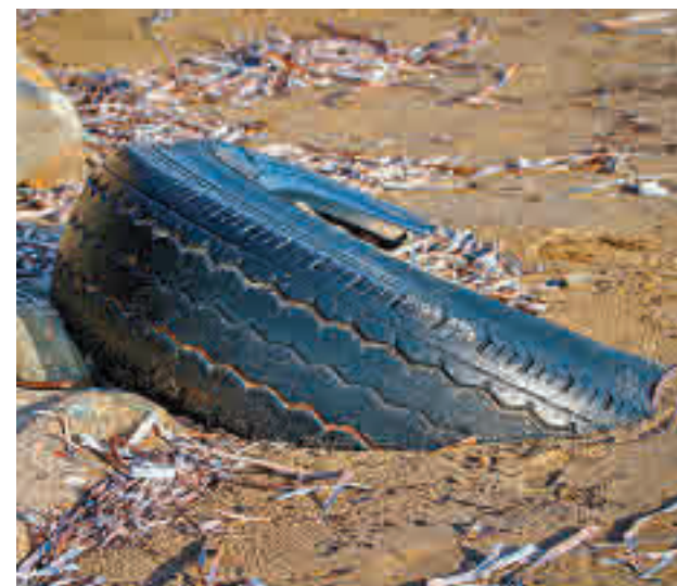
Neumático abandonado en una playa E.P.

proyecto 'Abandono de Neumáticos Fuera de Uso en espacios de Red Natura 2000: Análisis del fenómeno, reducción y valorización del residuo', ha informado la universidad en un comunicado. Este proyecto va a permitir la identificación de puntos de alta incidencia de neumáticos fuera de uso en el litoral español y contribuir a su tratamiento en colaboración con