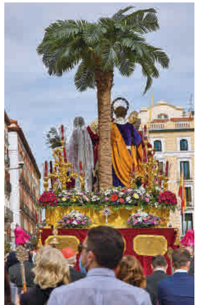
Procesión de Semana Santa en Madrid

“Estamos muy contentos y pensamos que hay motivos para el optimismo”, concluyó la máxima responsable del turismo madrileño.