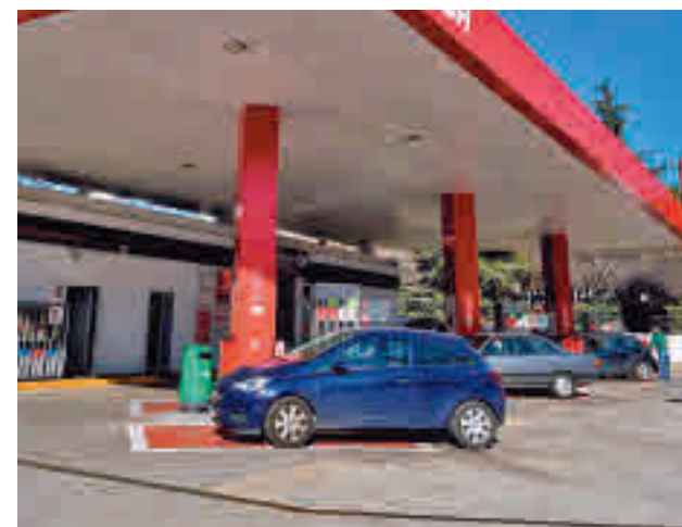
Gasolinera en la Comunidad de Madrid

Lasquetty ha recordado a Garzón que “los servicios de inspección de consumo de las comunidades autónomas no ostentan competencia alguna en la supervisión de los mercados de hidrocarburos, que le corresponde a la Comisión Nacional de Mercados y Competencia”.