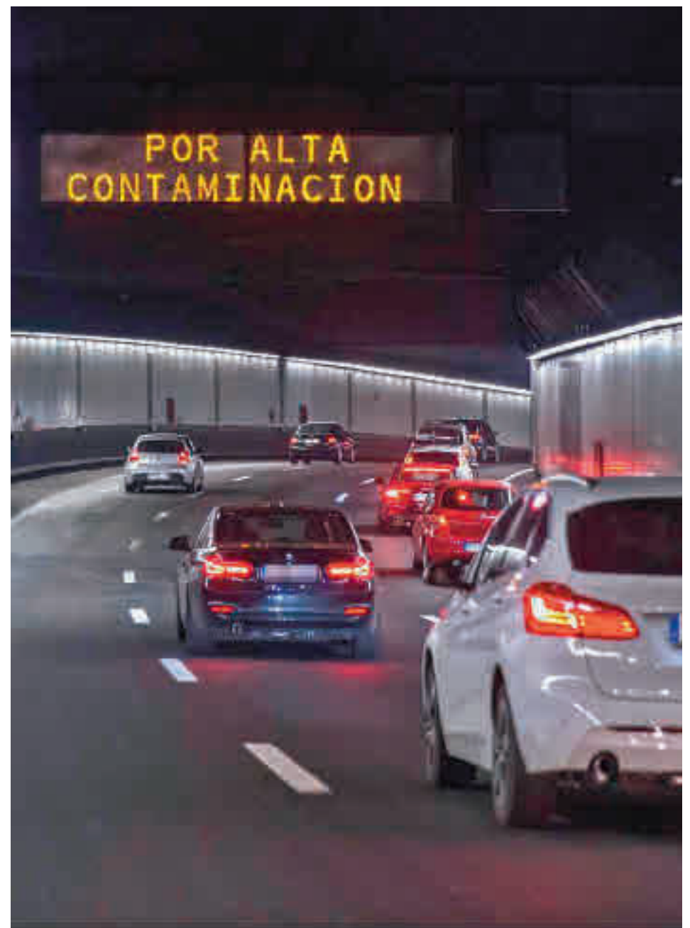
Cartel informativo de un episodio de alta contaminación en el túnel de la M-30

NeumaticOUT tiene prevista una duración de 8 meses y cuenta con un presupuesto de 267.450 euros. Asimismo, el proyecto incluye dos acciones de retirada de neumáticos en dos espacios marinos de la Red Natura 2000 con la colaboración de aso-