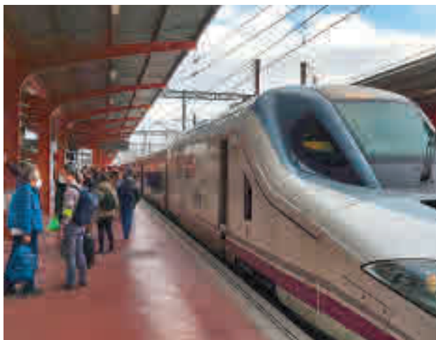
Un tren de alta velocidad, en las instalaciones ferroviarias

La programación organizada por la Junta Municipal contempla un gran abanico de actividades para los próximos días, entre las que destacan la actuación de grupos del barrio (viernes 29 de abril, 22 horas, recinto ferial de la calle de Afueras a Valverde); la XXIX Carrera Infantil (sábado 30, 11 horas); el pasacalles de Gigantes y Cabezudos (domingo 1 de mayo, 18 horas); y el lanzamiento de fuegos artificiales (el mismo día, a las 23 horas en el Parque de Fuencarral).