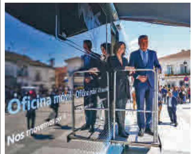
Visita de Díaz Ayuso a Villamantilla

El método que utilizaban los miembros de este grupo consistía, sirviéndose de unos amplios conocimientos sobre el funcionamiento de los sistemas informáticos adquiridos de manera autodidacta desde muy temprana edad, en introducirse en los programas destinados a la gestión de nóminas para alterar su normal funcionamiento y lograr cambiar la domiciliación bancaria de las mismas. Tras la obtención fraudulenta del dinero, el siguiente paso consistía en desviar el capital hacia cuentas que la organización criminal poseía. A través de una plataforma de compra-venta de activos digitales, el capital conseguido ilícitamente se convertía en criptomonedas, dificultando así la trazabilidad del dinero defraudado.