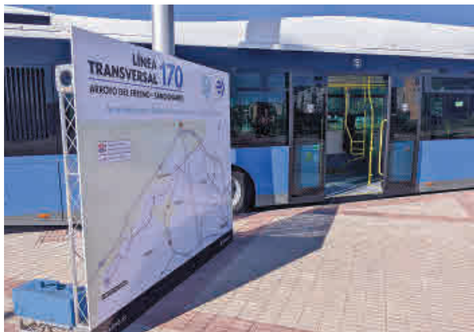
Una de las cabeceras del nuevo itinerario urbano

Las cabeceras están situadas en las calles de María de