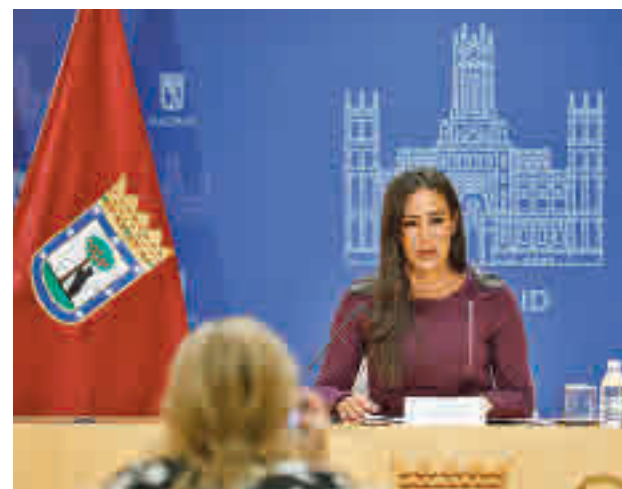
La vicealcaldesa presentó el informe en el Palacio de Cibeles

Por otro lado, Madrid es percibida por su población como una ciudad segura, alcanzando una media de 7,3 que representa una mejora