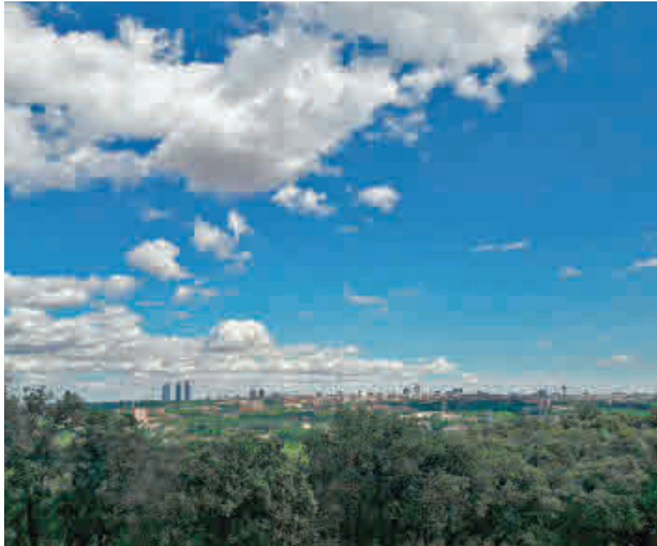
El cielo de la capital, visto desde sus alrededores

Entre las mejores, se encuentra la incorporación de un nuevo Índice de Calidad del Aire, el índice CAQI