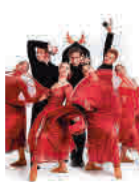
La danza llega a Las Rozas

» Sábado 30, 20 horas. Teatro CC Pérez de la Riva. Precio: 12 euros