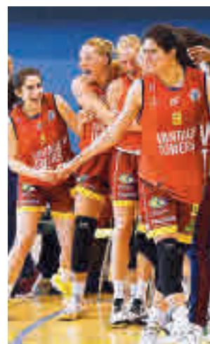
Gran curso del Alcobendas

El conjunto alcobendense disputará la primera semifinal este sábado 30 (17 horas) con el Hozono Global Jairis como rival, precisamente el equipo que ejerce como anfitrión. La otra semifinal la disputarán el Recoletas Zamora y el Manuela Fundación Raca, quedando la gran final para el domingo (12:30 horas).