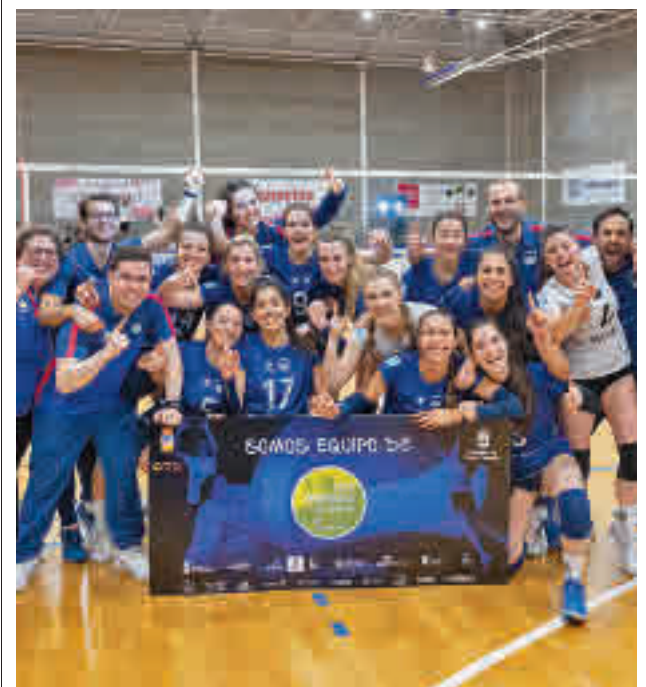
Celebración del conjunto madrileño RFEVB

Tampoco ha faltado la polémica en las horas previas, ya que jugadores como Fernando Verdasco o Pablo Andújar se han mostrado muy críticos con la concesión de las denominadas 'wild cards' (invitaciones). En el cuadro femenino, Paula Badosa querrá dar un paso más en su brillante trayectoria tras conquistar el puesto número 2 del ranking WTA. En su camino hacia el título no estará finalmente otra de las grandes favoritas, la polaca Iga Swiatek, baja de última hora.