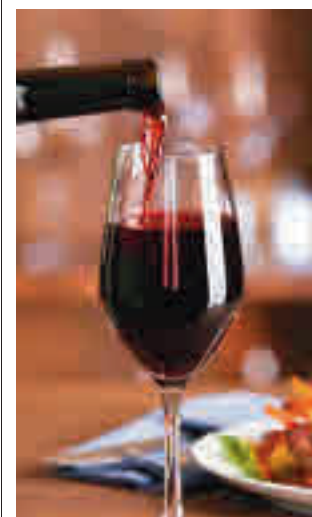
Restaurante en Madrid

to de vista social y también territorial". "Los consejeros no saben dónde están los pobres. Si se fuera a preguntar a cualquier trabajador de sus municipios verá que hay trabajadores que no llegan a final de mes". Por ello, pidió una redistribución justa de la riqueza y que no se devuelvan los salarios.