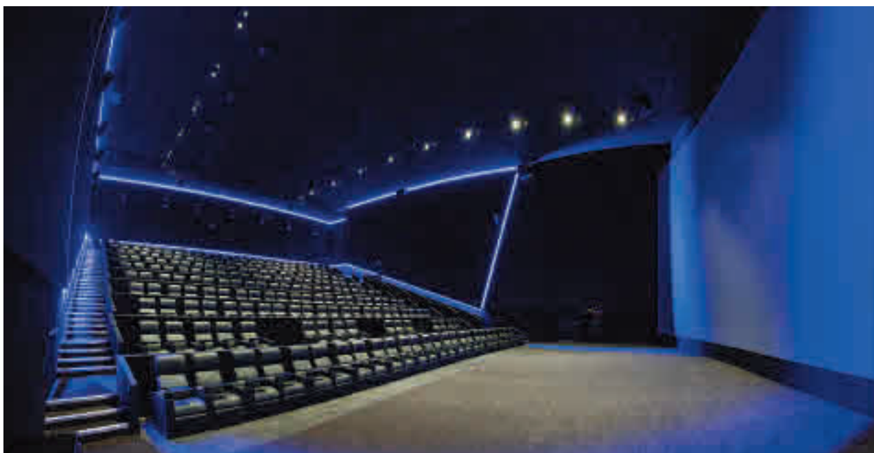
Las salas del Centro Comercial Oasis cuentan con butacas confortables y una gran oferta gastronómica

» Viernes 29, 19:30 horas. Factoría Cultural. Precio: 3 euros