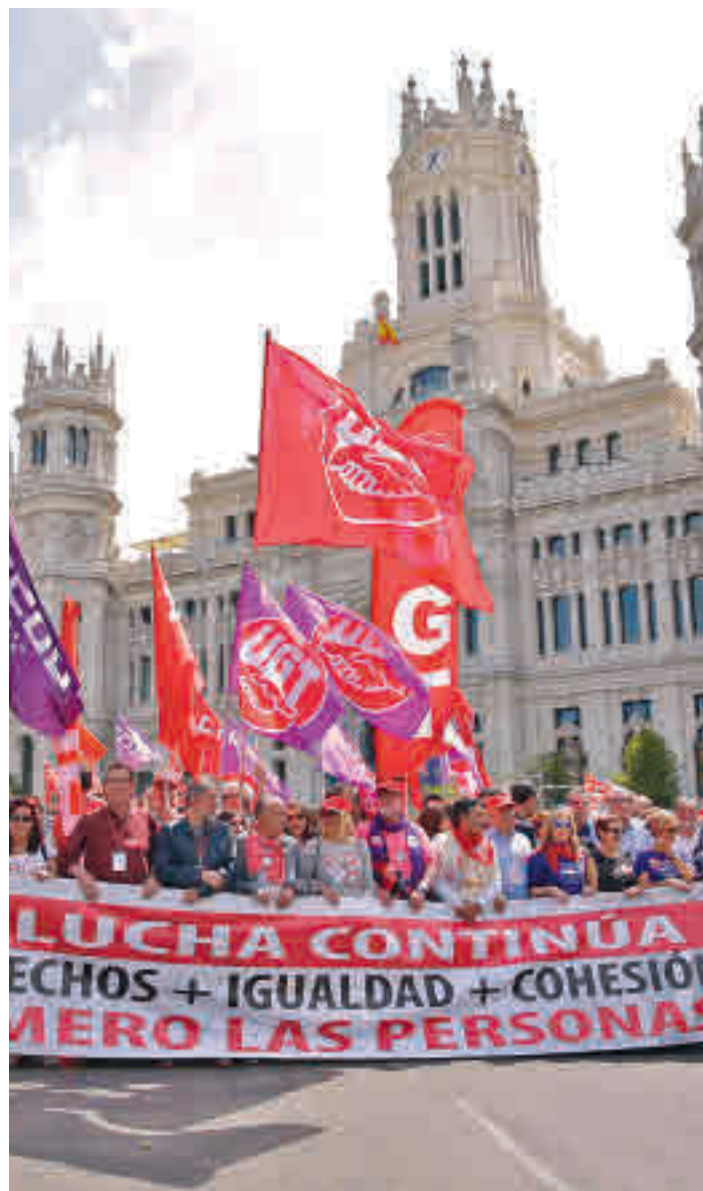
Manifestación del Día del Trabajo

CCOO y UGT saldrán a las calles de la capital este 1 de mayo para celebrar el Día del Trabajo • La negociación colectiva, la redistribución de la riqueza y los precios son sus objetivos