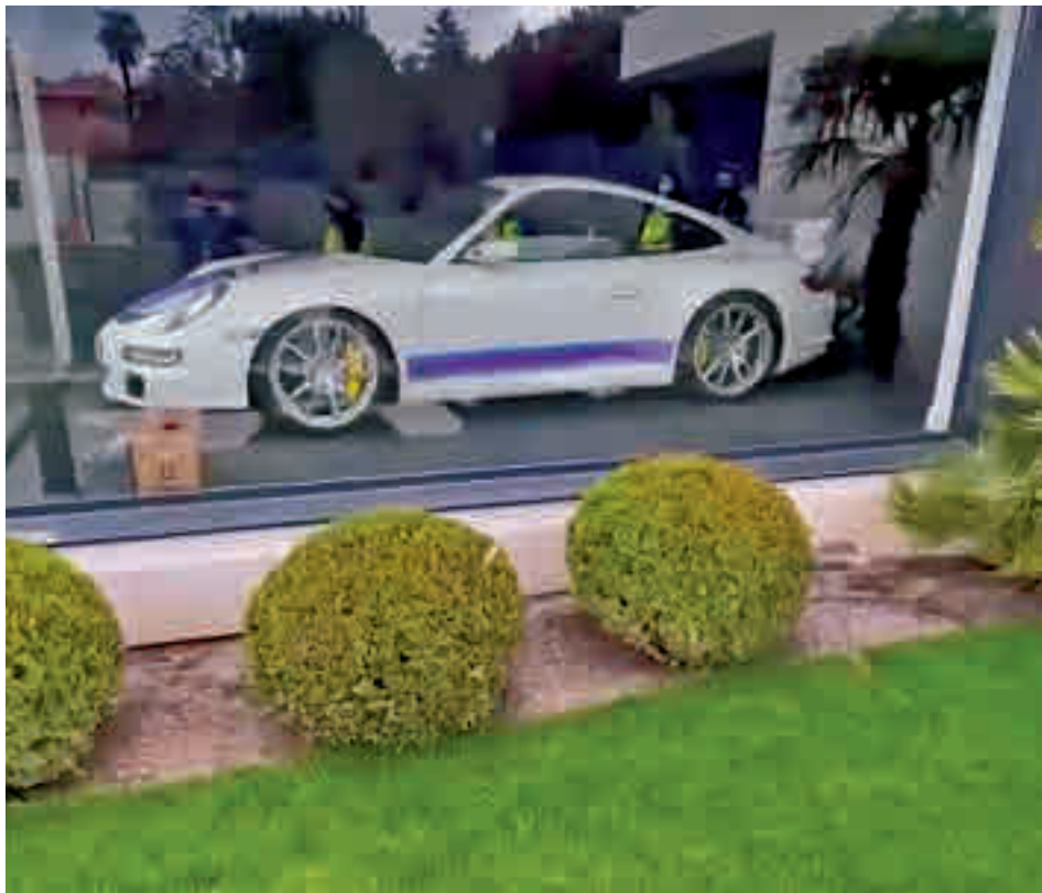
Algunos de los vehículos que se han incautado

SE HAN INTERVENIDO CUATRO VEHÍCULOS DE ALTA GAMA