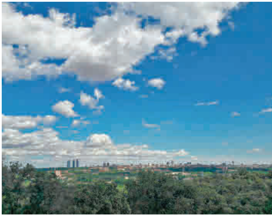
El cielo de la capital, visto desde sus alrededores