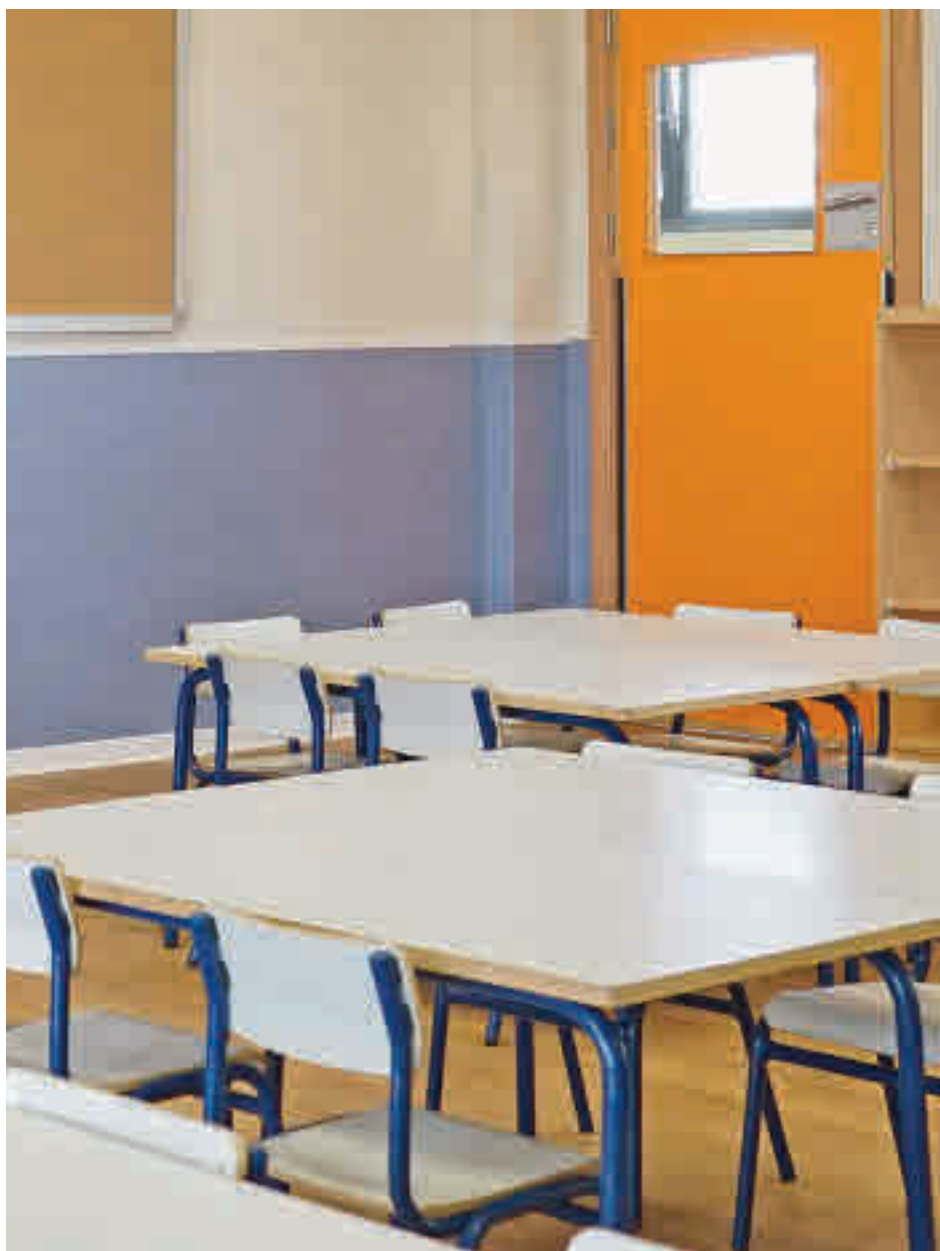
Las aulas para niños con TGD se incrementarán el próximo curso

Se trata del mayor aumento en términos absolutos y porcentuales registrado durante los más de veinte años de existencia del Programa para atender a este alumnado y supone la creación de 165 nuevas unidades y 820 plazas en colegios públicos, concertados e institutos, ha informado el Gobierno regional en un comunicado. Esta importante ampliación de la capacidad para atenderles su-