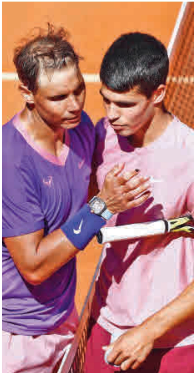
Nadal y Alcaraz, en su enfrentamiento del año pasado

Eso sí, el destino quiso que también sea la primera edición que no esté presente Manolo Santana, un nombre sin el que no se puede entender completamente el desarrollo de un torneo que se ha convertido en una cita casi obligada para quienes preparan el asalto a Roland Garros. Y, cla-