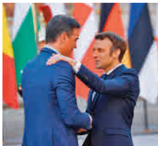
Pedro Sánchez y Emmanuel Macron

EL PERIÓDICO GENTE NO SE RESPONSABILIZA NI SE IDENTIFICA CON LAS OPINIONES QUE SUS LECTORES Y COLABORADORES EXPONGAN EN SUS CARTAS Y ARTÍCULOS