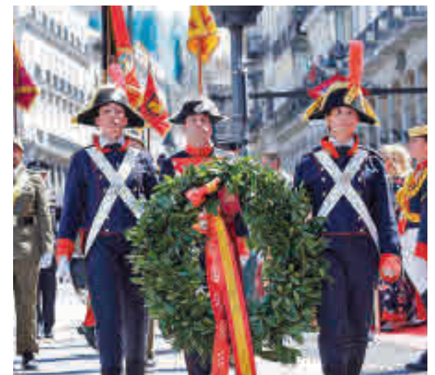
Fiestas del Dos de Mayo

La Comunidad también ha organizado un ciclo de cine en el que bajo el título 'IV Centenario de la canonización de San Isidro. Contrastes', se proyectarán los días 1 y 2 de mayo, en el Cinestudio del Círculo de Bellas Artes, varias películas.