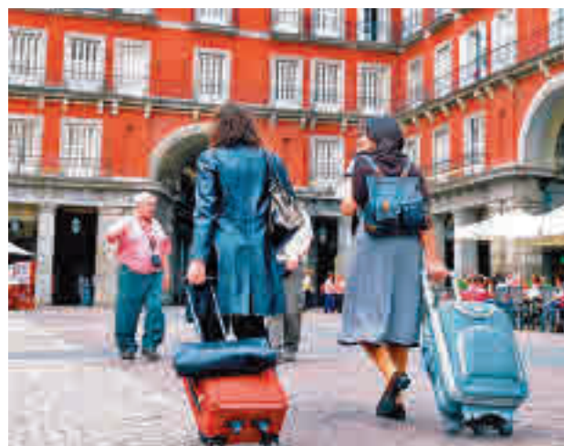
Turistas en el centro de Madrid

En concreto, ha subrayado que se ha recuperado el 90%