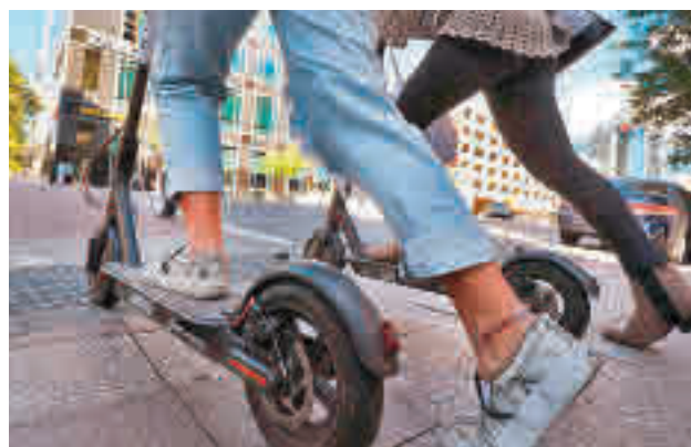
Patinetes en la Comunidad de Madrid

La mitad de los madrileños que se desplazan en bicicletas o patinetes eléctricos no usan habitualmente el casco o supera la velocidad máxima y el 78% circula en alguna ocasión por la acera, según un informe de Línea Directa.