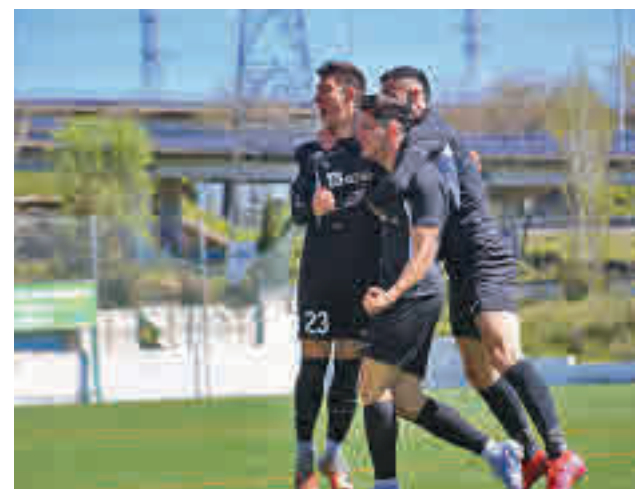
El Paracuellos Antamira, candidato a la promoción

Más dramática se plantea la pelea por evitar el descenso, aunque el Parla lo tiene relativamente fácil, ya que le basta con ganar o empatar con el Moscardó. El Tres Cantos necesita ganar al Alcorcón B y esperar un pinchazo.