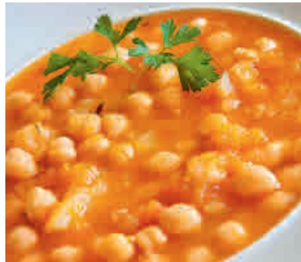
Los garbanzos aportan vitaminas del grupo B y minerales

evolucionar hacia unos niveles saludables y sostenibles, en España, según IMEO, habría que reducir un 84% la ingesta actual de carne y fomentar en un 80% la alimentación de origen vegetal. Tradicionalmente, las fuentes animales han sido las más elegidas por ser completas en cuanto a composición de aminoácidos esenciales (proteínas de alto valor biológico), fáciles de asimilar. Actualmente se sabe que las proteínas de origen vegetal también pueden cubrir estos requerimientos de aminoácidos, si se consumen de forma adecuada, ayudando así a re-