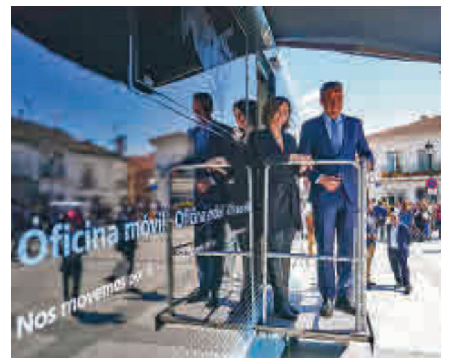
Visita de Díaz Ayuso a Villamantilla

El método que utilizaban los miembros de este grupo consistía, sirviéndose de unos amplios conocimientos sobre el funcionamiento de los sistemas informáticos adquiridos de manera autodidacta desde muy temprana edad, en introducirse en los programas destinados a la gestión de nóminas para alterar su normal funcionamiento y lograr cambiar la domiciliación bancaria de las mismas. Tras la obtención fraudulenta del dinero, el siguiente paso consistía en desviar el capital hacia cuentas que la organización criminal poseía. A través de una plataforma de compra-venta de activos digitales, el capital conseguido ilícitamente se convertía en criptomonedas, dificultando así la trazabilidad del dinero defraudado.