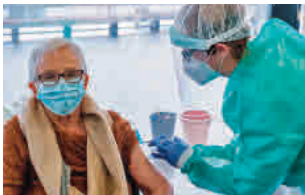
Vacunación en la Comunidad de Madrid

Los sanitarios de los centros públicos de la región ofrecerán a los mayores la posibilidad de hacerlo coincidiendo con sus citas sanitarias o revisiones habituales. La inmunización de las personas