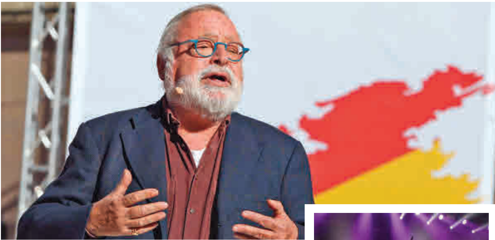
El filósofo y escritor Fernando Savater