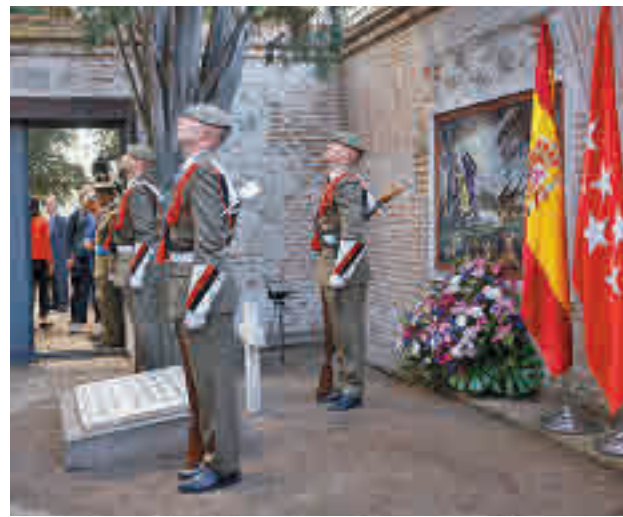
Ofrenda floral en el cementerio de La Florida

Nada más acabar este acto, en el que también participó el pelotón de Honores del Regimiento de Artillería Antiaérea 71, Díaz Ayuso se desplazó a la Real Casa de Correos de la Puerta del Sol para entregar las Medallas de la Comuni-