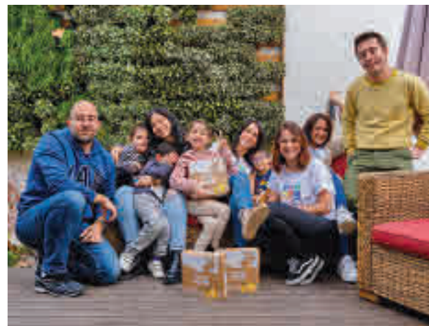
Buena acogida: La CEO y cofundadora afirma que "somos una comunidad aún pequeña, pero el 'feedback' que estamos recibiendo es muy positivo. Los padres destacan que "les permite tener tiempo de calidad en familia, al ser un proceso divertido".

Sobre las trabas que dificultan el emprendimiento, la CEO de WoWplay apunta a factores como la dificultad para conciliar, la financiación y la carga de tareas.