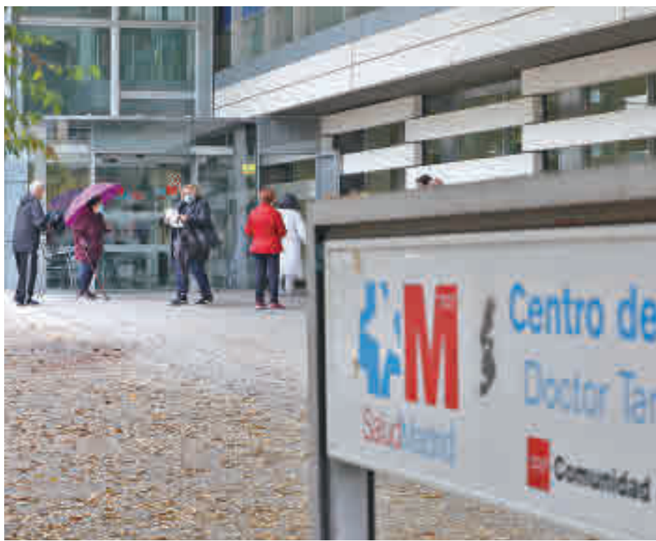
Centro sanitario de la Comunidad de Madrid

Zapatero subrayó que el coronavirus "sigue aquí" y, aunque continúen los contagios, la vacuna protege frente a casos graves. También ocurre en planta, donde hay una estabilización de ingresos y donde la mayoría de pacientes no están ingresados a causa de la infección por coronavirus. Además, ahora la Consejería de Sanidad cuenta con tratamientos para la covid-19 mediante antivirales que ya están utilizando en pacientes con mucho riesgo. "Van las cosas como tienen que ir", concluyó.