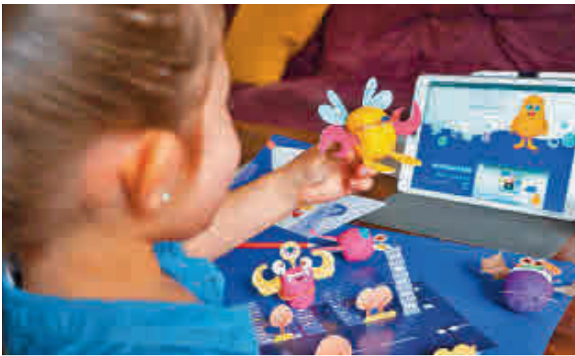
WoWplay tiene un formato híbrido entre el mundo digital y el offline