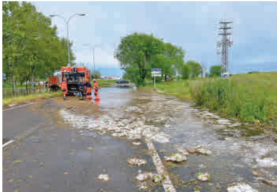
Intervención de los Bomberos en la zona Sur

Los principales incidentes se registraron en Leganés y Móstoles, aunque ninguno