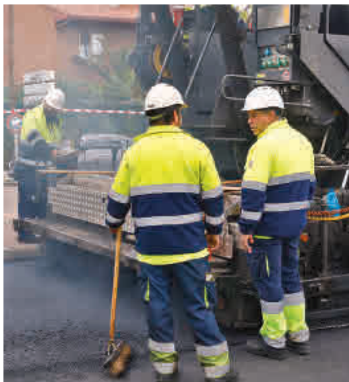
Cinco operarios esparcen el asfalto en la avenida de Logroño

EL ALCALDE PRESENTÓ LA ACTUACIÓN EL PASADO MARTES 3 DE MAYO