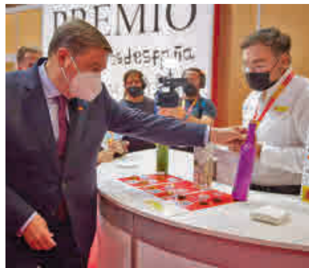
El ministro de Agricultura, Luis Planas, en el Salón Gourmets