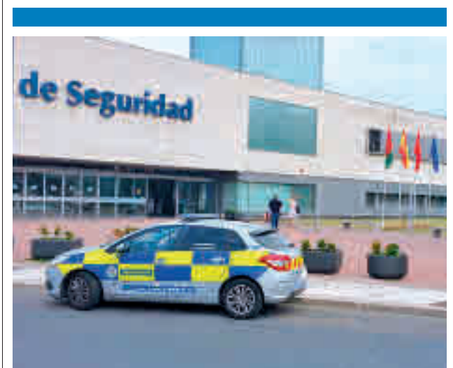
Policía Municipal de Alcorcón

Siempre Así, La Oreja de Van Gogh y Pastora Soler actuarán en Valdemoro dentro de las fiestas patronales que se celebran del 6 al 9 de mayo.