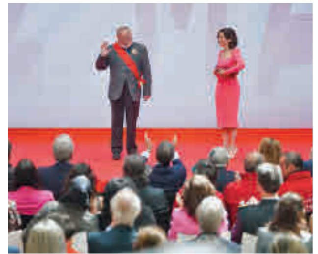
Entrega de los reconocimientos del 2 de Mayo

dad de Madrid y las Condecoraciones del 2 de Mayo. El filósofo Fernando Savater, el cocinero José Andrés, el grupo musical Hombres G, la exjugadora de baloncesto Amaya Valdemoro, el cineasta José Luis Garci, el periodista Luis María Anson y la juventud madrileña fueron algunos de los premiados en esta edición.