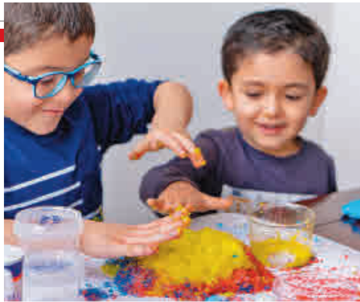
La iniciativa aún a varias disciplinas como la ciencia y las artes