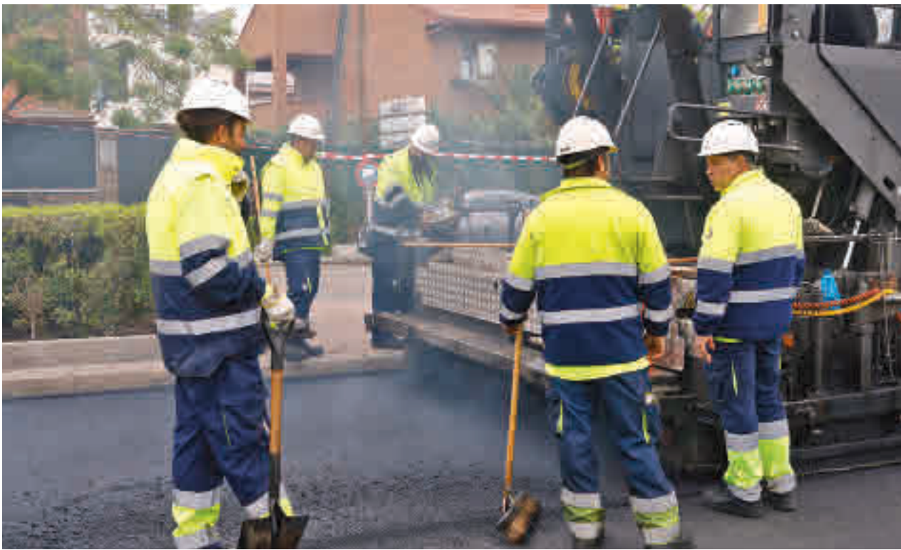
Cinco operarios esparcen el asfalto en la avenida de Logroño