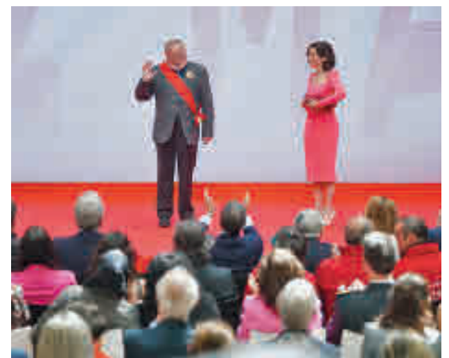
Entrega de los reconocimientos del 2 de Mayo

dad de Madrid y las Condecoraciones del 2 de Mayo. El filósofo Fernando Savater, el cocinero José Andrés, el grupo musical Hombres G, la exjugadora de baloncesto Amaya Valdemoro, el cineasta José Luis Garci, el periodista Luis María Anson y la juventud madrileña fueron algunos de los premiados en esta edición.