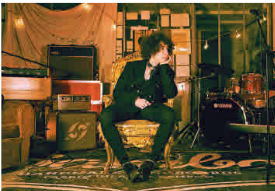
El artista tudelano comienza la gira en la capital AINHOA LAUCIRICA

» Sábado 7, 20 horas. Teatro Adolfo Marsillach. Precio: 18 euros.