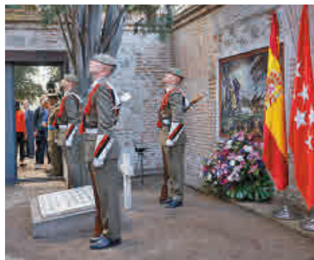
Ofrenda floral en el cementerio de La Florida

Nada más acabar este acto, en el que también participó el pelotón de Honores del Regimiento de Artillería Antiaérea 71, Díaz Ayuso se desplazó a la Real Casa de Correos de la Puerta del Sol para entregar las Medallas de la Comuni-