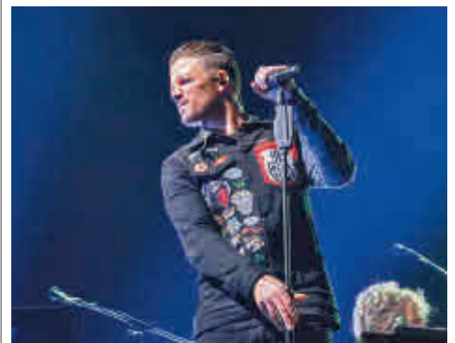
Dani Martín, otro de los artistas que colabora