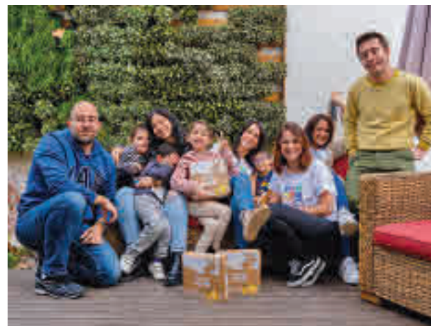
Buena acogida: La CEO y cofundadora afirma que "somos una comunidad aún pequeña, pero el 'feedback' que estamos recibiendo es muy positivo. Los padres destacan que "les permite tener tiempo de calidad en familia, al ser un proceso divertido".

Sobre las trabas que dificultan el emprendimiento, la CEO de WoWplay apunta a factores como la dificultad para conciliar, la financiación y la carga de tareas.