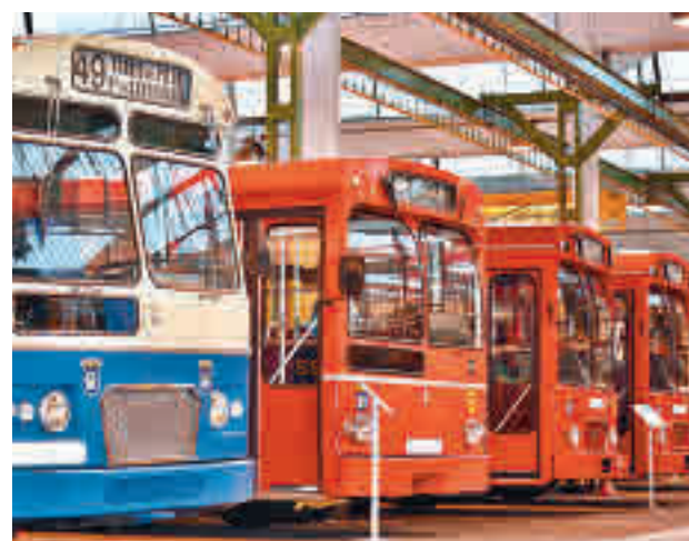
Algunos de los vehículos de la EMT que recorrieron Madrid

Fuentes municipales explican que se trata de un año muy especial, ya que se celebra el 75 aniversario de la compañía. Las visitas están programadas en tres sesiones: 10, 11:30 y 13 horas con un máximo de 30 personas por turno y para acceder es imprescindible reservar la entrada en la web del propio