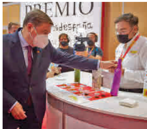
El ministro de Agricultura, Luis Planas, en el Salón Gourmets