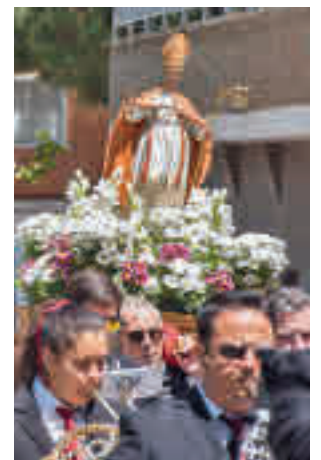
La última edición

Entre las propuestas de ocio destacan la exhibición de deporte canino (el viernes 6 de mayo, 19 horas), el vuelo de cometas (7 de mayo, 11 horas, Parque Forestal Adolfo Suárez), la romería de San Gregorio y posterior merienda en la pradera (el mismo día, 17 horas, desde la plaza