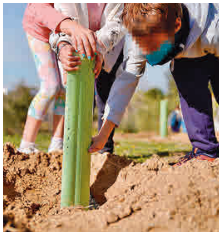
Bosques urbanos en Las Rozas

LA CIUDAD HA PLANTADO UN TOTAL DE 6.504 ÁRBOLES EN EL AÑO 2021