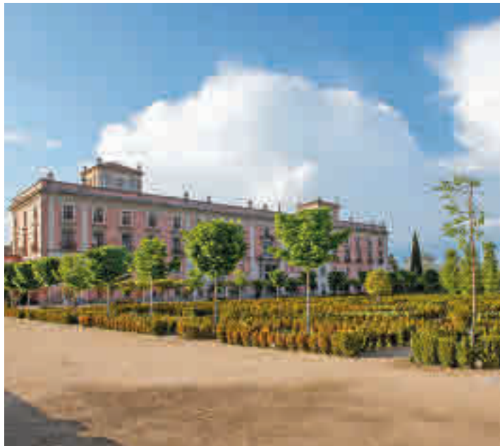
Jardines del Palacio

El Ayuntamiento inaugurará el fin de semana del 14 y 15 de mayo el Mercado de los Jardines de Palacio en los amplios espacios exteriores del Palacio del Infante Don Luis, un edificio neoclásico del siglo XVIII, símbolo de la localidad. Se trata de la primera edición de un mercado que nace con el principal objetivo de dar a conocer, preservar y promover los oficios artesa-