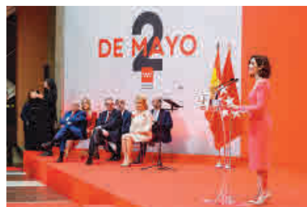
Homenaje en la Real Casa de Correos

Sin casi tiempo para la pausa, y aprovechando que las