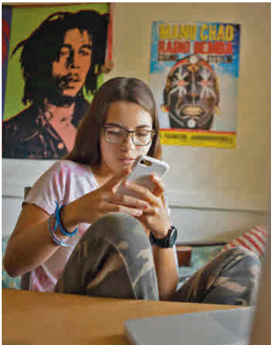
Las pantallas son las grandes compañeras de los jóvenes

El estudio revela descensos en el uso de todos los tipos de plataformas, aplicaciones y herramientas audiovisuales en 2021 respecto a 2020. Este fenómeno era esperable, ya que el confinamiento al que obligó la pandemia disparó el tiempo que los jóvenes y niños dedicaron a las pantallas ante la imposibilidad de salir a la calle o realizar otro tipo de actividades de ocio. Habrá que esperar al año que viene para ver si los números siguen bajando o se estabilizan.