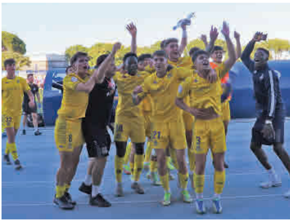
Los jugadores del Alcorcón B celebrando su pase a la final RFFM