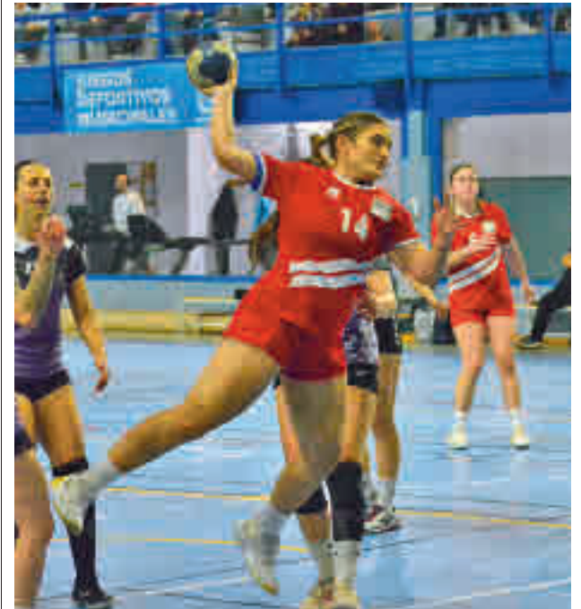
El Base Villaverde busca el ascenso

No será este el único foco de atención para el Base Villaverde, ya que su equipo senior masculino también se juega el ascenso, en su caso a Primera División. El conjunto madrileño disputará una liguilla con Ciudad de Villafranca, Cordoplas BM La Salle y Asociación Abaranera.