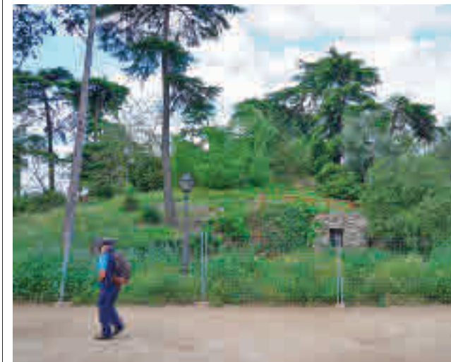
El exterior de la Montaña de los Gatos

Además, la intervención permitirá recuperar las cascadas y láminas de agua, mejorar el trazado y renovar los caminos interiores.