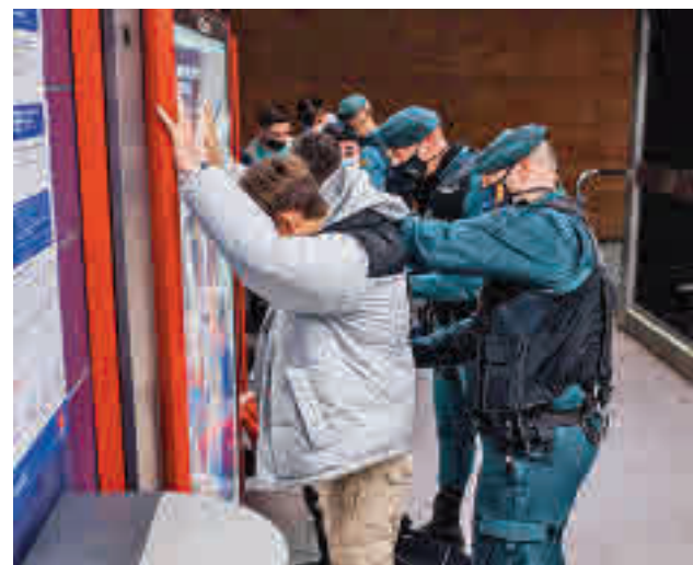
Las autoridades hablan de "buenos resultados"