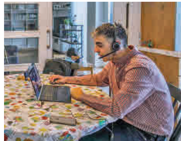
Madrid es la que más teletrabaja

Además, entre las mujeres de 16 a 24 años, solo un 3,4% de las ocupadas teletrabajaba, frente a un 5,5% de hombres. En cuanto a la frecuencia ocasional, hay mayor proporción de mujeres entre los 16 y los 44 años, mientras que a partir de los 45 años es más común encontrar hombres trabajando a distancia menos días por semana.