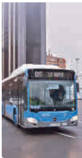
Autobús de la EMT

La EMT ha sido reconocida en la categoría de empresa pública por su proyecto integral para la construcción de una planta de repostado de hidrógeno verde para abastecer a una flota de autobuses de pila de combustible.