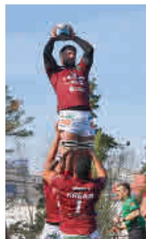
Dudas en el Alcobendas

Por otro lado, el club alcobendense convocó este jueves a sus socios a una asamblea extraordinaria para tratar, entre otras cuestiones, su viabilidad económica.