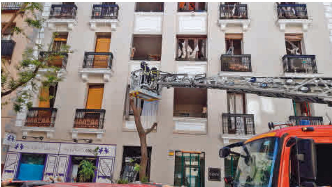
La intervención de los bomberos en la fachada del edificio siniestrado