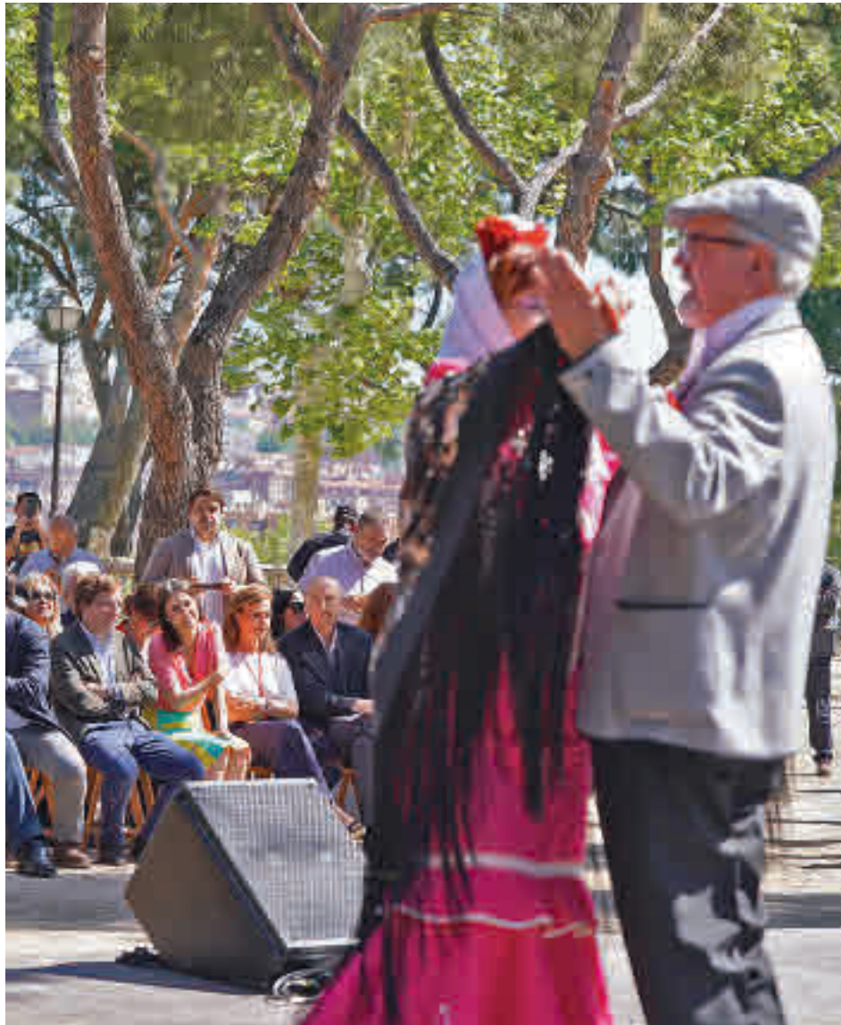
Un momento de la presentación de la programación de 2022

OBK (viernes 13, 22:15 horas, en Carabanchel), Amistades Peligrosas (día 14, 21:30 h, Plaza Mayor), Los Rebeldes (sábado 14, 21 h. en Las Vistillas), Los Chichos y Medina Azahara (día 14, a las 21:30 h y el 15, a las 22:30 h, respectivamente, en la Pradera), o los míticos The Skatalites (domingo 15, 23 h., en Las Visti-