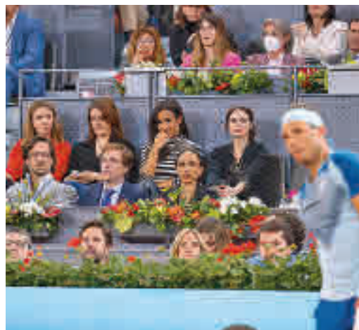
Espectadores ilustres en un partido de Nadal

EL PERIÓDICO GENTE NO SE RESPONSABILIZA NI SE IDENTIFICA CON LAS OPINIONES QUE SUS LECTORES Y COLABORADORES EXPONGAN EN SUS CARTAS Y ARTÍCULOS