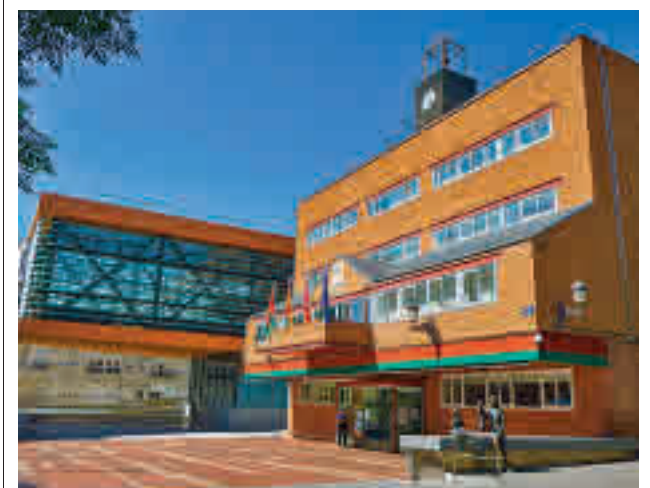
Ayuntamiento de Alcorcón

El Colegio de Guardias Jóvenes de la Guardia Civil de Valdemoro acoge entre el 13 y el 15 de mayo el tradicional concurso de saltos hípicos.