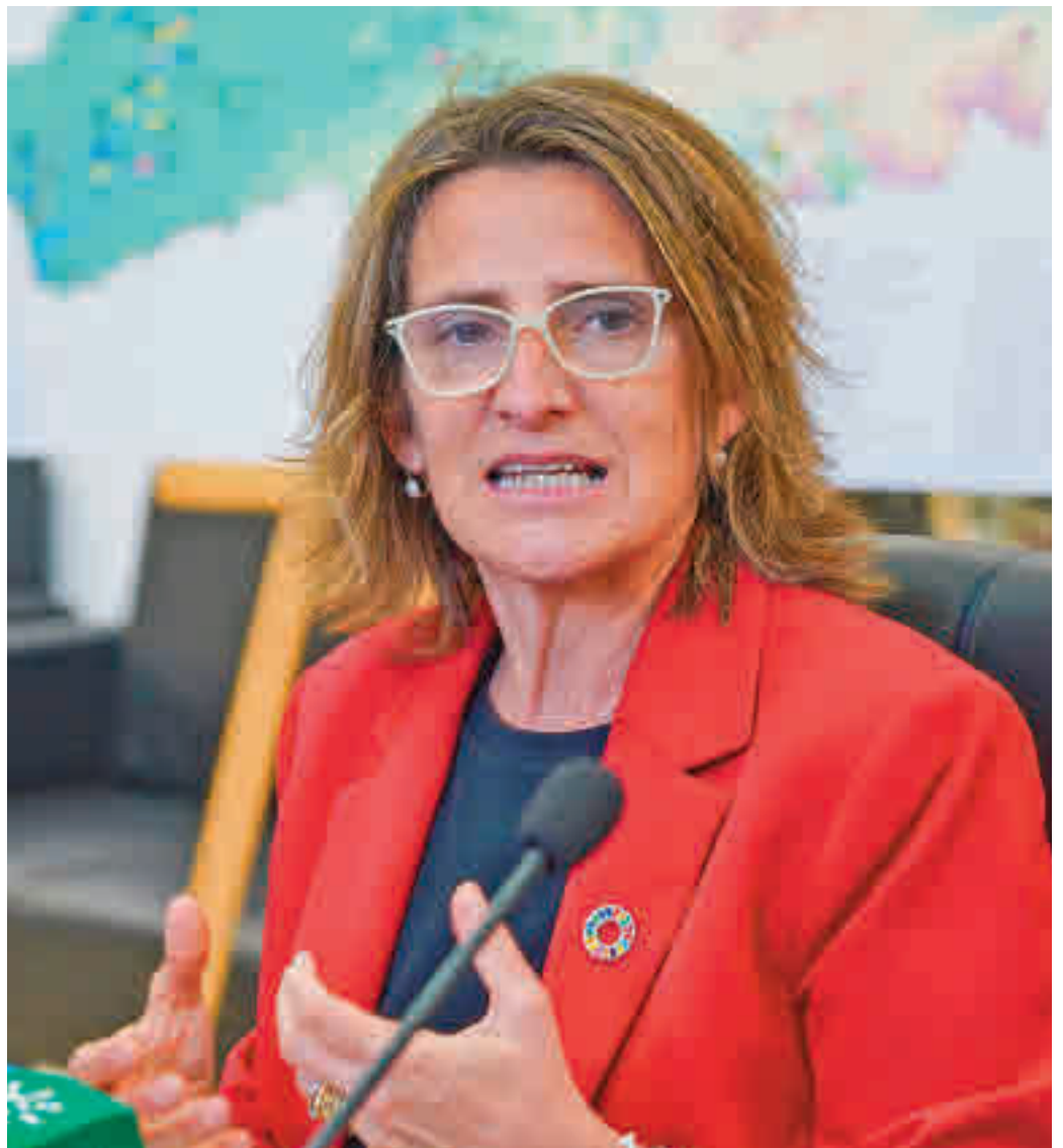
La vicepresidenta tercera del Gobierno, Teresa Ribera

Junto a esta medida, la vicepresidenta tercera del Gobierno y ministra de Transición Ecológica y para el Reto Demográfico, Teresa Ribera, ha anunciado que el Gobierno trabaja en un plan de ahorro y eficiencia energética en el ámbito de la Administración General del Estado (AGE) que aprobará la próxima semana, así como en una serie de "recomendaciones" a la ciudadanía, incluyendo a las empresas, para reducir el consumo de energía y las importaciones de combustibles fósiles. La intención del Ejecutivo es llevar este plan de eficiencia al Consejo de Ministros la próxima semana.