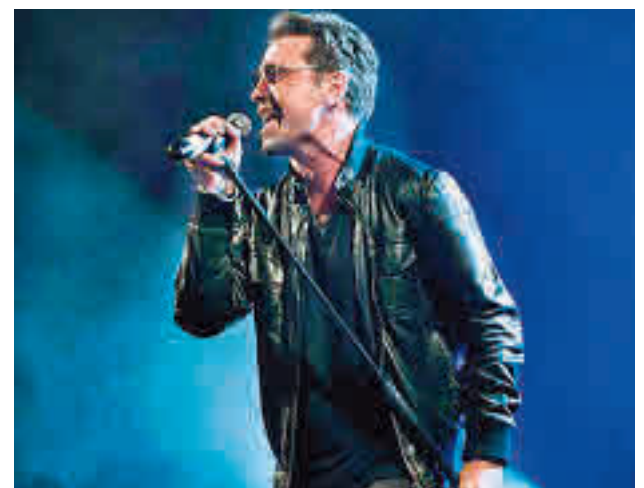
OBK actuará en la Pradera

Sobre el diseño de la actividad, el violinista libanés detalla que, en un principio, "quería componer algo porque es un lugar muy inspirador, pero no hubo tiempo, así que escogimos una música ya hecha". En ese contexto la apuesta por 'Las cuatro estaciones' responde a que "Vivaldi fue un compositor muy innovador, un pionero, que traducía en música todo lo que escuchaba de la naturaleza, imitando los sonidos de los pájaros, de las hojas, del viento...", razona. Aunque se encuentra en plena gira mundial, Ara Malikian ha hecho un hueco en su apretada agenda para 'Los paseos musicales del Real Jardín Botánico' porque "siempre hay que reinventarse, hay que encontrar nuevas sensaciones, nuevos caminos e inspiraciones". Como otros artistas, la pandemia también ha sido un momento de incertidumbre, lo que le hace valorar que "estamos un momento muy esperanzador para que todo vuelva a la normalidad".