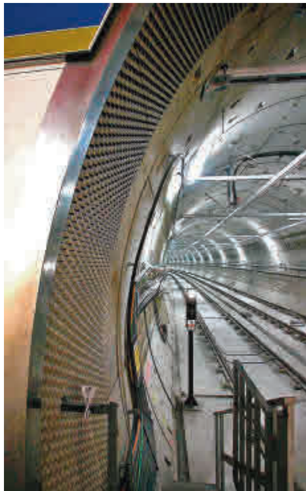
MetroSur podría tener otra conexión más

La conexión de MetroSur con la Línea 11 sería la tercera con el conjunto de la red. La primera, y hasta el momento la única operativa, es