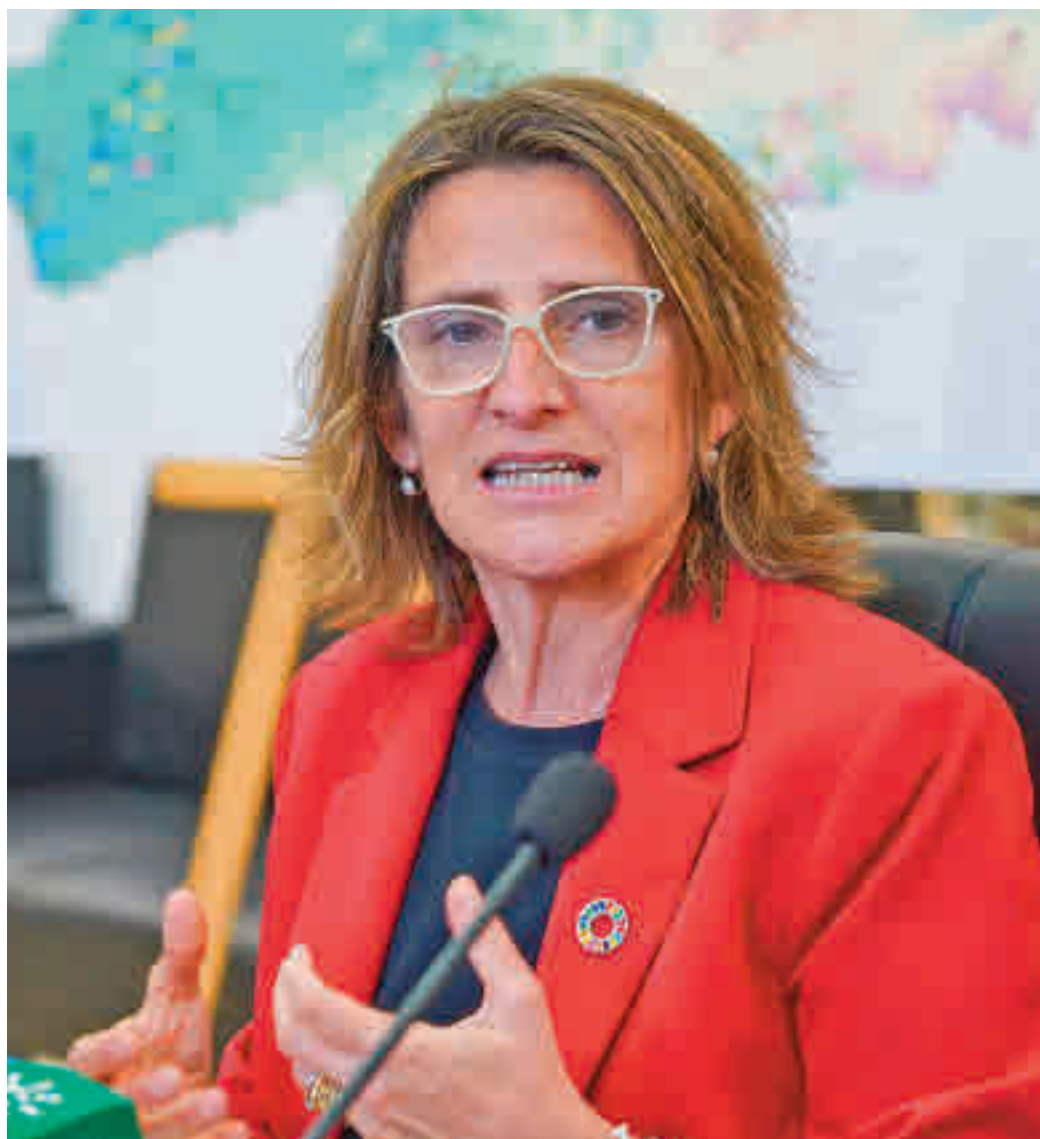
La vicepresidenta tercera del Gobierno, Teresa Ribera

Junto a esta medida, la vicepresidenta tercera del Gobierno y ministra de Transición Ecológica y para el Reto Demográfico, Teresa Ribera, ha anunciado que el Gobierno trabaja en un plan de ahorro y eficiencia energética en el ámbito de la Administración General del Estado (AGE) que aprobará la próxima semana, así como en una serie de "recomendaciones" a la ciudadanía, incluyendo a las empresas, para reducir el consumo de energía y las importaciones de combustibles fósiles. La intención del Ejecutivo es llevar este plan de eficiencia al Consejo de Ministros la próxima semana.