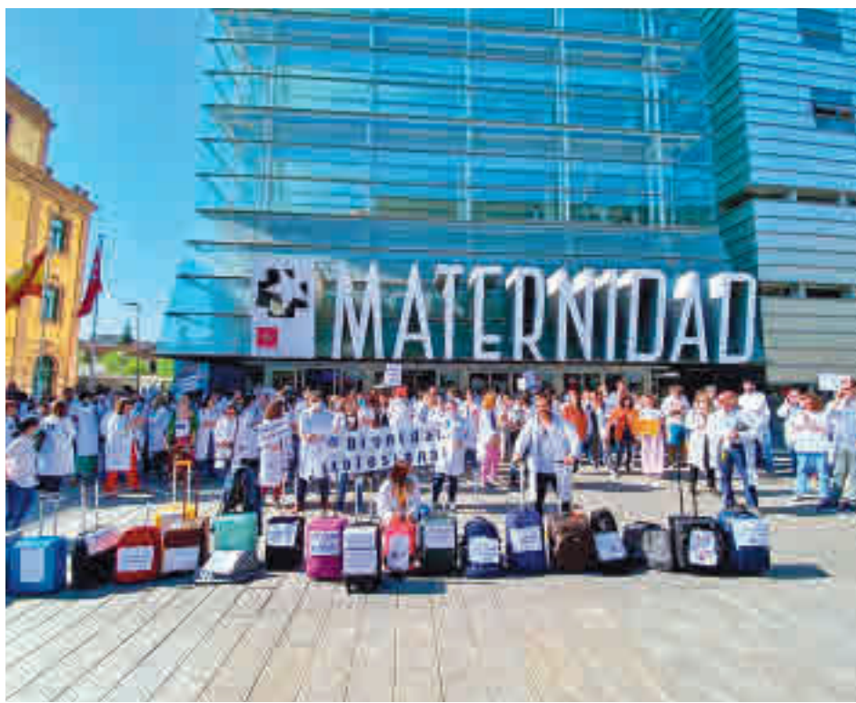
Protesta de los médicos de los hospitales madrileños

España ha obtenido un total de 729 'Banderas Azules' (621 playas, 103 puertos deportivos y cinco embarcaciones turísticas) que ondearán a partir de junio. Son 16 más que el año pasado, siendo la Comunidad Valenciana la región líder en número de playas con 'Bandera Azul'. De este modo, las playas de España, que este año han conseguido seis 'Banderas Azules' más, mantienen el liderazgo a nivel mundial que alcanzaron en 1994, acumulando el 15% del total de los galardones.