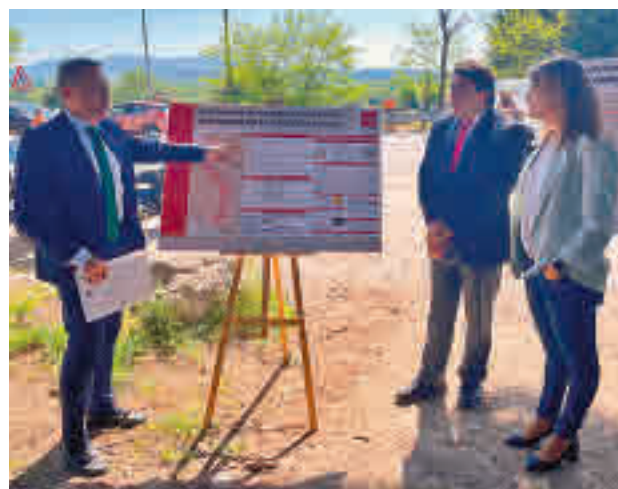
Visita de David Pérez a la carretera M-600

los puedan circular con mayor seguridad y fluidez. Así lo anunció el consejero de Transportes e Infraestructuras, David Pérez, durante la presentación en San Lorenzo del Escorial de las actuaciones. Las labores, que se pro-