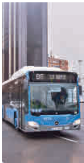
Autobús de la EMT

La EMT ha sido reconocida en la categoría de empresa pública por su proyecto integral para la construcción de una planta de repostado de hidrógeno verde para abastecer a una flota de autobuses de pila de combustible.