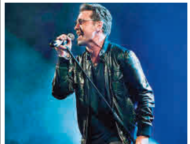
OBK actuará en la Pradera

Sobre el diseño de la actividad, el violinista libanés detalla que, en un principio, "quería componer algo porque es un lugar muy inspirador, pero no hubo tiempo, así que escogimos una música ya hecha". En ese contexto la apuesta por 'Las cuatro estaciones' responde a que "Vivaldi fue un compositor muy innovador, un pionero, que traducía en música todo lo que escuchaba de la naturaleza, imitando los sonidos de los pájaros, de las hojas, del viento...", razona. Aunque se encuentra en plena gira mundial, Ara Malikian ha hecho un hueco en su apretada agenda para 'Los paseos musicales del Real Jardín Botánico' porque "siempre hay que reinventarse, hay que encontrar nuevas sensaciones, nuevos caminos e inspiraciones". Como otros artistas, la pandemia también ha sido un momento de incertidumbre, lo que le hace valorar que "estamos un momento muy esperanzador para que todo vuelva a la normalidad".