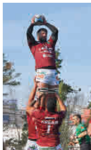
Dudas en el Alcobendas

Por otro lado, el club alcobendense convocó este jueves a sus socios a una asamblea extraordinaria para tratar, entre otras cuestiones, su viabilidad económica.