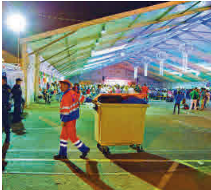
Se colocarán contenedores específicos para cada tipo de envase

Las fiestas de San Isidro en Alcobendas que arrancaron este jueves 12 de mayo están marcadas por la desaparición del plástico, con casetas que utilizarán vasos reciclables, y fuegos artificiales de bajo impacto acústico. Estas son las notas más destacadas de unos festejos en los que la seguridad también tendrá un papel relevante: el dispositivo incluye 150 agentes, seis