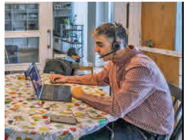
Madrid es la que más teletrabaja

Además, entre las mujeres de 16 a 24 años, solo un 3,4% de las ocupadas teletrabajaba, frente a un 5,5% de hombres. En cuanto a la frecuencia ocasional, hay mayor proporción de mujeres entre los 16 y los 44 años, mientras que a partir de los 45 años es más común encontrar hombres trabajando a distancia menos días por semana.