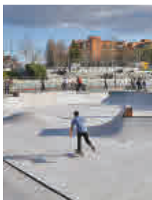
‘Skate park’ de Alcobendas