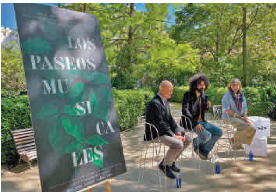
La presentación del evento se llevó a cabo en el propio Jardín Botánico

» Domingo 15, 18 horas. Teatro Adolfo Marsillach. Precio: 10-12 €