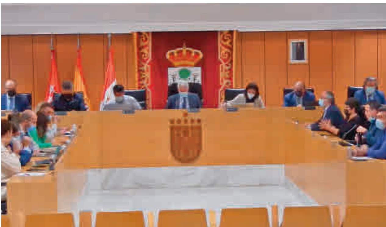
Imagen de archivo de un pleno en San Sebastián de los Reyes