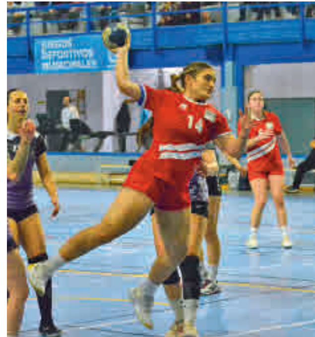
El Base Villaverde busca el ascenso

No será este el único foco de atención para el Base Villaverde, ya que su equipo senior masculino también se juega el ascenso, en su caso a Primera División. El conjunto madrileño disputará una liguilla con Ciudad de Villafranca, Cordoplas BM La Salle y Asociación Abaranera.