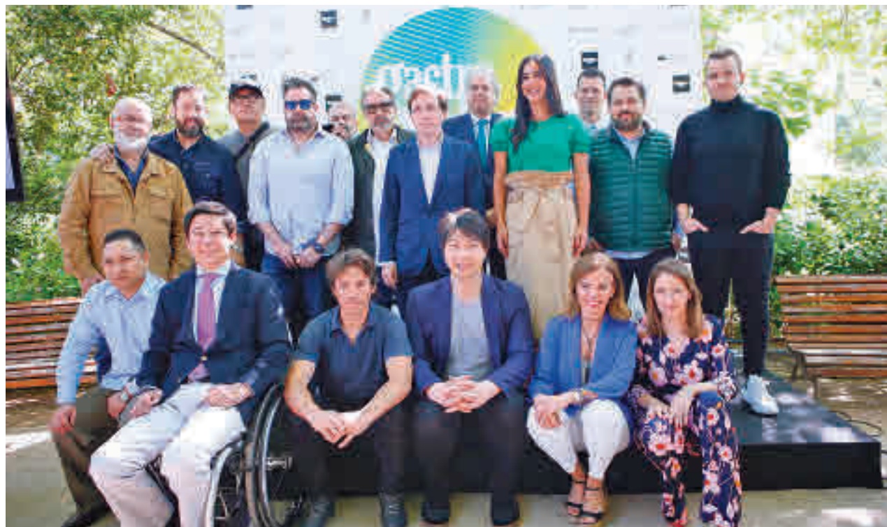
La presentación oficial de la programación tuvo lugar el pasado 10 de mayo

Gastrofestival tiene actividades para los más pequeños, como la visita familiar 'De la mano al tenedor' en el Museo Lázaro Galdiano (21 y 28 de mayo, a las 11 horas), los talleres 'Con la comida sí se juega' del Real Jardín Botánico de la planta pan (21 de mayo, 10 y 11 horas) y de las flores comestibles (28 de mayo, a las 10 y 11 horas) o el taller '¿A qué sabe el mundo?' del Museo Naval (29 de mayo, a las 16 h).