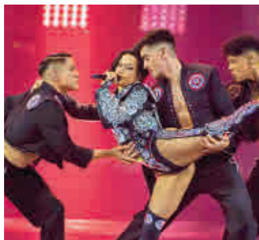
Chanel, durante su actuación en Eurovisión

EL PERIÓDICO GENTE NO SE RESPONSABILIZA NI SE IDENTIFICA CON LAS OPINIONES QUE SUS LECTORES Y COLABORADORES EXPONGAN EN SUS CARTAS Y ARTÍCULOS