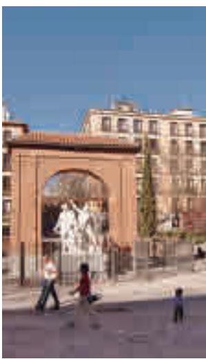
La zona de Malasaña