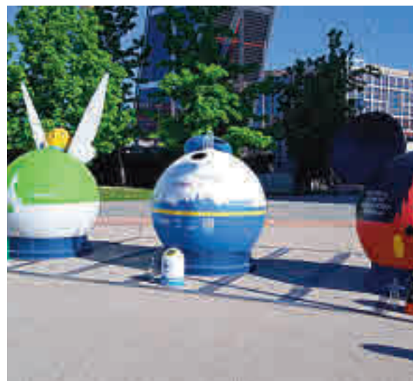
Contenedores temáticos de Disney ECOVIDRIO

dial del Reciclaje. Con motivo de la celebración del 30º Aniversario de Disneyland París, el vidrio reciclado por las familias en los contenedores verdes de Ecovidrio servirá para construir una réplica del Castillo de la Bella Durmiente de Disneyland París que se instalará el 6 de junio en Boadilla del Monte, en la calle Juan de la cierva esquina con Infante don Luis.