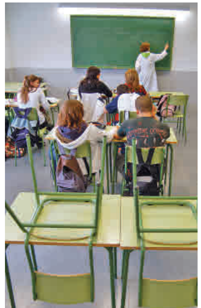
Las clases volverán a principios de septiembre

Los alumnos de 1º de Bachillerato concluirán este mismo día 22, mientras que para los de 2º las fechas se adaptarán a la realización de la evaluación final y de la admisión en las universidades.