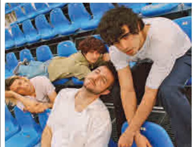
La banda madrileña Carolina Durante

Un mayor de dureza si cabe se puede observar en la tercera sala, 'Dolor y esperanza', que deja paso a un espacio donde se proyecta un vídeo con Diego Rivera. Para cerrar, la cuarta sala incluye el autorretrato 'La columna rota', acompañado por varias fotografías que contextualizan la vida y obra de Frida Kahlo.