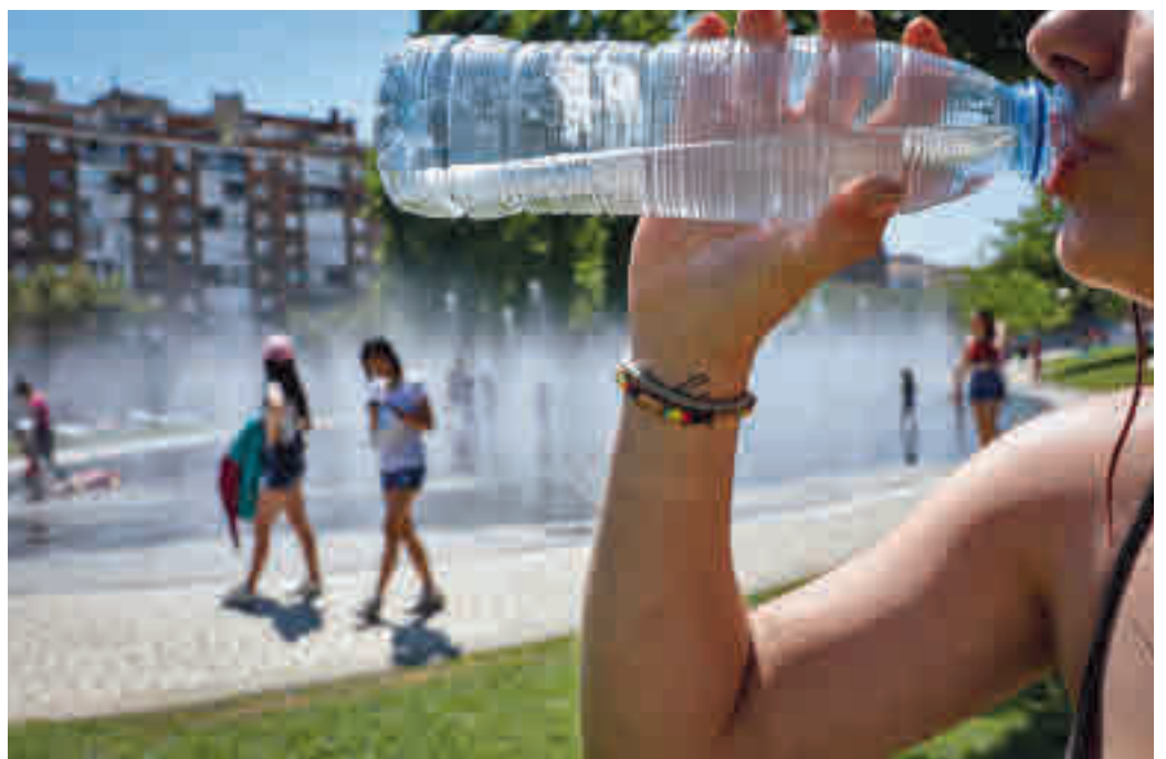
El calor veraniego llega este fin de semana

En cuanto a las precipitaciones, no se descarta que pueda haber chubascos tormentosos propios del verano, por contraste entre el calor en superficie y el aire frío en las capas altas.