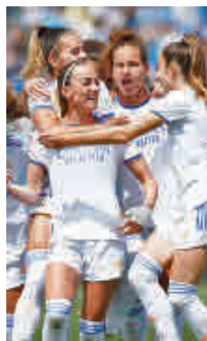
Habrá 'Clásico' en semifinales

Los ganadores jugarán la gran final del domingo 29. El vigente campeón de Liga, el Barça, parte como favorito para reeditar un título que ha ganado en cuatro de las últimas cinco ediciones. Por otro lado, el equipo azulgrana juega este sábado la final de la Champions.