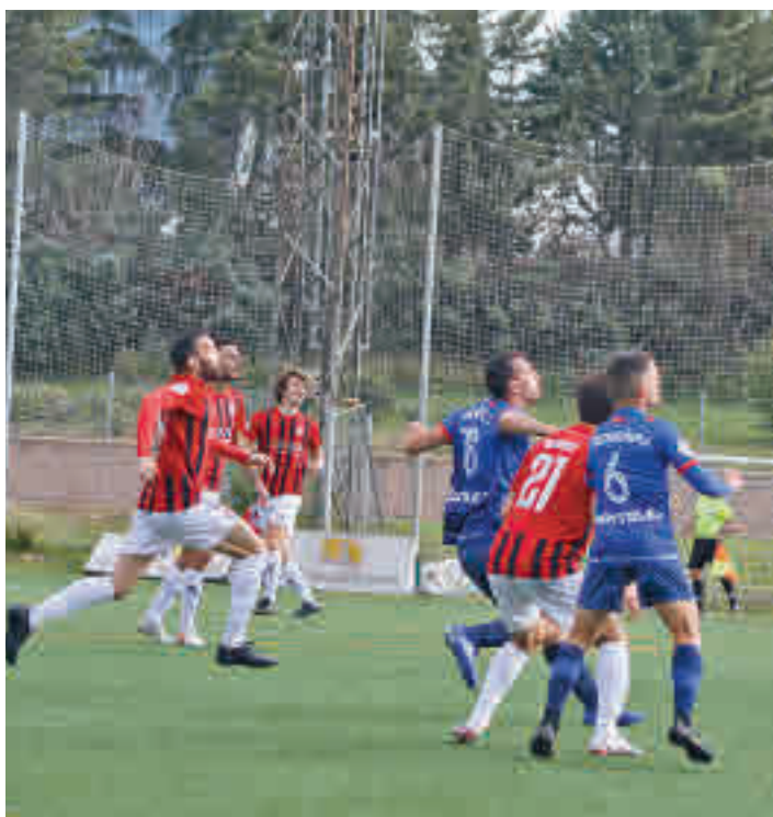
El Adarve aspira a regresar a la tercera categoría nacional