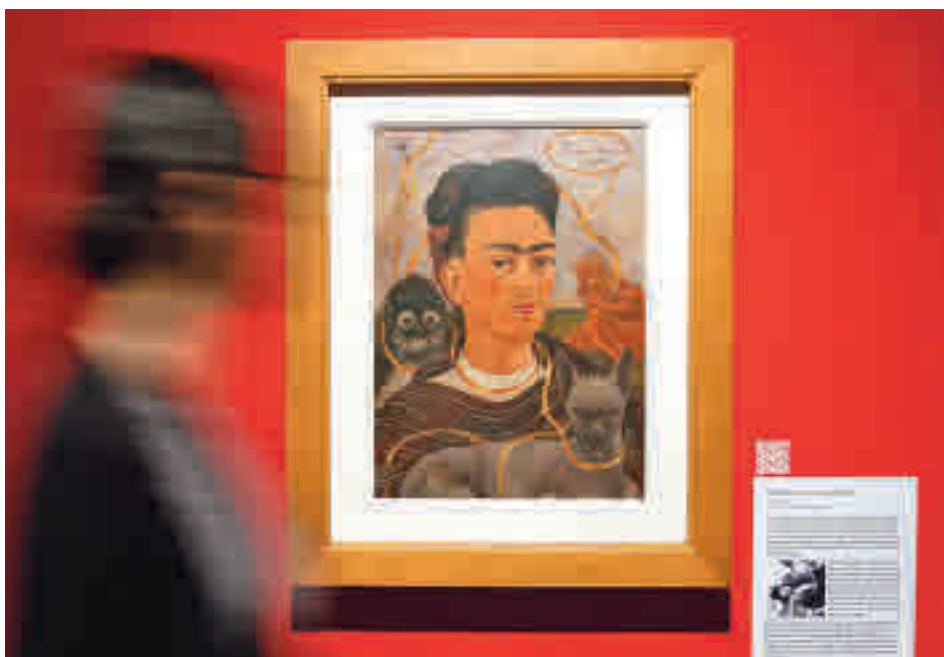
Uno de los autorretratos presentes en esta colección

» Sábado 21, 20 horas. Teatro Adolfo Marsillach. Precio: 7 euros.