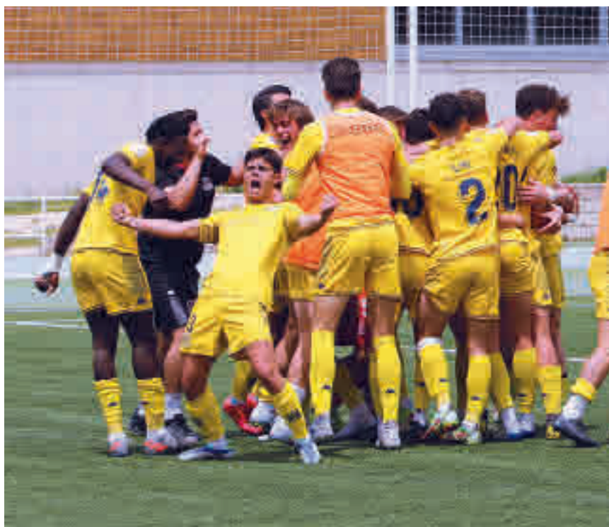
El Alcorcón B superó en la prórroga al Paracuellos Antamira RFFM