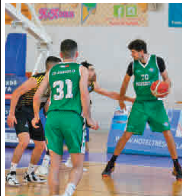
Imagen del partido jugado en Gandía FEB

Más allá del resultado que se dé en Magariños, esta jornada 34 también servirá para definir al último equipo que accede a las eliminatorias por el ascenso y que, por tanto, será el rival del Estudiantes. En estos momentos, la novena plaza la ocupa Tau Castelló con 17 victorias, las mismas que el décimo clasificado, el UEMC Real Valladolid Baloncesto, y una de ventaja respecto a su rival en esta jornada, el Acunsa Gipuzkoa. Por tanto, el resultado que se dé en el Ciutat Castelló puede ser decisivo para decidir qué equipo se hace con el último billete, entrando en el abanico de posibilidades un triple empate a 17 victorias. En ese caso, el beneficiado sería el Acunsa, aunque necesita el pinchazo del Valladolid en su visita a Palma.