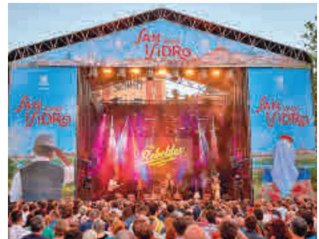
El concierto de Los Rebeldes en la Pradera de San Isidro

El momento de mayor tensión se vivió el domingo en los conciertos de la Plaza Mayor debido a la gran afluencia de público y la limitación del aforo a unas 8.000 personas.