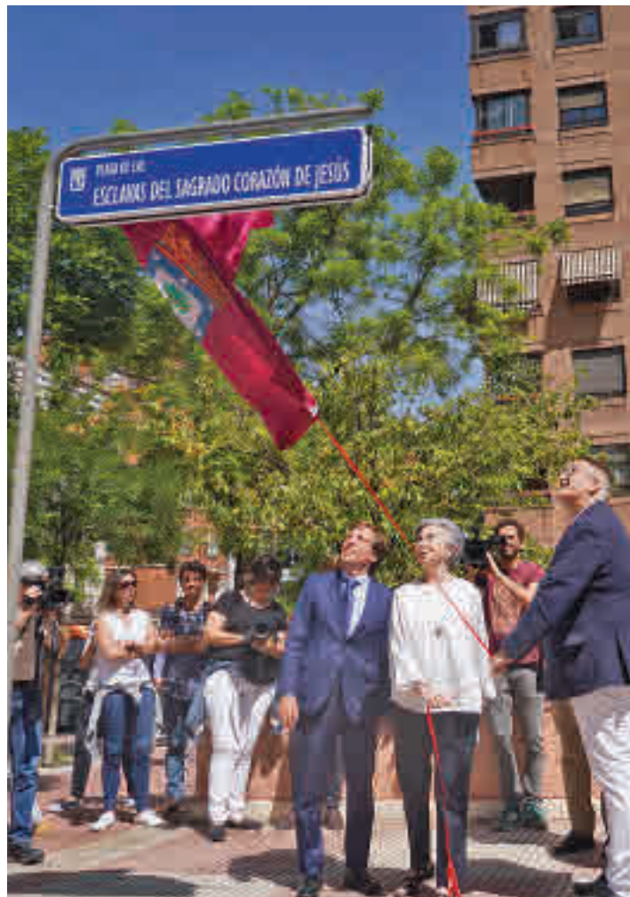
El acto de descubrimiento de la plaza con la nueva denominación

frutad, aprended, aprovechad. Estar aquí es garantía de que vais a poder hacer lo que queráis en vuestra vida”, dijo el primer edil a los escolares.