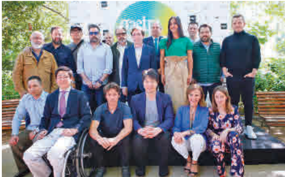
La presentación oficial de la programación tuvo lugar el pasado 10 de mayo

'Madrid está para comérsela' es el lema de la decimotercera edición de Gastrofestival que se desarrollará en la capital hasta el 29 de mayo. Menús, tapas, degustaciones, maridajes y actividades culturales en torno al universo gastronómico, entre otras propuestas, componen la programación de este encuentro organizado por el Área de Turismo del Ayuntamiento y Madrid Fusión. Más de 300 restaurantes, bares, hoteles,