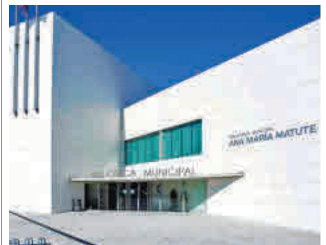
Biblioteca Ana María Matute de Valdemoro

Pinto celebra el 21 y el 22 de mayo varias actividades de deporte en las calles. Las inscripciones están en la web Deportegana.com .