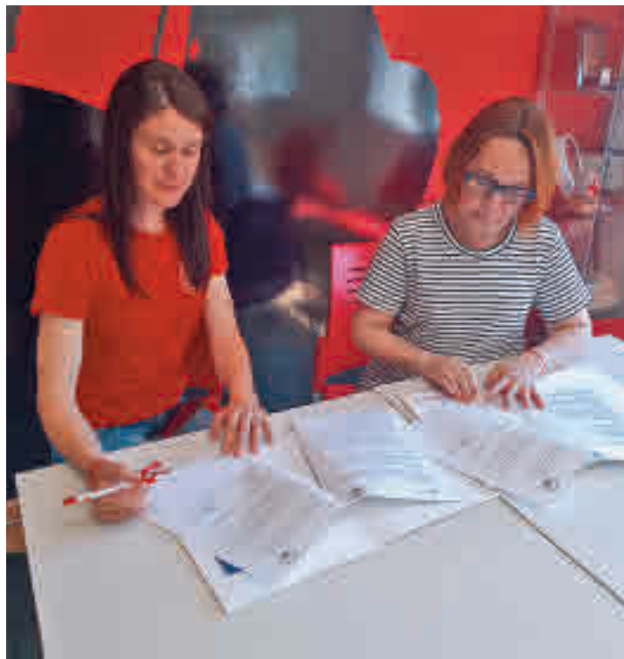
Firma del convenio

Desde el inicio de la invasión de Ucrania por parte del ejército ruso, la sociedad mostoleña, y por extensión la de toda la Comunidad de Ma-