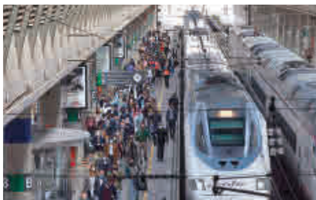
Estación de AVE de Atocha

Durante estas fiestas madrileñas, la compañía ha transportado un total de 590.000 viajeros en estos servicios entre los seis principales corredores, lo que representa un incremento de 60.135 personas respecto al