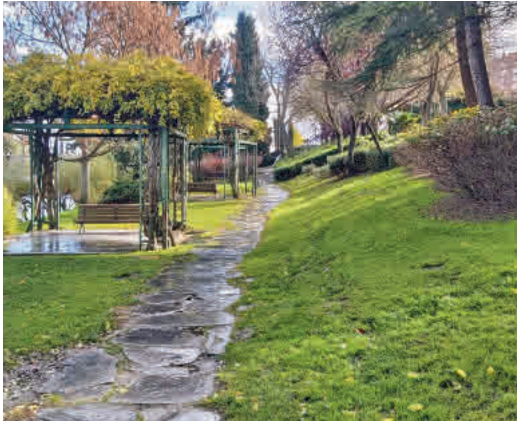
Parque de La Rambla AYTO. COSLADA

En el municipio ya existe un parque vallado en todo su perímetro, el boque de El Humedal. A este, de haberse