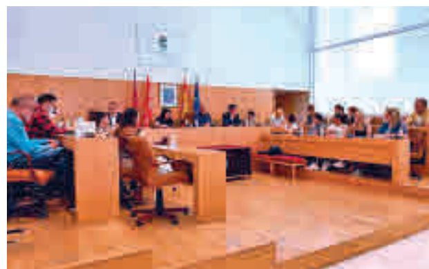
Imagen del Pleno extraordinario AYTO. SAN FERNANDO

otros trabajos de mejora, como en los colegios y las escuelas infantiles. Gracias a los votos de PSOE y Ciudadanos, se invertirá también en la creación de parques inclusivos, la modernización de las áreas de juego infantil o renovación de los equipamientos deportivos, que res-