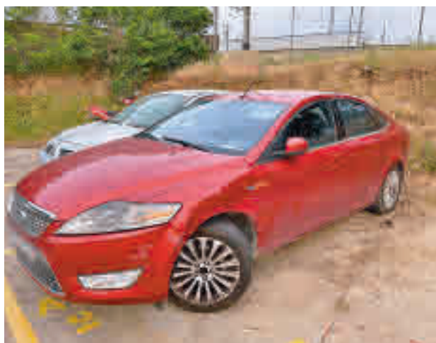
Coche causante del siniestro

en la avenida Doctor Fleming. Una vez en el lugar, los agentes comprobaron que el coche que había causado el siniestro llegó a impactar contra otros cuatro vehículos que se hallaban estacionados en la citada vía. El autor, un varón de 42 años, se resistió a la detención hasta el punto de que tres efectivos tuvieron que ir al hospital por las agresiones sufridas.