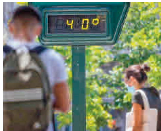
Los termómetros podrían llegar a 40 grados