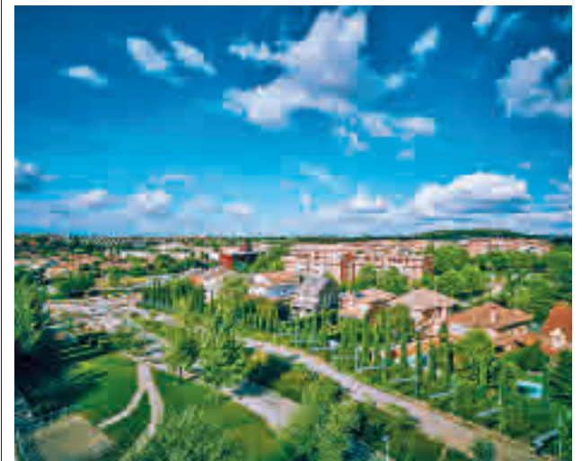
Panorámica de Rivas AYTO. RIVAS

gentedigital.es Toda la información de la zona Este, en nuestra página web.