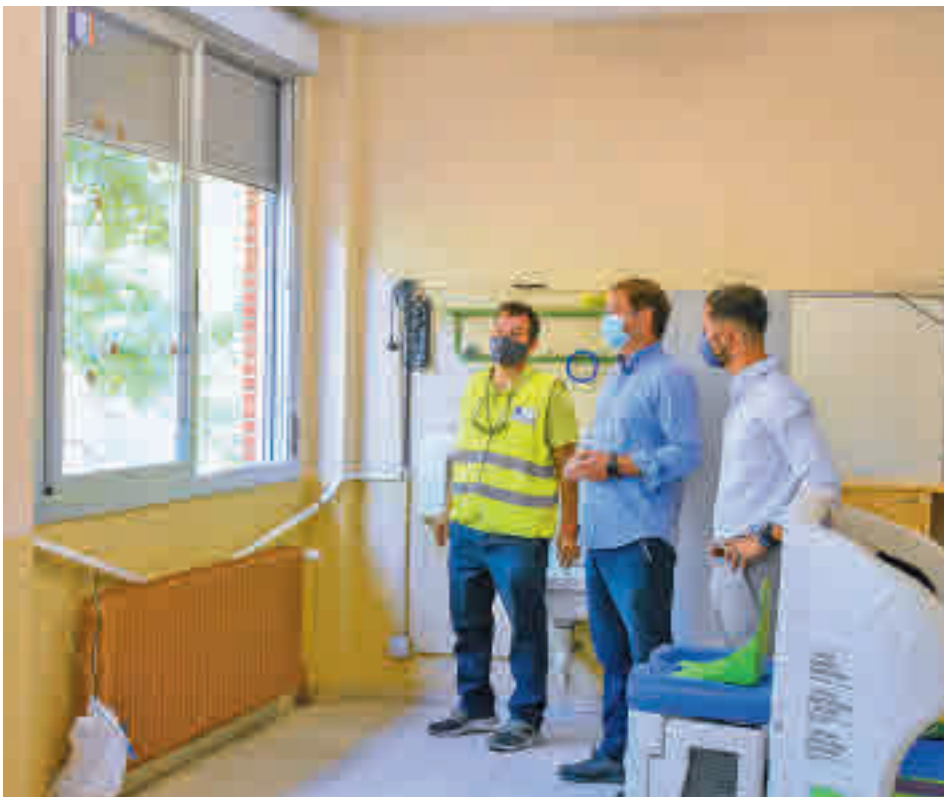
Obras en un colegio en el año 2021 AYTO. TORREJÓN