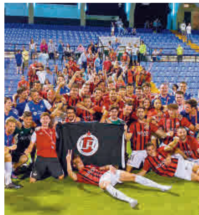
El conjunto rojinegro superó al Hércules

El segundo partido de esta serie de cuartos se jugará el domingo (12:30 horas).