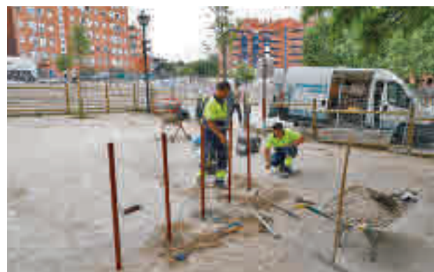
Las obras en el parque Imperial de Arganzuela

Fuentes municipales consideran que la instalación de