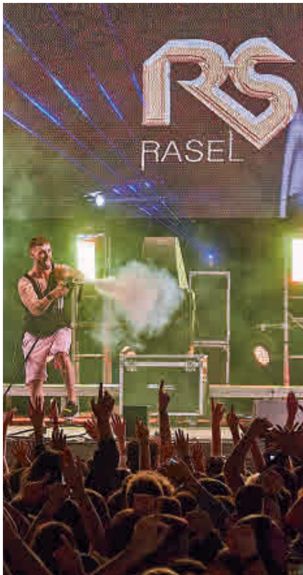
Un concierto del cantante sevillano Rasel

La mañana del sábado 28 de mayo estará dirigida a los más pequeños de la casa con los espectáculos de Wiky Tri-