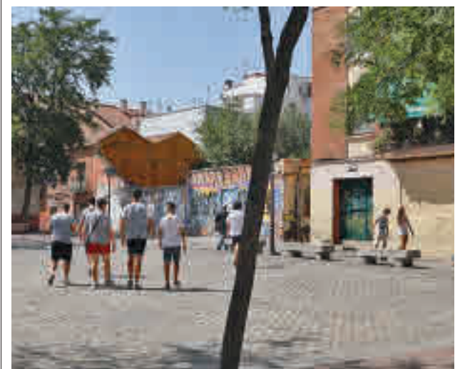
La Plaza Mayor de Villaverde

gentedigital.es Toda la actualidad de los distritos de Madrid, en nuestra web