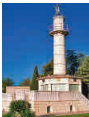
La Torre de Señales

La edificación data de principios del siglo XX (1919 y 1920) y adopta la forma de un faro marítimo, siendo la