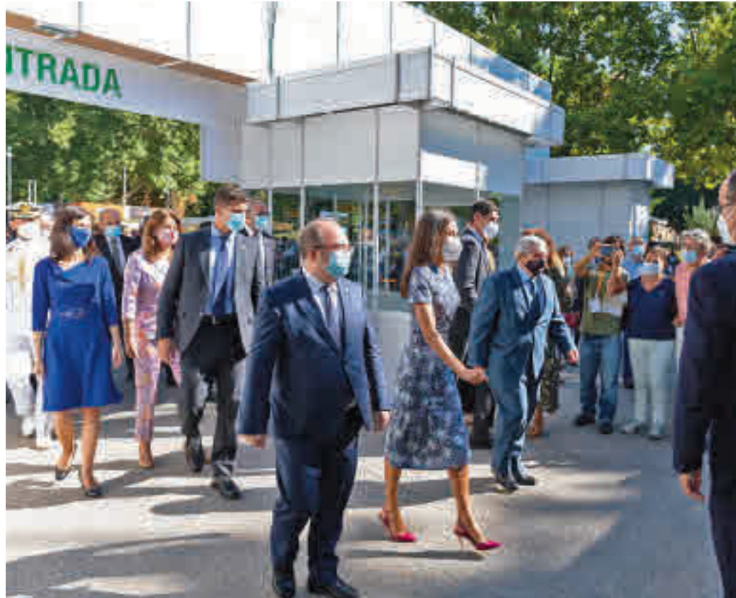
Un momento de la inauguración real de 2021

Otra de las novedades es que se habilitarán cuatro espacios para acoger firmas multitudinarias, que permitirán desplazar las filas de per-