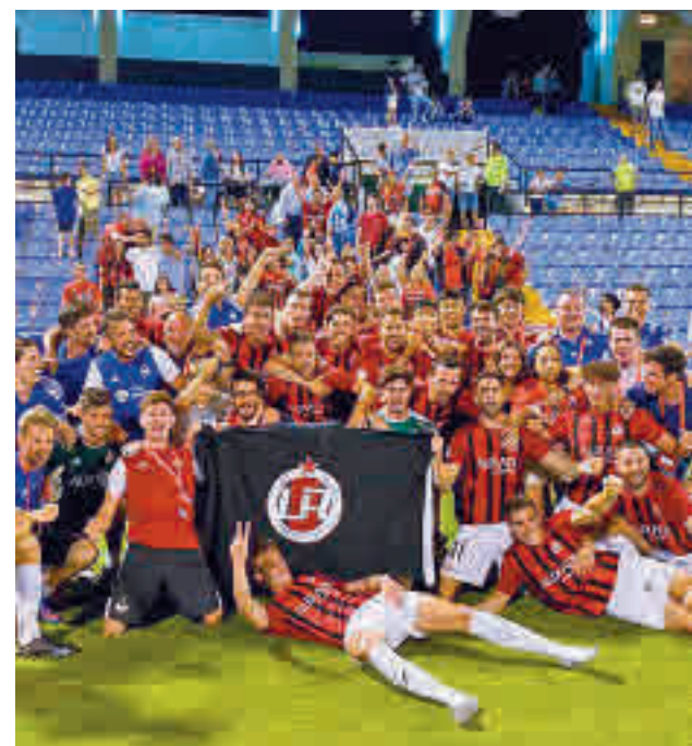
El conjunto rojinegro superó al Hércules

El segundo partido de esta serie de cuartos se jugará el domingo (12:30 horas).