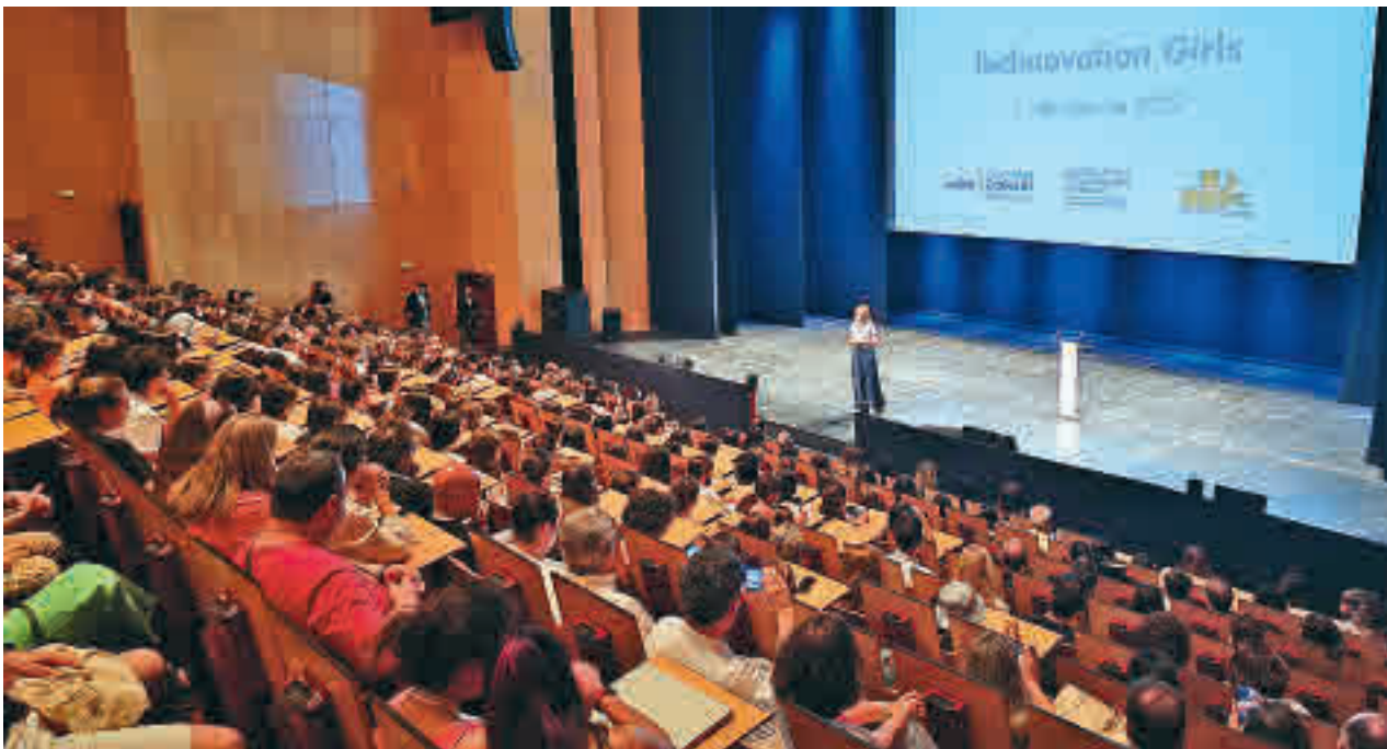
Acto de presentación de los proyectos de Technovation Girls en Leganés