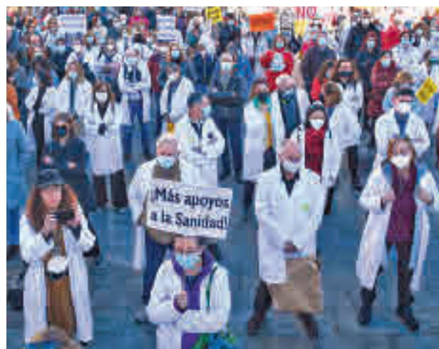
Manifestaciones de los médicos en Madrid

El objetivo es reducir la temporalidad por debajo del 8% con una serie de condicio-