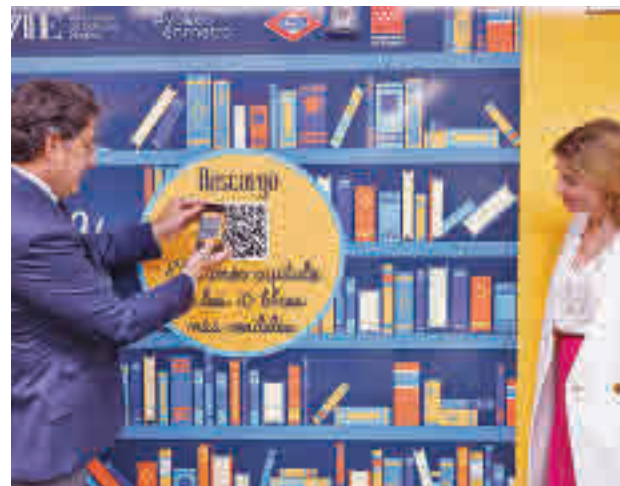
Presentación de la campaña

Además, coincidiendo también con la conmemoración del 25º aniversario de la ini-