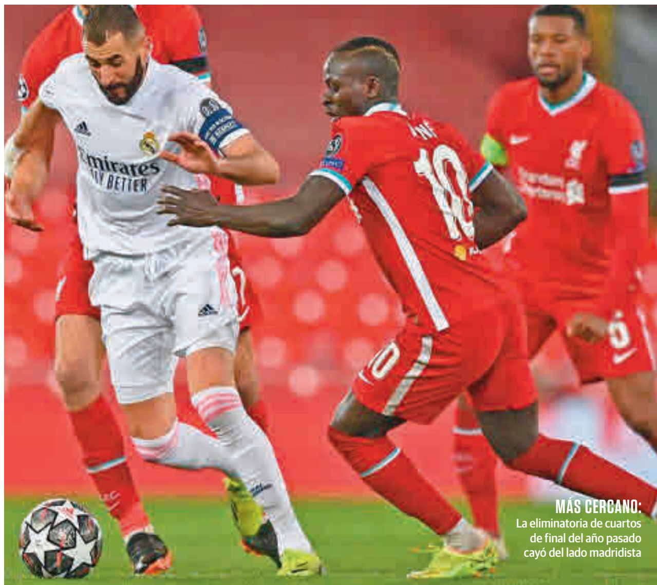
MÁS CERCANO: La eliminatoria de cuartos de final del año pasado cayó del lado madridista

El formato de la Champions League propició que 'reds' y blancos se vieran las caras en más ocasiones, pero quizás la más trascendental fue la de la final de 2018. Sobre el Olímpico de Kiev, el incipiente proyecto de Jurgen Klopp desafiaba a un Real Madrid que, con Zinedine Zidane en el banquillo, redoblabla su