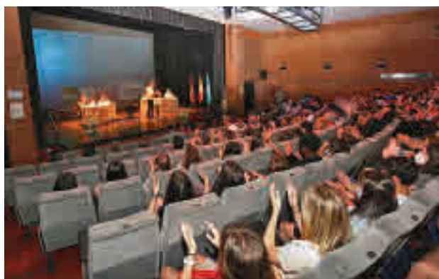
Final de la Liga de Debate Escolar

El Centro Cívico Rigoberta Menchú acogió el pasado