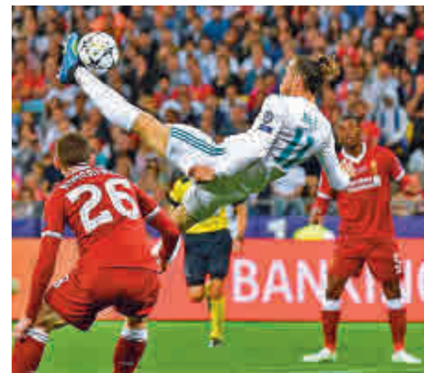
Bale decantó la final de 2018 con dos goles

ha acariciado hasta la semana pasada la posibilidad de firmar el 'triple'. Por su parte, el Real Madrid sí que ha cambiado más respecto a aquella final de Kiev. El testigo goleador de Cristiano Ronaldo lo ha tomado Karim Benzema, acompañado por jugadores como Vinicius, que en 2018 aún era una promesa juvenil en Brasil. En la línea defensiva, solo Carvajal repite respecto a aquel antecedente. Courtois, Alaba, Militao y Mendy han reemplazado a Navas, Ramos, Varane y Marcelo.