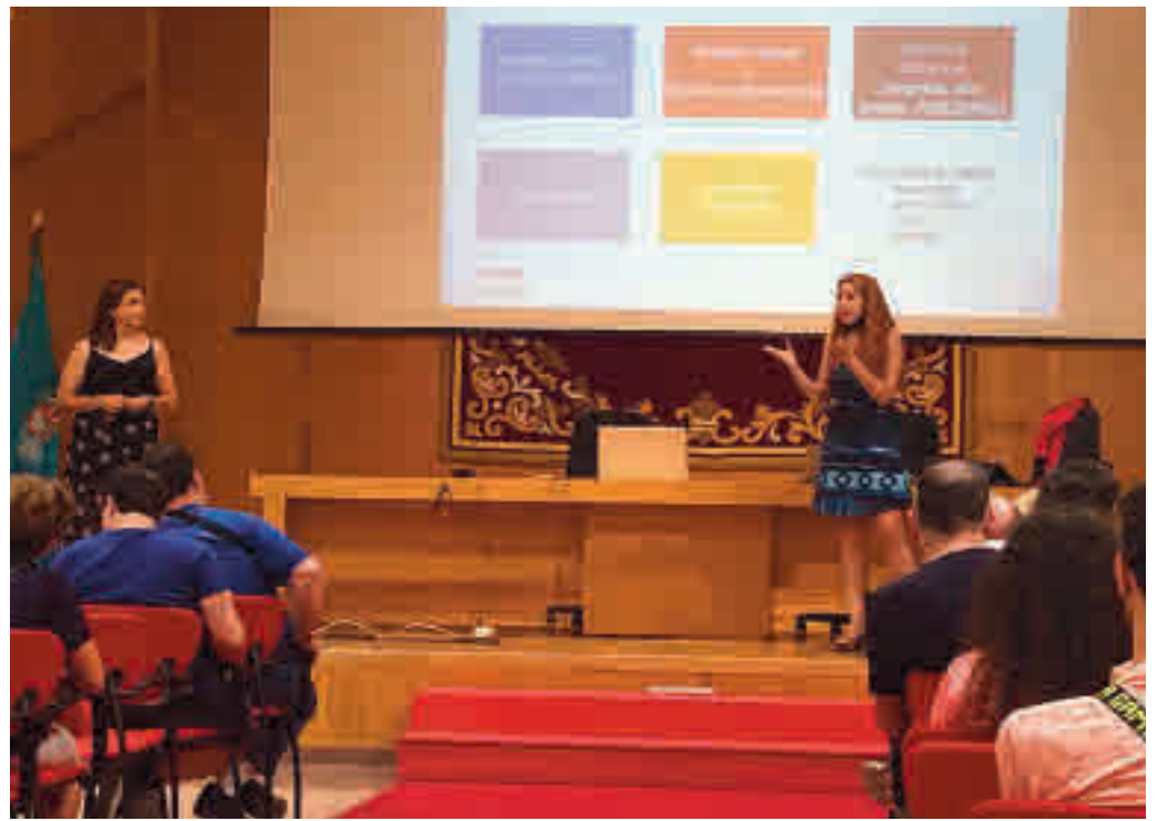
Presentación del taller

tarse de forma más rápida a entornos laborales digitales y les permitirán aprovechar aspectos como el teletrabajo, el uso de redes sociales o la realización de entrevistas online, tan necesarios para la integración completa en el