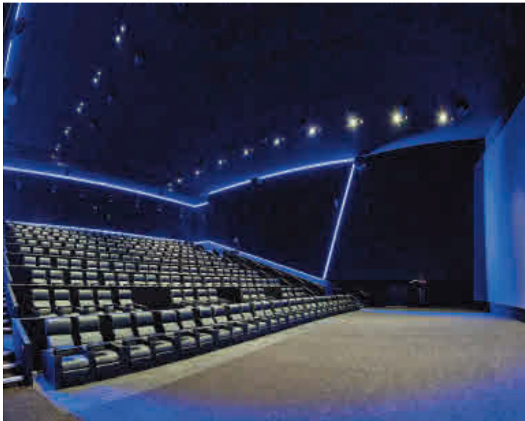
El número de salas se ha incrementado en la región

Salas Por cada millón de habitantes es la cifra de la Comunidad de Madrid