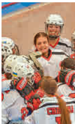
Triunfo de las tricantinas

un paso más proclamándose campeón de la Women European League, conquistando su primer título continental. Para llegar hasta ese éxito, las