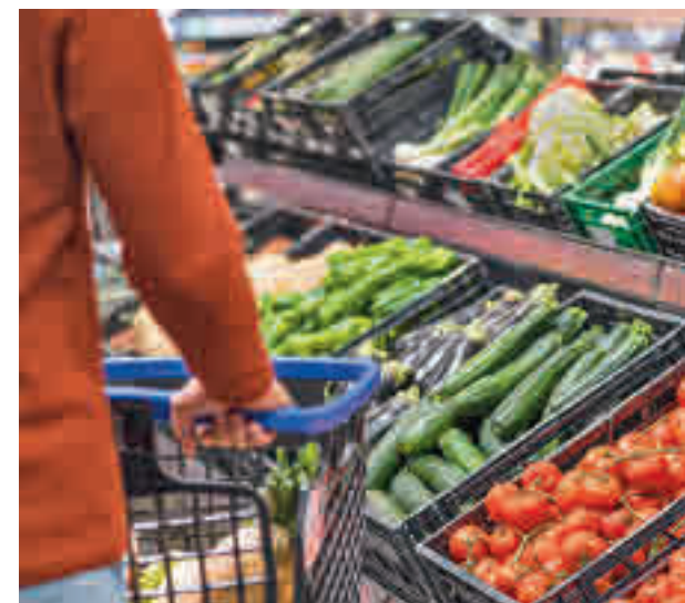
Los compradores evitan el plástico

3 de cada 10 euros Según datos del estudio elaborado por la compañía durante el pasado año, el 73% de las cestas de la compra mensuales incluyen como mínimo un producto fresco y representan una media de 3 de cada 10 euros del total de compra.