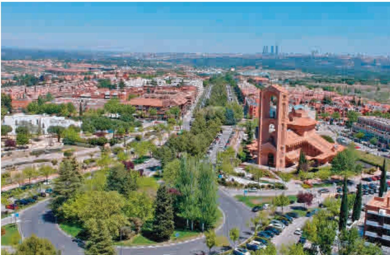
Pozuelo de Alarcón sigue siendo la localidad con la renta más elevada