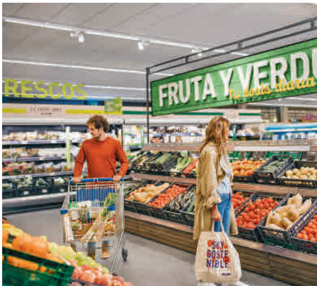
Los frescos son una parte muy importante de la cesta de la compra

Factores La relación calidad-precio es el principal factor que motiva a los consumidores espa-