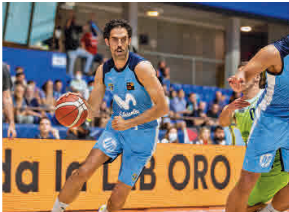
Beirán es uno de los jugadores clave del conjunto colegial MOVISTAR ESTUDIANTES

Unión Adarve ratificaba que su candidatura es muy firme. Los pupilos de Diego Nogales enmudecieron el Rico Pérez para eliminar al equipo anfitrión, el Hércules, haciendo valer su mejor clasificación en la fase regular. Ese factor podría volver a ser decisivo este domingo. En el caso de que el partido llegue empatado al final de los 90 minutos, se iría a la prórroga. En el caso de mantenerse las tablas, no habría tanda de penaltis y el Adarve ascendería.