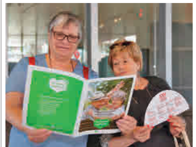
La programación incluye 70 actividades

En concreto, Alcobendas sube 183 puntos su tasa de incidencia acumulada, hasta situarse en los 986 casos por cada 100.000 habitantes. En Sanse la situación es muy parecida tras experimentar un repunte de 169 puntos y llegar a los 975 casos. Por Zonas Básicas de Salud, los datos más elevados los registran Rosa Luxemburgo (1.153) y, especialmente, Valdelasfuentes (2.222).