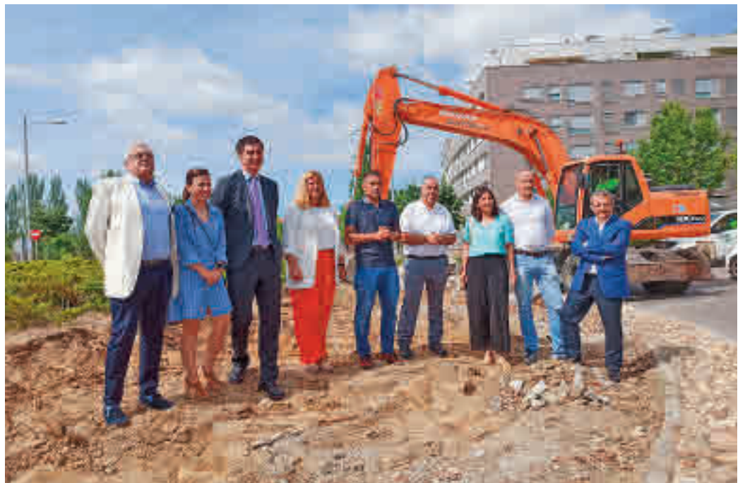
Visita de las autoridades a una de las rotondas del barrio

Una de las notas predominantes en esta actuación, que se enmarca en el programa Sanse Impulsa, es, sin duda,