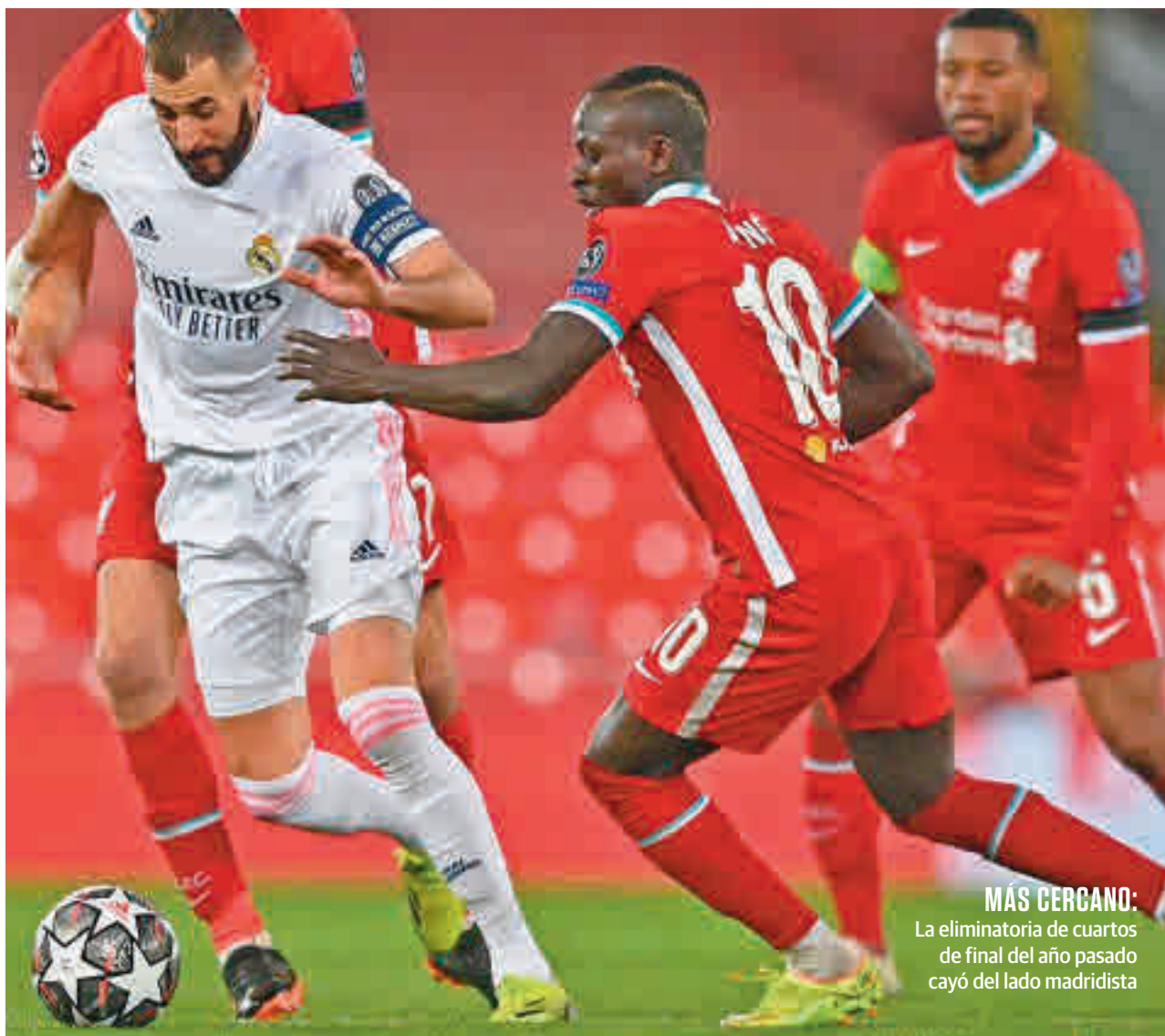
MÁS CERCANO: La eliminatoria de cuartos de final del año pasado cayó del lado madridista

El formato de la Champions League propició que 'reds' y blancos se vieran las caras en más ocasiones, pero quizás la más trascendental fue la de la final de 2018. Sobre el Olímpico de Kiev, el incipiente proyecto de Jürgen Klopp desafiaba a un Real Madrid que, con Zinedine Zidane en el banquillo, redoblabla su