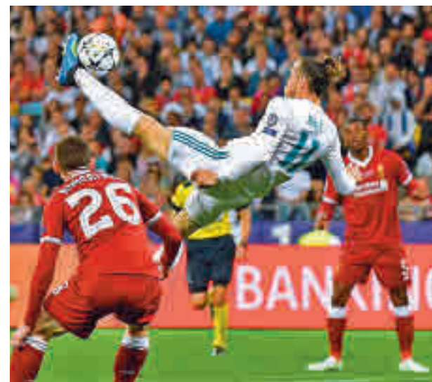
Bale decantó la final de 2018 con dos goles

Por su parte, el Real Madrid sí que ha cambiado más respecto a aquella final de Kiev. El testigo goleador de Cristiano Ronaldo lo ha tomado Karim Benzema, acompañado por jugadores como Vinicius, que en 2018 aún era una promesa juvenil en Brasil. En la línea defensiva, solo Carvajal repite respecto a aquel antecedente. Courtois, Alaba, Militao y Mendy han reemplazado a Navas, Ramos, Varane y Marcelo.