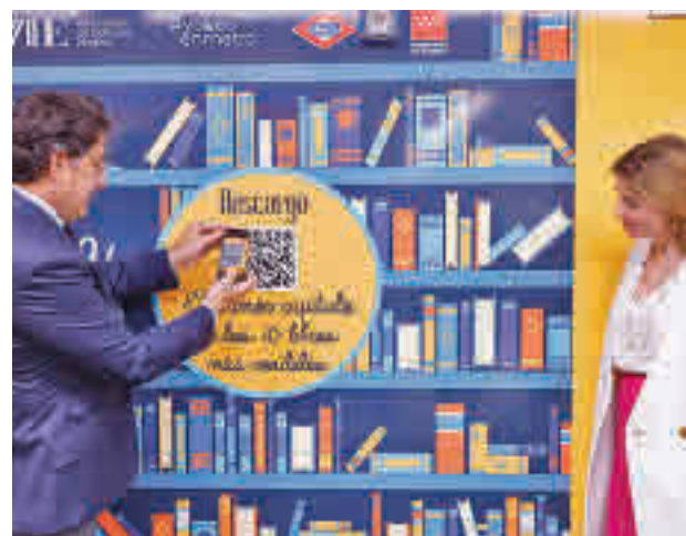
Presentación de la campaña

Además, coincidiendo también con la conmemoración del 25º aniversario de la ini-